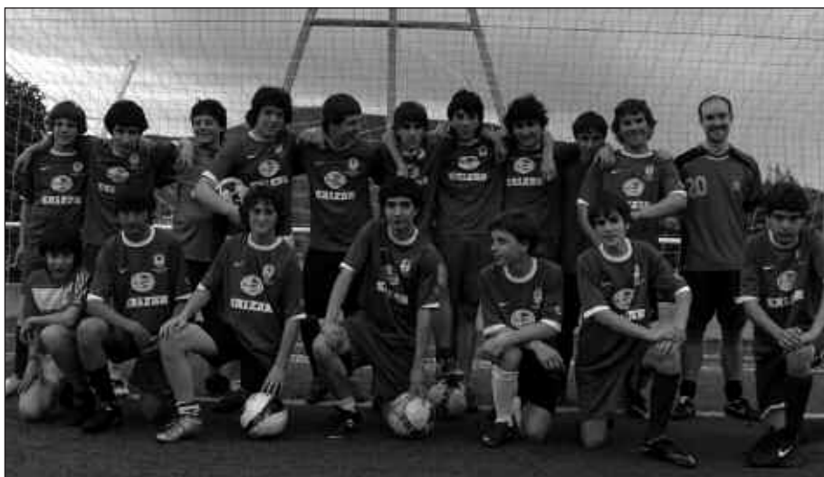
JOKALARIAK ETA ENTRENATZAILEAK GUSTURA ARITU DIRA.

Azkenean, denak elkarren lagunak dira, koadrilakoak. Bai futbolagatik eta baita lagunekin jarraitzeagatik, badirudi animatuta daudela. Askotan, maila aldaketekin urte desberdinetako jokalariek nahasten dira. Datorren denboraldian ordea, jokalariek gehienek maila berdinean jarraituko dute.