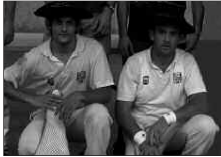
ERRASTI-GALARRAGA BIKOTEA IZAN ZEN IAZKO IRABAZLEA.