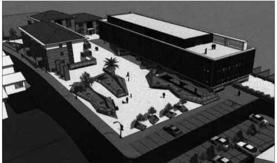
MOJEK KALEZARREN DUTEN EGOITZAN ERAIKIKO DA GERONTOLOGIKOA. IRUDIAN, PROIEKTUAREN MAKETA.

Halere, 2009ko ekitaldia positiboki itxi du Udalak. Baikor agertu da alka-