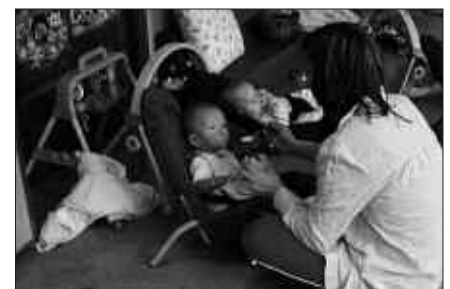
SEME-ALABEN OSASUN EMOZIONALA GURASOekin ETA IRAKASLEekin BATERA LANTZEA DA HELBURUA.

Proiektuaren barruan hamar saio burutzea aurreikusten zen irakasleekin. Lehen lau saioak egin dira. Baina azken bilkuran, ekimenak izan duen parte hartze