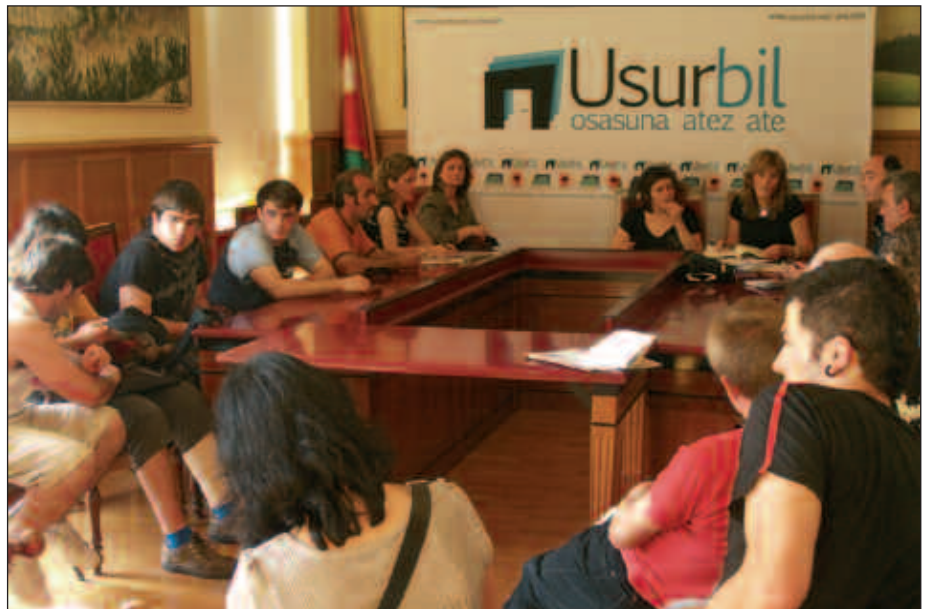
AURREKO ASTEAN BILDU ZEN LEHEN ALDIZ JAI BATZORDEA. BIGARRIN BILERA MAIATZAREN 13AN IZANGO DA, UDALETXEKO PLENO ARETOAN.

Bestalde, aurten ere jaietako egitaraua diseinatzeko lehiaketa antolatzeke asmoa du Udalak. Deialdia laster egingo du. Beraz, ekimenean parte hartu nahi duenak diseinu lanari ekin diezaioke.