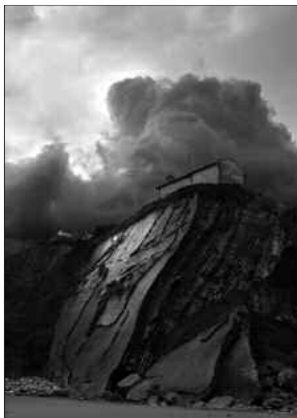
SAN TELMO, ITZURUNDIK IKUSITA.