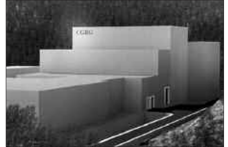
ITXURA HAU IZANGO LUKE BALIZKO ERRAUSTE-PLANTAK.

Diputatua hedabideen aurrera agertu baino astebete lehenago, Aldundia bera ordezkatu dagoen Gipuzkoako Hondakinen Kudeaketak kaleratutako datuak ezagutzera eman zituen San