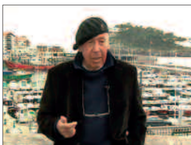
MIKEL LABOAREN DOKUMENTALA BERE EMATZEAK ZUZENDU ZUEN.

Sarrerak Lizardi dendan jaso daitezke doan (gehienez bi sarrera pertsonako).