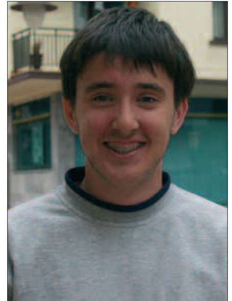
URTEURRENEKO EKITALDIAK PRESTATZEN DABILTZA BURU BELARRI AZKEN ASTEOTAN.

B. A. Urte batzuk barru, inguruan ibiliko gara. Orain benetan dagoen antolakuntza bezala izatea nahi nuke. Oraingo antolatzaileei esker ari da funtzionatzen Ziortza. Egungo moduan, oraingo indar eta gogoarekin mantendu daitezela.