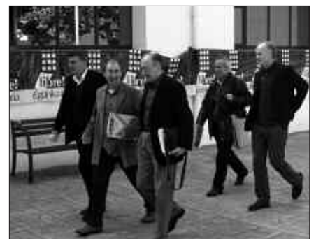
AUZI EKONOMIKOAK, ORDEA, ZABALIK JARRAITZEN DU DRAINDIK.

Pieza ekonomikoak zabalik jarraitzen du ordea. Zortzi lagun daude auzipetuta. Defentsak epaiketa Donostiako Auzitegira lekuz aldatzea eskatua du, absoluzioaren ostean egoera juridiko berria sortu dela ulertzen baitu. Ohiko delituari lotutako auzia litzateke pieza ekonomikoa eta ohiko delituak epaitzeko eskuduntzarik ez du Espainiako Auzitegi Nazionalak. Eskaria onartzen badute, auzi ekonomikoa Donostiako epaitzeko zigor sailean epaituko da.