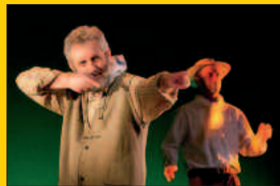
“Aitarekin bidaian”, puntako antzezlanaren Sutegin