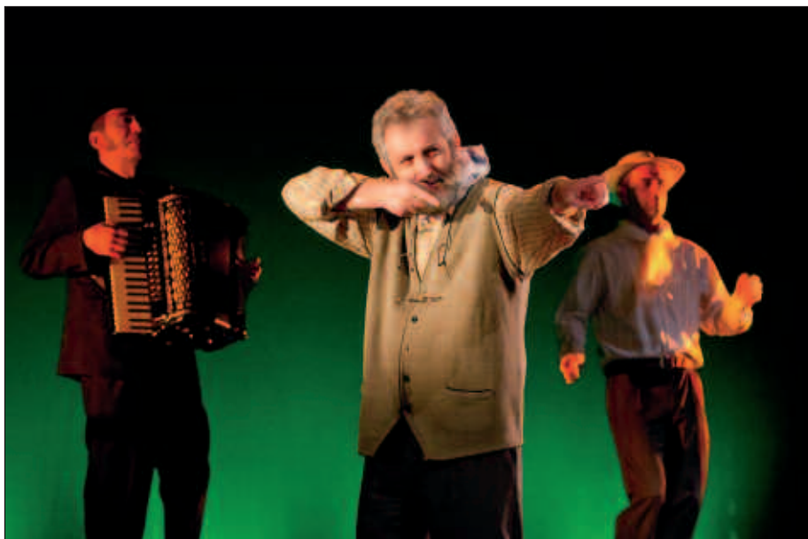
DONOSTIAKO UDALAK URTERO EMATEN DUEN ANTZERKI SARIA ESKURATU DU HIKA TEATRO KONPAINIAREN LAN HONEK.

Sarrerak: 8 euro aldeztu aurretik Lizardi dendan; 10 egun beretan.