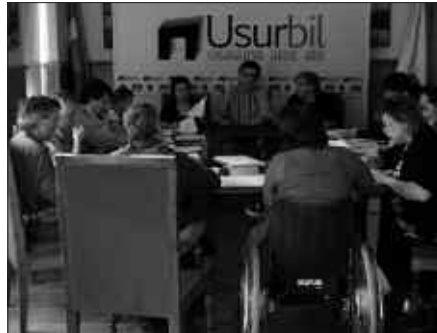
PASA DEN ASTEAN EGINDAKO PLENOAN HAINBAT GAI LANDU ZIREN.

Bozketa: alde, Ezker abertzalea, Aralar eta PSE-EE; abstentzioa, EAJ-PNV; aurka, Alkarbide.