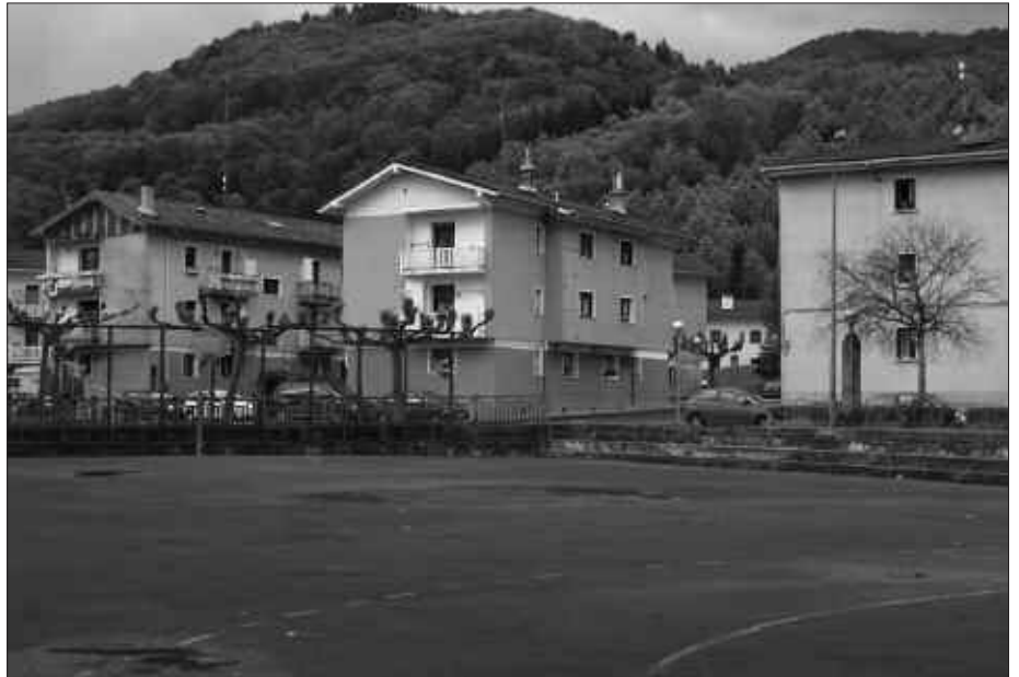
BIZILAGUNEKIN HAINBAT BILERA EGIN DITUZTE AZKEN HILABETEOTAN. OKERRIK EZ BADA, UDAN HASIKO DIRA FRONTOI ESTALIA ERAIKITZEN SANTUENEAN.

Eraikin berria egiteko proposamena alboratu ostean, udatik aurrera hasi nahi da handitzearekin; aldagela edota pista berriak egiteko lanekin, alkateak gogorarazi duenez, "kirol taldeekin egindako lanari esker".