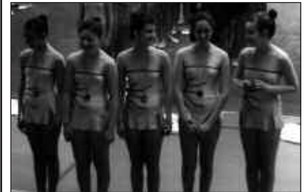
USURBILDARRAK HIRUGARREN IZAN ZIREN.

A pirilaren 24an, soinketa erritmi-ako txapelketa jokatu zen Oiartzunen. Jauziak, figurak, tresnekin ariketak, musika, dantza... Ikuskizuna aparta izan zen eta Usurbilgo ordezkarriak oso ondo aritu ziren. Euren mailan, hirugarren izan ziren azken sailkapenean. Irudian dituzue usurbildar parte hartzaileak.