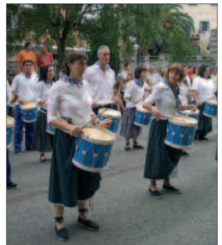
HELDUEK LEHEN ENTSEGUA OSTIRAL HONETAN IZANGO DUTE AGERIALDEN.

Bi danborraden prestakizun lanak hasi dira dagoeneko. Ostegun honetan, maiatzak 6, haur danborradan parte hartu nahi dutenek izena emateko aukera izango dute arratsaldeko 18:00etan Agerialden. Helduek aldiz ostiral honetan, leku berean baina