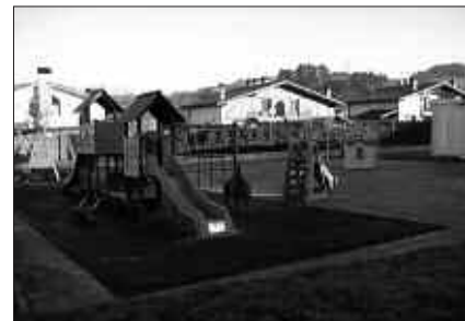
UZTAILA ETA ABUZTUAN, ESKOLA TXIKIAN ELKARTUKO DIRA 9:30ETIK 13:30ERA.