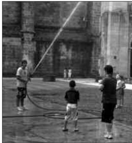
IZEN EMATEA NOAUA!N EGIN BEHAR DA ARRATSALDEZ, 17:00ETATIK 19:00ETARA.