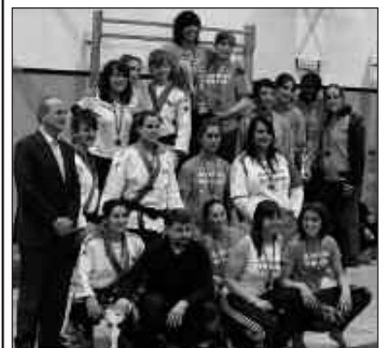
LIGAN BIGARREN IZAN DIRA. IRUDIAN, PODIUMEAN DIRA USURBIL JUDO TALDEKO KIDEAK.