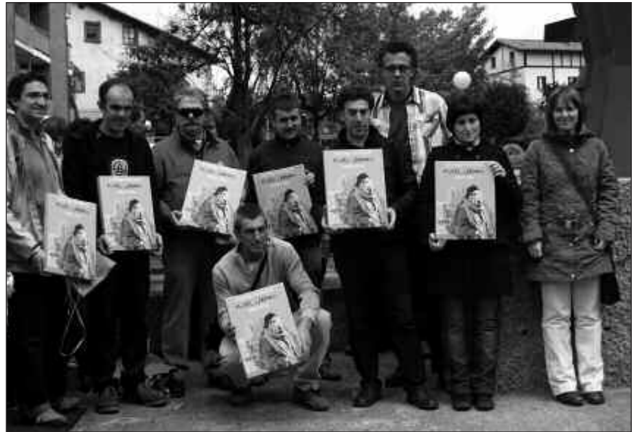
LEHIAKETAN PARTE HARTU ZUTEN ARTISTA GUZTIEI OPARI BANA EGIN ZIEN UDALAK.

Laboari eskainitako liburua Zabalik jarraitzen du bestalde, Mikel Laboaren omenez berari zerba-it datzi nahi dionarentzat, Udalak kale-