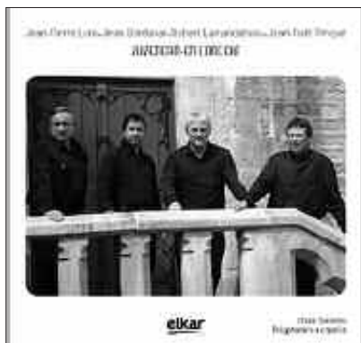
ZUBEROAKO ABESTIAK DIRA DISKO HONETAN BILDU DIRENAK.

NOAUA!ko webgunean kantu bat jarri dugu entzungai aste honetan, “Zohardi batez” izeneko abestia.