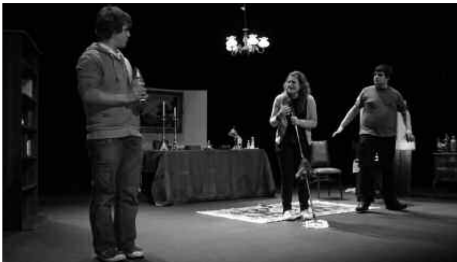
LAN BERRIA EZ DA KOMEDIA ESTILOKOA IZANGO...

N. Taldeak izen, logotipo, blog eta kartel berria estreinatzeke ere baliatu duzue azken antzezlan hau. Azken hila-