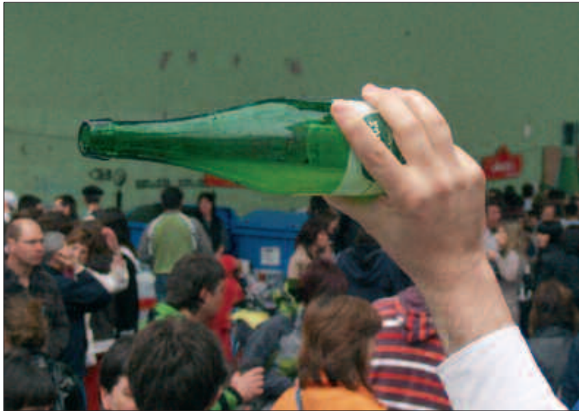
IAZ, 40 POSTU JARRI ZITUZTEN; AURTEN 30 IPINIKO DITUZTE.

Desadostasunak eragina izan du aurtengo Sagardo Egunean. Gipuzkoako Sagardogile Elkarteko ekoizle gehienek igandeko festara ez etortzea erabaki dute. Ondorioz, Sagardo Eguneko antolatzaileak elkartetik kanpo sagardogile gehiagoren bila aritu dira. Usurbildik hasita, Gipuzkoan ber-