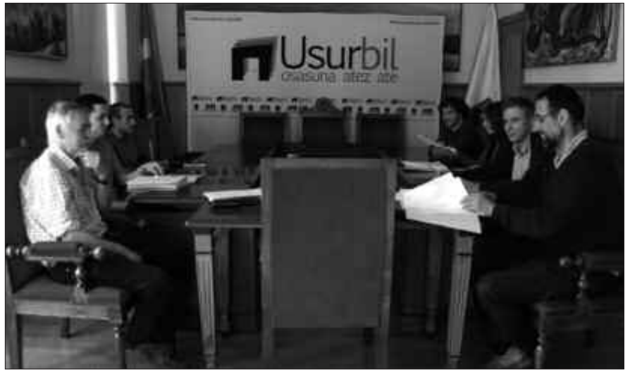
ASTELEHEN HONETAN BILDU ZEN KIROL PATRONATUA. BESTALDE, KIROL ARLOKO DIRULAGUNTZAK ESKATZEKO EPEA LASTER ZABALDUKO DA.

Bestalde, atzerapenik ez bada Gipuzkoako Aldizkari Ofizialean hilabete amaieran erabakia kaleratu ostean kirol arloko diru-laguntzak eskatzeko hogege eguneko epea zabalduko dela iragarri du Kirol Patronatuak.