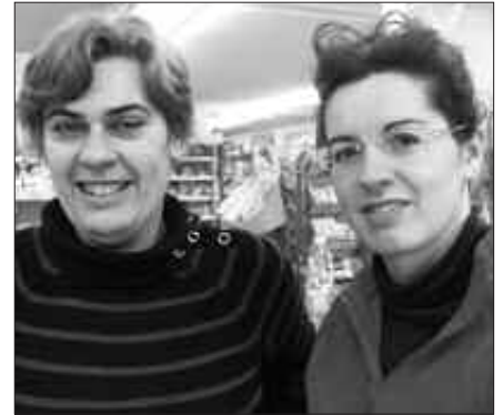
ALIPROX DENDAKOEN USTEZ, OSO PRAKTIKOA DA POLTSA BERRERABILGARRIA.

B.T. Plastikoa, kartoia... Jendea ez da jabetzen, produktu askok duten material guztiaz. Hemen, kartoi pila bat sortzen dugu, hau denda txiki bat izanda. Pentsa, saltoki gune handietan, hondakin kopurua biderkatzen da. Langile baino gazte txo moduan oroitzen dut garai hura. Lehengo garaia, guztia erabili eta botatzeko ohiturak ordezkatu zuen; erosi, kontsumitu eta botatzeak hain zuzen. Horregatik sortu da hainbeste tona zabo-