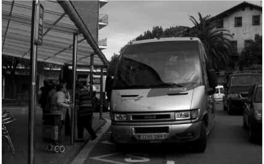
ASTELEHEN HONETAN JARRI ZEN MARTXAN BUS ZERBITZU BERRIA. IRUDIAN, LEHEN BIDAIRIAK.

Ordu hauetan abiatuko da bus zerbitzu berria Bordatxo paretik: 7:15, 8:15, 9:15, 10:15, 11:30, 12:30, 13:30, 14:30, 15:30, 16:30, 17:45, 18:45, 19:45, 20:45. Zubietara hamar minutuko tartean ailegatuko da eta ibilbidearen amaierara, ospitaleetara