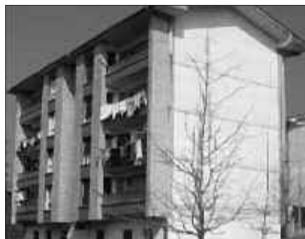
SEI ETXEBIZITZA DIRA ALOKAIRU MODUAN ZOZKETATUKO DIRENAK.

Usurbilgo Udalak igorri berri ditu Ondasun Higiezin gaineko Zergari dagozkion ordainagiriak, borondatezko epean ordainduak izan daitezten.