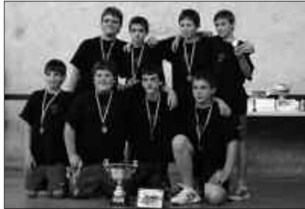
ASTEBURUAN JOKATUKO DA USURBIL CUP-EN LEHEN JARDUNALDIA.

Pasa den astekarirako NOAUAlri igorritako gutunean, Usurbil Futbol Taldetik ziotenez, "pozgarria da hainbeste haur ilusioz, gogoz eta pasioz frontoian lehiatzen ikustea". Baina hastear den txapelketan argi utzi nahi dutenez, "ez ditugu onartuko entrenatzaileen jarrera eta erabaki baztertzailak, gehiegizko tentsio momentuak eta horrelako dinamika". Horregatik halako egoerak saihesteko elkarlanera dei egiten zieten, entrenatzaile edota gaztetxoek gurasoei ere. "Parte