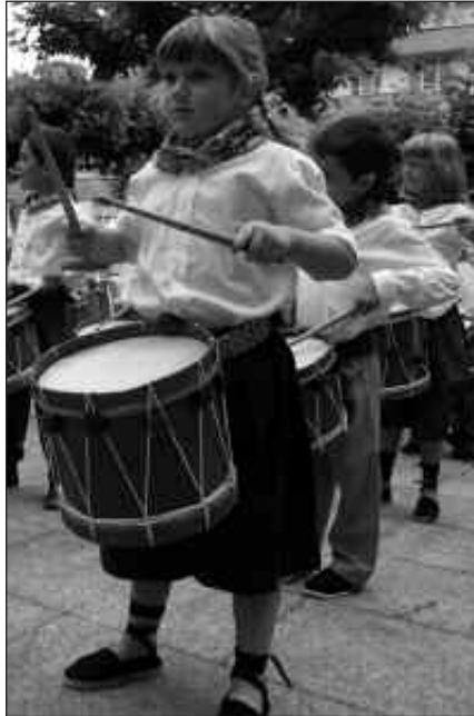
EKAINAREN 10EAN BILDUKO DA BERRIZ ERE JAI BATZORDEA.

Denetarik ekitaldiz osatutako bost egun izango dira, herriko jaiez gozatze-ko. Ordurako dena prest izango da. Aipatu moduan, prestaketak oso aurreratuak ditu Jai Batzordeak. Baina orain arteko lana borobiltzeko hirugarren bilera deialdia egin dute. Hitzordua, ekainaren 10ean, arratsaldeko 19:00etan udalbatza aretoan.