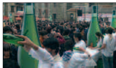
UDARREGIN EGINGO DA BILERA,

Igandean sagardoa botatzen parte hartu nahi dutenei zuzendutako deialdia da. Garrantzizkoa antolatzaileen esanetan, aurtengo edizioaren nondik norakoen berri emateko. Antolakuntzatik jakinarazi dutenez bestalde, Sagardo Egunerako sukaldari laguntzaileak behar dituzte.