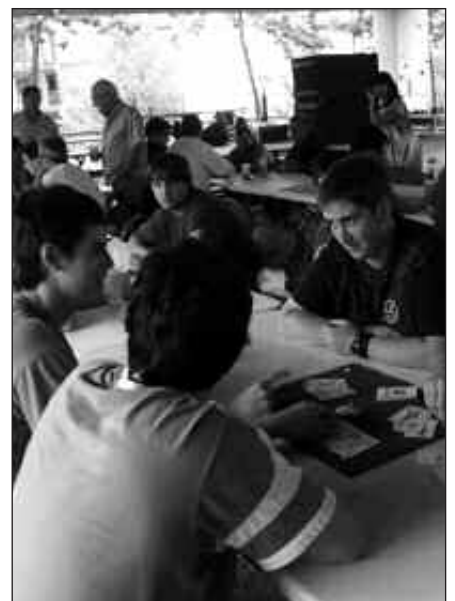
500 EURO JASOKO DITU LEHIAKETA IRABAZTEN DUEN LANAK.

Oharra: Saria eman gabe geratu ahal izango da, baldin eta aurkeztutako lanek