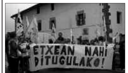
SAGARDO EGUNEAN, 13:00EAN ELKARRETARATZEA EGINGO DUTE.

Bestetik, igande honetako Sagardo Egunean, presoen eskubideen aldeko elkarretaratzea egingo dute, eguerdiko 13:00ean Mikel Laboa plazan.