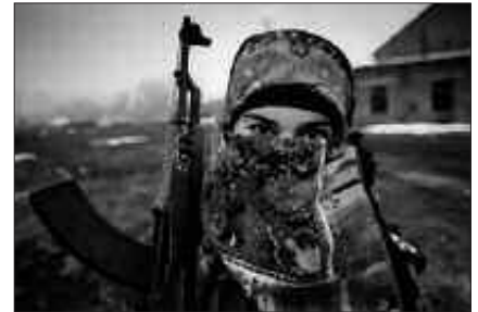
KAUKASO ALDEKO EGOERAZ HITZ EGINGO DA OSTEGUN HONETAN SUTEGIN.

Soilik dozenaka hildako eragiten dituzten triskantza handiak gertatzen direnean izaten da Txetxeniaren berri, eta betiere, era oso partzialan. Gatazkaren nondik-norakoak eta