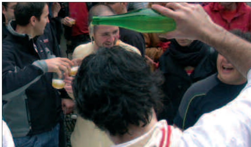
AURTENGO SAGARDO EGUNEAN ANTZEKO IRUDIAK ERREPIKATUKO DIRA.

H asiera batean, begi bistako aldaketarik ez du sumatuko maiatzaren 23ko sagardo festara hurbilduko denak. Pintxoak, sagardo postuak, giroa eta jendetza, ohiko Sagardo Eguneko osagaiek ez dute hutsik egingo igandean. Baina postuz postuko osteratxoak egiten dabilenak, zer sagardo dastatzen ari den ezagutzeko jakin mina duenak, berrikuntzak sumatuko ditu.