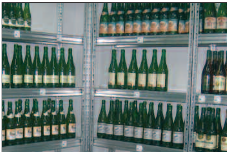
SAGARDOA EDARI FRESKAGARRIA DA, ALKOHOL GRADUAZIO BAXUKOA, URTE OSOAN KONTSUMITZEKO EGOKIA.

Edalontzitik 20-30 zentimetroz zerbitzatu, sagardoa hautsi eta txinparta ateratzeko.