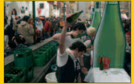
Igandean Sagardo Eguna; ale honekin gehigarri berezia