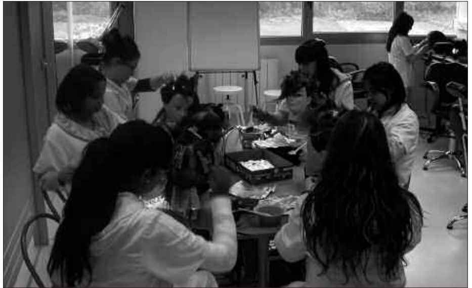
SUKALDARITZAN ETA ILE-APAINKETAN NOLA ARITZEN DIREN IKUS AHAL IZANGO DUGU SUTEGIN EGINGO DEN ERAKUSKETAN.

DBH graduatuan eta oinarrizko heziketan, aisialdiarentzat tartea ere bada