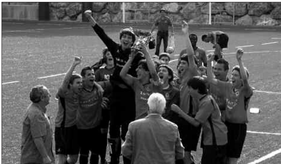
PASA DEN LARUNBATEAN IRABAZI ZUTEN FINALA AÑORGAREN AURKA.

D enboraldiko erronka nagusia beteta, pozik da Usurbil FT-ko jubenilen taldea. Gipuzkoako Kopa irabazi zuen joan den larunbatean, Añorgaren aurka jokaturako neurketan. 3-0 izan zen partidako azken emaitza. Autobusa antolatu zuten futbol taldekoek jokalariekin batera, haien inguruko jendea ere finala ikustera joan zedin. Ehun bat lagun bildu ziren Donostiako Puyo zelaian. Finalean giroa aparta izan zen eta aipatu moduan, emaitza bikaina. Garaipena ospatzeko garaia da orain. Zorionak!