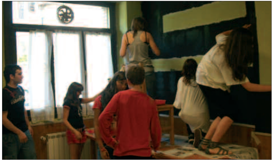
LOKALA EGOKITZEKO GARAIAN, GAZTEEK PARTE HARTZEKO AUKERA IZAN DUTE.

I. A. Udalak Gaztelekurako utzitako lokala, lehen zahar etxea zena hutsa dago.