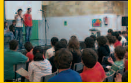
Igande honetan, Ikastolaren Eguna