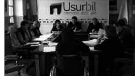
UDALBATZA PLENOA PASA DEN ASTEAZKENEAN BILDU ZEN.