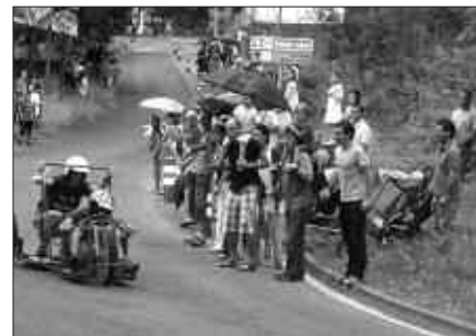
IRUDIAN, IAZKO JAIETAN EGINDAKO GOITIBEHERA TXAPELKETA.

izango da, baldin eta aurkeztutako lanek ez badute behar besteko kalitatearik.