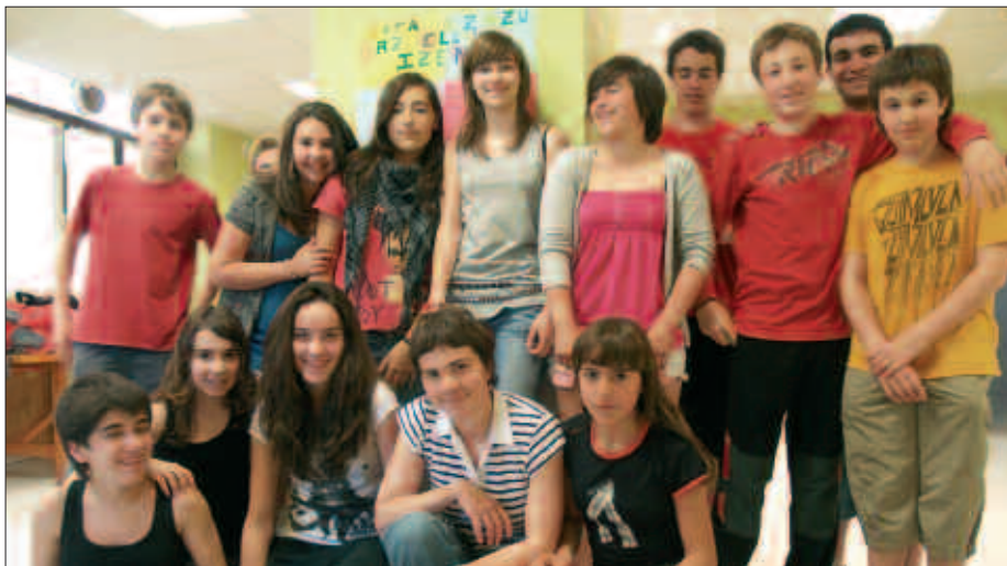
HERRIKO GAZTEAK LOKALERA GERTURATU ETA PARTE HARTZERA GONBIDATU DITUZTE AZKEN ASTEOTAN.