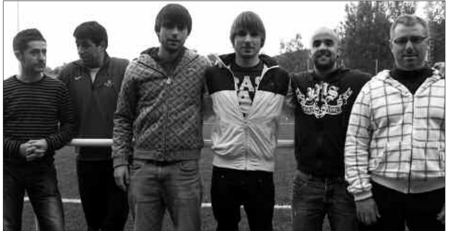
ARGAZKIAN, USURBILGO FUTBOL ESKOLAKO ENTRENATZAILEAK.

Adin tartearen kontuan izanda, bi taldeetan banatu dituzte gaztetxoak eta astean ordubetez, Haraneko futbol zelaian gus-tukoena duten kirol jardueran murgiltzen joan dira, iazko urriaz geroztik. Baina aipatu moduan, kirol jarduerak