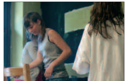
LEHEN GURE PAKEAREN EGOTZAZEN TOKIAN JARRI DA GAZTELEKUA. LOKALAK HIRU GELA IZANGO DITU.

I. A. Lokalak hiru gela ditu. Gela handiena topaleku izango da. Bertan, ping pong moduko joko bat egongo da, sofak egon edo hitz egiteko, mahai jokoak, musika, aldizkariak eta gazteei zuzenduriko informazio taula. Honetaz gain, gai ezberdinen inguruko jolasak edo tailerrak landuko ditugu adibidez, natura, sexua, herrialde ezberdinetako kulturak, nerabeen arteko harremanak, tuentiaren erabilpena... Sorkuntza gela deiturikoan, tailer bat martxan jarri nahi dugu. Proposamen desberdinak jaso ditugu orain arte; irratitailer bat, laburmetrai tailer bat, ile-apaindegia, makillajea... Gela hau ere gazteekin