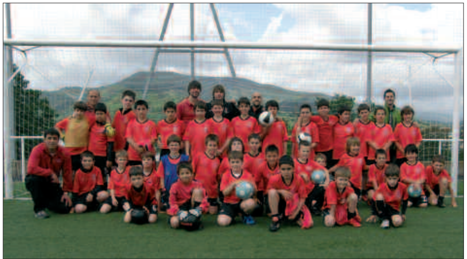
IRUDIAN, FUTBOL ESKOLAN PARTE HARTZEN DUTEN IKASLEAK ETA ENTRENATZAILEAK.

Futbol eskolatik berri eman dutenez, Gipuzkoa mailan ugaritzen doaz