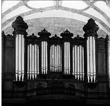
ORGANO KLASEAK HARTZEKO, PIANO EZAGUTZAK BEHAR DIRA.

Usurbiltzen taldea, bestetik, datorren astelehenean ekainaren 7an bilduko da, ohi bezala, 18:00etan Artzabalena.