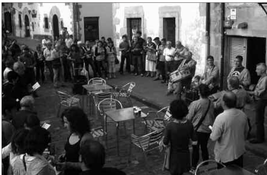
KUXKUXTU TXARANGA ETA KANTU TALDEA, ELKARREKIN KANTUAN.

Eta larunbat honetan, ekainak 5, Herrera eta Alcazarreko espetxeetara martxak antolatu dira eta Hernanitik autobusa aterako da goizeko 1:30ean. Izena emateko aukera, Txiriboga tabernan.