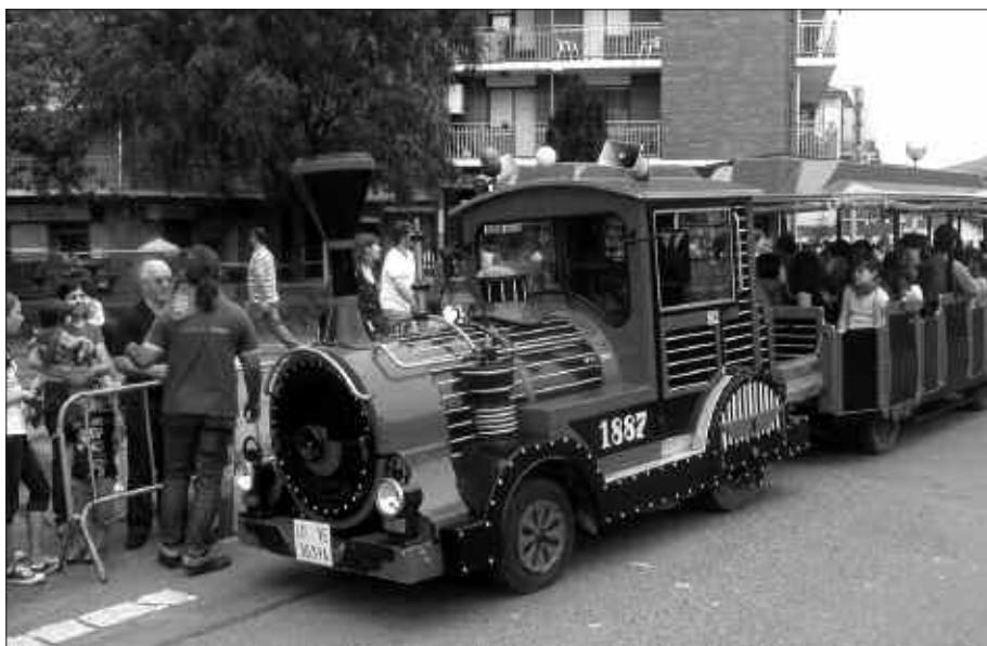
TXU TXU TRENAK ARRAKASTA HANDIA IZAN ZUEN IAZKOAN.

Bertsopaper Lehiaketa. Honako baldintzak bete behar dira parte hartzeko: usurbildarra izatea edota gai librean idaztea. Inoiz argitaratu gabeak izan behar duten lanak ekainaren 29a baino lehen aurkeztu behar dira udaletxean. Lanean egilearen daturik ez da agertuko, datu pertsonalak gutunazal itxi batean aurkeztu beharko dira. Erabakia jaietako bertso saioan ezagutuko da, uztailaren 3an. Lehen hiru sailkatuek, 200 euro eta txapela, 150 euro, eta 100 euroko sariak jasoko dituzte hurrenez hurren.