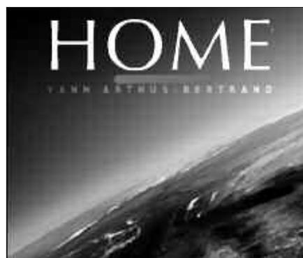
EKAINAREN 10EAN OSTEGUNA "HOME" PELIKULA ESKAINIKO DUTE.

Egitaraua: Abesbatza, Txalapartariak, Triki-Pandero-Alboka Taldea, Talde instrumentala, Txistulariak, Dantzariak.