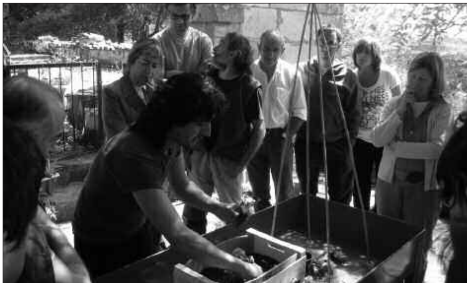
ARRILLAGA TXIKI BASERRI ONDAN EGIN ZEN IKASTAROA.

Ikastaroko plaza denak bete ziren eta batzuk kanpoan geratu ziren. Horregatik, ikastaro berri bat antolatzekotan dira. Aurrerago zehaztuko dute noiz burutuko den ikastaroa.