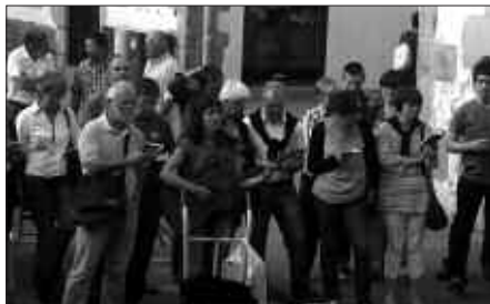
KANTU TALDEAREN BILERA ENTSEGU LOKALEAN BERTAN IZANGO DA.

Baina uda aurreko ekimen saioak agurtzeko, Kantu Taldeak "Gure Herriko Musika" emanaldia antolatu du Sutegin, ekainaren 18an ostirala, 20:00etan, Ibaia