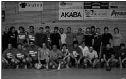
IAZ BEZALA, ARRATSALDEZ HAINBAT PARTIDA JOKATUKO DIRA ETA GAUEZ AFARIA EGINGO DUTE SAIZARREN.

Usurbilgo eskubaloit taldekoek iragarri dutenez, "nahikoa izerdi bota ondoren, denak Saizar sagardotegian afaltzera