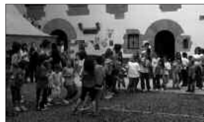
BAZKARIAREN ONDOREN JOLASEAN IBILI ZIREN DEMA PLAZAN.

E kaineko lehen igandean ospatu ziren Ikastolaren Eguna. Hainbat jolas eta ekitaldi iragarrita zeuden goiz partean. Ondoren, guraso, ikasle eta irakasle askok bat egin zuten frontoian egin zen herri bazkarian.