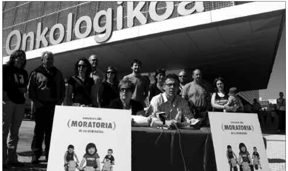
HAURRAK “MOTORREKIN” JOATEKO DEIALDIA EGIN DUTE.

Manifestaldi egunean, haurrak karteleko argazkian ageri diren motorrekin agertzera dei egiten dute antolatzaileek. Manifestaldi buruan joango dira haietako asko, antolatzaileen hitzetan, “aurrera egin nahi dutela adierazteko, etorkizuna direla erakusteko, osasuntsu bizi nahi dutela aldarrikatzeko”.