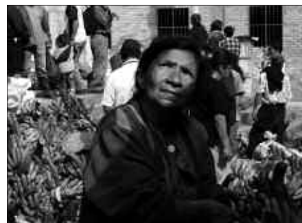
"SEMILLAS PARA SEGUIR VIVIENDO" DOKUMENTALA OSTIRALEAN EMANGO DUTE.

Ekainak 10, osteguna 19:00 "Home", Sutegin.