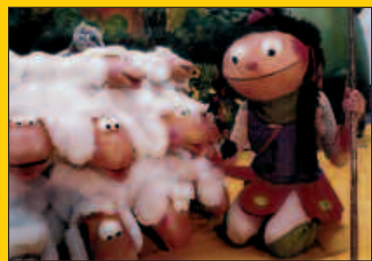
Kukubiltxokoak, ostiral honetan frontoian