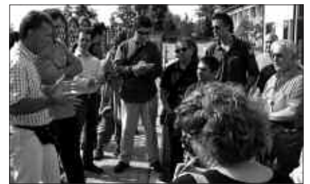
ITALIAN IZAN DIRA EGUNOTAN SAN MARKOSEK ANTOLATUTAKO BIDAIA.