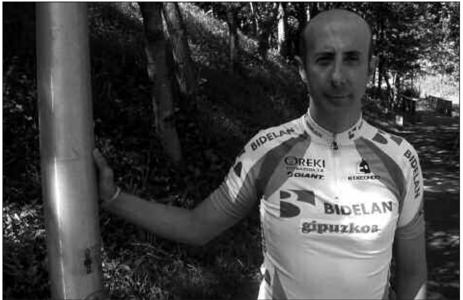
ASTEBURU HONETAN SEGOVIAN JOKATUKO DEN MUNDUKO KOPAN ARITUKO DA.

2012 urtean Londonen egingo diren Joko Olinpikoetan erretiratu nahi luke.