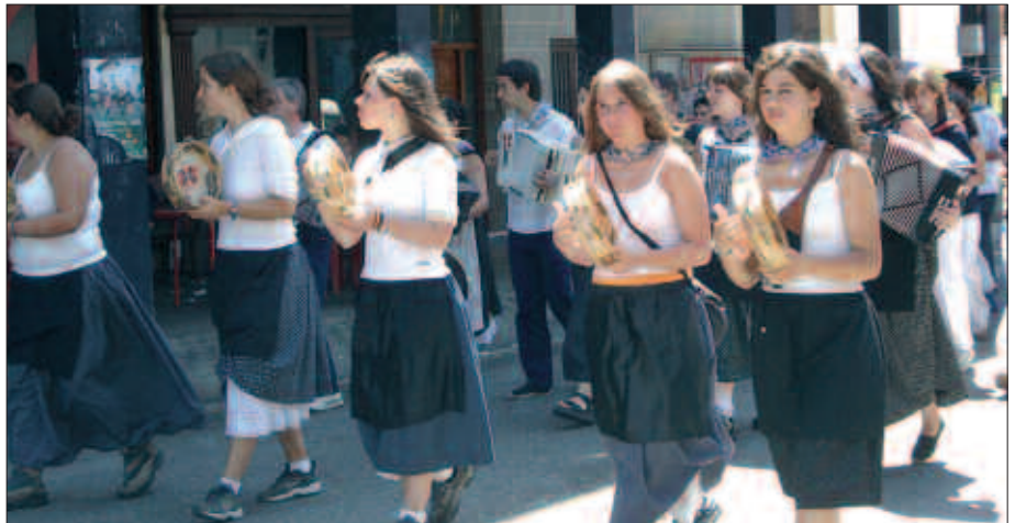
ZUMARTEK PASATAKO BELAUNALDI EZBERDINAK ARITUKO DIRA LARUNBATEAN.

I. A. Ikasle helduak geroz eta gehiago ditugu. Talde instrumental bat ere sortu da. Lanean topera dabilta. 25. urteurrenaren harira, apirilean disko bat grabatu genuen gaur egun ditugun taldeekin. Ekainaren 17an aurkeztuko dugu.