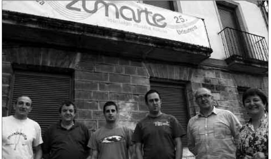
ZUMARTE MUSIKA ESKOLAKO KIDEAK LARUNBATA NOIZ IRITSIKO ZAIN DIRA.

I. M. Beste musika eskola batzuegandik ikasitako gauzak egiten hasi ginen. Guretzat Trintxerpeko musika eskola erreferente bat izan zen, eta haien laguntzarekin hasi ginen. Txistua, tronpeta, pianoa, eskusoinua edota saxofoia bezalako instrumentu batzuekin eta hurbildu zen ikasle kopuru txiki batekin hasi ginen. Lagun artean, borondatez lan asko eginez, ordu asko sartuaz, egitasmoa martxan jarri arte.