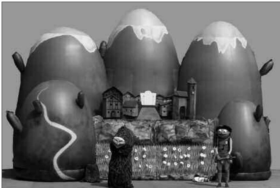
"KUKUBEL 2.0" ARRATSALDEKO 17:30EAN HASIKO DA, FRONTOIAN.

Kukubiltxoren lan guztietan, musikak leku berezia izaten du, baita Kukubel 2.0 ikuskizunean ere. "Lehenengo abesti berberak erabiltzen ditugu lan honetan. Doinuak berrituta daude, baina Oskorriren partaidez berdin jarraitzen du. Gainera, Kukubeli musikak duen magiak indarra ematen dio".