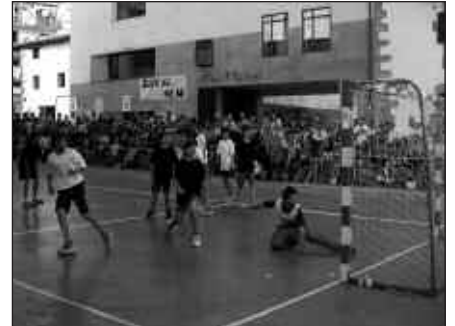
HARANEN JOKATUKO DIRA DONOSTI CUP-eko PARTIDA BATZUK.

Usurbil Cup amaitu den honetan, hastear da Donosti Cup txapelketa, datorren astelehenean, uztailak 5. Usurbilgo futbol taldekoek bi modutan parte hartuko dute. Batetik, kadete mailako taldeak txapelketan jokatu du. Bestalde, Haranen zenbait neurketa burutuko dira uztailaren 5etik 8ra. Lehenengoa, astelehenean bertan, arratsaldeko 16:30ean. Real de Gandia CF