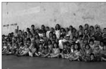
UDAJOLASEN 100 LAGUN BILDUKO DIRA. ARGAZKIAN, IAZKO TALDEKO KIDEAK.

Zubietako Txokoetan, 2 urtetik 11 urte bitarteko haurrak elkartuko dira. Uztailean eta abuztuan egongo da martxan eta egunero Eskola Txikitari batuko dira. Ordutegia honako hau izango da: 9:30etik 13:30era.