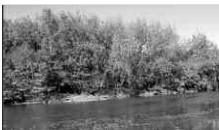
ITSASADARRA BABESTEKO, PARTEHARTZE PROZESUA IREKI DA.

Oriako ibaia usurbildarren natura ondare izanik, eta parte hartze prozesua interesdun orori zabalduta dagoenez, orain da ekarpenak egiteko aukera.