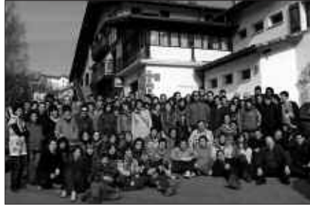
AEK-KO IKASLEAK, ARANTZAKO (NAFARROA) BARNETEGIAN.

Bestetik, lehenengo barnetegi ibiltaria egin zela hamar urte betetzen direla eta, aurten, bizikletaz egiten den betikoaz gain, lehenengo aldiz burutuko da oinez egindakoa ere. Biek ala biek