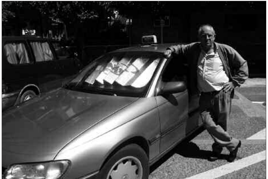
TAXI LIZENTZIA SALGAI DAGO ORAIN.

Taxi lizentzia salgai dago orain. Interesdunek Gipuzkoako Taxi Elkartearen eskura dezake informazio gehiago eta eginbeharrekoen berri. Telefono zenbakia honakoa da: 943 465 498.