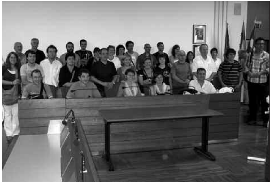
ITALIAN IZAN DIREN UDAL ORDEZKARIAK ETA GIZA MUGIMENDUETAKO KIDEAK.

Kutsatzen duenak ordaindu behar du, ingurumenaren aldeko ahalegina saritu egiten da. 2008an Piamonteko erregio guztian, baziren 176 herri %45eko helburura iritsi ez zirenak. Guztien artean ordaindu behar izan zuten zigor ekonomikoak dirutza eragin zuen, milioi bat euro. Jasotako dirua ingurumenaren