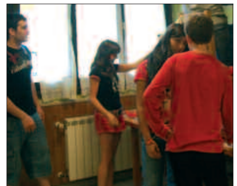
LARUNBAT GOIZEAN HASIKO DA GAZTELEKUKOEN PRESTATU DUTEN UDA FESTA.

Astebete barruko irteeren aurretik, larunbat honetan uztaileak 3, Udako Festa antolatu dute Gaztelekukoek Santixabel jaien barruan. Ekimena bereziki orain arte Gaztelekura hurbildu diren gaztetxoiei eta haien lagunei zuzendua dago. Lau