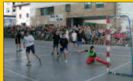
Jendetza bildu zen Usurbil Cup txapelketako finaleran