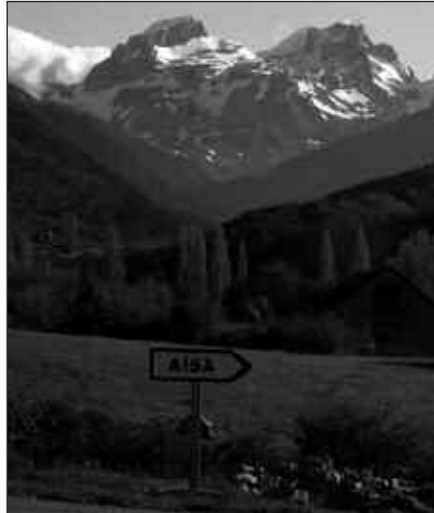
IRTEERA SANTIXABEL ONDORENGO ASTEBURUAN EGINGO DA.

Joan nahi duen edonork, 20 euroko fidantza ordaindu beharko du Andatza Mendi Taldeko kontu korrontean,