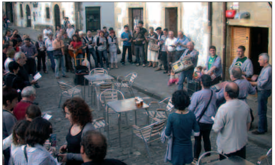
LARUNBAT HONETAN, KUXKUXTU TXARANGAREKIN BATERA EGINGO DEN KANTU JIRAREKIN AMAITUKO DUTE IKASTURTEA USURBILGO KANTU TALDEKOEK.

Kantu Jirakoek aipatu dutenez, “Kuxkuxtu txarangakoek banatzen duten liburuxka lehendik duenak ez du berriz erosi beharrik izango, baina