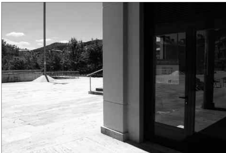
ATEZ ATEKO BULEGOA ARTZABALEN DAGO DRAIN.

J. M. I. Usurbilen historian izan den prozesu partehartzaile handiena eman da