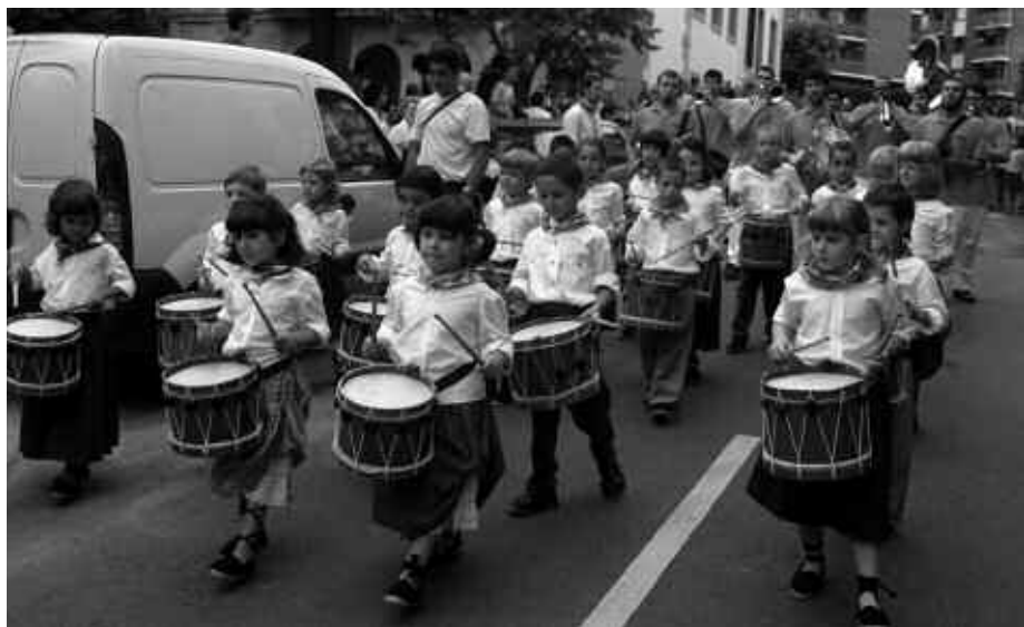
OSTIRALEAN, EGUERDIKO 12:00AK ALDERA ABIATUKO DA UMEEN DANBORRADA UDALETXEKO PLAZATIK.

18:00 "Zirko dantza eroa" ikuskizuna Artzabalen.