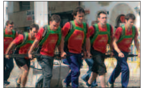
LEHENBIZI NORK BURUTUKO DUEN PROBA, ERABAKIGARRIA IZAN DAITEKE.

Aginagarren moduan, aurkariek baino plaza gehiago egitea da usurbildarren erronka nagusia. San Ixidro eguneko desafioa Aginagakoek irabazi zutela ez dute ahaztu. Honenbestez, emaitza berdintzea izango da usurbildarren giza-probako helburu nagusia.