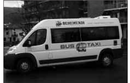
UZTAILEAN GOIZEZ IBILIKO DA. ABUZTUAN EZ DA BUS-TAXIRIK IZANGO.

Datorren hilabete osoan zehar ez da beraz, bus-taxi zerbitzurik izango. Bai ordea, uztaila amaitu artean, baina murrizketekin. Urtean zehar, astelehe- netik ostiralera eguneko eskaintzen ziren bost zerbitzutik hirura murriztu baita hil honetan bus-taxi zerbitzua.