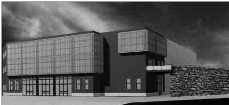
KANTXARA IGOTZEKO ARRANPA BAT ERAIKIKO DA. IRUDIAN, ESKUBITARA, HARRI ITXURAKOA.

Baina kiroldegiaren itxuraldaketa prozesua laster abiatuko da. Kirol instalazioak handitzeko lanak fatxadatik