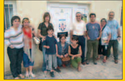
Zubietako kaltetuak Foru Aldundiarekin bildu dira