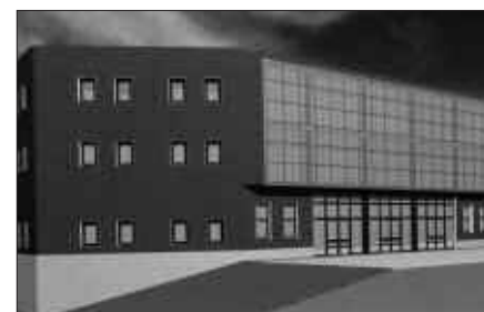
KIROLDEGIKO ATARIAK ITXURA HAU IZANGO DU.

Usurbilek. Egun duen sarrera aldetik hainbat metro karratu irabazi ostean, fatxada hainbat metro aurrera ekarri ostean alegia, gune berriak sortuko dira instalazioetan. Batetik, zuloan geratzen zen gimnasioa lehen solairura lekuz aldatuko dute. Kirol Patronatutik gogorazten dutenez, aldaketarekin argitasuna izango du gimnasia doan. Bigarren solairuan, balio anitzeko areto berri bat zabalduko dute. Hura erabiltzeko Usurbil Judo Taldekoek izango dute lehentasuna, nahiz haien entrenamendu orduetatik kanpo, beste zenbait ekintza burutzeko ere baliatuko duten gune berria. Handitze lanei esker, aldagela gehiago izango ditu Kiroldegiak etorkizunean.