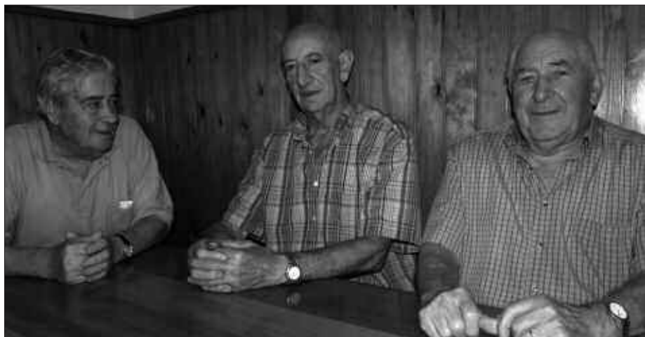
ELKARTEKO SORTZAILEAK OMENDUKO DITUZTE UZTAILAREN 31N.

Bazkideen sortzaileek gogorazten duten moduan, lehen egunero hurbiltzen ziren elkartera. Belaunaldi berriek