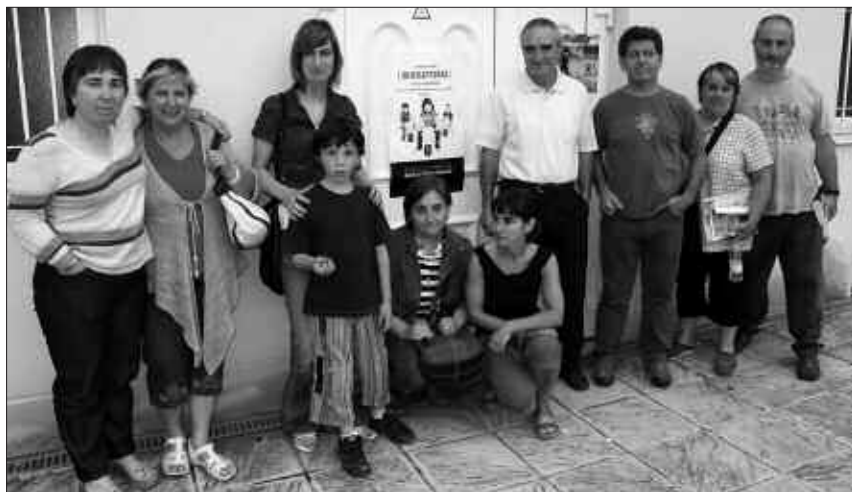
ZUBIETAKO KALTETUAK DIPUTAZIOKO ORDEZKARIEKIN BILDU ZIREN AURREKO ASTEAN.

E rraustegiak eragingo dituen kalteak ehizpide izan zituzten hitzorduan; eta atez ateko bilketaren zein moratoriaren aldeko jarrera erakutsi zieten zubietarrek Aldundikoei. Aldunditik elkarlanerako jarrera eta aurrerantzean informazioa partekatzeko asmoa erakutsi zuten, beti ere ordea zubietarren esanetan, "beraien proiektua jarraituko bagenu". Aldundiak "karta guztiak markatuta dituztela", diote zubietarrek. Bilera ostean ordea argi diote: "Kontziente izan behar gara gure indarra zein den. Argi dago atez atekoaren aldeko mugimenduak min handia egin diela beraiei eta hori ez zuten espero", adierazi dute Zubietatik.