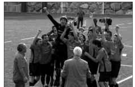
TALDEAK OSATZEKO LANEAN HASIA DA USURBIL FT TALDEA.

Uztailak 29, jubenilen txanda Uztailaren 29an jubenilen txanda izango da. Arratsaldeko 18:30ean