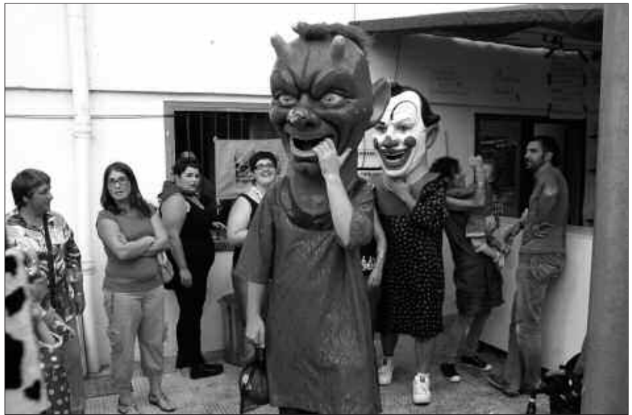
BURUHANDIAK, IAZ ATXEGALDEN ANTOLATU ZITUZTEN JOLASETAN.

Auzoko festak ospatu ziren lehen urtetik, egitarauan pisu nabarmena izan dute haurrei zuzendutako ekitaldiek.