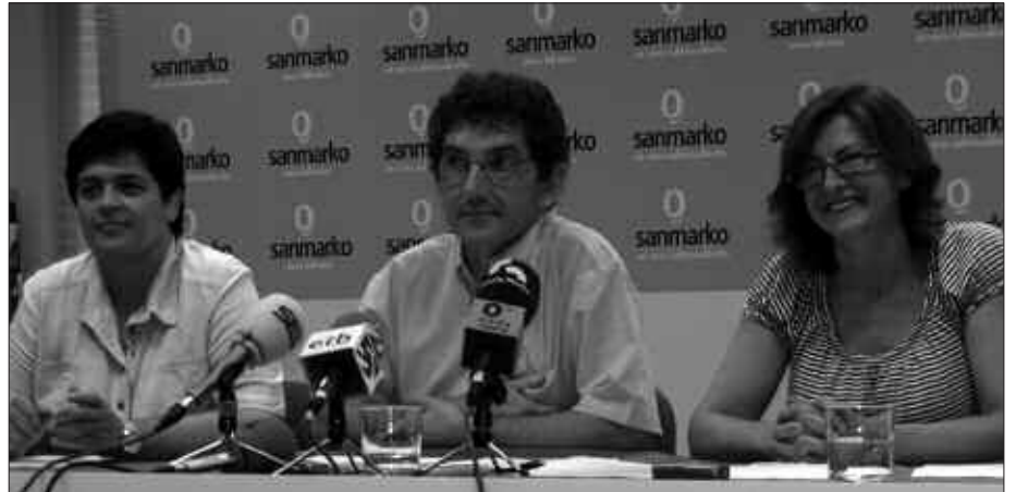
IRUDIAN, HERNANI, USURBIL ETA DONOSTIAKO UDAL ORDEZKARIAK.

Hamaikabat, PP, PSE-EE eta EAJ-PNV alderdiek gai honetan erakutsitako jarrera gaitzetsi zuten Mankomunitateko