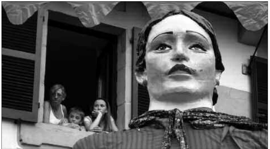
2011 RAKO PROPOSAMENAK ERE AZTERTU ZIREN AZKEN JAI BATZORDEAN.

M unduari bira ematen ari dira udan Zubietan, Zubietan antolatutako txokoetan. Ur jolasak, ginkana, herri kirolak, futbola... Lekuan lekuko ohiturei lotutako ekintzak burutzen ari dira. 2-11 urte arteko berrogei bat haurrek eman dute izena udako txoko hauetan. Burutu dituzten beste ekintzen artean, kanpora ere irtenak dira. Elizondan izan ondoren, egunotan Bizkaia aldera, Mundakara gau bat pasatzera joango dira. Abuztu amaierara arte izango dira martxan Zubietako Txokoak.