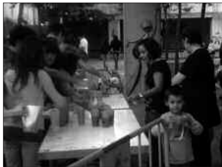
IAZ BEZALA, TXOKOLATEA BANATUKO DA ARRATSALDEAN.

-Zure esku dagoen bide-gorri sarea erabili.