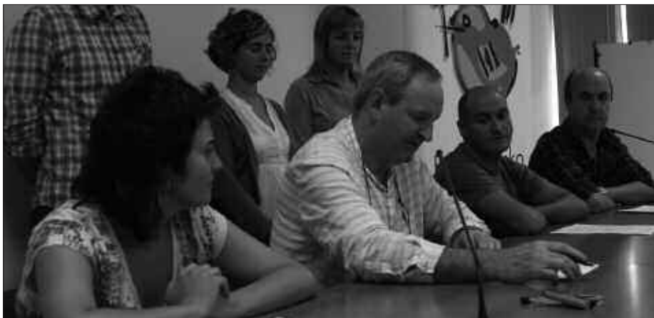
IKASTURTE BERRIKO KLASEAK URRIAREN 4AN HASIKO DIRA ETUMETA EUSKALTEGIAN. PRENTSAURREKOAREN BIDEA, NOAUA.COM WEB ORRIAN.

nagusia, aipatzen zutenez, “helduen artean, pertsona elebarririk ez egotea da”. Eta euskara ikasten ari direnak euskal mundura, euskal kulturara gerturatzea, baita “herritarren aukera berdintasunera ere”.