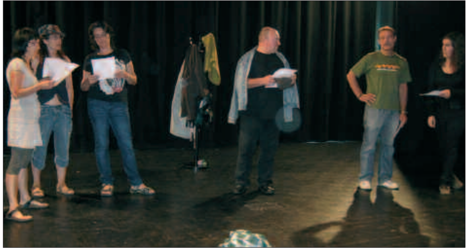
SUTEGIN ENTSEATZEN IZAN ZIREN AURREKO ASTEAN LANDABERRI TALDEAK.

Iluntzetan berriz, emanaldi desberdinez gozatzeko aukera izango da; tartean, ostiralean, irailak 17, Lasarte-Oriako Landaberri Antzerki Eskolakoek ekarriko duten obra berriaz: “Mikelenak”. Mikel Laboaren omenez, bere abesti eta lana agertuko dituzte. “Giroa, gizartean edo gudan bere presentzia edo eragina nola suma dezakegun. Badira eszena batzuk bere kantuetatik eratorriak. Esperimentazioa ere bada”, adierazi dute taldetik. Ohiko elementuekin, ezohiko antzezlanak izango da beraz, antzerki eskolako esanetan, “Laboak berak egiten zuen moduan”.