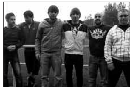
IRUDIAN, IAZ ESKOLAN ENTRENATZAILE MODUAN ARITU ZIRENAK.

banakako entrenamendu saioak programatu dituzte, astehenetik ostiralera.