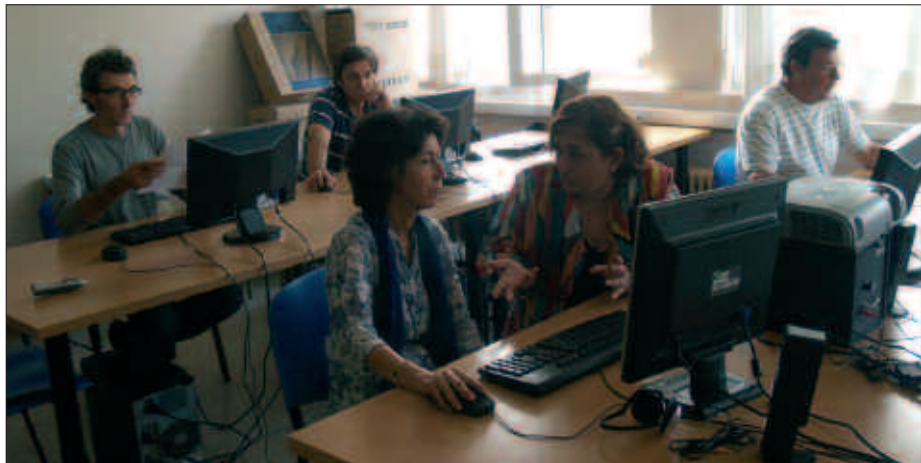
ESKARIAREN ARABERA MOLDATUKO DUTE IKASKETA ESKAINTZA.