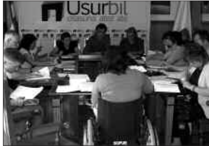
UDALBATZA PLENOA, ARTXIBOKO IRUDI BATEAN.

Alkaside taldekoek aldiz, testuaren aurka bozkatu zuten. Osoko bilkura berean hain zuzen, Alkaside udal tal-