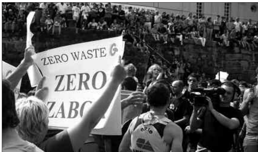
GIZA-KATEA ERE EGIN ZUTEN KONTXAKO HONDARTZAN.

Giza-katea ere burutu zen Kontxako hondartzan, Gipuzkoako Errausketaren Aurkako Plataformen Koordinakundeak deituta.