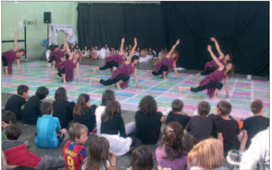
LANDABERRIKOAK KALE ANTZERKI EGUNEAN ERE HARTU ZUTEN PARTE.

Ikasturte honetan, bilgunea antzerki eta dantza eskolan bihurtu nahi dute. “Lasarte-Oriako Kukuka Antzerki eta Dantza Eskola izenarekin hasiko gara”, iragarri dute. Helburua herrian haien oihartzuna hedatzea da, edo urteotan egin duten moduan, zabalkunde prozesuarekin jarraitzea. Gogorarazten dute-