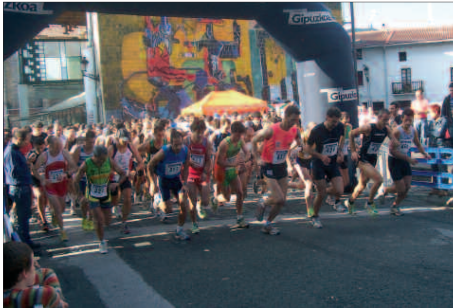
LASTERKARIAK, MIKEL LABOA PLAZATIK ATERAKO DIRA GOIZEKO 11:00ETAN.

Antolatzailea: Baxurde Txiki Usurbilgo Triatloi Taldea.