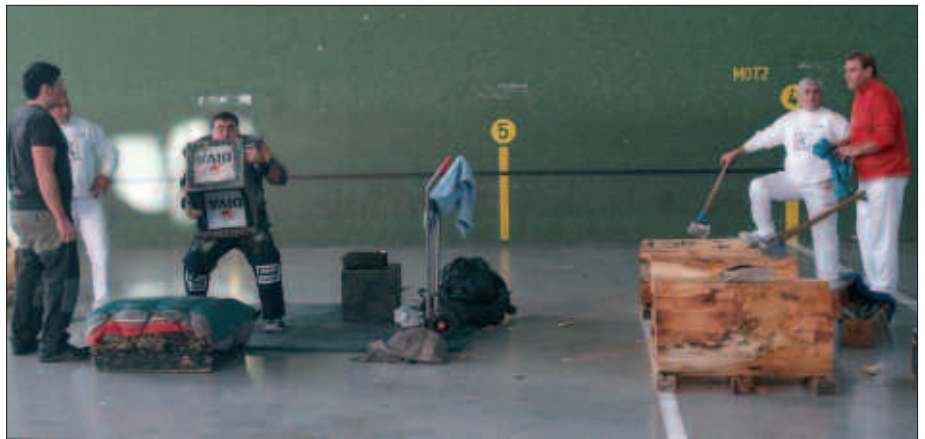
SAN PRAIXKU EGUNEAN, HAMAIKETAKOA ETA HERRI KIROLAK IZAN ZIREN.

erosi beharko ditu, Arrate Zahar Egoitzan edo Etxebeste tabernan. Helduen menuko tiketak 20 eurotan eskuratu ahal izango dira, haurren menukoak 15 eurotan.