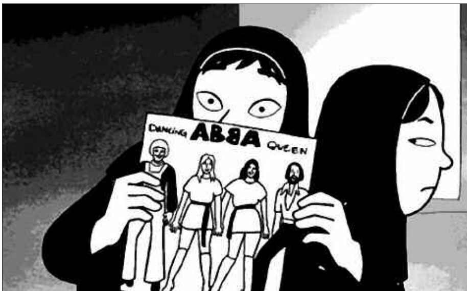
PERSEPOLIS PELIKULA MARJANE SATRAPIREN KOMIKI AUTOBIOGRAFIKOETAN DINARRITZEN DA.