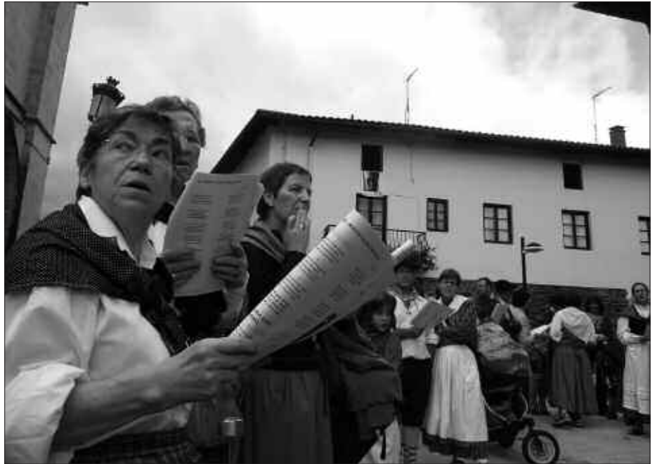
IAZ BEZALA, KANTU-JIRAN IBILIKO DIRA EGUERDI PARTEAN.