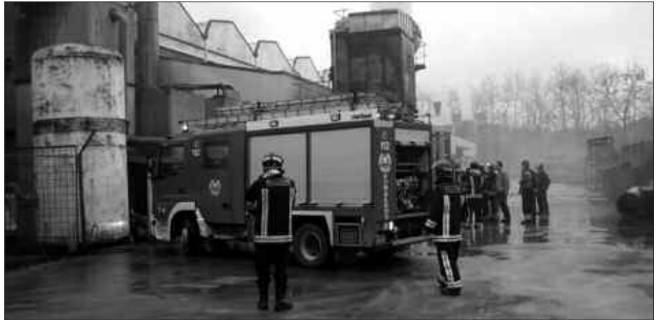
2007AN UCINEKO ESTRAKTOREAREN FILTROA ERRE EGIN ZEN.