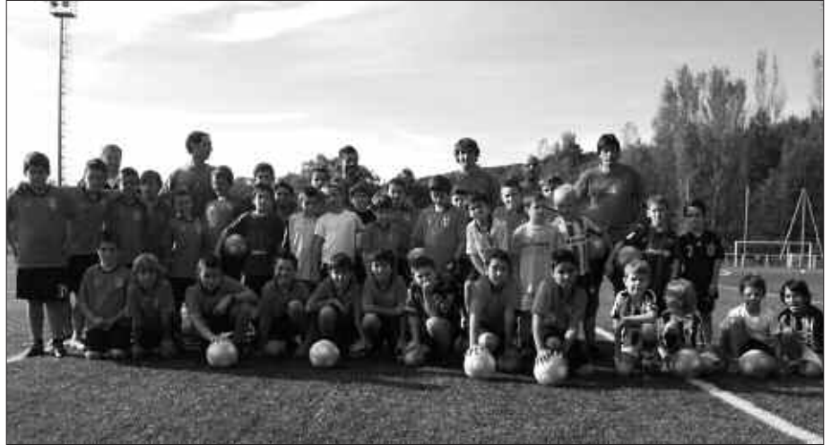
AURTEN EZ DA NESKEN TALDEA OSATU.

Futbol Eskolari dagokionean, bere horretan mantenduko da, 40 gaztetxorekin. Hamabost jokalariz osatutako alebin mailako taldeak ere haiekin batera jokatzea nahi zuten. Hauek ere federatzea zen Usurbil FT-ren asmoa. Federazioko izen emate orriak eskuratu eta bete arren, "inork jakinarazi gabe, ezustea izan genuen kanpoan geratu ginenean". Gai honetan zeresana duten