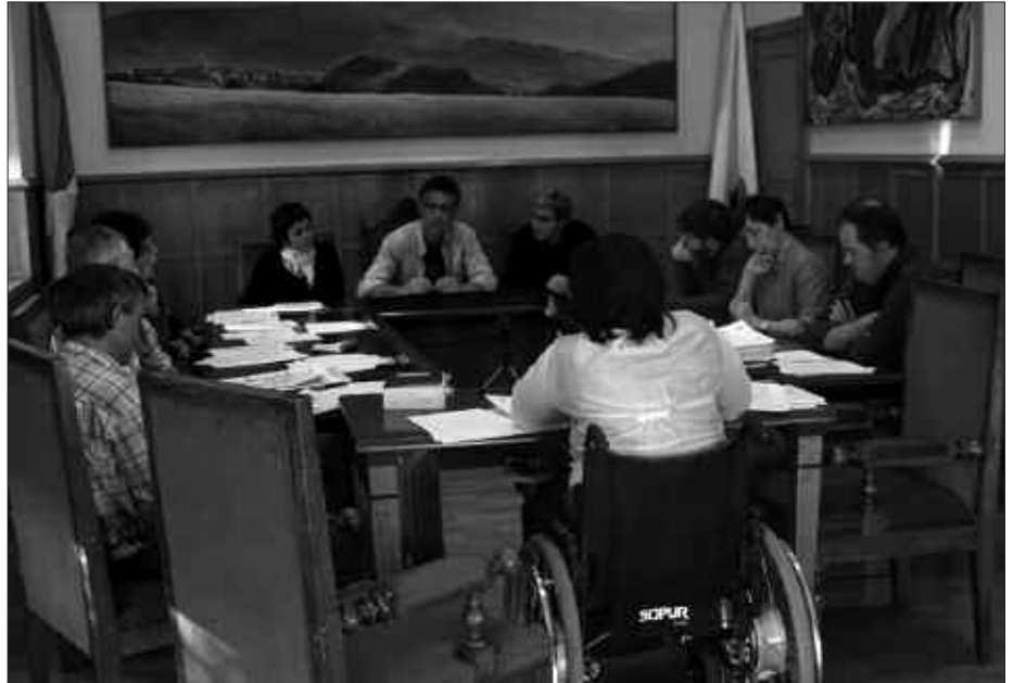
IRAILAREN 28AN BILDU ZEN UDALBATZA PLENOA.

2 010-14 urterako Emakume eta Gizonen Berdintasunerako I. Plana onartu zuen udalbatzak gehiengo osoz, joan den irailaren 28an burutu zen osoko ohiko bilkuran. Planak, aurrerantzian garatu beharreko lau estrategia biltzen ditu: genero-ikuspegia udal jarduera guztietan txertatzea; emakumeen ahalduntzea eta parte hartze publikoa sustatzea; bizitza pertsonala eta lana bateragarria izateko neurriak hartzea, eta emakumeen eta gizonen erantzunkidetasuna sustatzea; eta azkenik, emakumeen aurkako indarkeria prebenitzea eta horren biktimak diren emakumei eskainitako arreta hobetzea.