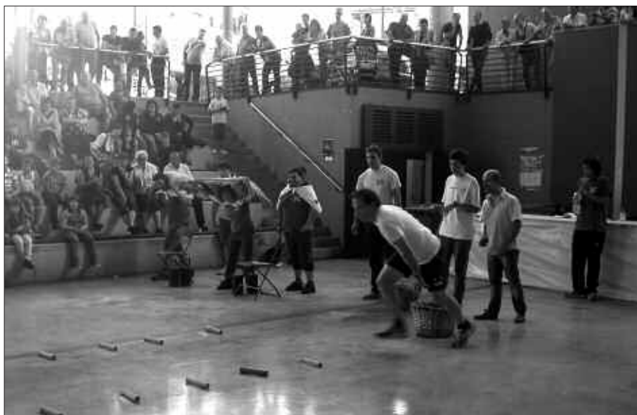
SERIO DEMONIO ARITU ZIREN LEHIAN AGINAGAN, IKUSKIZUN POLITA ESKAINIZ.

A rgazkia pasa den igandekoa da. Alde batean, txuriz jantzitakoak. Bestean, urdinez jantzitakoak. Egin beharreko lana, makala ez behintzat: lokotxak biltzea, sagar bilketa, hogeikolpeko ingude proba, txingekin itzuli bana, trontzan hiruna ebaki... Bazkalostean izanik, jendea isil antzean zegoen frontoian. Baina gazteak zein helduak lehian hasi zirenean, berotzen hasi zen frontoiko giroa. Batzuk eta besteak animatuz, arratsalde polita pasa zuten Aginagara hurbildu zirenek.