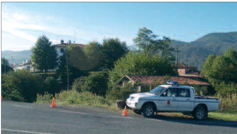
MAIATZETIK, HAINBAT GAZTE BIZI ZIREN SAN INAZIO ERROTONDA ONDOKO ETXE HONETAN.

Udal perituaren txostenean oinarrituta hain zuzen, etxea hustutzeko agindua sinatu zuen alkateak. Gazte hauek adierazi digutenez, "perituak etxeari begiratu bota eta paper batean zirriborro bat egin zuen; eta argazki batzuk atera zituen, hori baino ez".