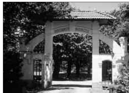
GARAI BATEAN ARKU HAU ZEGOEN SENDATEGIAN.

Baserriak urmaela, lorategi eta sarretarako arku dotoreak zituen. Argazki horietako bat baduzu, sendategiko arduradunek bereziki eskertuko lukete.