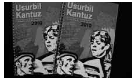
KANTU TALDEAK LIBURUXKA BAT PLAZARATU BERRI DU.

Asteartean hasi ziren entseguak, Udarregi ikastolako musika gelan. 19:00etan elkartu ohi dira, asteartetan.