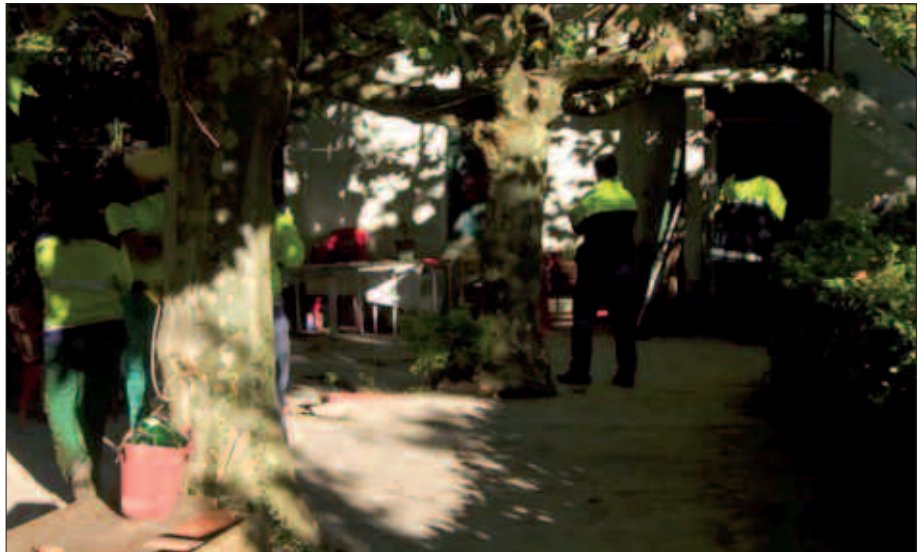
IRAILAREN 29AN HUSTU EGIN ZUTEN ETXEA.

Santa Teresan bizi ziren hiru gazte Usurbilgo lagun baten etxean daude orain. Beste biak eta ume txikia, lan kontuengatik kanpoan aurkitzen ziren etxearen hustuketa eman zenean.