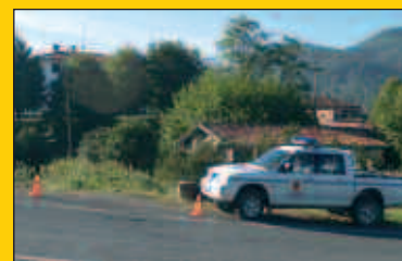
Prezintatu egin dute Santa Teresa etxea