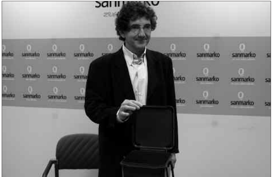
ATEZ ATEKO KUBOA ESKUETAN AGURTU NAHI IZAN ZUEN.

Aurrera begira, Garbigune proiektuak bideratzeko lanetan zebiltzan. Garberan zabaldukoarekin batera, Donostian