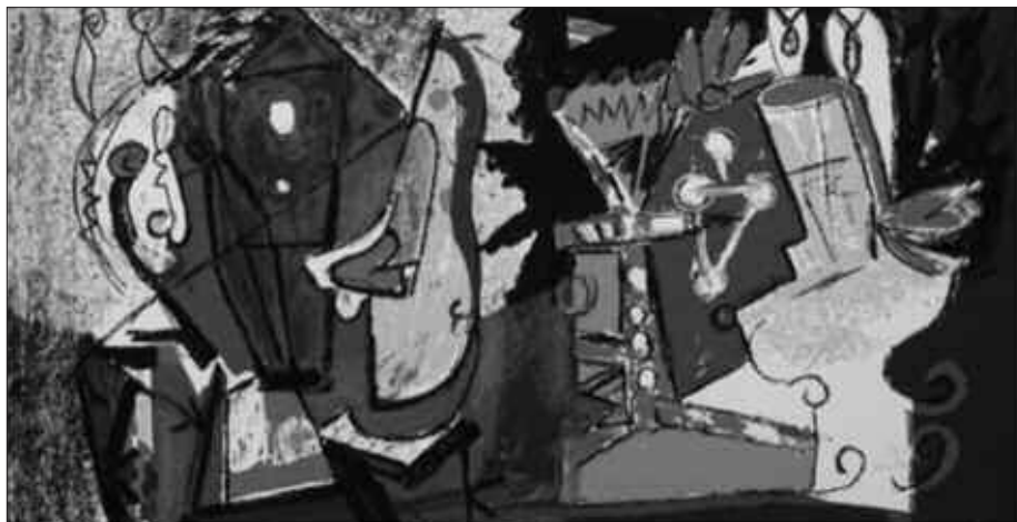
SUTEGIN TOPATUKO DUGUN SERIGRAFIAKOKO BAT HAUXE DA.