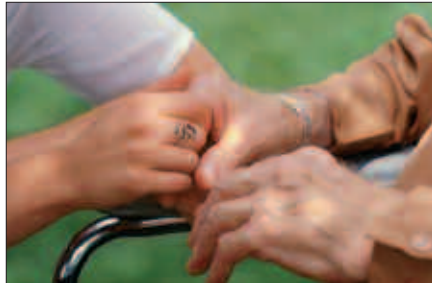
IKASTARAREN ONDOREN PRAKTIKAK EGITEKO AUKERA IZANGO DA.

Ondoren, praktikak Ikastaroa amaitu ondoren, sektoreko enpresetan praktikak egin ahal izango dira.