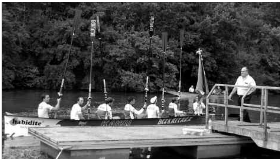
KAIKUKOAK, BANDERA ESKURATU BERRITAN.

Trainerila txapelketaren aurretik eta jaien lau eguneko etenaldiaren ondoren, Haurren Egunarekin ekin zioten