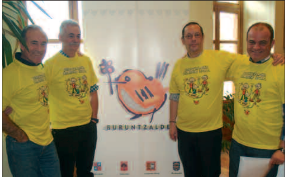
USURBILGO UDALETXEAN EGIN ZEN IBILALDIAREN AURKEZPENA.

Aukeran bost ibilbide izango dira guztira, bakoitza bere kolore identifi-