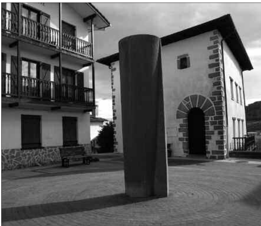
HIRIBILDU TITULUA EMAN ZITZAIONEKO URTEURRENEAN JARRI ZEN HONAKO ESKULTURA.