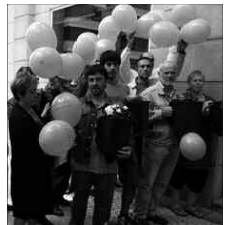
ATEZ ATEKO KUBOEKIN ETA GLOBOEKIN BERTARATU ZIREN.

Orain arteko Mankomunitatearen lan ildoak jarraitzea deitu du Gipuzkoa Zero Zabor taldeak: “gauzak ondo egiteko bideak badirela erakutsi du, erabili ditzagun”. Errausketaren aurka dardela gogoraztearekin batera, osasuna lehenetsi, eta dirua, murrizte, birziklatze eta berrerabiltzera bideratzea galde-giten dute.