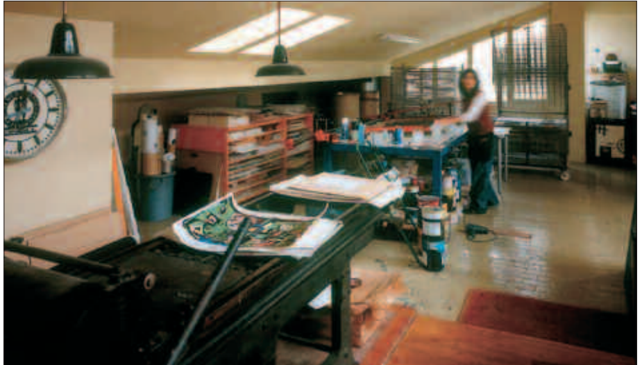
USOA ZUMETA BERE TAILERREAN, SERIGRAFIA LANETAN.

da. Bilboko Arte Eder museoan aurkeztu zen liburua, oso garrantzitsutzat jotzen dudana. Ate asko ireki dizkigu eta ibilbide bat egin da liburuarekin; ez da bukatu gainera. Oraindik jarraitzen dugu erakusketa horrekin lanean. Erakusketari esker, jende askok ezagutu du lan hau eta esperientzia oso polita izan da.