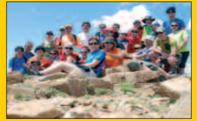
Andatza Mendi Taldea, etorkizuna kolokan