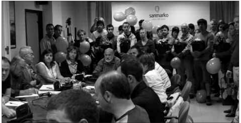
BOZKETAN, GIPUZKOA ZERO ZABOR TALDEKO KIDEAK ERE IZAN ZIREN.

Jarraian, aipatu moduan, hedabideekin batera bilera gelan sartzeko eta kargu aldaketa gertutik jarraitzeko aukera izan zuten. Bilerako gai zerrendako lehen pun-