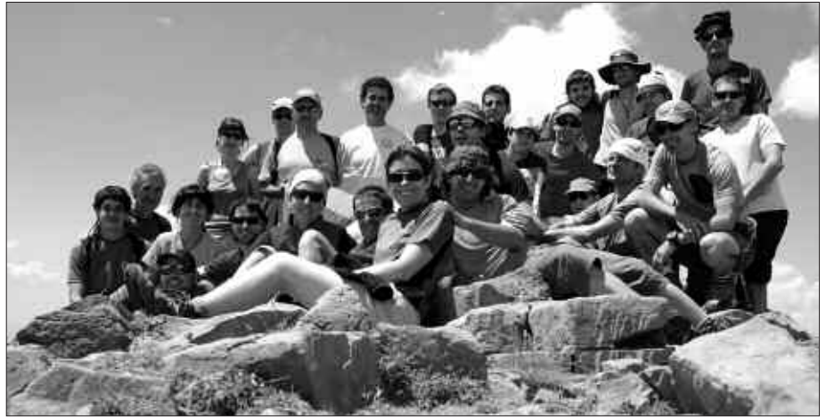
IAZKO UZTAILEAN, PIRINIOETAN EGINDAKO ARGAZKIA.

A. U. Aldiz, Andatzatik taldean joate horri tarte bat egiten saiatu izan gara.