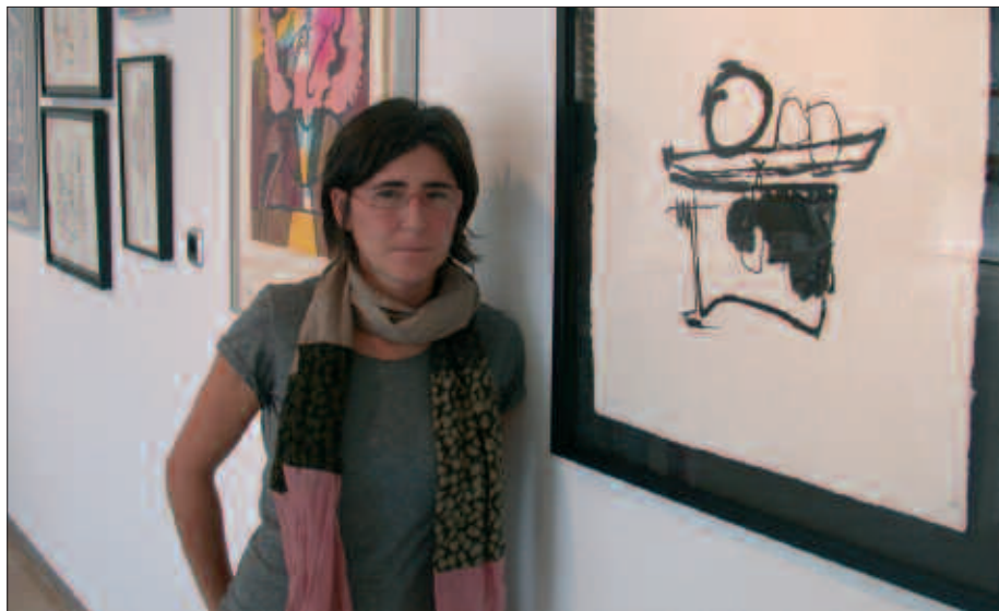
USOA, SUTEGIN JARRI DITUEN SERIGRAFIA LANEN ONDOAN.

U. Z. Oso bide polita da. Pintura, pintura da. Eta eskultura, eskultura. Artista batek bere lana beste teknika batera itzuli behar duenean (kasu honetan, serigrafia), hori aldaketa asko daude. Eta garapen-prozesu hori ikustea oso aberatsa da. Niri hori asko