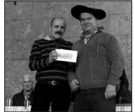
BABARRUN LEHIAKETAN, OLARRI BASERRIAK (KALEZAR).

aukera izan zuten. Atxega jauregikoek egindako zuku beroa esker onez hartu zuten askok eta askok.