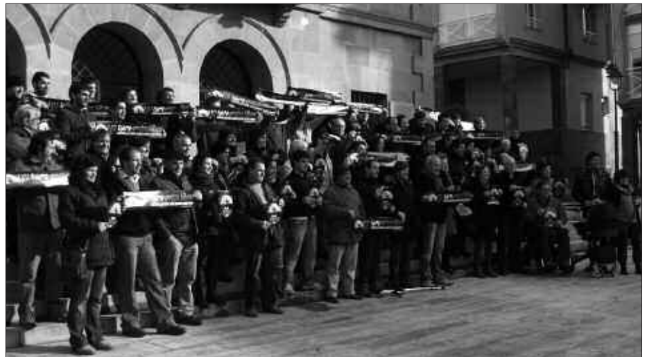
ABENDUAREN 18KO GIZA-KATEAN, URTARRILAREN 8KO MANIFESTAZIORAKO DEIALDIA EGIN ZUTEN.

Azkenik, urtarrilaren 8rako presoen eskubideen aldeko manifestazio nazionala deitua dago Bilbon, "esku-bide guztiekin, euskal presoak Euskal Herrira!" lemapean.