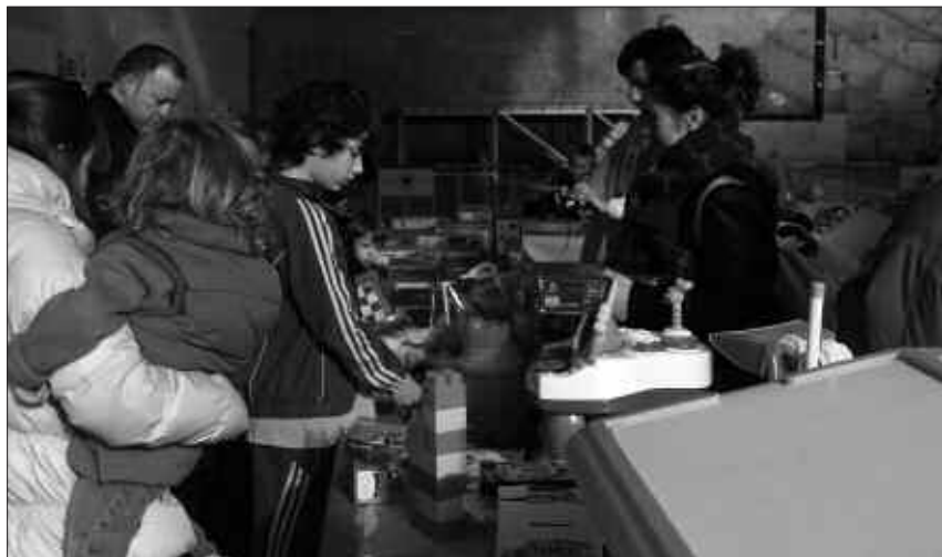
LARUNBAT GOIZEAN EGIN ZEN JOSTAILU AZOKA FRONTOIAN.

Eguberrien atarian, eta jostatzeko gaiak berosteko eskaintza geroz eta ugariagoa den honetan, etxean gordeta, ahaztuta izan ohi diren beste jostailu horiek berrerabiltzeko aukera eskaini dute laugarrenez, Hitz Aho Udarregi ikastolako guraso elkarteak, joan den larunbatean frontoian antolatu zuen Jostailu Azokan. Jostailuak berrerabili eta trukatzeko bultzatu nahi dute, sistema erraz baten bidez. Norbaitek aipatu ekimenerako utzitako jostailua, azokan bertan beste gai batengatik truka zezakeen. Goiz hotzari aurre eginez, herritarrak bertaratu ziren frontoira. Bertan zeuden mahaiei begira, argi dago; beste norbaitek gus-tura erabil ditzakeela jakin arren, etxetan era-biltzen ez diren jostailu asko dago.