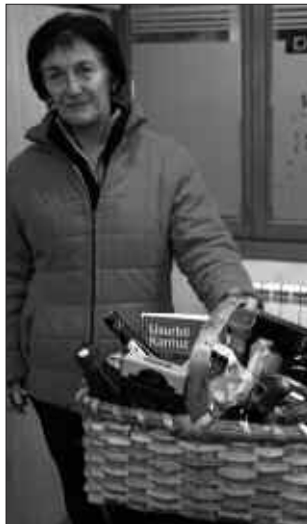
ALKORTA HARATEGIA, BEZERO SARITUA.

Publizitatea jartzen duten bezeroen artean, Alkorta harategia izan da saskia eramán duena.