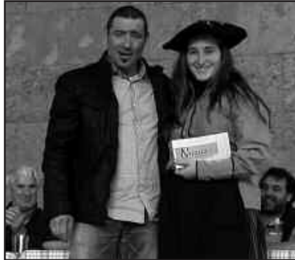
SAGARDOAN, AGINAGAKO GOROSTIDI BASERRIAK ERAMAN ZUEN LEHEN SARIA.

NOAUA!ren eskutik, azokara bertaratu zirenak babarrun zukua dastatzeko