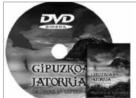
AURKEZPENA SUTEGIN IZANGO DA.