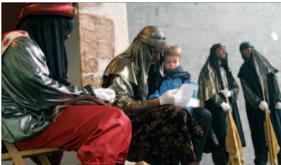
URTARRILAREN 5EAN, GOIZEZ, GUTUNAK JASOKO DIRA FRONTOIAN.

Aurten aldaketa txiki bat dago, ordutegiari lotutakoa. Iluntzeko 17:30etan abiatuko dira Kabalgatakoak Usurbil aldera. Kaxko inguruko erronda egin ostean, frontoian osatuko dute ibilbidea azken ekitaldiarekin. Kabalgata ondo lotuta uzteko, bertan parte hartzeko