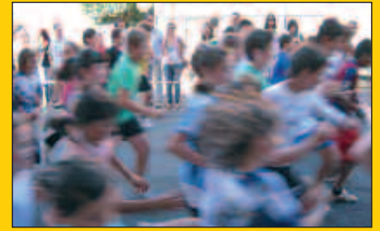
Izen-emate ugari San Silvestre lasterketarako