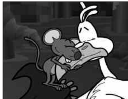
“MIDAS ERREGEAREN ALTXORRA” URTARRILAREN 4AN EMANGO DUTE.