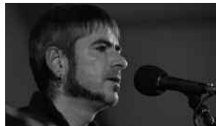
UNAI ITURRIAGA BERTSOLARIA.

Sarrerak 5 eurotan erosi ahal izango dira aldeztatik, Oiardo Kiroldegian eta Txiribogan. Edo egunean bertan bestela, 8 euroren truke. Antolatzaileek, ekitaldira joateko asmoa duenari sarrera lehenbailehen erostea aholkatzen diote. Salgai izango dira urtarrilaren 3tik aurrera.