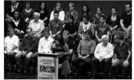
ALDERDI EZBERDINETAKO KIDEAK, AKORDIOAREN BERRI EMATEN.

Gainera, negoziazio prozesua eragile politiko, sindikal eta sozialen egitekoa baino ez dela izango diote. Eta elkarriz-