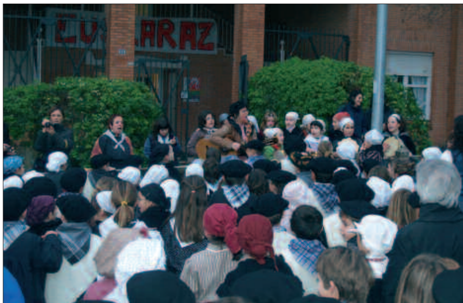
UDARREGI IKASTOLAKO IKASLEAK IZAN ZIREN GOIZTIARRENAK. ASTEARTEAN ARITU ZIREN KANTUAN.

18:00 Presoen eskubideen aldeko Olentzero, Aitzaga aurretik abiatuta. Triki-poteoa Kaxkoan.