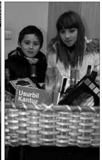
OLATZ ANAIAREKIN ETORRI ZEN SARI BILA.