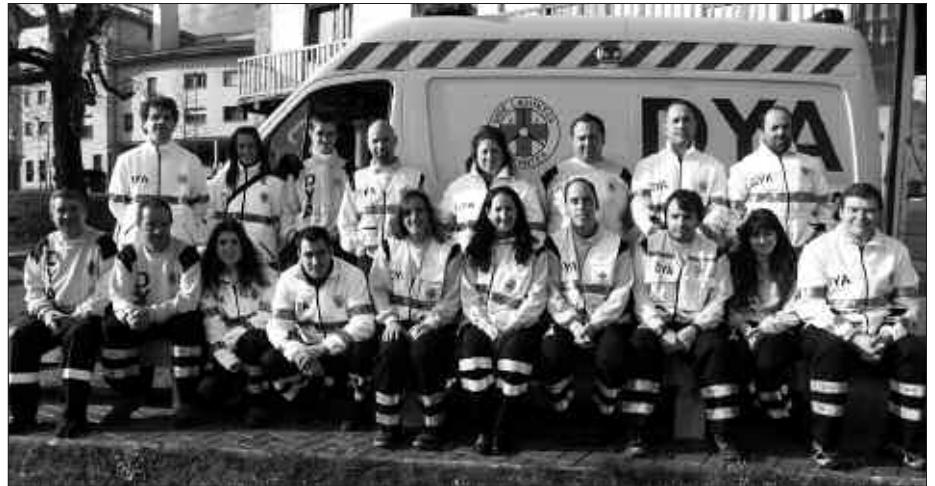
DYAKO BOLUNTARIO TALDE BAT, TARTEAN, HAINBAT USURBILDAR.

J. L. A. Aurrera begira ongizate alorrean lan piloa dago egiteko. Prebentzio lanetan geroz eta gehiago. Gure erronka nagusia, ikastolatik ume guztiak osasun ikastaro batekin ateratzea litzateke. Bestalde, gaur egun nahiko lekua ez dugunez, boluntarioak elkartzeko eta formazioa eskaintzeko zentro berri bat eraikitzeko egitasmoa dago Donostian.