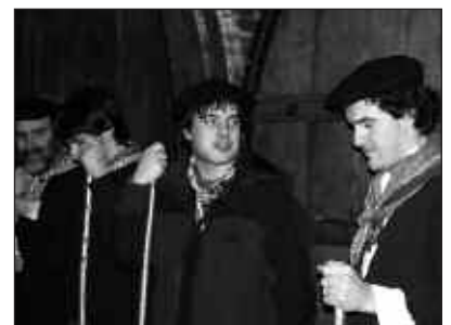
SANTA AGEDARI KANTATZEN, DUELA BI URTE.

Kaxkoan tabernatik tabernarako ibilbidea osatuko dute eta gero sagardotegietara joango dira. Urdairan amaitzea aurreikusten dute. Ekitaldi irekia izango denez, herritarrak parte hartzera deitzen dituzte. Hori bai, baserritar jantziak eta Santa Ageda makilarekin agertzea ezinbestekoa izango da.