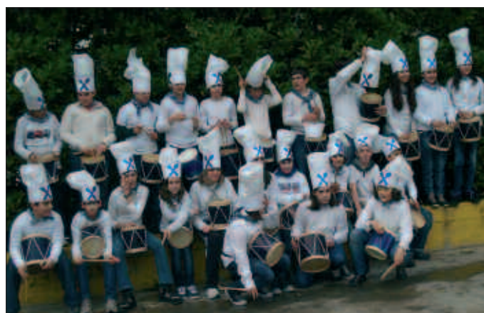
IKASLEAK GOGOTSU PRESTATU ZUTEN DANBOR-SAIDA.