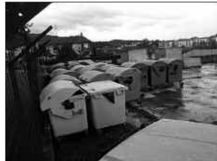
PIKAOLAKO GARBIGUNEAN OLIOA BILTZEKO AUKERA DAGO.

San Marko Mankomunitateko Skamioiak bitan bisitatzen du Usurbil, hilabeteko lehen eta azken asteazkenetan hain zuzen. Besteak beste, erabilitako olio a eraman daiteke bertara. Baina Udaleko Komunikazio Saitetik ohartarazten dutenez, ordutegi aldetik moldatu ezin duenak, badu olio a uzteko bigarren gune bat ere; Pikaola. Bertan, aipatu gaia uzteko egokitutako gune bat erabiltzeko prest dago aspalditik.