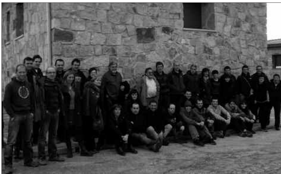
USURBIL ETA ORIOTIK HAINBAT LAGUN ETA SENIDE BERTARATU ZIREN. ARGAZKIA BIDEAN EGINDAKO ATSEDENALDI BATEAN ATERATAKOA DA.