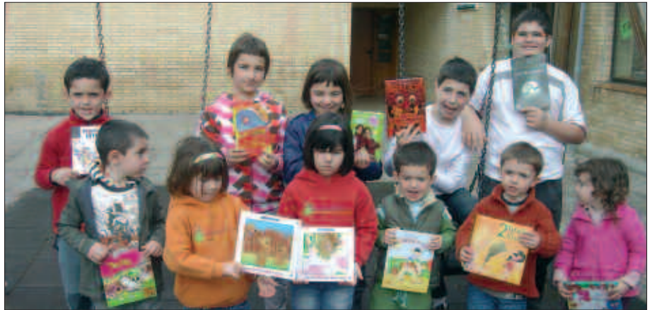
ARGAZKIAN, HERRI ESKOLAKO IKASLEAK.

A. H. E. Hezkuntza proiektua buruzteko garaian landa eremuan kokatua