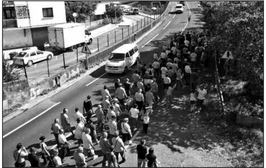
DUELA BI URTE BEZALAXE, INGEMARREKO LANGILEEN ETA ZUZENDARITZAKOEN ARTEAN GORABEHERAK IZAN DIRA ASTE HONETAN.

Langabezia tasaren harira, Usurbilgo Hamaikabat-ek bere web orrialdean aipatu duenez, 2007ko martxoan 167 langabetu zeuden Usurbilen, eta