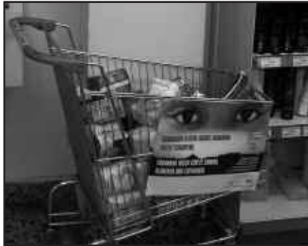
ARROZA, AZUKREA, LEKADUNAK, SARDINAK, ATUNA ETA KONPRESAK BILTZEN ARI DIRA.

Elkartasun hori bideratzeko, honako tokiak baliatu dituzte Usurbilen: