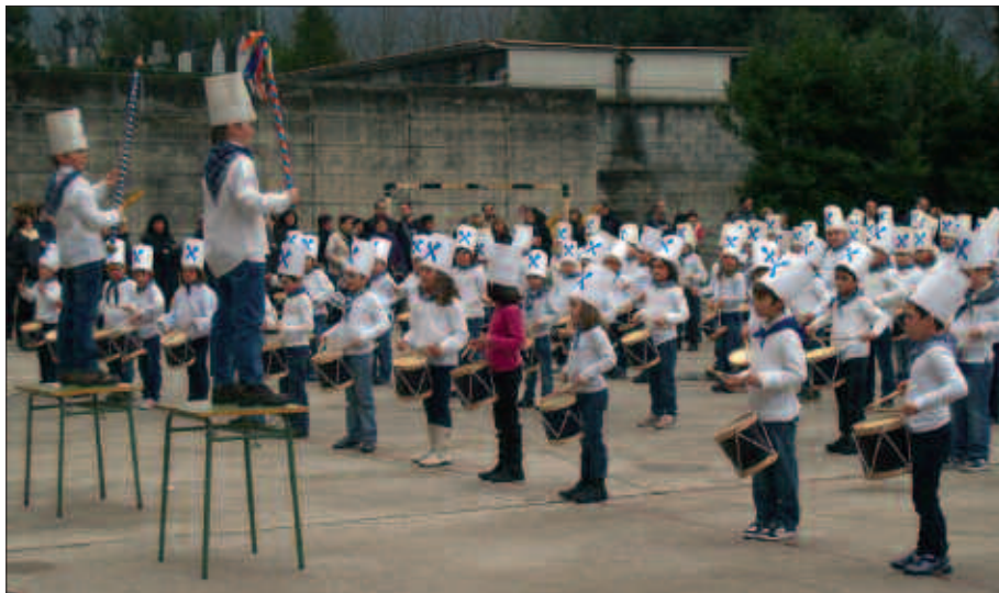
ADI-ADI JARRAITU ZITUZTEN ZUZENDARIEN AGINDUAK.

Udarregiko ikasleek, irakasleak inguruan zituztela, danborrada festari lotuta ezagutzen ditugun abesti ezagunenak jo zituzten urtarrilaren 19an, arratsaldeko laurak inguruan hasi zen ekitaldian. Ordu laurden pasatxo iraun zuten danborrada saioek eta goizean euria egin bazuen ere, arratsalderako atertu egin zuen.