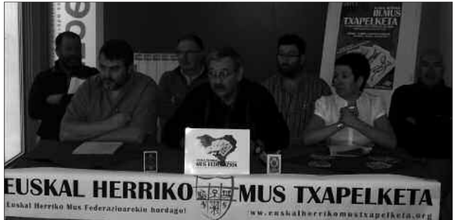
AZARDAN EGIN ZEN MUS TXAPELKETAREN AURKEZPENEA.

Euskal Herriko Mus Federazioaren arautegiaren arabera jokatu da. Eta arauak, eskura izango dira Ardi Beltzen. Webgune batean jarraitu daitezke