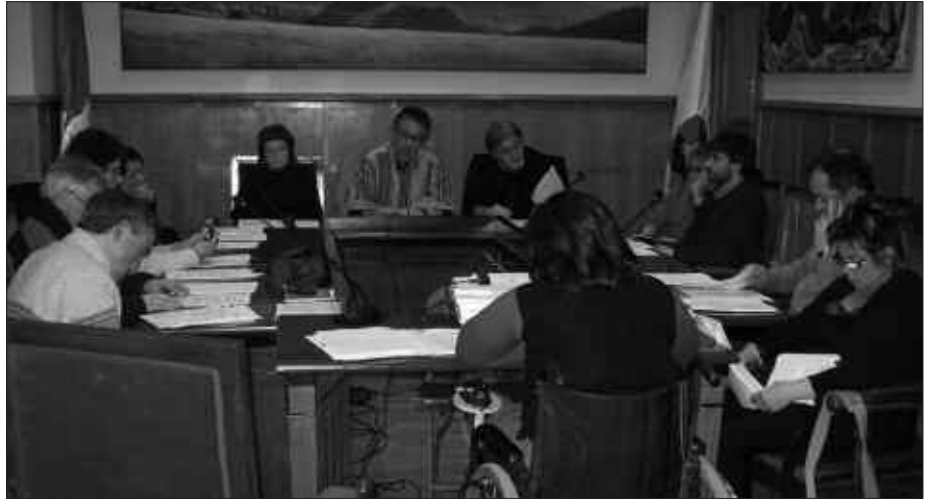
14 MILIOI EURO PASATXOKO AURREKONTUAK HASIERAZ ONARTU DITU UDALBATZAK. 15 EGUNEZ JENDAURREAN EGONGO DIRA.