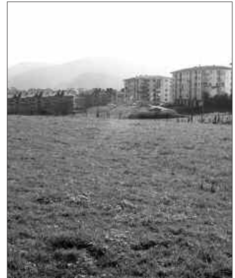
GUZTIRA 223 USURBILDAR, LEHEN ETXEBIZITZA ESKURATZEKO PREMIA.