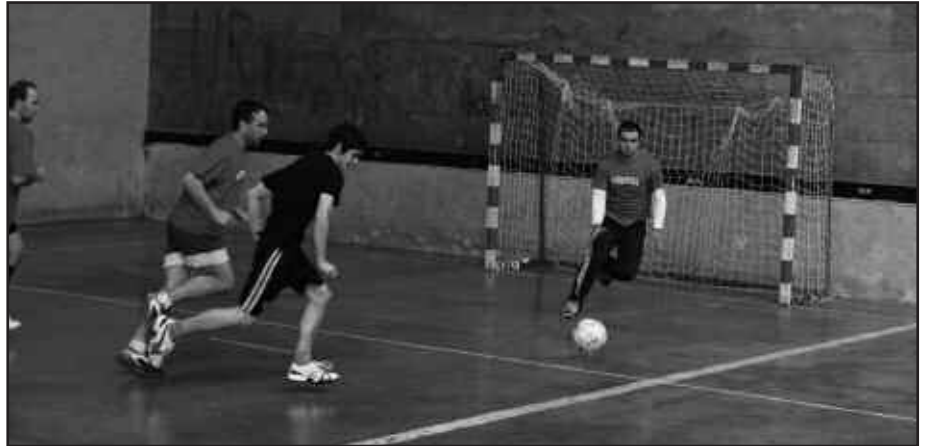
TXAPELKETAKO PARTAIDEK KIROLDEGIAN IZENA EMAN BEHAR DUTE.

A.G. Mutilen taldeak animatu ohi dira, baina neskenak ez. Jokalarien parekidetasuna bultzatzeko puntuazio sistema aldatu dugu. Talde mistoek neurketa irabaztean bi puntu izan ordez, hiru jasoko dituzte. Eta berdintzean, puntu bat izan ordez bi. Gainerako taldeek, irabaztean bi puntu eta berdintzean bat. Hiru taldekideetako batek neska izan beharko