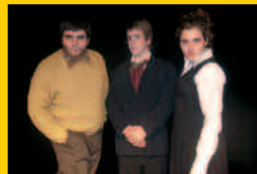
Ostiral honetan, “Teatreruak” Aginagan