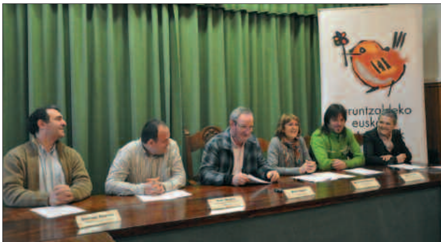
ARGAZKIAN, EGITASMOAREN AURKEZPEN EKITALDIA URNIETAKO UDALEAN.

"Baietz gurean!" egitasmoan parte hartzea erabakitzen duten enpresei