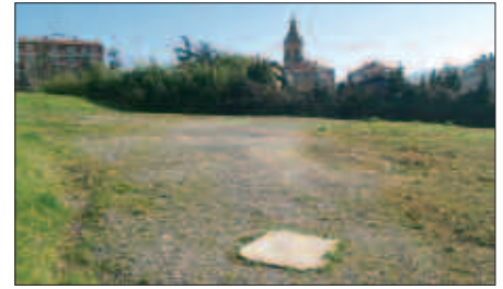
SEKAÑA, LASTER, ETXE BERRIAK EGITEN HASIKO DIRA.