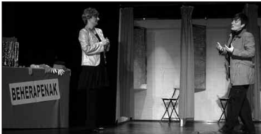
KULTUR ETA KIROL ARLOKO DIRULAGUNTZAK ESKATZEKO EPEA IREKI BERRI DA.

Irizpideen artean berrikuntzak txertatu ditu Udalak. Oinarrietan berri ematen denez, “bereziki baloratuko dira gaitzat euskara eta hondakinen kudeaketa duten ekintzak”. Gaineratzen denez, ez dute dirulaguntzarik jasoko kidea auke-