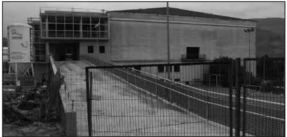
KIROLDEGIKO HANDITZE LANAK AUERRERABIDEAN DIRA; BAI SARRERA ALDEKO FATXADAKO ETA FUTBOL ZELAI PAREKO ARRANPAKO OBRAK.

Kirol patronatutik jakinarazi duteenez, Kiroldegiko erabiltzaileentzat oharra dute. Instalakuntzetan burutzen ari diren lanak tarteko, martxoaren 7tik 11ra igerilekua itxita egongo da. Bestalde, oraindik zehaztu gabe dagoen beste egun batean Kiroldegia bera ixteko asmoa dute, ur beroaren sistema eta galdarak aldatzeko.