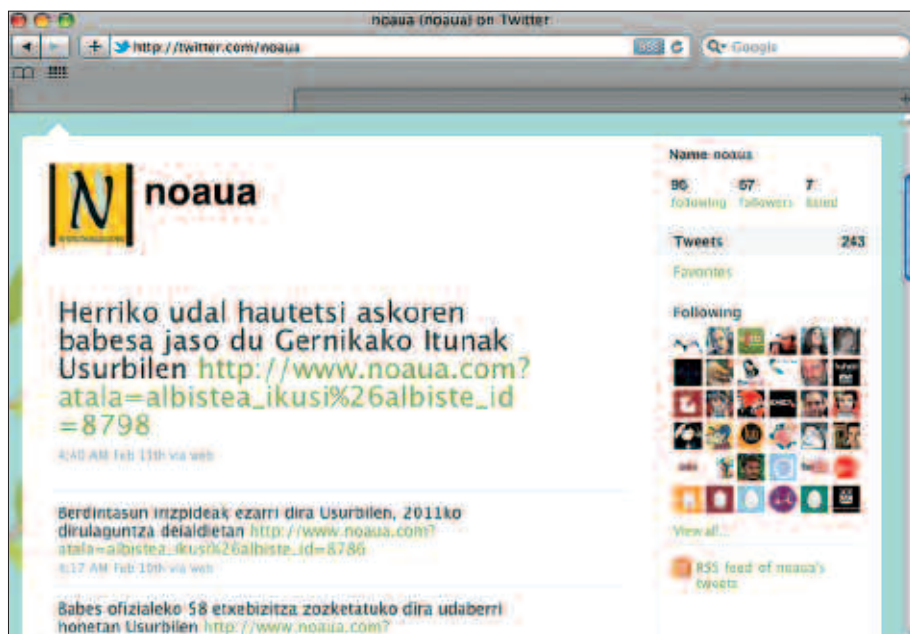
NOAUA!K TWITTER SAREAN DUEN ATARIA.

Sare sozial batzuk erraldoiak dira, eta erabiltzaile kopuru itzela dute; Facebook-ek, esaterako, 600.000.000 erabiltzaile aktibo inguru dauzka. MySpace-k, berriz, 200.000.000 baino