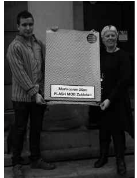
AURKEZPEN EKITALDIKO IRUDIA.

Flash Mob-aren grabazioa dela eta, martxoaren 20rako goiz osoko festa antolatu dute Zubietan. 10:30etatik aurrera, dantza emanaldiak, ogitartekoak, barrikotea eta freskagarriak egongo dira. Baita koreografia ikasteko entsegu saioak ere, tartean, Porrotx eta Marimotots irakasle lanetan arituko dira.