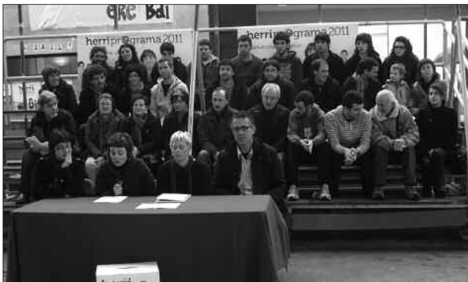
HILAREN 12RAKO HERRI BATZARRA DEITU DUTE, 15:45ETAN ARTZABALEN.

M aiatzaren 22ko udal hauteskundeetara, herri programaren lehen zirriborroa prest du jada Usurbilgo Ezker abertzaleak. Herritarren ekarpenekin osatu nahi dute ordea, "zuen ahotsa gure hitza izateko. Guztion artean Usurbil hobea eraiki asmoz", adierazi zuten larunbat eguerdian frontoian eskaini zuten agerraldian. Horretarako, etxez etxe inkesta bat banatuko dute, usurbileginez.com blogean iritzia emateko aukera izango da eta herriko taldeekin ere bilduko dira. Hauteskundeetara, 2007ko gogo berarekin aurkeztuko direla iragarri dute, "duela lau urte abiatu genuen herri proiektua bururaino eramateko".