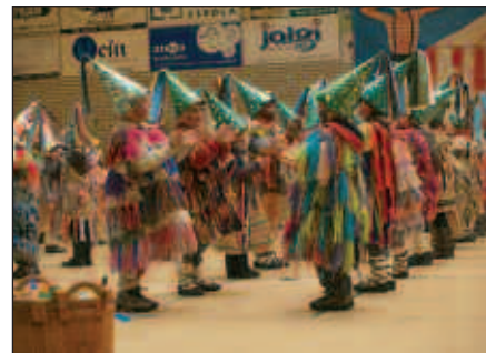
IAZ, KOREOGRAFIA IKUSGARRIAK ESKAINI ZITUZTEN IKASLEEK.

Bestalde, inauterietako ekimen hau gauzatzeko burutzen den ahalegina azpimarratu nahi dute: "Usurbilen