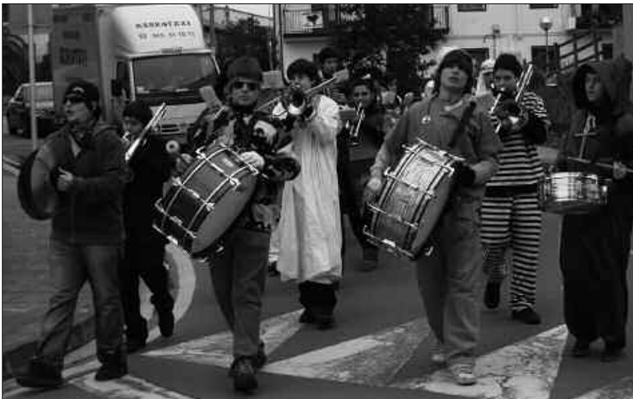
INAUTERI FESTA, IAZ BEZALA, ZUMARTXAN TXARANGAREKIN HASIKO DA.

A stigarragako Sagardoetxeak sagardoa dastatzeko bisitaldi gidatuak antolatzen ari da inguruko zenbait sagardotegietan. Martxoaren 26an 11:00etan Saizarren antolatu dute ekimena. 10 euroren truke sagardo berria dastatu ahal izango da, pintxoekin lagunduta. Izena ematea: 943 550 575 edo info@sagardoetxea.com.