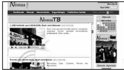
NOAUA!REN FLASH MOB BIDEOK 1.200 BISITATIK GORA IZAN DITU.

Beste kontu batzuen artean, aipatzekoa da Topagunea Euskara Elkartearen Federazioak eta Berria Taldeak elkarlan