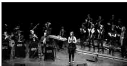
OSTIRALEAN, 20:00ETAN HASIKO DA MAC JEARA'S BANDEN SAIOA.

Landarbasoko kide baten bidez jaso zuten proposamena. Mac Jeara's Band taldekoek, emanaldi berri bat prestatzen hasiak zirela eta kantarien pre-