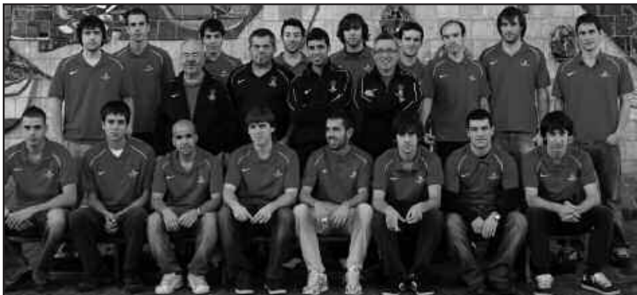
IBAN TXIPIREN ESANETAN, "BORROKA POLITA EGONGO DA BUKAERA ARTE".

I. T. Kanpoan galdu genuen, Soraluzen. 0-2 irabazten hasi ginen, baina zelai txiki eta estua zen. Futboleko gaizki jolastu genuen. Beraiek golak, bi korner eta faltetan sartu zizkiguten. Lastima, baina bestela oso gustura.