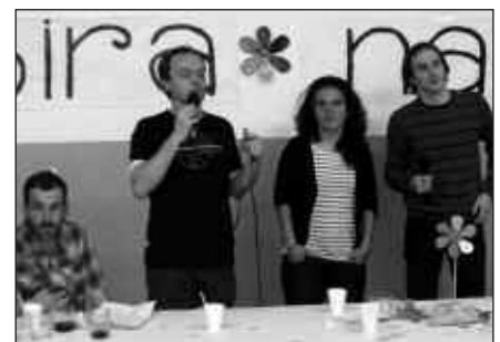
AFARIA BAINO LEHEN, KANTU-JIRAN IBILI ZIREN MAIALEN ETA SUSTRAI.

Ekitaldia borobiltzeko, "Hartu nahi dut arnas" Flash Mob ekimeneko kantuen koreografia dantzatzera animatu zen talde bat. Kantu-jira, bertso-afari zein dantza inprobisatuen bideoak noaua.com web orrian topatuko dituzue.