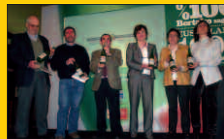
Euskal Sagardoaren aurkezpena Usurbilen egin zen