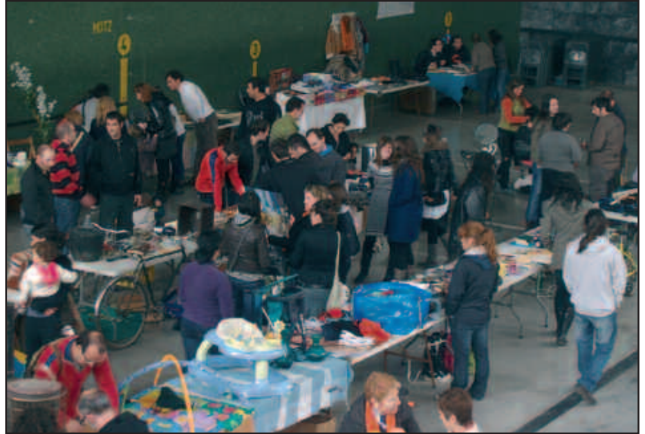
TXOKOALDEN BEHARREAN, AGINAGAKO FRONTOIAN EGIN ZEN TRUKE AZOKA.

“Gauza bakoitzak guk geuk ezartzen diogun balioa du”, hala diote Trukalariak taldekoek. Eta akaso, ez al da urte osoan gogoan izateko moduko hausnarketa?