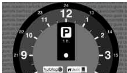
HURBILAGOKO DENDETAN ESKURA DAITEZKE DISKO HAUEK.

K omertzio orduetan bezeroek Kerosketak erosoago egitera eta zamalanetara bideratuko diren 47 aparkaleku egongo dira aurrerantzean kaxkoan. Guztiak, lurzorua kolore urdinez margotuak dauden guneeetan kokatuko dira eta errotatorioak izango dira. Bertan, autoa gehienez ordubetez aparkatu ahal izango da.