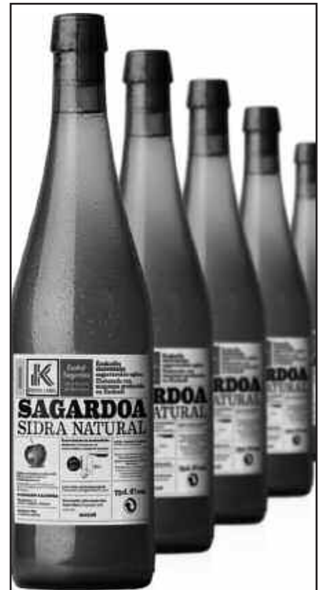
EUSKO LABEL ETIKETA AGERTUKO DA BOTILETAN.

Interesa agertu dutenak: Calonge, Etxebarria, Larrate, Urkiola, Itsas-Buru, Iturrieta eta Sebastianeko.