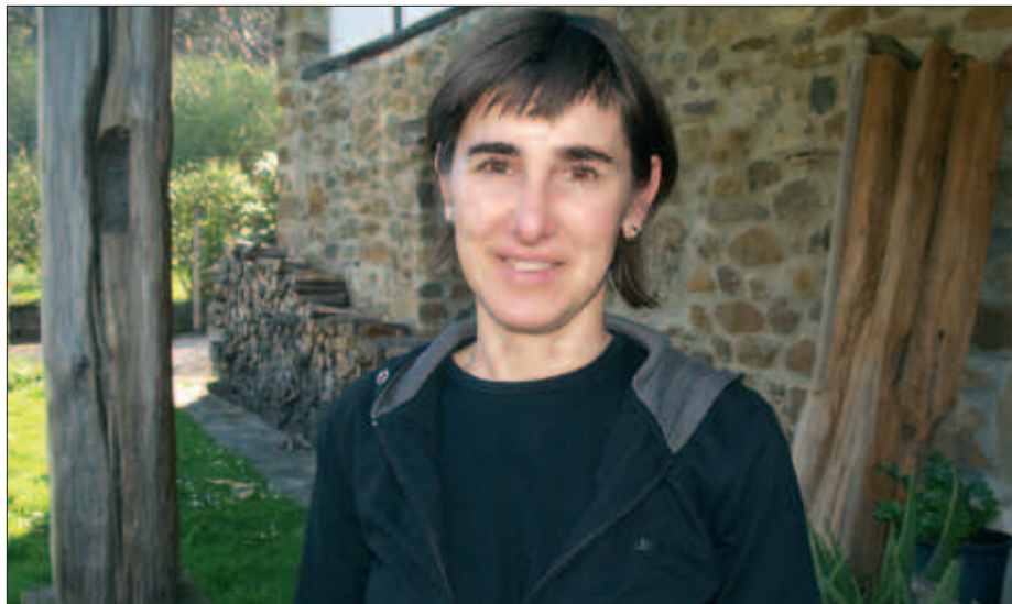
AGINAGAKO MENDI LASTERKETAN BITAN IZAN DA. AURTEN EZ DA ATERAKO.

A. E. Andatza mendi polita da herri lasterketa bat egiteko. Beti iruditu zait,