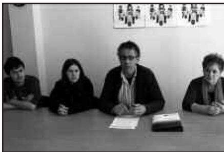
DONOSTIAN PRENTSAURREKOA ESKAINI ZUTEN AURREKO ASTEAN.

Hori guztia, Usurbilgo Ituneko ordezkariak berresten dutenez, alternatibak badirenean. Gogorazten dutenez, atez ateko bilketarekin ez da erraustegiaren beharrik eta gaineratzen dutenez, “hondakinak atez ate bilduta, ia 500 lanpostu berri sor daitezke Gipuzkoan”.