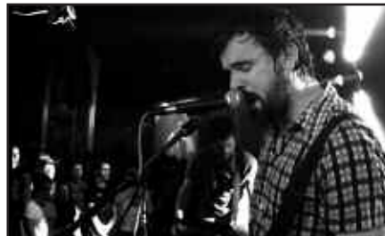
BOST SARRERA INDIBIDUAL LORTZEKO AUKERA APARTA DUZUE.

Erantzuna erredakzioa@noaua.com helbidera bidali edo NOAUA!ko bulegora ekarri, apirilaren 7a baino lehen.