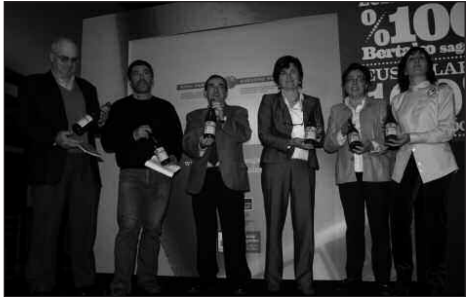
AURTEN, 860.000 LITRO PLAZARATUKO DITUZTE EUSKO LABEL ZIGILUAREKIN.

Aurkezpen ekitaldian aipatu zuten, ingurunearen zainketa, baserriak egindako lanaren onarpena, kali-