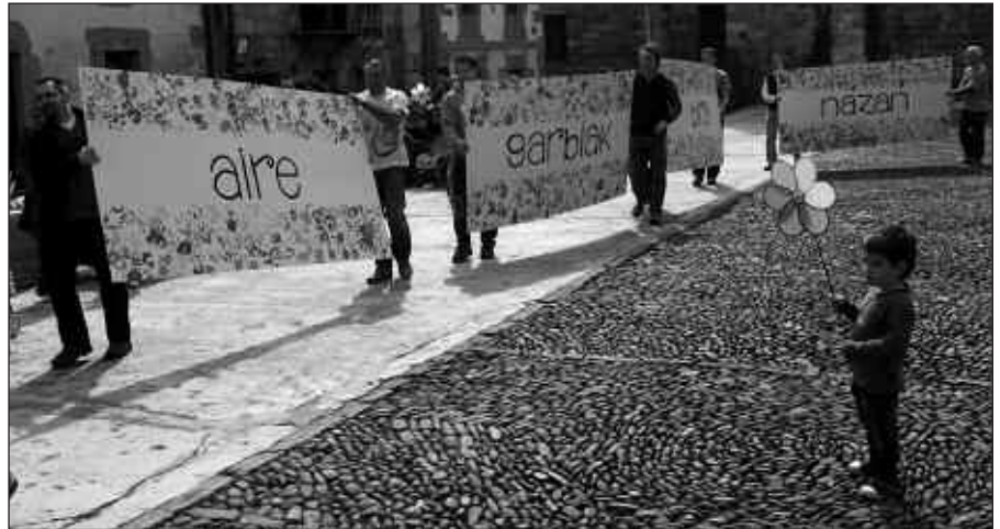
LARUNBATEAN ZINTZILIKATU ZITUZTEN MURAL HAUEK N-634 ERREPIDE ONDOAN.

Ondoren, margotutako pankartekin kalejira burutu zen Kaxkotik Atxegalderaino. N-634 ondoko horman zintzilikatu zituzten, Usurbil Zero Zabor bilguneko kideek.