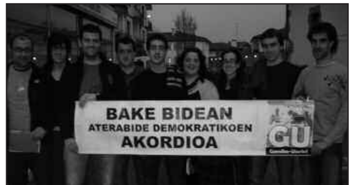
BERTSO ESKOLAKO IKASLEAK, ATXIKIMENDUA EMATEN.