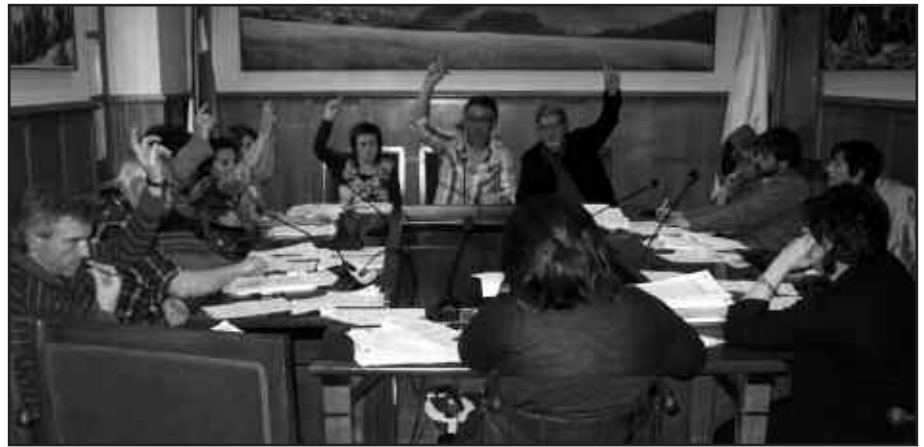
UDAL KORPORAZIOA, PASA DEN ASTEAN EGINDAKO PLENOAN.

Bestalde, Udarregi ikastolatik behera Kaxko aldera datorren ibilbideak Gernika izena duenez, GU bilgunekoek Picassoren Gernika zeramika lan batean birsortu eta izen bereko kalean kokatzeko asmoa dute. Udalbatzak horretarako