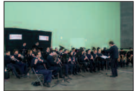
OPERAZ GOZATU, ORGANOA EZAGUTU, IKASLEEN SAIOAK ENTZUN... JOKO ASKO EMAN DU AURTENGO SOINURBIL MUSIKA ASTEAK.