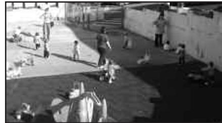
KALEZARREN DAGO HAUR ESKOLA.

V. M. 7:30-17:00 artean dago aurten irekia, krisiaren eraginez edo egun osorako eskaria gutxitzen joan baita. Hurrengo ikasturtean zer ordura arte irekia egongo den ez dakigu, eskariaren arabera izango da. Bestalde, oso malguak gara. Txikiak 10:00ak arte dute sartzeko aukera, eguerdian atera edo arratsaldera arte egon eta bertan askaltzeko aukera dute. Bularra emateko amei Haur Eskolara etortzeko aukera ematen zaie. Janari ekologikoa dugu, bertan dago sukaldaria. Aukera asko ditugu. Gure irizpide eta metodologia daude bestalde. Psikomotrizitate gelak, garrantzia handia duena adin hauetan. Mugimendu librean sinesten dugu eta haurren erritmoa erres-