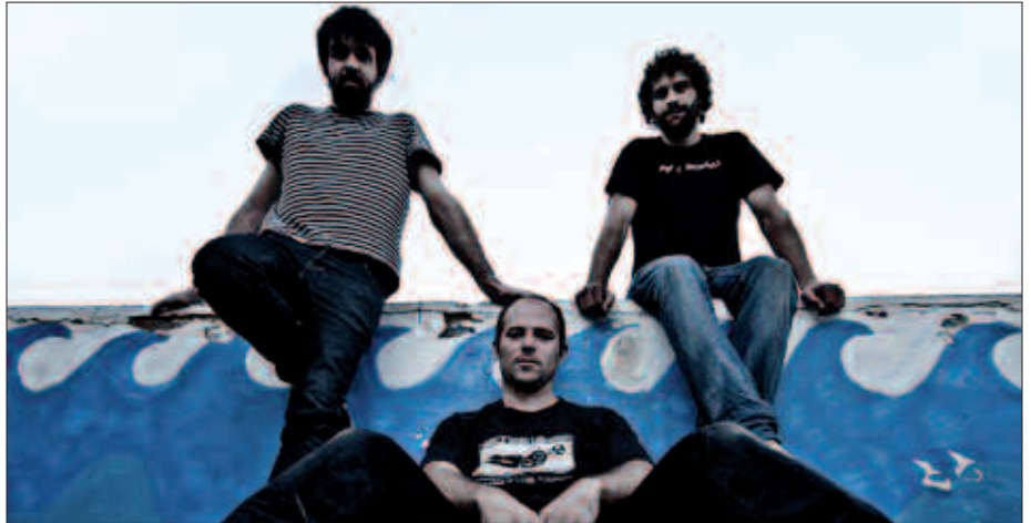
SARRERAK ALDEZ AURRETIK KIROLDEGIAN ESKURA DAITEZKE. DESEGIN ETA ODDOLAREN MINTZOA ERE ARITUKO DIRA LARUNBATEAN.

N. Japonen ere aritu zarete aurretik jotzen. Pentsatzen dut han egon eta gero,