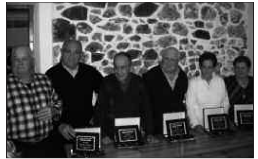
AIALDE BERRIN EGIN ZEN EKITALDIA. IRUDIAN DIRA OMENDUAK.