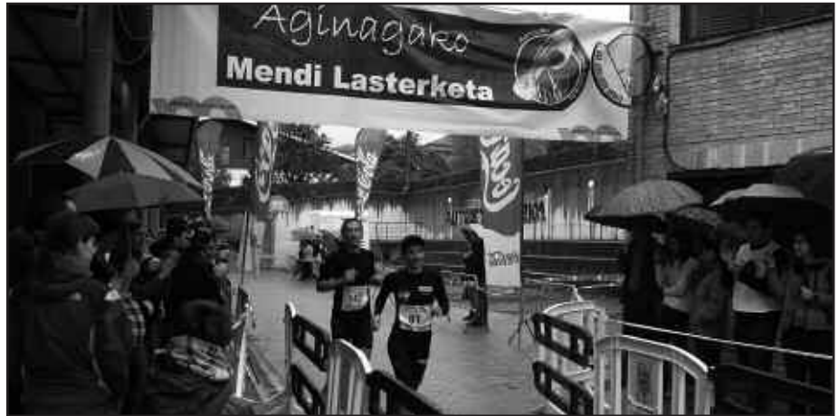
IRITSI ETA BEREHALA, HAMAIKETAKO EDERRA ZUTEN ZAIN FRONTOIAN.