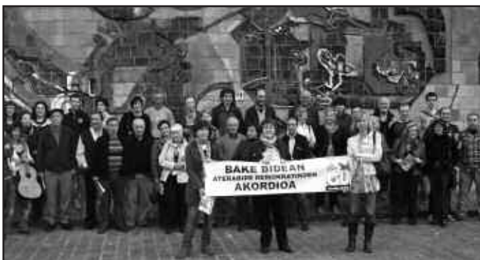
KANTU TALDEKOEK, AKORDIOAREN ALDEKO ARGAZKIAN.