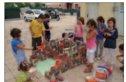
3-11 URTE BITARTEKO HAURREI ZUZENDUTA DAUDE TXOKOAK.

Izen emateko epea astebete barru itxiko dute antolatzaileek, maiatzaren 27an. Informazio gehiago: 636 719 301 (Josune) edo 618 700 479 (Izaskun).