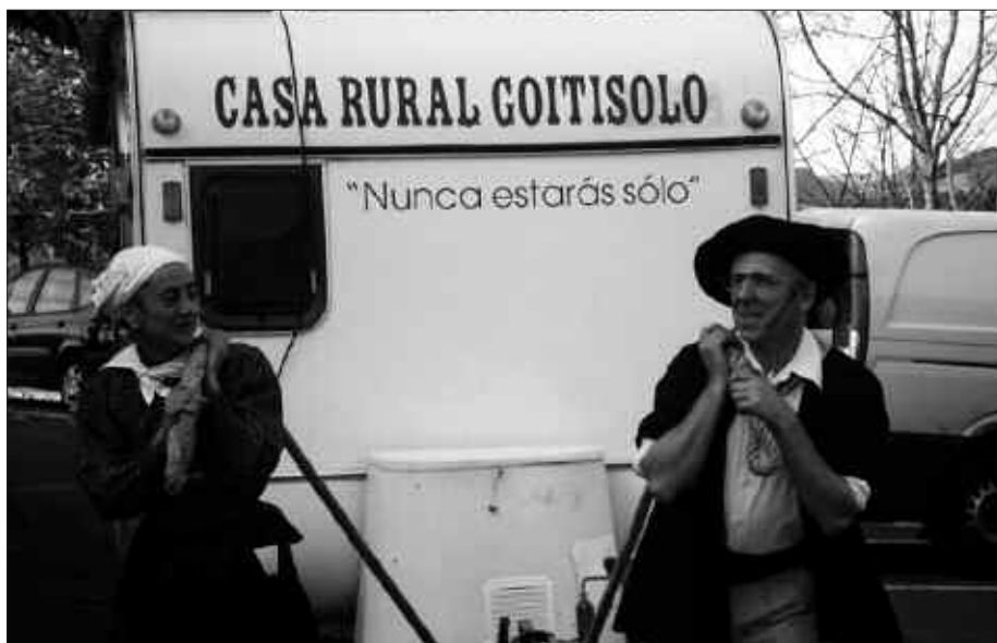
TRAPU ZAHARRA TALDEKO KIDEEK, "KANPING RENOVE" SAIDA ESKAINIKO DUTE 19:30AK ALDERA.

13:00 OIHULARI KLOWN taldea "Otiacicoach" antzezlanarekin Mikel Laboa plazan.