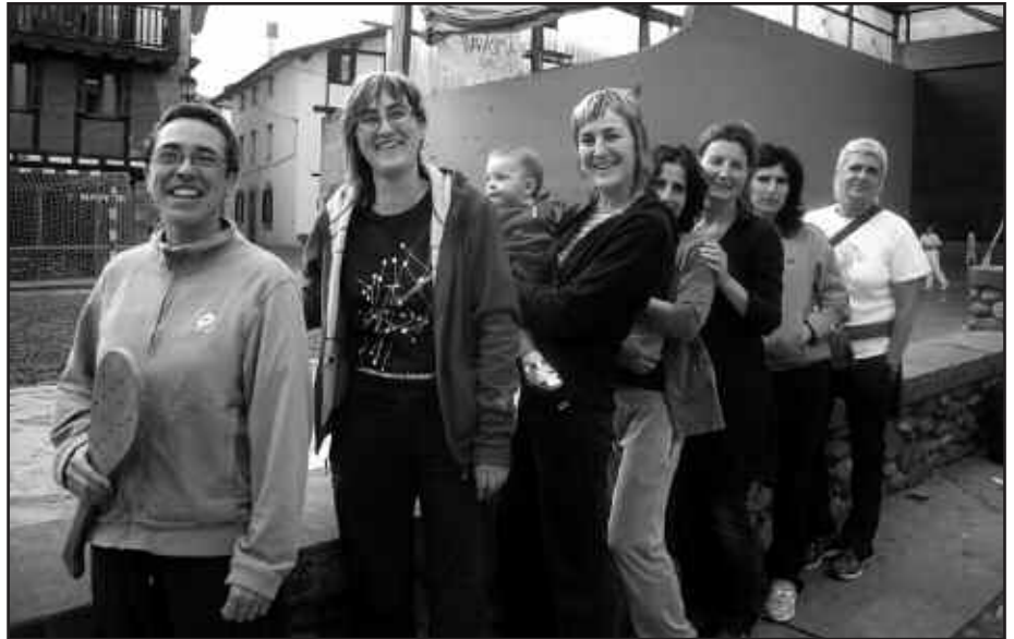
IAZ ERAKUSTALDI IZAN ZENA, AURTEN TXAPELKETA MODUAN JOKATUKO DA.

Elkarren arteko pala partidak jokatuko dituzte datozen asteotan frontoian, astearte arratsaldetan 19:00etatik aurrera eta ostegun arratsaldetan, 19:30etan hasita. Txapelketa maiatza bukaeran hasita aurreikusten da eta ekaina bukaeran jokatuko dituzte azken neurketak. Gizonezkoen pala txapelketa ere ospatuko da aurten. Emakumezko zein gizonezkoen neurketen finalak egun berean jokatuko dira, datorren hilabete amaieran.