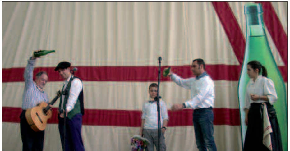
ERESERKIA KANTATU ONDOREN EGIN ZEN IREKIERA EKITALDIA.

Aurtengo Sagardo Egunaren ezaugarrietako bat izan da. Bertako sagarrarekin egindako sagardoa delako. Label sagardoa, gainera, Eusko Labelen kalitate irizpideetan oinarritzen delako.