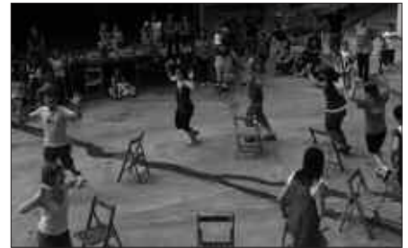
JAI BATZORDEKO LOKALEAN IZANGO DA BILERA, 11:30EAN.

Datozen jaiok antolatzeko lanei ekin diete jadanik. Hurrengo bilera hitzordua, larunbat honetarako, maiatzaren 21erako finkatu dute,