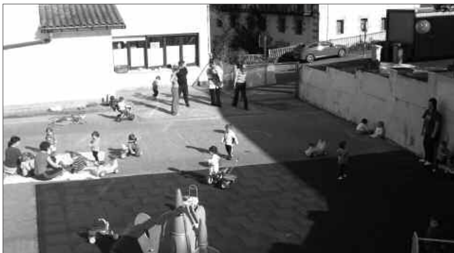
2 URTEKO HAUR GUTXIAGO MATRIKULATU DIRA AURTEN.

Zergatia Haur Eskolakoeak argitzen dute, esanez, “2 urteko haur gutxiago matrikulatu direla joan den ikasturtean baino, eta 2 urteko 4 gela izan beharrean 3 gelek nahiko dugunez, beste gela libre ez uztea iruditzen zaigu logikoena eta orduan 0-1 adin tarterako utzi dugu; horrela, 0-1ean 3 gela egon beharrean, 4 egongo dira eta horrela 0-1eko haur guztiak sartzen dira. 1-2ko gelan matrikulatutako guztiak ere sartu dira”.