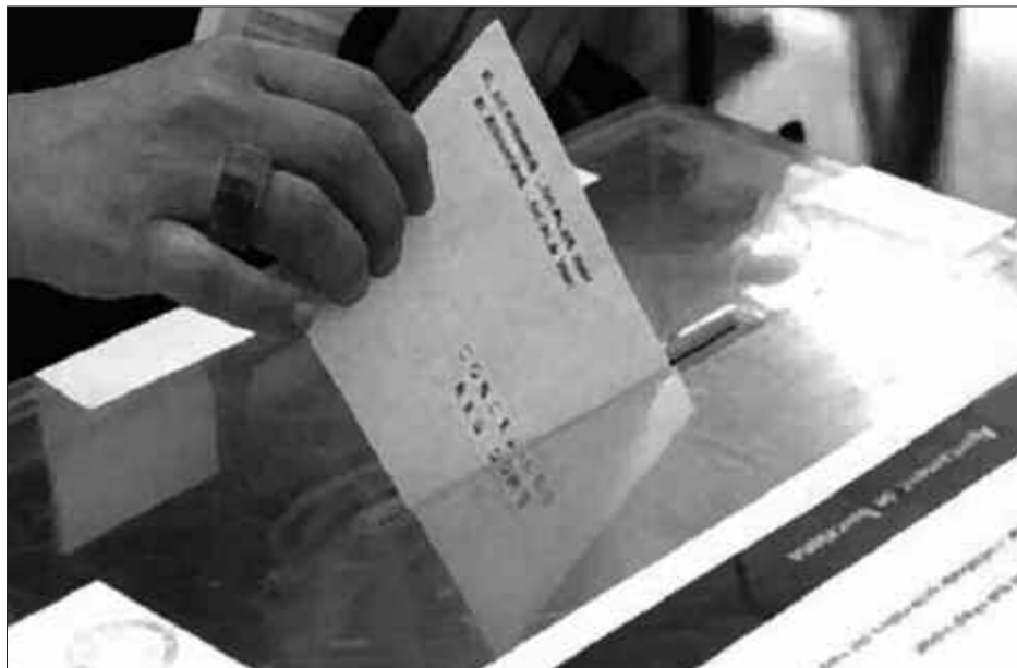
EMAITZAK NOAUA.COM WEB ORRIAN IPINIKO DITUGU IGANDEAN BERTAN.

Gipuzkoako Batzar Nagusietara aurkeztu diren zerrenda guztiak ere orriotan aurkituko dituzue.