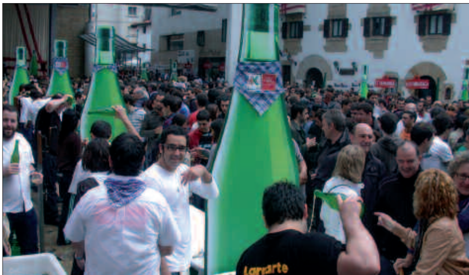
FRONTOI INGURUA BESTE BATZUETAN BAINO LASAIAGO EGON DA AURTENGOAN.

badituzu, bidali argazkiak JPG formatuan erredakzioa@noaua.com helbidera, eta orain Argazkitegi horretan ikusgai dauden argazkiekin batera ipiniko ditugu.