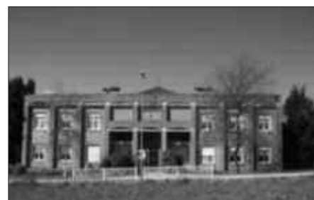
2,5 MILIOI EUROKO AURREKONTUA DU PROIEKTUAK.

Udarregi ikastolako eraikin berria zabaldu eta Haur Eskola bertara leku aldatzean, Kalezarko eraikina hutsik geratuko da. Udaletik iragarri dutenez,