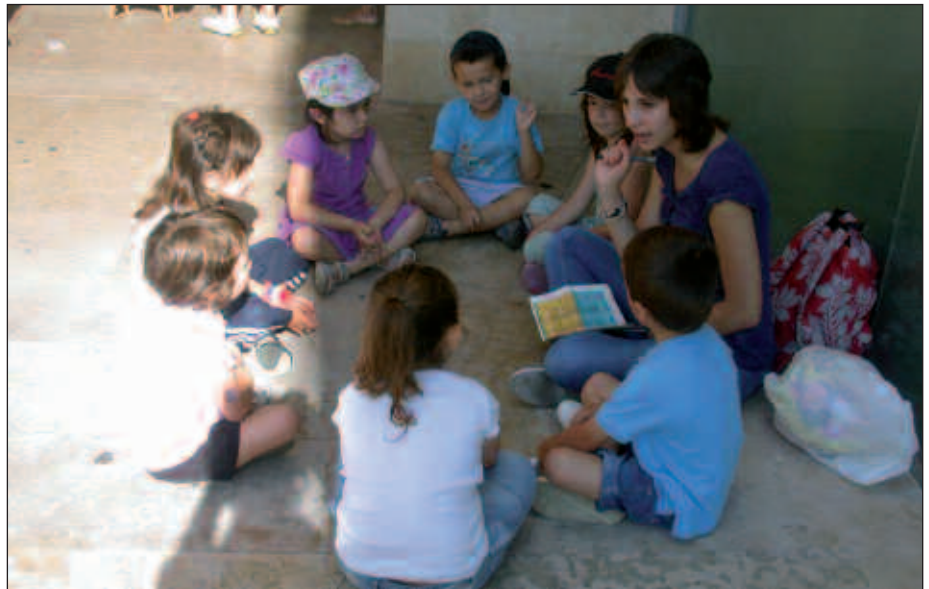
AURTEN, 135 IZANGO DIRA ESKAINIKO DIREN PLAZAK.

Plaza lortu dutenek, maiatzaren 30era arteko epea izango dute ordainketa kontu korrante zenbaki honetan egin eta ordainagiria NOAUA!ra ekar-