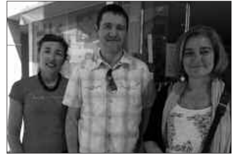
HURBILAGOKO KIDEAK POZIK DIRA EKIMENAK IZAN DUEN HARRERAREKIN.

Errotazio bidezko aparkalekuen egitasmoa Hurbilagok herri merkataritza biziberritzeko, bezeroei zerbitzu hobe edota gertuagokoa emateko egindako ahalegi-