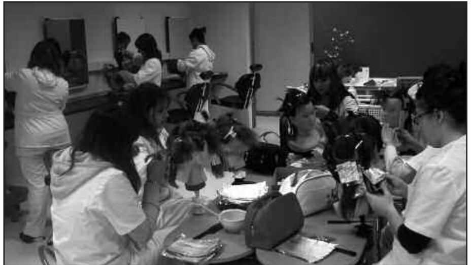
ILE-APAINKETA TALDEKO IKASLEAK, IAZKO IKASTURTEAN.

Hezkuntza eskaintza hauetan matrikulatzeko honako baldintzak bete behar dira: 15-18 urte artean izatea, DBH-ko graduatua lortu ez izana, edota lanbide bat ikasi nahi izatea. Bi ikasturtez osaturiko programak dira: lehenengoa, 1.050 ikasketa orduz osatua dago. Bigarren ikasturtean, 1.050 ordu bideratu ohi dira