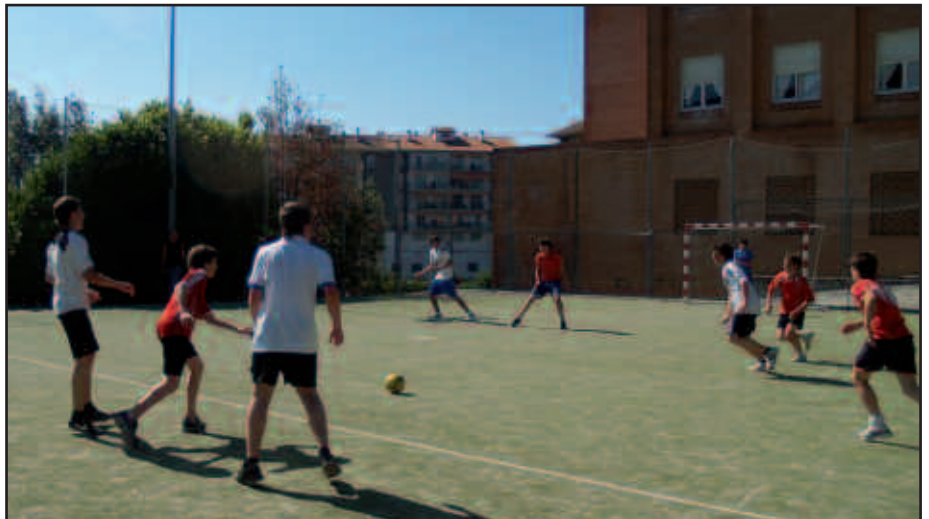
FINALAK EKAINAREN 25EAN JOKATUKO DIRA.

Aipatu moduan, asteburu honetan bertan jokatuko dira txapelketako