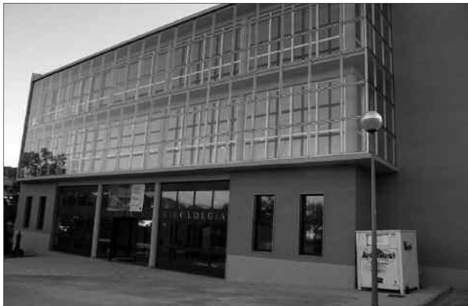
ITXURAN EZ EZIK, ZERBITZUETAN ERE HOBERA EGIN DU OIARDO KIROLDEGIAK.