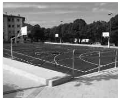
GOIZEAN ZEHAR HAINBAT EKITALDI IZANGO DIRA.

S antueneak frontoi berri bezain ikusgarria du jada, baita futboleko edo saskibaloian jokatzeko pista eraberritua, bi jolas parkeez inguratua. Eraberritze hauetaz gozaten hasteko aukera dute jada Santueneko bizilagunek. Lanak amaitzearen ondoren, Ibai-Ondo eta auzotar elkarteok larunbat honetarako, maiatzaren 21erako goizean zehar zenbait kirol ekimen antolatu dituzte auzoan.