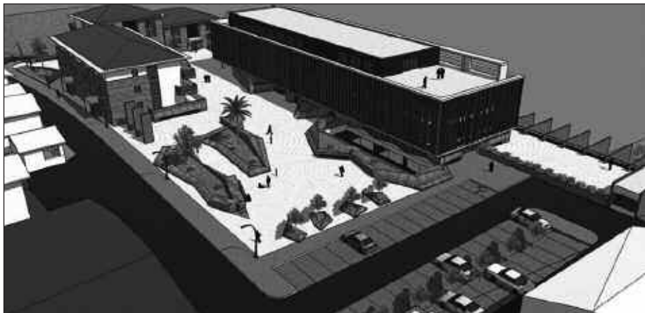
AURKEZTUTAKO PROIEKTUAN, ITXURA HAU ZUEN GERONTOLOGIKO BERRIAK.

N egu amaieran hasi ziren orain arte Kalezarko mojen komentua izan zena behe- ra botatzen, gerora bertan eraikiko baita 148 lagunentzat tokia izango duen gerontologikoa. Usurbilgo Udalak, Matia Fundazioak eta Gipuzkoako Foru Aldundiak obrak hasteko adosturiko akordioari esker lanak abian dira eta Udalak eraikin berria noizko amaitua egongo den ere aurreikusia du jada, "2012ko negurako edo 2013ko udaberrirako amaituta egongo da". Amaituta bakarrik ez, aipatu data horretarako zerbitzua abian jartzea ere espero baita. Aspalditik eskatzen ari den azpiegitu-