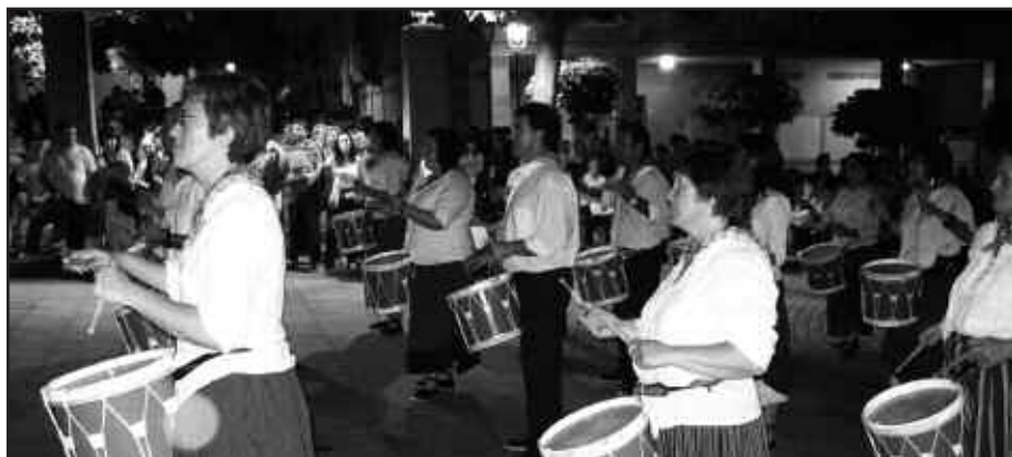
OSTIRALEAN 20:30EAN, AGERIALDERA HURBILDU BEHARKO DUTE.

S antixabeletan ospatuko den helduen danborradan parte hartu nahi dutenek, ostiral honetan, maiatzaren 20an dute izena emateko eguna, 20:30ean Agerialden. Hitzordu berean burutuko da gainera, lehen entsegu saioa eta baita datozenak ere. Ordu bete lehenago burutuko da joan den maiatzaren 7an haurren danborradan izena eman zutenen lehen entsegu saioa. 19:30etan Agerialden eta aurrerantzean ostiralero ordu eta leku berean.