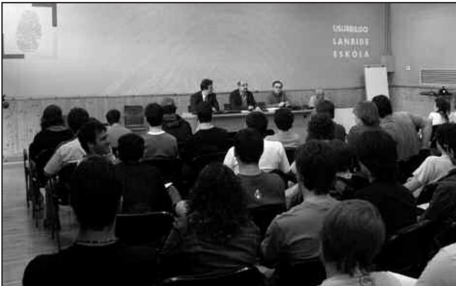
INFORMAZIO GEHIAGO JASO DAITEKE WWW.LHUSURBIL.COM HELBIDEAN.