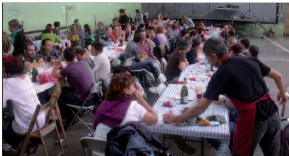
BAZKARIA FRONTOIAN IZANGO DA.

18:30 Udarregi ikastolako HH5 eta LH5 mailetako ikasleen kantaldia Sutegiko auditorioan, senideei zuzendua. Oharra: sarrera mugatua, lekua-erengatik.