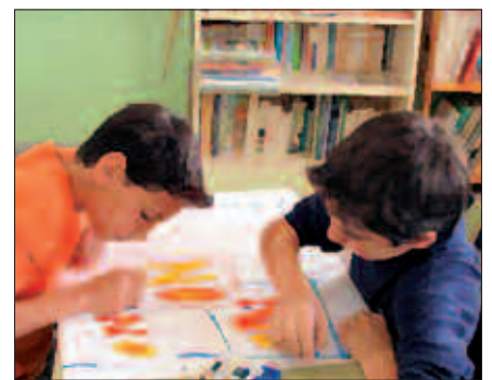
BILERA DUELA ASTEBETE EGIN ZEN SUTEGIN.

Guraso talde honek 100 sinadura bildu ditu eta duela gutxi bilera bat egin zuten Sutegin. Bilera honetan, hainbat guraso, Hezkuntza Saileko ordezkaria eta amaitzear den legealdiko udal ordezkariak ere izan zen. Eskola publikoaren beharra zein neurritarainokoa den jakin asmoz, inkesta bat jarri dute martxan. Galdetegi moduko bat erantzun behar dute gurasoek, funtsean, balizko eskola publikoaren ezarpenaren alde dauden ala ez jakiteko.