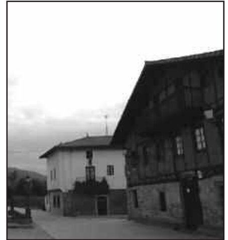
ZUBIETAKO ORDEZKARIAK ERE HAUTATU ZITUZTEN MAIATZAREN 22AN.