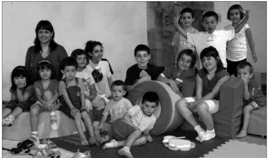
TXOKOAK UZTAILAREN 1EAN HASI ETA 29RA BITARTE LUZATUKO DIRA.

Prezioetan ere bada alderik: bazkide direnek udako txokoetan hilabete erdiz parte hartzeagatik 30 euro ordaindu beharko dute, eta hilabete osoan egoteagatik 55 euro. Bazkide ez direnek, 60 euro eta 100 euro hurrenez hurren. Guraso elkartetik berri eman dutenez, "ordainketa egiteko erreziboa uztailako lehen astean emanango zaizue. Apuntatutakoek ekarri mesedez hauraren Osakidetzako txartelaren kopia lehen egunean". Informazio gehiago telefono zenbaki