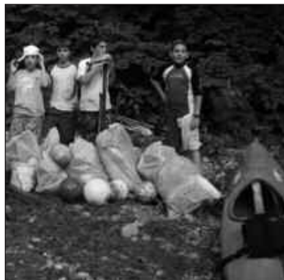
EKAINAREN 11N ELKARTUKO DIRA, 10:00ETAN ALIRIKO ZUBIAN.

A urreko urteen ildotik, ekainaren 11n Oria ibaia hondakinez garbitzeko ekimena antolatu du Puntapax Kanoe Kirol Elkarteak. Goizeko 10:00etan finkatu dute hitzordua, Zubietako Aliriko zubian. Antolakuntzatik berri eman dutenez, Oria ibaian zehar bizpahiru orduz piragutan bilketa lanak burutzea litzateke asmoa. Ez da ekimen hau burutzen duten lehen aldia eta diotenez, denetarik aurkitu izan dute, plastikozko hondakinak bereziki. Informazio gehiago telefonoz zenbaki honetan: 660 395 094.