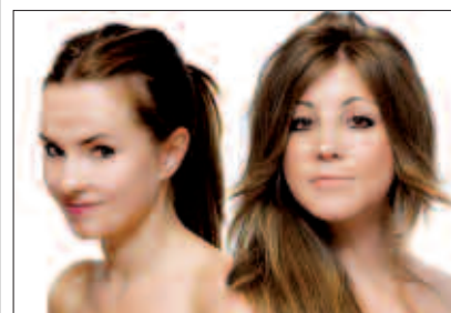
LARUNBAT HONETAN, 22:00ETAN SUTEGIN.

Larunbat honetan, 22:00etan Sutegin. Sarrera: doan.