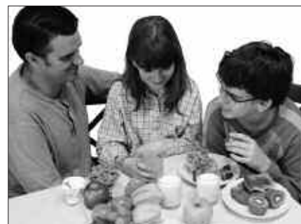
HITZALDIAK ARTZABALEN IZANGO DIRA.