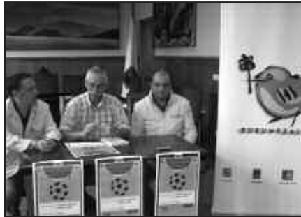
USURBILGO UDALETXEAN EGIN ZEN AURKEZPENA.

Udalerrri bakoitzeko ordezkari banak parte hartuko du lehian; hau da, Andoain, Lasarte-Oria, Urnieta eta Usurbilgo ordezkariak. Guztira beraz, lau lehiakide izango dira, kasuan kasuko herri mailan antolatutako areto futbol txapelketa irabazi dutenak.