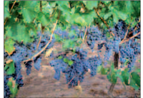
EGUERDIKO 12:00ETAN, OIARDE KIROLDEGIAN.

Ez ezazu honelakorik esan!! Zu, lurrez eginda zaude eta lurrari eta simaurrari esker gu osasuntsuak, ede-