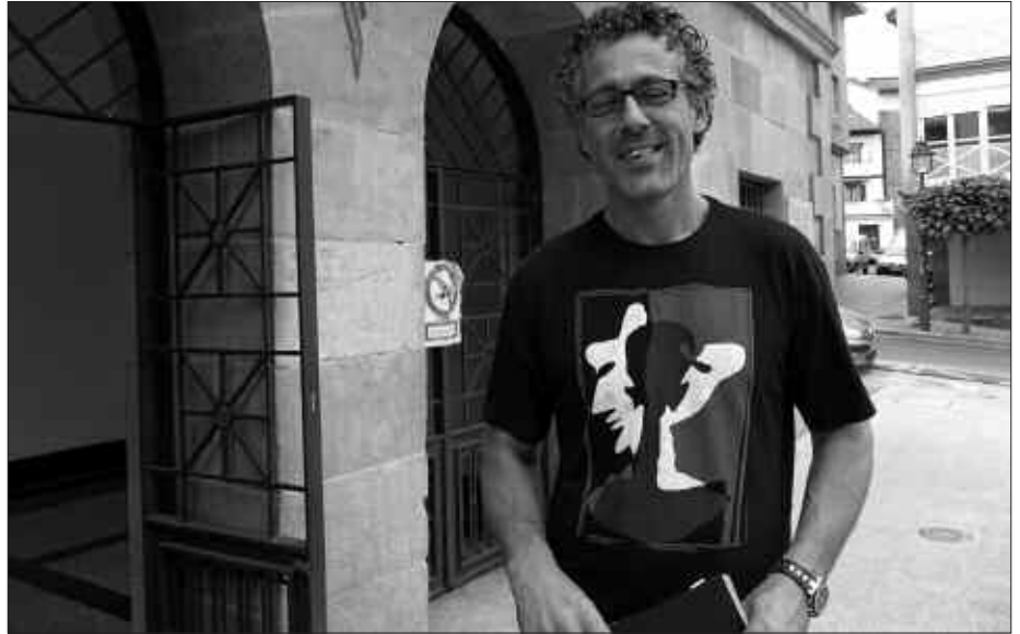
LASTER UTZIKO DITU UDALETXEKO LANAK.

X. M. E. Udaleko alderdi guztiok elkarlanean lan egin dezakegu, beti ere borondatea egonez gero. Zorionak hala ulertu dutelako alderdi gehienek. Zorionak PSE-EE-ko Amayari jarrera irekia erakustegatik, baita Aralarreko kideei eta EAJ-PNV-