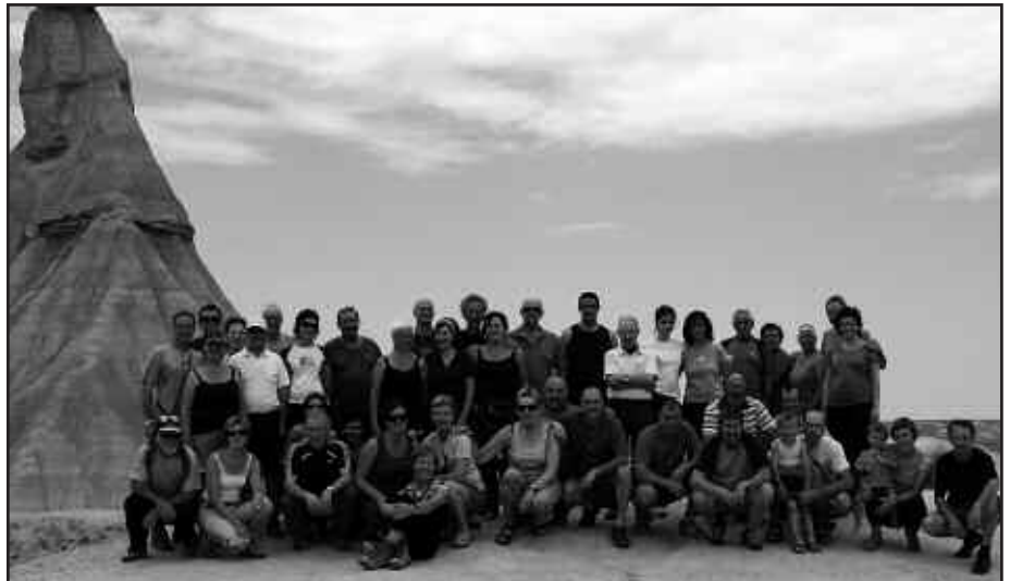
ASKORENTZAT, LEHEN ALDIA IZAN ZEN BARDEETAN.

Argazkian, Bardeetara joan ziren 41 mendizaleak.