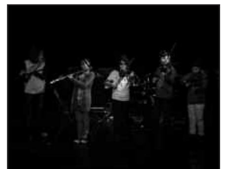
MUSIKA INSTRUMENTU UGARI IKASTEKO AUKERA DAGO.