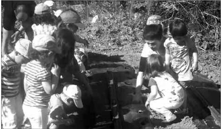
IRAKASLEAK ETA IKASLEAK, ESKOLA ONDOKO BARATZEAN.

eta haziak botatzen hasi ginen denok txandaka. Aurrena letxuga haziak bota, ondoren kalabazina eta azkenik azenario-arena. Esan zigutenez, haziak ez dira pilan bota behar, sakabanatuak baizik, baina zein zaila den hazi txikiak, gure eskutxoetatik pilatuta irteten diren horiek, zabalean botatzea. Ondoren arrastoak tapatu eta jarraian dena ureztatu genuen, hori bai polita!