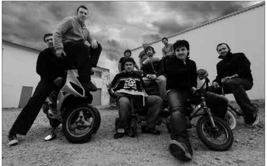
ESNE BELTZA TALDEKOAK, ASPALDIKO ARGAZKI BATEAN.

Gaineratzen dutenez, azken bi urteotan "100 gazte izan dira atxilotuak, 90 espetxeratuak eta hauetatik 64k gutxienez tortura edo tratu txarrak salatu dituzte epailearen aurrean".