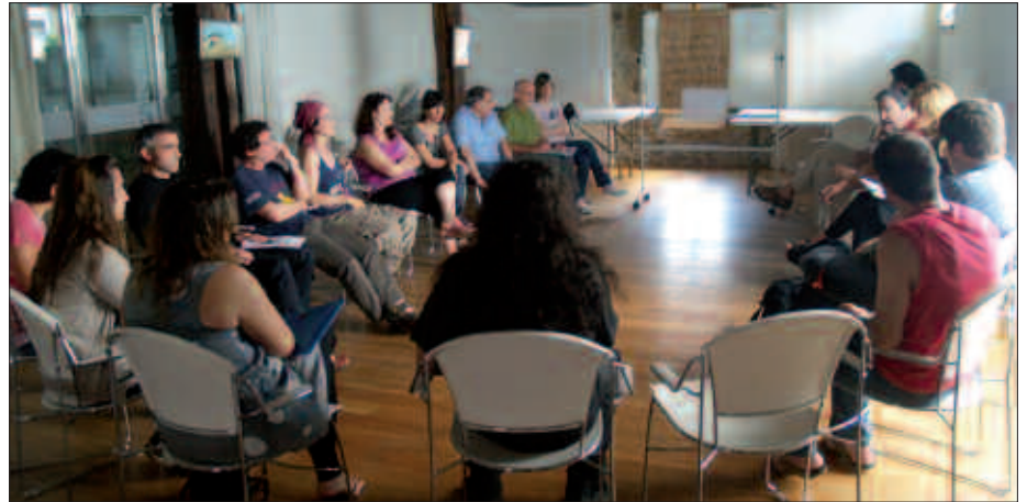
PARTE HARTZE PROZESUKO BILERAK ARTZABALEN EGIN DIRA AZKEN HILABETEOTAN.

Azken hilabeteotan burutu den lanketa ekainaren 8an burutuko den ekitaldian borobilduko da; datorren asteazkenean hain zuzen, Usurbilgo Kulturgintzako Plan Estrategikoa aurkeztuko baita Artzabalen, arratsaldeko 18:00etatik aurrera. Bilera irekia izango da, hau da, herriko kultur arloko eragileez gain, herritarrak hitzordura gonbidatuak daude.