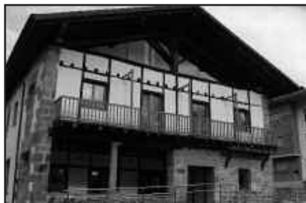
ARTZABALGO PINTURA IKASTAROKO LANAK IKUSGAI JARRIKO DITUZTE SUTEGIN.