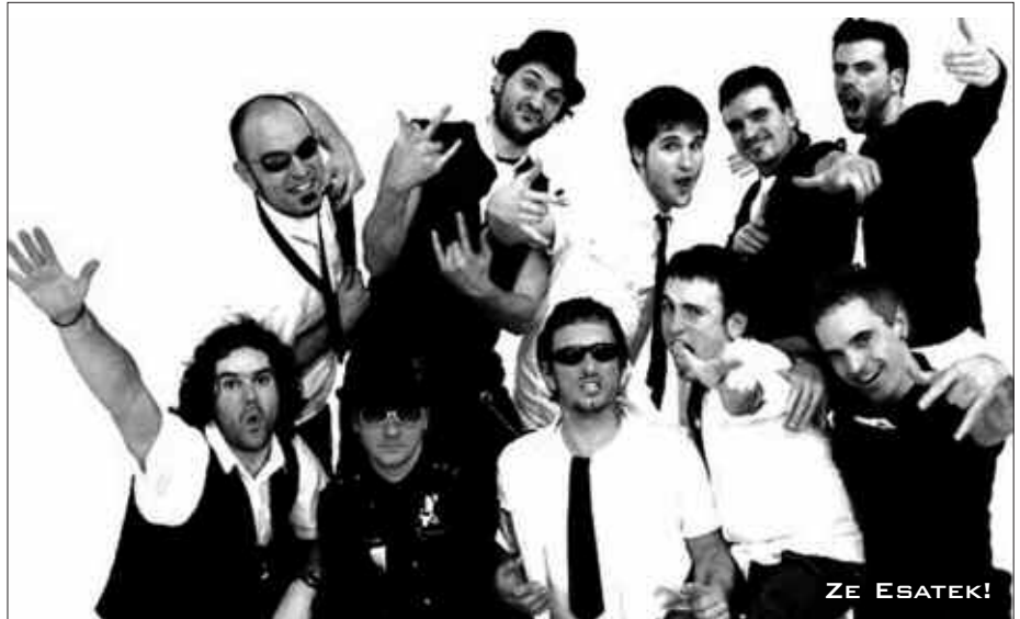
SARRERAK ALDEZ AURRETIK DAUDE SALGAI TXIRIBOGAN ETA IRRATIN.

Larunbatean, ekainak 11, 18:30etan ekitaldi nazionala burutuko da. Eta gaueko 21:30etatik aurrera kontzertu gaua, Esne Beltza,