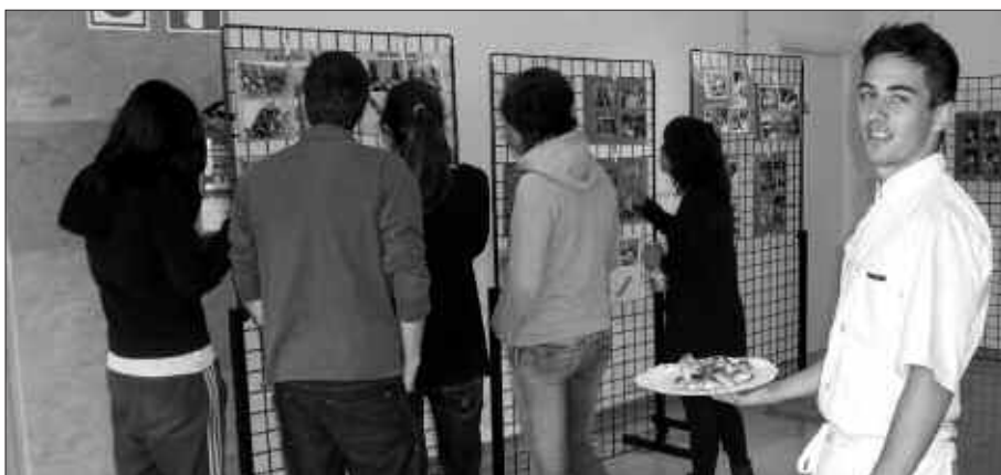
ARGAZKIAK IKUSI ETA IKASLEEN PINTXOAK DASTATZEKO AUKERA IZANGO DA.

Eta ordutegia hauxe izango da: goizeko 11:30etik 13:30ak bitartean.