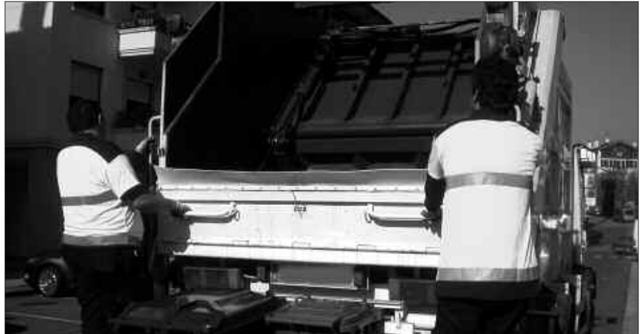
ATEZ ATEKOAREKIN HAINBAT LANPOSTU SORTU DIRA LEGEALDI HONETAN.