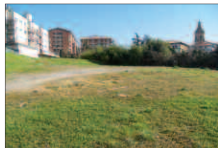
SEKAIAKO ETXEA 2012KO NEGURAKO EGONGO DIRA ESKURAGARRI.

Oiardo Kiroldegiko taberna zabaltzea, edota kirol instalakuntzak handitzea legegintzaldian zehar burutu dituzten hobekuntza lanak izan dira. Errekondok aipagarritzat jotzen du baita, kirol arloko diru-laguntzak ehuneko ehuneko igo izana. Eta laster kirol taldeek izango duten tresna erabilgarria; web orri berria.