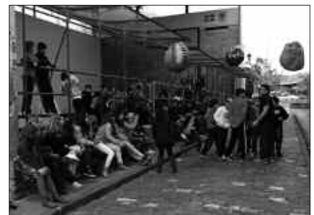
GAZTELEKUKOAK, FRONTOIAN EGINDAKO JOLAS BATZUETAN.

ekintzei buruzko argazkiak ikusteko eta ondoren luntxa eta ping-pong partida animatzen direnekin". Asmoa, guraso eta hezitzaileen arteko biltoki bat sortzea da. "Elkarrizketa gune bat sortu nahi dugu, elkarren arteko iritzi trukaketa egiteko, Gaztelekuko heziketa proiektua nerabeek dituzten beharretara egokitzen joan dadin. Honetarako ezinbestekoa da gurasoen iritzia jakitea".