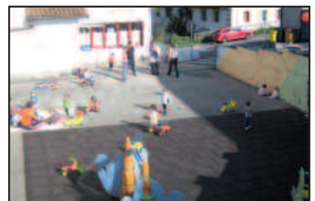
HITZORDUA EKAINAREN 13AN IZANGO DA, 18:00ETAN.

Egokitzapenari loturiko ekimen hau urteak daramatzate antolatzen Haur Eskolan. Lehengo urtera arte, haurra jaio eta Haur Eskolan hasi berritan burutzen zuten egokitzapen prozesua. Iaztik ordea, haurra jaio baino lehenagotik egokitzapen prozesua burutu daiteke. Hartara, orain arte aipatutakoaz gain, gurasoek eta haurraren hezitzaile izango direnek elkar ezagutzeko aukera dute,