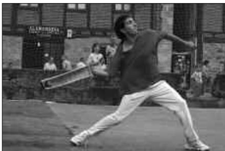
KAPITO HARRI TALDEAREN AURKA, IGANDE HONETAN VILLABONAN.

Finalerdietan, Villabonako Behar Zana taldea gaudituz zuten, 13-5 azken emaitza. Horri esker, igande honetan