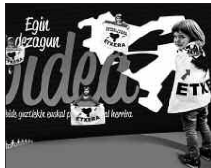
IGANDEAN MANIFESTAZIOA EGINGO DA BILBON, 12:30EAN GUGGENHEIMETIK ABIATUTA.

Igitai ikur batekin "belar txarrak errorik" esaldia eta antzekoak irakur daitezke hainbat tokitan. Zurrumurruak indar handia hartu dute azken egunotan; nekazarien iraultza ote den diote batzuk, antolatutako kanpaina bat ote den ere esaten hasiak dira... Denborak argituko ote du pintada hauen atzean zer dagoen?