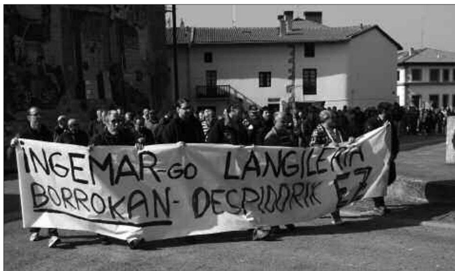
HILABETE HAUTAN, MOBILIZAZIO ASKO EGIN DITUZTE LANGILEEK.

gileek, “borroka luze honetan elkartasuna adierazi diguten guztiei, eta bereziki, lan taldeari laguntza eskaini dioten usurbildarrei”. Herritarrei, Udalari, eurekin egon diren alderdi politikoei, tabernariei edota aldizkariari.