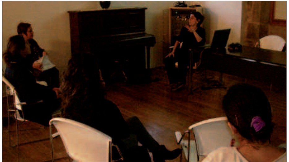
2010EAN AURKEZTU ZEN BERDINTASUN PLANA.

Aniztasuna egotea beti aberasgarria denez, herritarrei parte hartzera deitzen die berdintasun teknikariak. “Gaiak pizten dion edonori gonbidapena egiten diogu, ongi etorriak izango dira denak”, dio. Urtean lautan biltzeko asmoz sortuko da Berdintasun Kontseilua. Irailean deituko da lehen bilera. Aipatu deialdiaren gonbita jaso edota kontseiluan parte hartu nahi duenak, Berdintasun teknikariarekin hartu emanetan jar dadila, berdintasuna@usurbil.net hel-