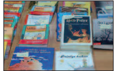
TESTU-LIBURUAK PARTEKATZEA DA SISTEMA HONEN HELBURUA.

Ekimena martxan jartzeko erabakia joan den maiatzaren 26an Udarregi ikastolan burutu zuten urteroko batzarrean hartu zen. Lau egun beranduago, ekimenaren nondik norakoak aurkeztu eta zalantzak argitzeko bilera