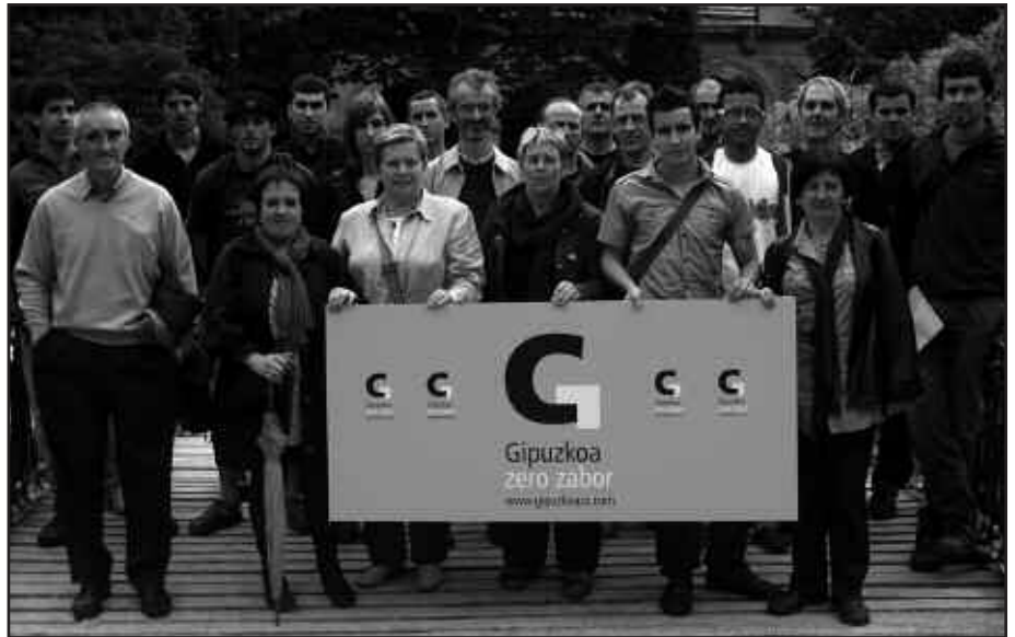
IAZ EGIN ZEN GIPUZKOA ZERO ZABOR TALDEAREN AURKEZPENA.

E rrauste plantaren egitasmoari moratoria aplikatzea eta Ordezkarri politiko hautatu berriei arduraz jokatzeko eskatzen die Gipuzkoa Zero Zaborrek (GZZ), maiatzaren 22ko udal eta foru hauteskundearen ostean sortu den egoera berriaren inguruan egin duten hausnarketaren baitan. Era berean, elkarlanerako prest agertzen dira GZZ-koak. "Arduraz jokatzeko eskatzen diegu gure eta gure ondorengoen etorkizuna bere eskuetan izango duten arduradun politikoei. Moratoria eskaera onartu eta zaborraren kultura gainditzeko bidean, bidelagun izateko eskua luzatzen diegu era berean", adierazi dute ohar bidez.