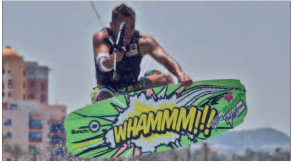
EGUNERO ARI DA GOGOR ENTRENATZEN, MUNDUKO TXAPELKETAN PENTSATZEN.

I. A. Zortzi pertsona izan gara hautatuak, eta orain Milanera goaz, Munduko Txapelketara, uztailearen 13tik 18ra.