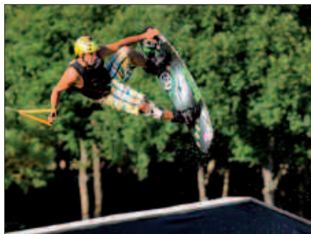
“EUSKAL HERRIAN AUKERA ONAK DITUGU”.

Herrian, ibai ederrak ditugu. Gertatzen dena da, zaila dago, azkenean burokratikoki, legeak daude eta entitateek ez dute asko laguntzen eta zaila da.