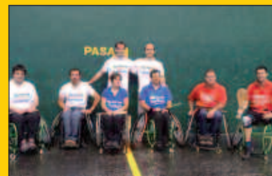
Datorren asteartean, Pilota Elkartearen erakustaldia