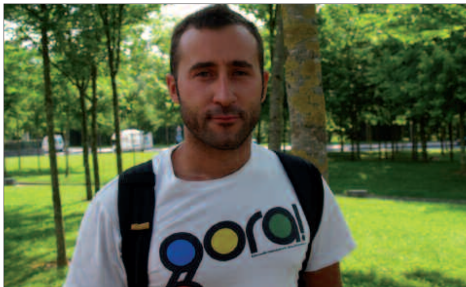
ORIAN HASI ZEN BAINA ORAIN ULIBARRI-GANBOAN ENTRENATZEN DU.

I. A. Orain arte Orian ibili gara. Lauzpabost urtez entrenatzen egon gara,