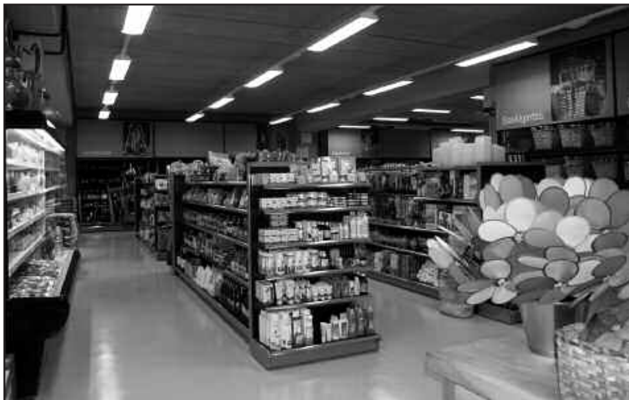
INAUGURAZIDA UZTAILAREN 16AN IZANGO DA.

M ateriala eta beharrezko lanabes guztiak lekuz aldatuta, astearteaz geroztik zabalik dago Alkartasuna Nekazal Kooperatibako egoitza berria. Atallun du kokagunea Alkartasunak. Bertara ailegatzeko ez da galbiderik; Kaxkotik Ingemar pareraino jaitsi eta han Santuenea alderako bidea hartu ordez, pabilioi berrietara jo behar da. Detaile moduan, lehen egunotan, erosketaren bat egiten duten bezeroei oparitxo ematen ari dira. Aipatu moduan, ekainaren 21ean ireki zituen atea Alkartasunako egoitza berriak, baina aurrerago inaugurazio ekitaldi batekin irekiera ospatzeko asmotan dira. Uztailaren 16rako iragarri dute inaugurazio ekitaldia.