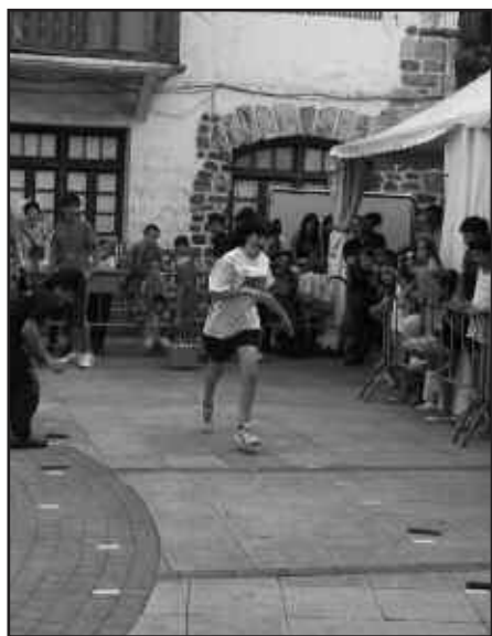
AUZOTARREN ARTEKO JOKOETAN OSO GUSTURA IBILI ZIREN GAZTEAK.