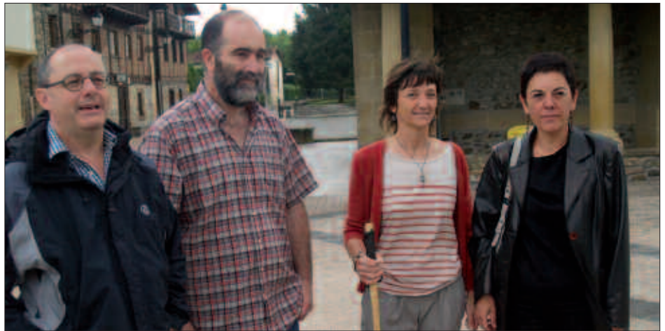
DONOSTIA ETA USURBILGO ALKATEEN BABESA IZAN ZUTEN.

Txalo artean eman zioten ongi etorria alkate berriari. Eskerrak emanez, karguari ilusionaturik eta gogotsu helduko ziola burutu zituen bere lehen jendaurreko adierazpenak. “Esateko dituzuenak entzuteko prest gaude”, zuzendu zitzaion zubietarrei. Baina proiektuak gauzatzea Herri Batzarrek bakarrik ezin duela egin zioen.