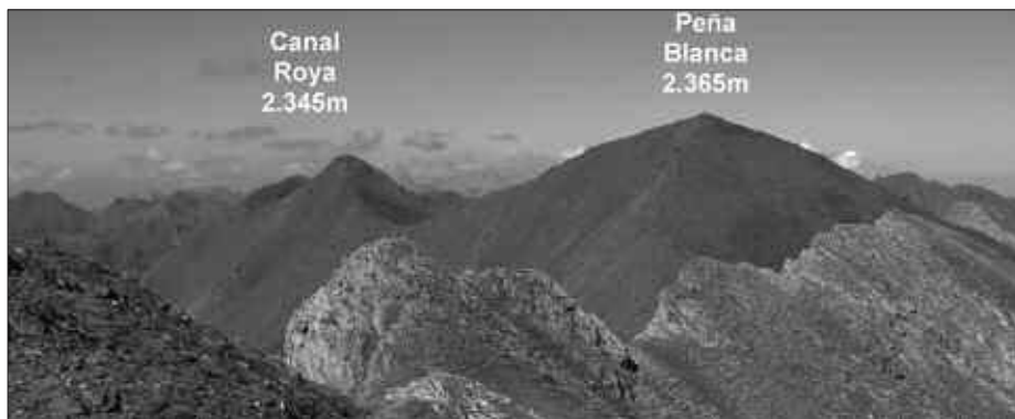
BESTEAK BESTE, BI TONTOR HAUETATIK IGAROKO DIRA.

6:30 "Irteera autobusez Oiardo udal kiroldegiko aparkalekutik. Astuneko eski estaziotik abiatu, eta 2.268 mko Pico de