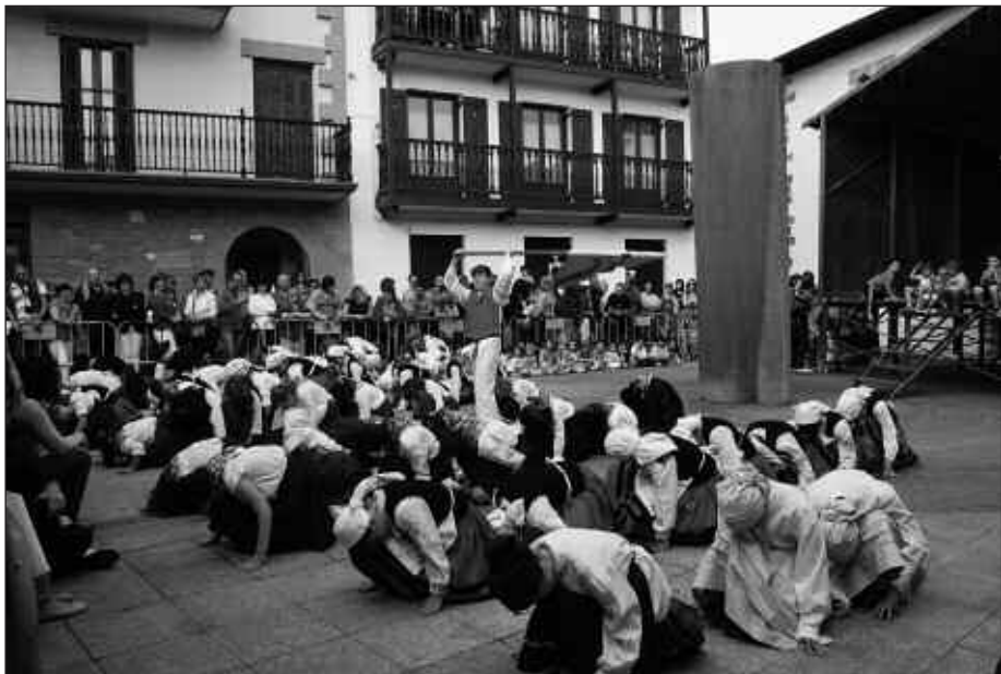
LARUNBATEAN, HERRIKO DANTZARI GAZTEAK ARITU ZIREN KALEZARREN.

Ostiral honetan ordea, soka-dantzan, helduak izango dira plazara aterako direnak. Eta ekainaren 24ko jai biribiltzeko, soka-dantzaren ondoren sardina eta sagardo dastaketa hasiko da.