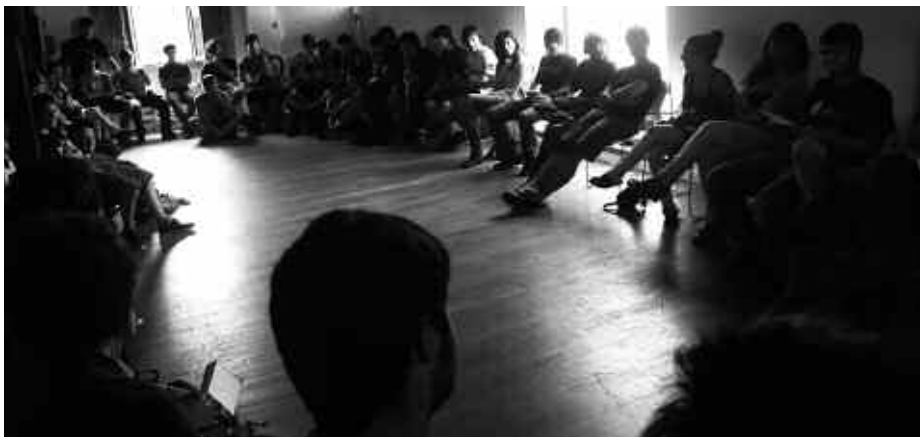
AURREKO OSTIRALEAN ARTZABALEN ELKARTU ZIREN.

Hainbat ondorio nagusi atera dituzte lanketa horretatik. Etxebizitza ez dagoela eskuragarri gazteentzat, eta euren ustez, alokairu soziala bultzatu behar da. Horretarako gainera, lanpostu bat behar da. Diotenez ordea, lan finkoa amets hutsa da, eta lan baldintzak kaxkarrak dira. Euskara bultzatzeko beharra ere sumatzen dute, erabilerak behera egin duelako. Sare sozialek indar handia hartu duten honetan, irizpide propiodun eta informazio gardena eskainiko duen gazteei zuzenduriko hedabide bat falta dela diote, "gazteoi kritikoak izatea bultzatuko gaituena".