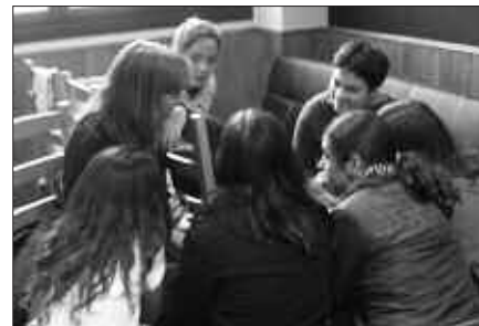
LARUNBATEAN IZANGO DA LEHEN SAIOA, ASTEAZKENEAN BIGARRENA.

Hartara, sexualitate gaiaren inguruan hitz egiteko partaidetza errazteko giroa sortu nahi dute, alderdi fisiko, psikologiko eta soziala kontuan izanik gai honi buruzko informazioa eman, gai honetan gazteek dituzten jarrerak kritikoki aztertu, sexualitate kontzeptua argitzea modu