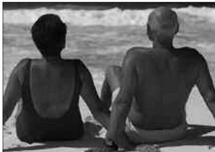
EKAINAREN 28AN AMAITUKO DA IZENA EMATEKO EPEA.

Izena ematen dutenei ondorengo zerbitzuak eskainiko zaizkie: joan etorriko bidaia, ostatua pentsio osoan, taldearen aseguru-poliza, osasun zerbitzua eta animazio programa.