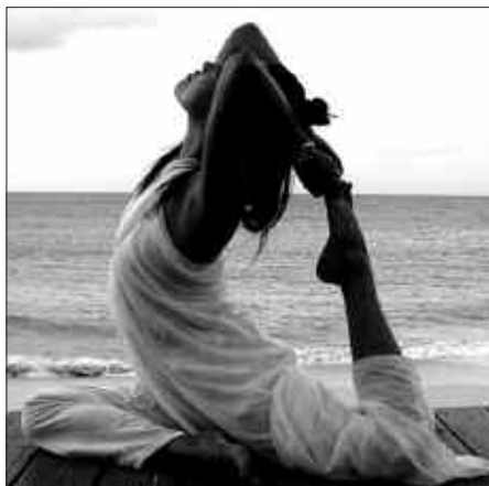
YOGA IKASTAROA URRIARI HASIKO DA.