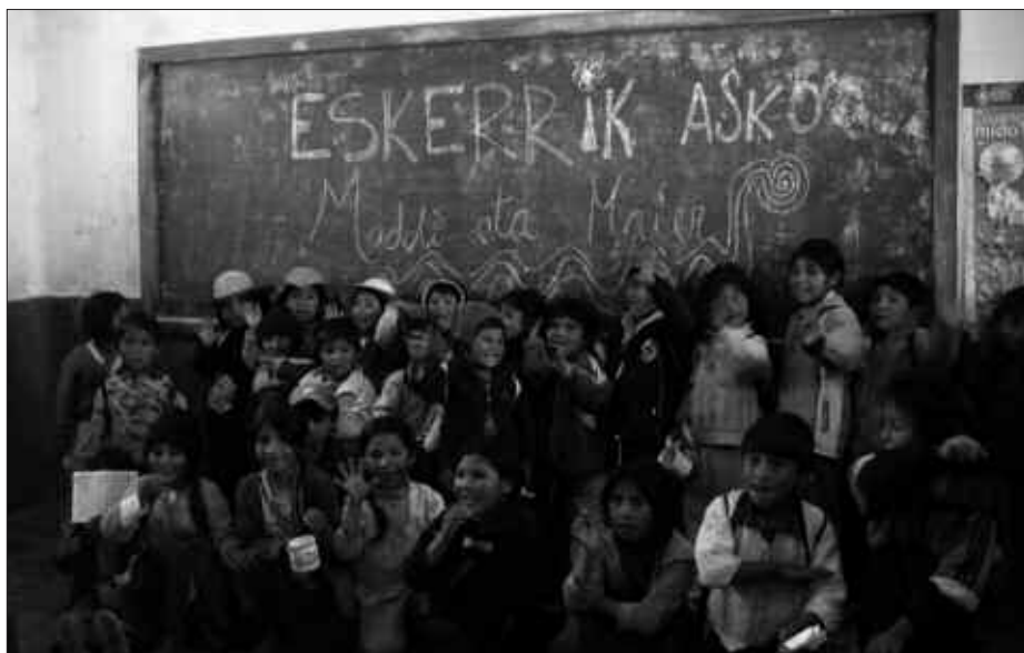
“OINARRIZKOENA IRAKASTEN ZITZAIEN: IRAKURTZEN, IDAZTEN ETA ZENBATZEN”.

M.G. Bizitza erabat aldatu zitzaigun, hobeto geunden. Hiriko proiektuari “eskola mugikorra” deitzen zitzaiogen. Furgoneta batean egunero auzoz auzo joaten ginen. Kalean lan egiten zuten haurrak lan mundutik ateratzea zen berez helburua, jolasen bidez. Umeak ume sentiaraztea, momentu batez bazen ere.