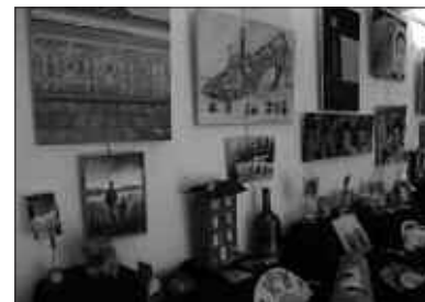
IRUDIAN, IAZKO TAILERRETAKO HAINBAT LAN IKUSGAI.