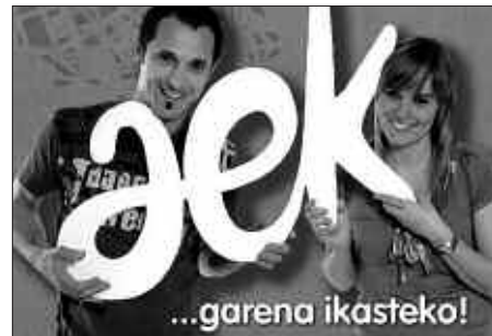
URRIAREN 3AN HASIKO DIRA KLASAK.

Euskara ikasi edo hobetzeko euskaltegian ikastaroren bat egiten dutenek, ikasturte amaieran, datorren 2012ko ekainean udal diru-laguntzak eskatu eta jasotzeko aukera izango dute. Horretarako bi baldintza baino ez dira bete behar: batetik, Usurbilen errol-datua egotea. Bestetik, klaseen %80ko asistentzia izatea. Kasuotan, Usurbilgo Udalak matrikularen %80a itzuliko die ikasleei. Ehuneko ehuna, 12 urtetik beherako seme-alabak dituzten gurasoei baita langabetuei ere.