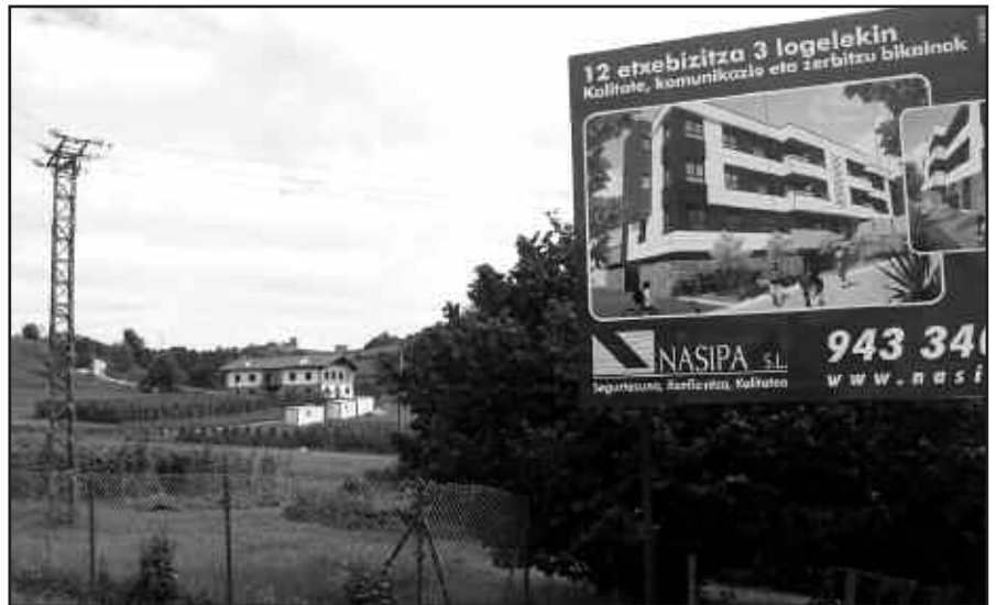
HASI DIRA ERAIKITZE LANAK IRAGARTZEN.

Agerreazpin babes ofizialeko etxebizitzak eraikitzen haste-koak direla nabari da. Pisuen salmenta iragartzen duen kartel bat ikus daiteke, babes ofizialeko etxebizitzak eraikitze-koak diren lur eremu ondoan. Handik gertu, laster hasiko diren lane-tarako etxolak ere kokatu dituzte. Aurreko legegintzaldi amaieran, bizileku hauen zozketa egin eta aste gutxira, gobernu taldeak lanak udazken honetan bertan hastea aurreikusia zuen. Itxura guztien arabera, begi bistako aldaketa hauekin, egindako iragarpenak beteko dira. Usurbilgo Udalak 2012 eta 2013 urteak lotuko dituen negurako bizilekuok eskuragarri izatea espero du.