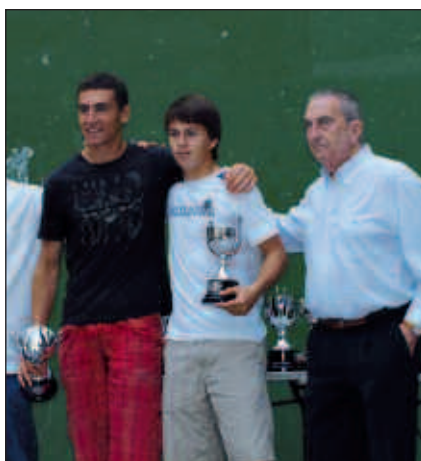
KADETE MAILAN, IBARGOEN ETA TELLERIA FINALERA IRITSI ZIREN.