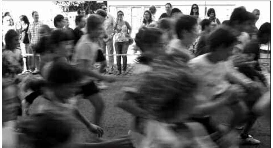
IZEN-EMATEA ALDEZ AURRETIK EGITEN BADA, 10 EURO BAINO EZ.

hain zuzen. Mikel Laboa plazan hasi, Kaxkoa zeharkatu, Santuenea eta Zubieta aldera jo eta handik bueltan, Kalezarrera igo, Olarrondotik igaro eta irteera gunera, Mikel Laboa plazara itzuli beharko dute. Bidean ur hornidura izango dute, eta helmugan, luntxa dastatzeko aukera.