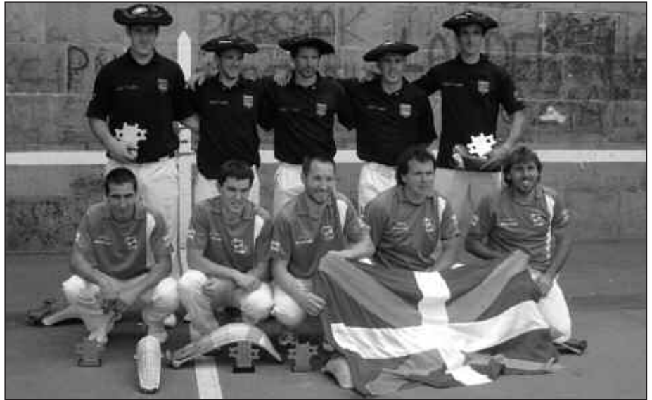
IAZ FINALERA IRITSI ZIREN ZUBIETARRAK (ARGAZKIAN, MAKURTUTA).

dira eta txapelketa bi fasetan banatu dute. Lehendabizikoa, itzuli bateko ligaxka jokatu dute taldeek, irailaren 25a bitartean.