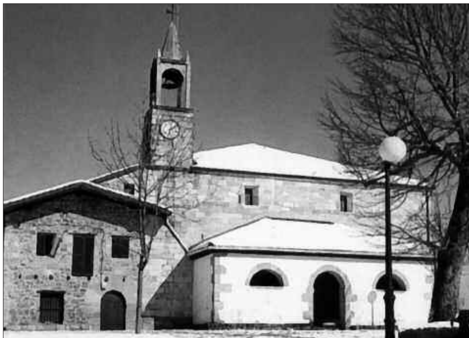
SAN ESTEBAN ELURRETAN.

Eskualdean diharduten eragile pribatuak publikoetara hurbiltzeko partaide-