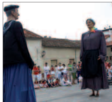
USURBILGO BI ERRALDOI, AGOIZKO TOPAKETAN.

S antixabel jaietan, erraldoiak Stehen aldiz dantzan aritu ziren. Agoizko erraldoiekin batera kalejiran ibili ziren. Abuztuaren 14an, ordea, usurbildarrak izan ziren Agoizera gerturatu zirenak. Erraldoi eta Buruhandien XXIV. Topaketan hartu zuten parte. Beraiekin batera, hainbat usurbildar ere animatu ziren.