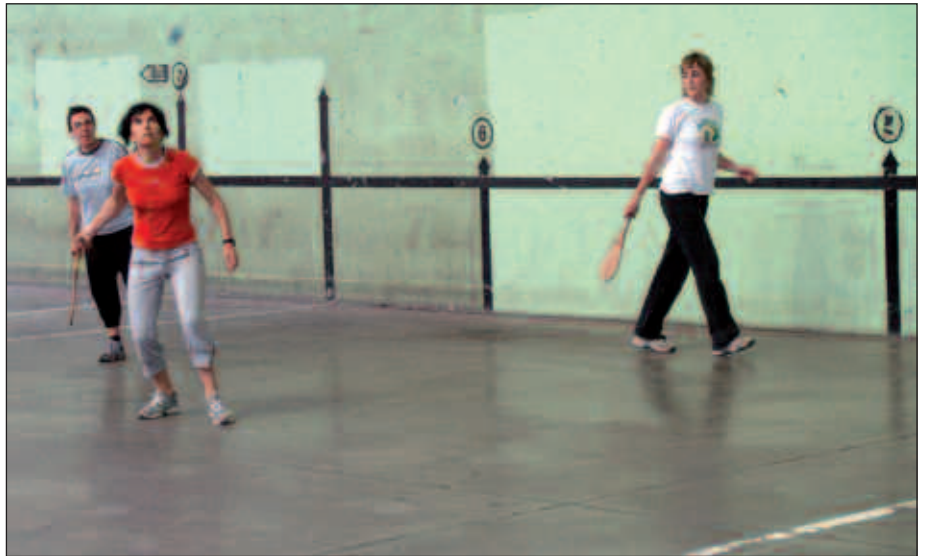
IRAILAREN 30ERA ARTE IKUSGAI IZANGO DIRA OIARDO KIROLDEGIAN.

Udaberriko txapelketaren ostean, Kirol Patronatuak sustatuta, Usurbilgo Pilota Elkartek emakumeei zuzenduri-