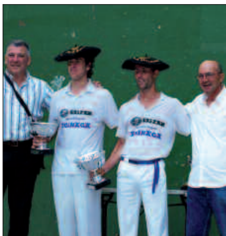
URRUZOLAK ETA HUIZIK IRABAZI ZUTEN HANDIEN MAILAKO TXAPELKETA.

Telleriarekin jokatu zuen eta 18-7 galdu zuten Iturengo bikotearen aurka. Handien mailan ordea, Huizi eta Urruzolak Hernaniko Esnal eta Lizeagari irabazi zieten 22-18 (Berriemaile: Iñaki Agirresarobe).