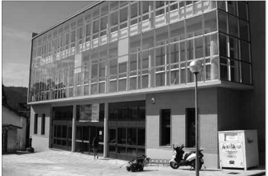
IKASTAROTETAN IZENA EMATEKO EPEA IREKI DA KIROLDEGIAN.

Aerobik, mantentze gimnasia, pilates, spinning, tonifikazioa, banakako entrenamendu saioak giharketa gelan, 3.adin eta ezinduei zuzenduriko ikastaroak, haur zein helduei zuzenduriko igeriketa saioak... Zerrenda luzea da, ordutegi eskaintza zabala eta abonatuak prezio bereziak izango dituzte interesa piztu dien jardueretako batean izena ematen badute. Iazko ikasturtean ikastaroren batean parte hartu zuten herritarrek izango dute aurrenik, izena emateko lehentasuna, irailaren 15era arte. Bigarren hamabostaldian denentzat irekiko da aipatu epea. Informazio gehiago Kiroldegian bertan (edo 943 372 498).