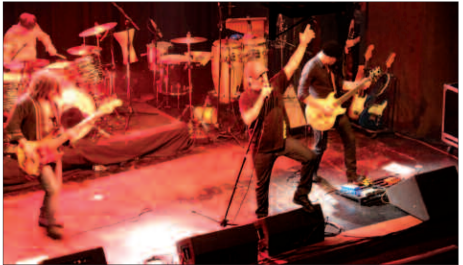
GATIBU TALDEKOAK IRAILAREN 16AN IZANGO DIRA GURE ARTEAN.

Gatiburen kontzertuarekin batera, bada aurtengo jai egitarauan nabarmenetzeko moduko beste berrikuntza bat ere. Bota Punttuba bertso eskolakoak estreinakoz antolatzen ari diren Udarregi Sariketa. Belaunaldi desberdinetako bertsolariak bildu nahi dituzte ekimen berri honetan. Beteranoak eta gazteak aurrez aurre jarriko dituzte. Irailaren 18an Santueneako jaietan ospatuko den herri bertso-bazkarian, sei heldu ariko dira bertsoan. Udarregi Sariketako lehen finalerdia izango da. Bigarrena, Aginagako San Praixkuetan ospatuko da, eta hitzordu horretan, sei bertsolari gazteren saioaz gozatzeko aukera egon-