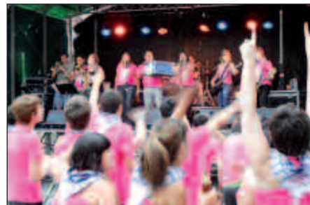
ARRAKASTA IZAN DU ATXEGALDEKO JAIEN ABESTIAK.