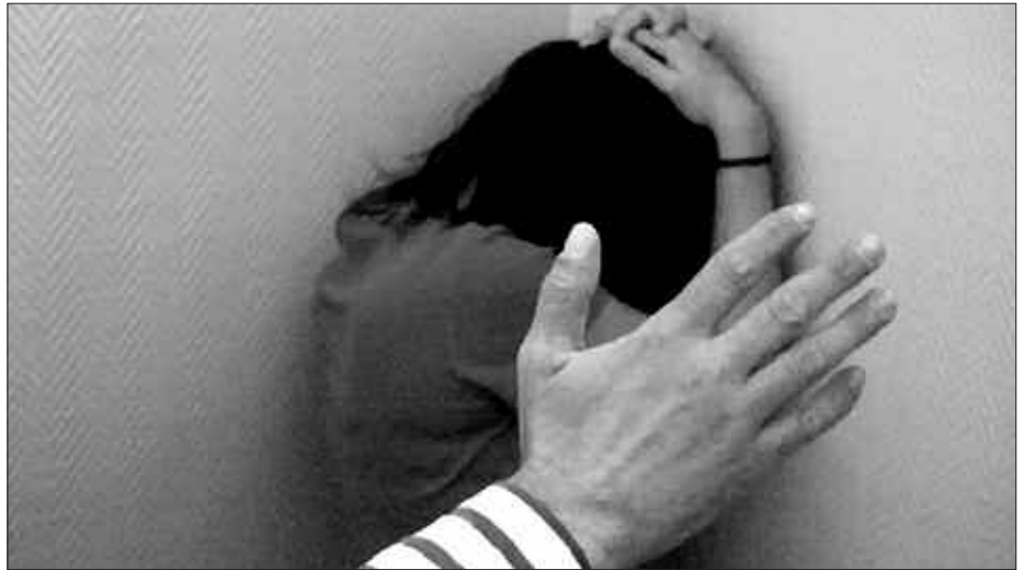
ERANTZUN EGOKIA EMATEKO PROTOKOLOA ZEHAZTU NAHI DU UDALAK.