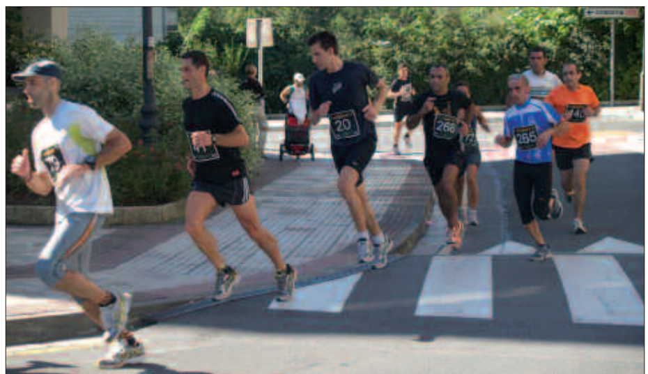
11:00ETAN HASIKO DA KROSSA.

Ondo gogoan izan goizeko 11:00etan hasiko dela krossa. Honez gero, gauza jakina da proban parte hartzeko izena eman behar dela alde aurretik. Irailaren 15era arte, 10 euroren truke, kiroldegian edota herrikrossa.com web orrialdean. Lasterketa egunean bertan ere eman daiteke izena. Irteera gunean, goizeko 9:00-10:30 artean hain zuzen, 13 euro ordainduta.