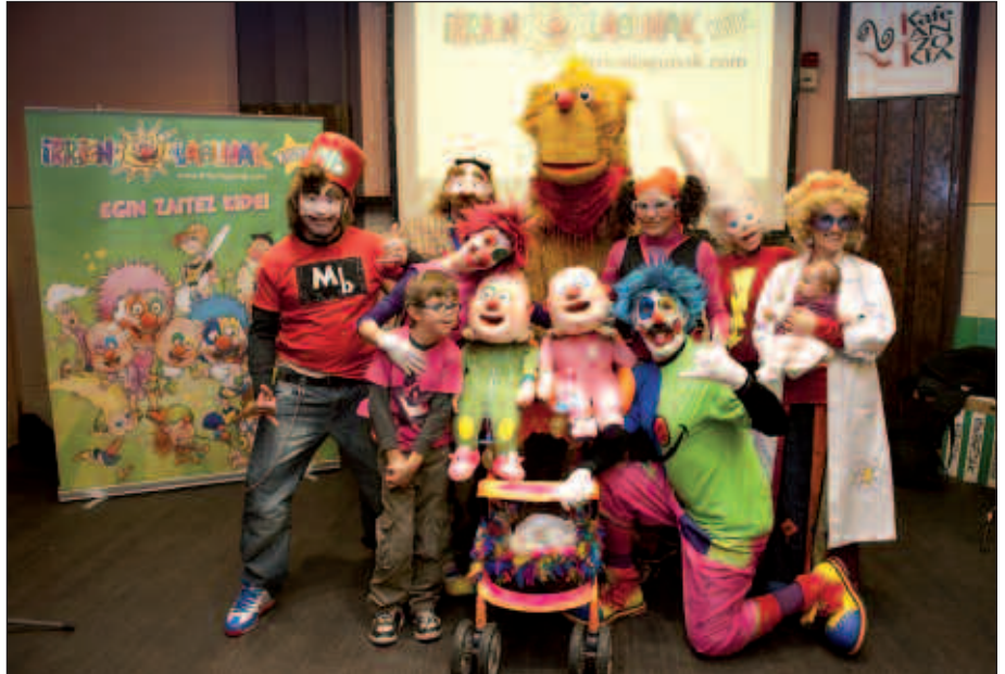
JOLASAK, IKUSKIZUNAK, JAN ZEIN EDATEKO AUKERA UGARI... EKITALDI BETE DATOR IRRIEN LAGUNAK KLABEKO EGUN HANDIA.