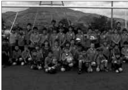
ARGAZKIAN, IAZKO FUTBOL ESKOLAKO JOKALARI ETA HEZITZAILEAK.

Aipatu moduan, 2011-2012 denboraldia asteburu honetan bertan hasiko dute futbol talde gehienek. Preferente mailakoek lehen partida asteburuan jokatu dute. Datorrenean irtengo dira futbol zelaira, denboraldi berriko lehen neurketa jokatzeraz honako talde hauek: 1. mailako jubenil eta kadeteen taldeak, baita urtebeteko etenaldiaren ostean Usurbil FT-koek berriz osatzea lortu duten erregional mailako nesken taldea ere.