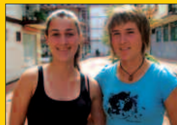
Orioko arraunlari usurbildarrak