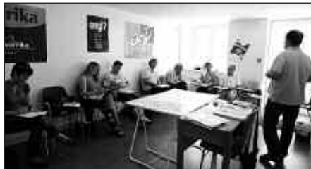
AURTEN ERE, DIRULAGUNTZAK ESKATZEKO AUKERA DAGO.

Interesdunek Zumarte Musika Eskola ondoko Kale Nagusia 45 zenbakidun egoitzara gertura daitezke izen ematera. Astelehenetik ostiralera, goizez 11:00-13:00 artean edo arratsalde, 18:00-20:00 artean. Goiz, eguerdi eta iluntze partean taldeak sortzeko aukera dago. Informazio gehiago: