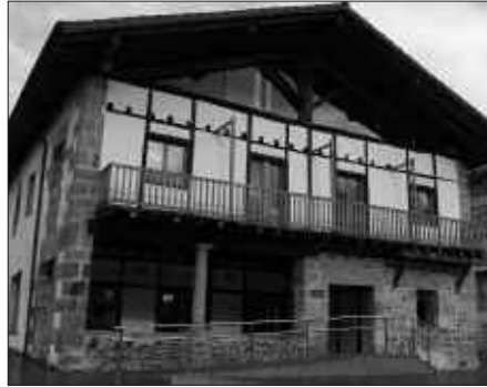
IRAILAREN 23AN, DYAK HITZALDIA ESKAINIKO DU ARTZABALEN.

-Euskadiko Kutxa: 3035 0140 31 1401018416.