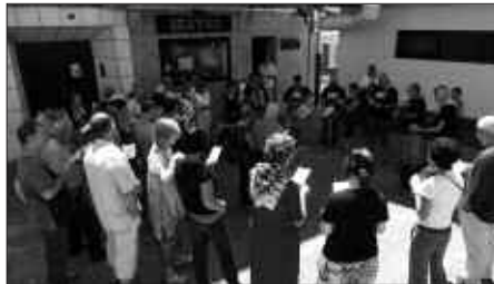
ENTSEGUAK, ALDIZ, IRAILAREN 27AN HASIKO DIRA.

Bestetik, asteartetan, "andereño berare-