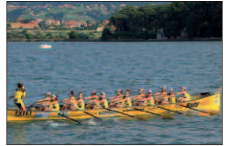
ORIOKO TRAINERUAN ARITU DIRA SARAI ETA IRATI.

S. L. Arraunlaria beti hor dago, baina ez dio inork kasurik egiten. Azkenean arraunlariari ez zaio bere meritua ematen, neskei behintzat gutxi. Arraunlarien iritzia neure ustez, garrantzitsua da. Zuzendaritzak, ligak edo ikuskizunak garrantzi gehiago dute, arraunlariek baino.