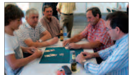
MUS TXAPELKETA LARUNBATEAN DA.