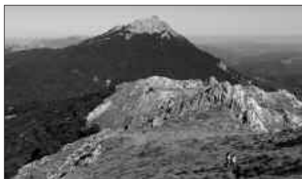
KIROLDEGITIK ABIATUKO DIRA AUTOZ, GOIZEKO 7:00ETAN.

Antolakuntzatik ohartarazten dutenez, ibilbidea amaitu ostean, "Otzaurtetik bi kilometrotara dagoen atsedenekuan otordua egingo dugu". Janaria norberak eraman beharko du, edaria aldiz Andatzakoek.