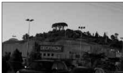
EROSKETA SISTEMA BERRIAK EZ DU EUSKARAZ EGITEKO AUKERA EMATEN.

Usurbildar batek NOAUA!ra deitu du honen berri emanez. Berak egin bezala, gainontzeko erosle euskaldunak ere gauza bera egitera animatu nahi ditu: Decathlonen informazio gunean, erreklamazioa egitera. Eta hori bera udaletxera eraman, Udalak ere tramitatu dezan kexu hori.