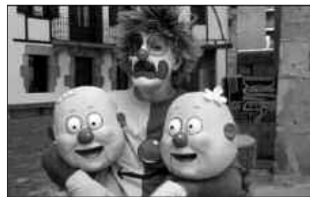
PUPU ETA LORE ERE ETORRIKO DIRA.