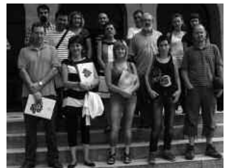
ARGAZKIAN, UDAL ORDEZKARI ETA EUSKALTEGIETAKO KIDEAK.

Artean, matrikulazio epeak zabalik jarraitzen du, astelehenetik ostiralera,