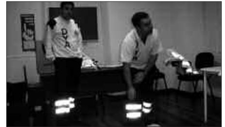
GURE PAKEAK ANTOLATU DUEN HITZALDIA 17:00ETAN HASIKO DA.

Alfabetatzea, DBH-ko Eskola Graduatua atera, unibertsitatean sartzeko hauta-froga prestatu, gaztelania etorkinentzat, hizkuntzak (euskara, ingelesa, frantsesa), informatika, literatura eta historia tailerrak, elikadura, artea, marrazketa, irteera hezigarriak... Eskaintza zabala prestatu dute aurtengoan ere, Usurbilgo Helduen Hezkuntzan, EPA-n. Matrikulazio epea zabaldu dute jada. Izena Agerialden eman liteke, astelehentik ostiralera, goizez 9:00-13:00 artean eta arratsaldez, 15:00-19:00 artean. Informazio gehiago 943 361 273 (Usurbilgo egoitza) eta 943 366 608