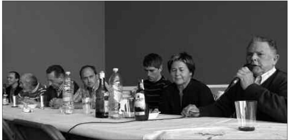
SANTUENEO SAIOAN GIRO EDERRA IZAN ZEN.

Zortziko txikiko ariketak izan ziren segidan. Ez ziren ikaritzen ez, elkarri mikrofonoa kendu behar ziotela zirudien, hori erraztasuna dutena oraindik gure beteteranoek! Saioak bere horretan eutsi zion, akaso ez zen beti zortziko handiko-