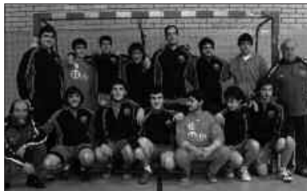
ASTEBURU HONETAN HASIKO DA DENBORALDI BERRIA.

M. Zuzendaritzan sartzan zaren unetik ilusionatua egon behar duzu, ilusioa gal-tzen bada, gaizki baikoaz. Badakigu den-