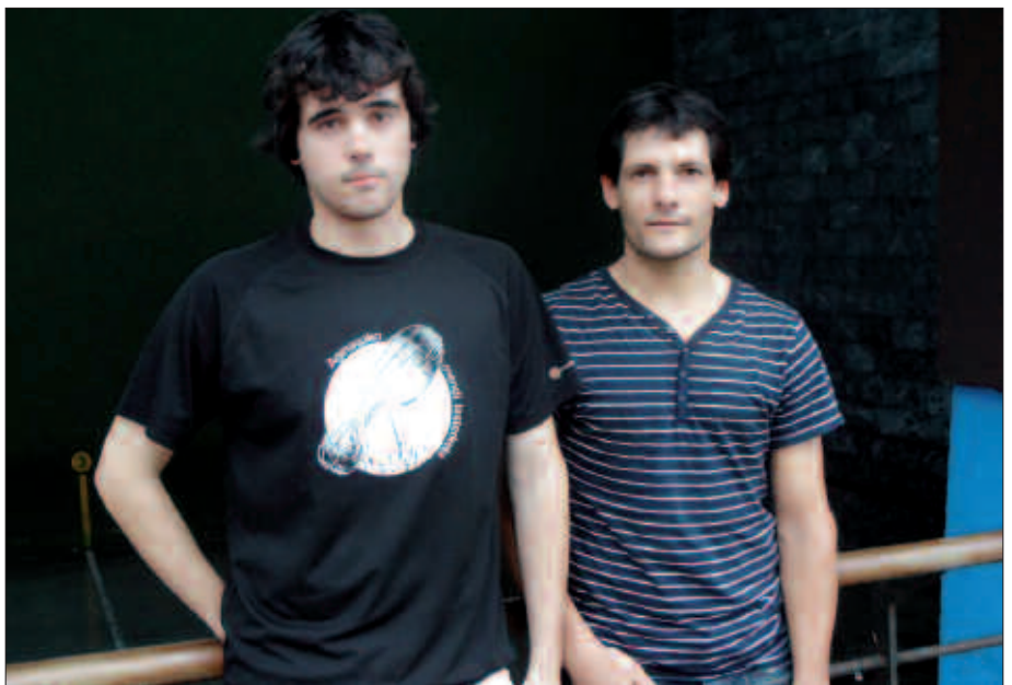
Aginagako frontoian elkarrizketatu ditugu bi pala jokalaria.

N. Finalerdiak noren aurka jokatu dituzuen badakizue. Lehiari begira, elkar ezagutzen zarete