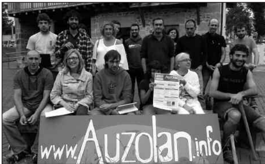
ARGAZKIAN, TOPAKETEN ANTOLATZAILEAK ETA UDAL ORDEZKARIAK.

Topaketa hauetan parte hartzeko, izenematea www.azolan.info gunean egin behar da, eta 30 euroko bonoa eskuratuz, topaketetan parte hartu ahal izanen da. Topaketen azken egunean “Auzolanaren liburua” aurkeztuko dute.