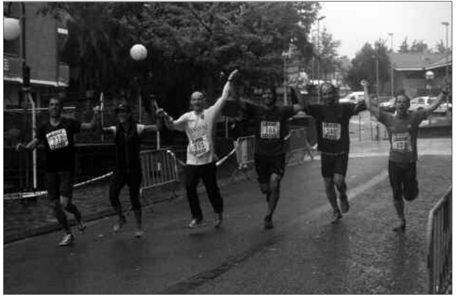
EURI JASAK BETE BETEAN HARRAPATU ZITUEN KORRIKALARIAK.