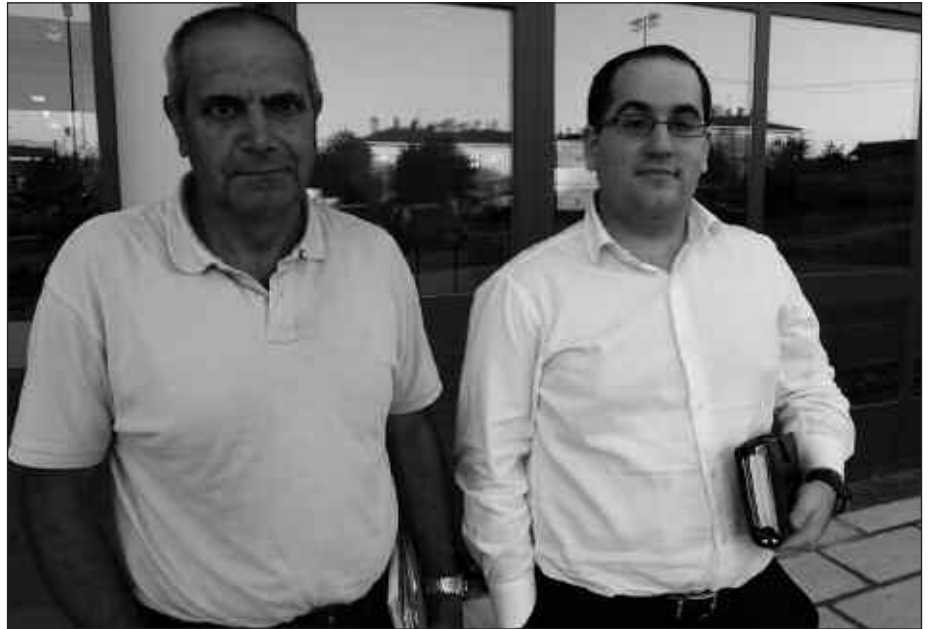
ARGAZKIAN, USURBIL KE-KO ZUZENDARITZA TALDE BERRIKO BI KIDE.

J. L. Gutxi gorabehera, iaz genituen taldeak mantenduko ditugu. Mutiletan, seniorretan bi talde; 2. Nazional eta territorial mailakoa. 2. Nazional mailara igo den senior nesken taldea dugu aurten. Kadete eta jubenil neskek Euskal Ligan jokatzen jarraituko dute. Aurten, kadete mutilen taldea ez da osatzerik izan. Baina jubenil mutilen taldea aterako dugu, 2. urteko kadete eta jubenilekin.