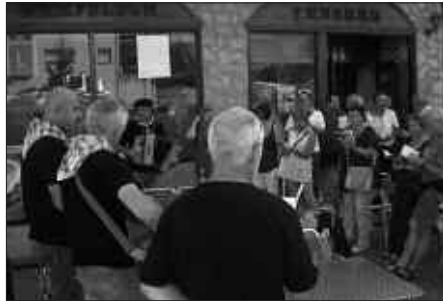
19:00ETAN ELKARTUKO DIRA MIKEL LABOA PLAZAN.

Bestetik, asteartetan, "andereño berare-