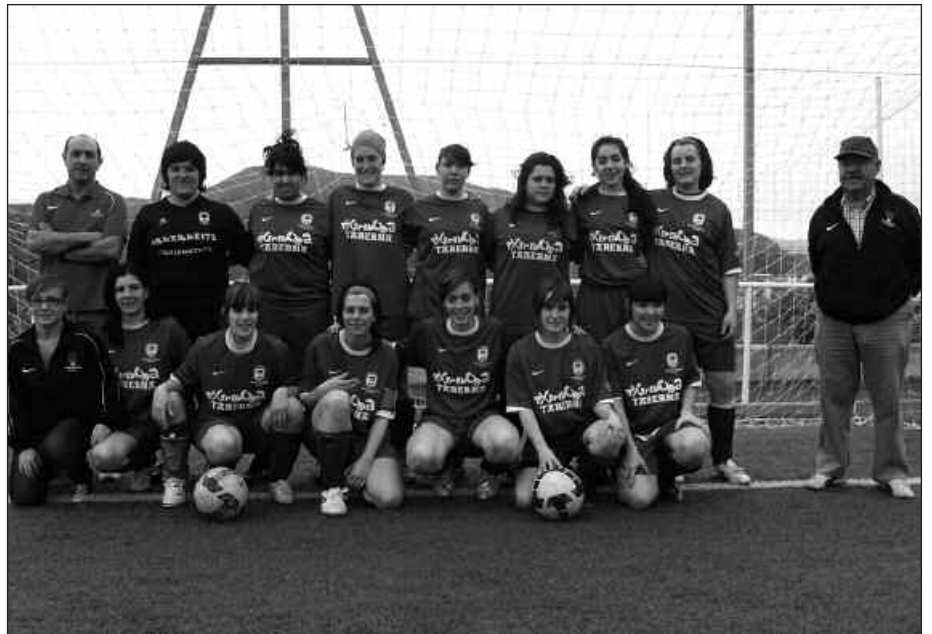
ZAZPI TALDE IZANGO DITU USURBIL FUTBOL TALDEAK. ETA BAITA FUTBOL ESKOLA ERE.

Hasi berri den denboraldian, kalitatearen aldeko apustua egin nahi dute Usurbil F.T.-koek, "futbolaren alorrean sakontzen hasi nahi genuke.