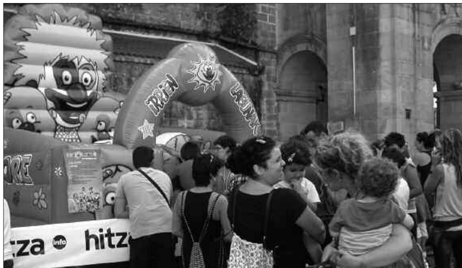
IRRIEN LAGUNAK HERRIAZ JABETU ZIREN IGANDEAN.