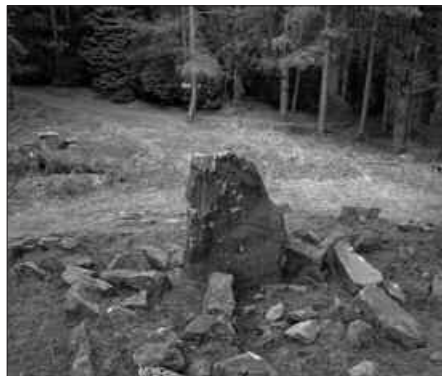
ABENDUKO MENDI ASTEAN EMANGO DIRA SARIAK EZAGUTZERA.

Tolestu gabeko kartazal itxi baten barruan, Andatzako en egoitzan utzi