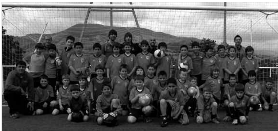
FUTBOL ESKOLA ERE ANTOLATZEN DU USURBIL FT-K.

Futbol Eskolan 38 gaztetxok eman dute izena, hamalauko talde berri batek tartetan. Kasu honetan, asmoa, "lanean segi eta hobetzen joan nahi dugu". Argibideen berri emateko arduradunak bilera burutzekoak dira laster, jokalarien gurasoekin.