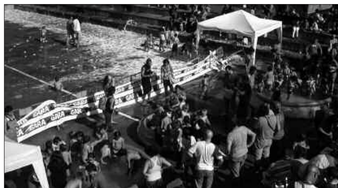
ARRATSALDE PARTEAN, APAR FESTA EGIN ZUTEN ARTZABALEN ETA UMEEK ASKO ESKERTU ZUTEN.