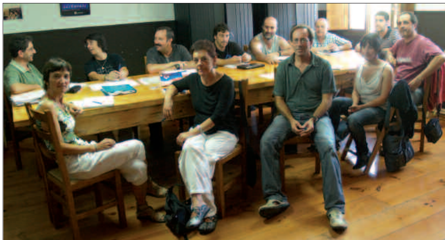
IRAILAREN 15EAN ELKARTU ZIREN ZUBIETA, DONOSTIA ETA USURBILGO UDAL ORDEZKARIAK ZUBIETAN.

A. O. Zubietako izaera bereziaz ere hitz egin genuen, bi udalerrien artean banatua baitago. Etorkizunerako, konponbidetarako edo bateratzea gauzatzeko bide desberdinak aipatu ziren. Ideia horiek jorratu eta egokiena dena aurrera eramatekoan geratu ginen. Donostiako Udalak