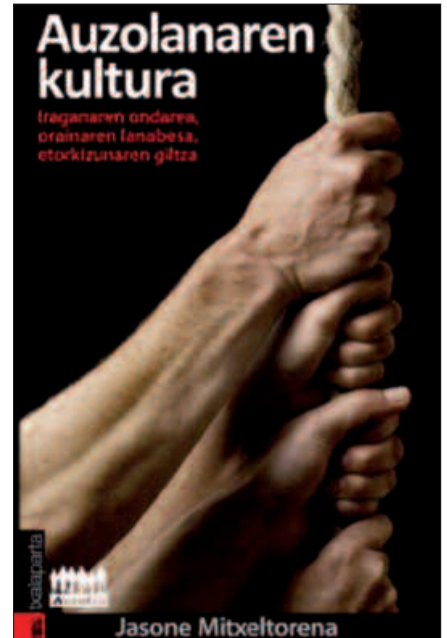
LIBURU HAU AURKEZTUKO DA JARDUNALDI HAUETAN.