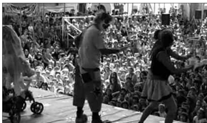
FRONTOIA ETA DEMA PLAZA TXIKI GERATU ZIREN "PUPU ETA LORE" IKUSKIZUNEAN.