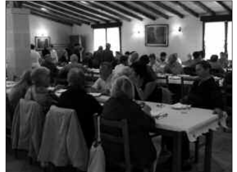
UDARREGI SARIKETAREN BIGARREN FINALERDIA JOKATUKO DA AGINAGAN.

Urriaren 7an, ostiralarekin ospatuko da bertso-afaria, Aginagako Eliza Zaharrean. 21:00etan hasita, Bota Punttuba bertso eskolak estreinakoz antolaturiko Udarregi Sariketaren biga-