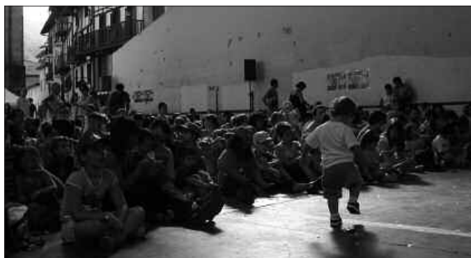
16:00ETAKO SARI BANAKETA ASKO ATZERATU ZEN ETA UMEEK ETA GURASOEK ZAIN EGON BEHAR IZAN ZUTEN...