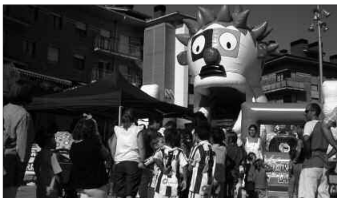
BERDARI ETA EGUZKIARI AURRE EGINEZ, HAURRAK PORROTXEN PUZGARRIRA IGOZTEKO ZAIN.