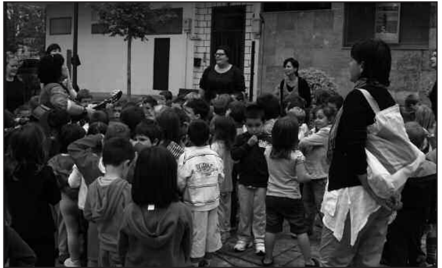
UDARREGI IKASTOLAKO IKASLEAK, BORDABERRIN KANTUAN.