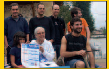
Asteburu honetan, Auzolan Topaketak