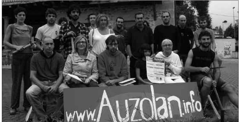
OSTIRALEAN, ARRATSALDEKO 16:00ETAN HASIKO DIRA TOPAKETAK.

Jardunaldiotan parte hartzeko egiten ari diren deialdia Euskal Herri mailakoa da. Antolakuntzatik gogorarazten dutenez, Euskal Herrian "abian diren ekimenen eta horien esperientzien topagune izan nahi dute; horiek ezagutuz eta ezagutzak parte-