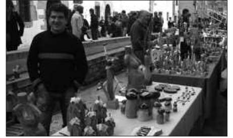
ARTISAU LAN EZBERDINAK JARRIKO DITUZTE IKUSGAI.

Denetariko produktuak aurkituko ditu, datorren asteartean pilotalekura gerturatzeko denak; bitxigintza, larrugintza, egur lanketa, zeramika, otargintza, metalgintza... Ez hori bakarrik. Hamaiketako ederra dastatzeko modua ere izango baita. Txorizoa eta taloa jan