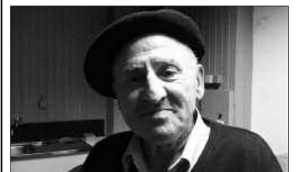
SORTZEZ NAFARRA DA URTUBIA.

Antolatzaileek aurreratu dutenez, Urtubiak, "egun 80 urte ditu baina borrokarako grina ez du galdu. Han hemenka eskaintzen dituen hitzaldi eta topaketetan transmititzen duen errebeldia eta indarrak, herritarrak -batez ere gazteak- konkistatzen ditu".