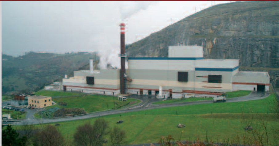
IRUDIAN, BIZKAIKO ERRAUSTE PLANTA.

Erregai merkea: Normalean, argindarra sortzeko erregai fosilak erabiltzen dira, gasa, petroleoa eta ikatza. Hauek eskasak eta garestiak dira, geroz eta gehiago, eta merkatuen arau eta gorabeheren menpe egoten da prezioa. Hondakinak erretzeagatik, herritarrok ordaindu behar diegu errauste planta kudeatzen dutenei eskaintzen diguten "zerbizua-gatik". Beraz erregaiagatik ordaindu beharrean, erregai eskuratzeagatik irabaziak daukate. Horra hor negozio kutsakorren lehen hanka.