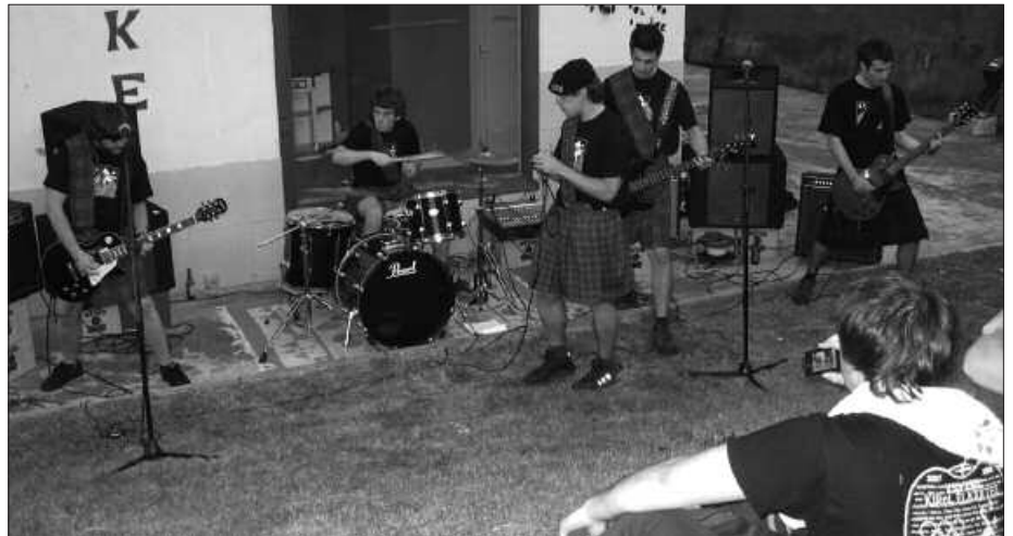
HARANeko LOKALETAN ENTSEATZEN DUTE.

baina bertsioak asko jotzen ditugu. Iritsiko da gure kantak plazaratuko ditugun ueua.