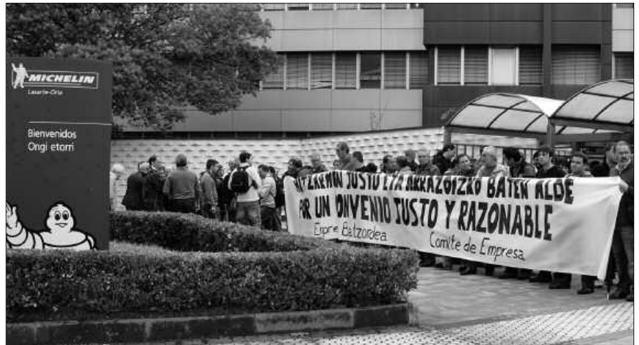
URRIAREN 19AN ELKARRETARATZEA EGIN ZUTEN.

LAB sindikatutik ohartarazi dutenez, “urte osoa daramagu lan-hitzarmen berriaren negoziazioan. Hitzarmen honek espainiar estatuko eta Euskal Herriko bi lantegiei eragingo die (Gasteiz eta Lasarte-Oriako lantegiei). Hasiera hasieratik Enpresa zuzendaritzak negoziazioa bera luzatzeko jarrera garbia izan du, akordio bat lortzeko jarrera benetan eskasa erakutsiz. Enpresaren jarrera honek eraginda, mahai negoziatzaileak ia astero mantentzen zituen bilerak bertan behera geratu dira, negoziazioa blokeo