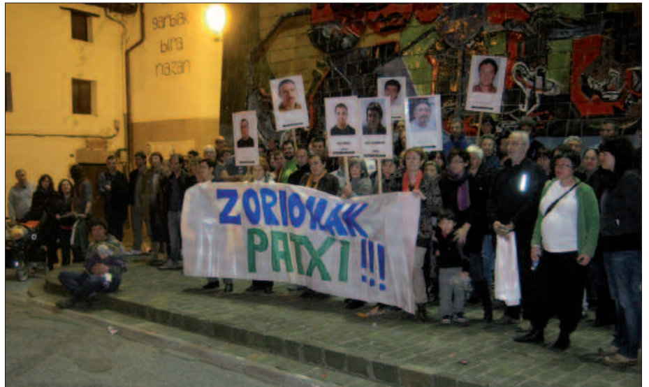
OSTIRALEAN ELKARRETARATZEA EGINGO DA, 20:00ETAN MIKEL LABOA PLAZAN.

N. Ze egoeran daude herriko presoak oraintxe bertan?