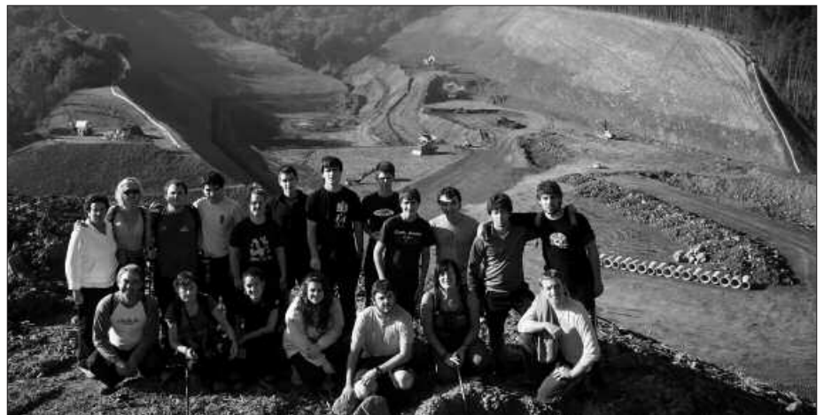
ZUBIETAKO PROIEKTU EZBERDINAK IKUSTEN IZAN ZIREN ITAYAKO HAINBAT KIDE.

ITAYAKoan ustez, erraustegia eraiki nahi duten lekuan “Usurbilgo kaxko osoa