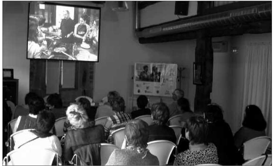
ARTZABALEN EMATEN DA ESPERIENTZIA ESKOLAKO TAILERRA.

E sperientzia Eskolaren ikasturte berria hasi zen pasa den astean. Aurkezpen hitzaldi bat eskaini zuten Artzabalen. Aurrerantzean, asteartero elkartuko dira bertan, arratsaldeko 16:00etatik 18:00etara. Baina aste honetan bezala, datorren astean ere asteartea jai denez (azaroak 1), Esperientzia Eskolaren hurrengo bilkura asteazkenean izango da esandako ordutegian, 16:00etatik 18:00etara. Izena ez baduzu oraindik eman, jakin ezazu ikasturte osoak 50 euro balio duela. Eta ikastaso burutzen duten guztiek diploma bat jasoko dute. Informazio gehiago honako telefono zenbakian jaso daiteke: 943 22 41 46 (Aitziber Indart).