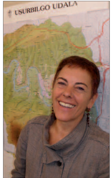
LAN TALDE ONA OSATU DUTELA USTE DU ALKATEAK.

M.A. Aurreikusi daiteke. Batzuk badira deitu dutenak ia hurrengo babes ofizialeko etxebizitzak noiz aterako diren. Ugartondoko proiektua geldirik zegoen baina jada pausoak ematen hasi direla esan daiteke. Birpartzelazioa eta hainbat barruko tramite egin dira. Eraikuntzen eta jabegoen arteko hainbat pauso egin