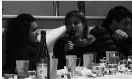
BERTSO-AFARIA BAINO LEHEN, KANTU JIRA EGINGO DA.

Sarrerak alde aurretik Bordatxon eta Txiribogan eskura daitezke, 18 euroren