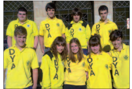
DYAK BOLONDRES BERRIAK DITU.