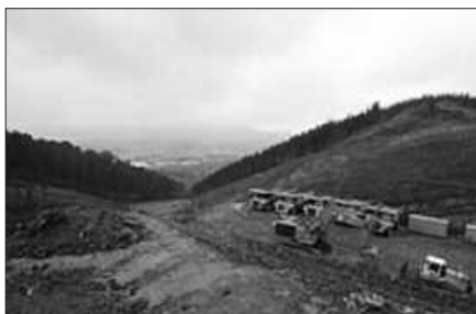
BILDU ETA PSE-EEKO ORDEZKARIEN ARTEAN EZTABAIDA PIZTU ZEN HONDAKINEN GAIAREN INGURUAN.