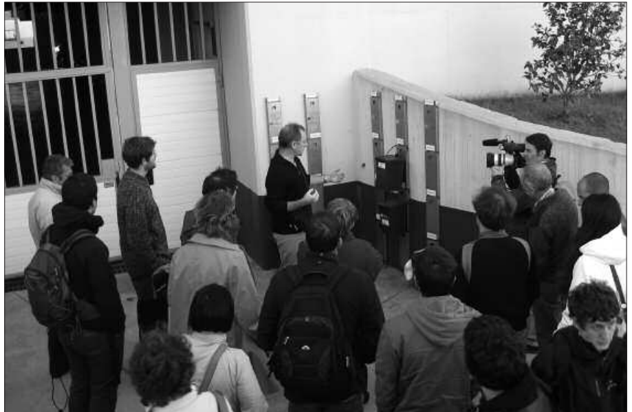
URRIAREN 22AN ATEZ ATEKO BILKETA EZAGUTZERA HURBILDU ZIREN.

D eshazkundera, antimundialismo edo altermundialismoa, ekologia, justizia soziala eta ingurumenaren inguruan lan egiten duen Baionako Bizi! mugimenduko kideak, Usurbilgo eta Hernaniko atez ateko bilketa esperientziak ezagutzen izan dira berriki. Usurbilgo Udal ordezkartzaren eta Zero Zabor bilguneko kideen eskutik, sistemaren ezaugarrien eta lortu diren emaitzen berri jaso zuten.