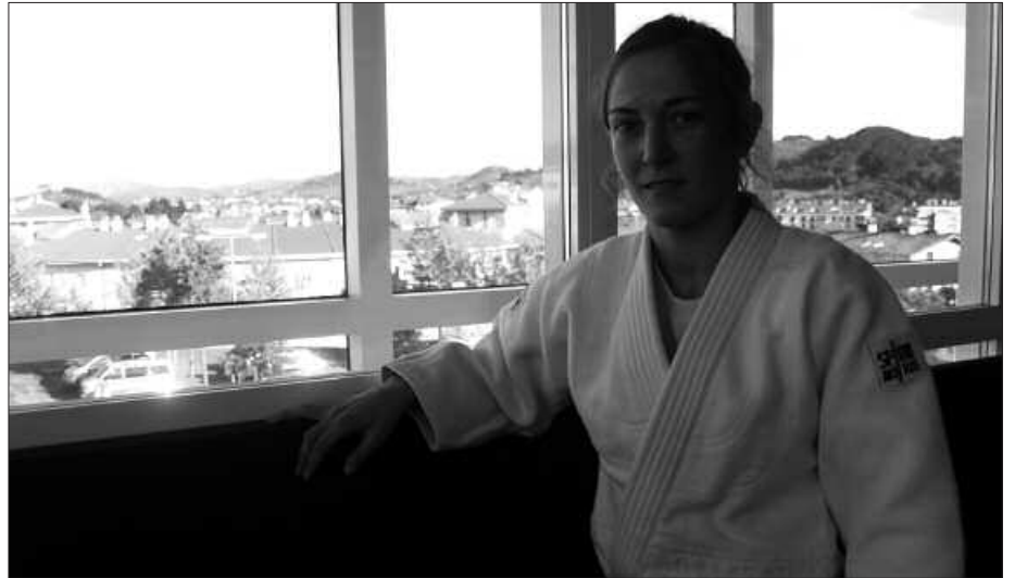
DIARDO KIROLDEGIAN ARITU GINEN OIANA BLANCOREKIN SOLASEAN.

N. Londres 2012 helmuga horretara ailegatu aurretik, nondik nora ibiltzeko