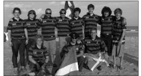
MUNDUKO TXAPELDUN IZAN DIRA EUSKAL ORDEZKARIAK.