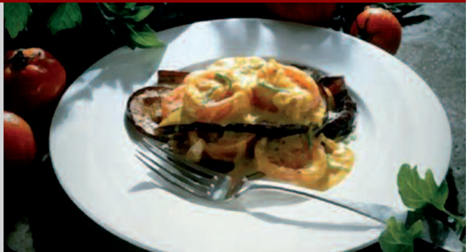
BERENJENAK XERRATAN MOZTU BEHAR DIRA, LUZEETARA.

·piper mina. Prestaketa: Berenjenak xerratan moztu luzetara, 3-4 xerra ateratzeko moduan. Labeko bandejan jarri olio txorrotada batekin, urez ziprztinduta eta gatza eta piperminarekin. Ordu erdiz erre 180°C-tan eta atera labetik. Tipula, porrua eta potxatu zartagi