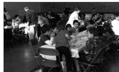
BAZKARIA FRONTOIAN IZAN ZEN.

U rriko lehen asteburuan burutu ziren topaketen ostean, hitzordu berri bat finkatu zuen Auzolan Elkarteak joan den urriaren 25erako; Egonean Egon Eguna. Auzolan proiektuaren eta gai berari buruzko liburuaren aurkezpenak iragarriak zeuden goizerako, eta gero hainbat herritar hurbildu ziren frontoian ospatu zen herri bazkarira.