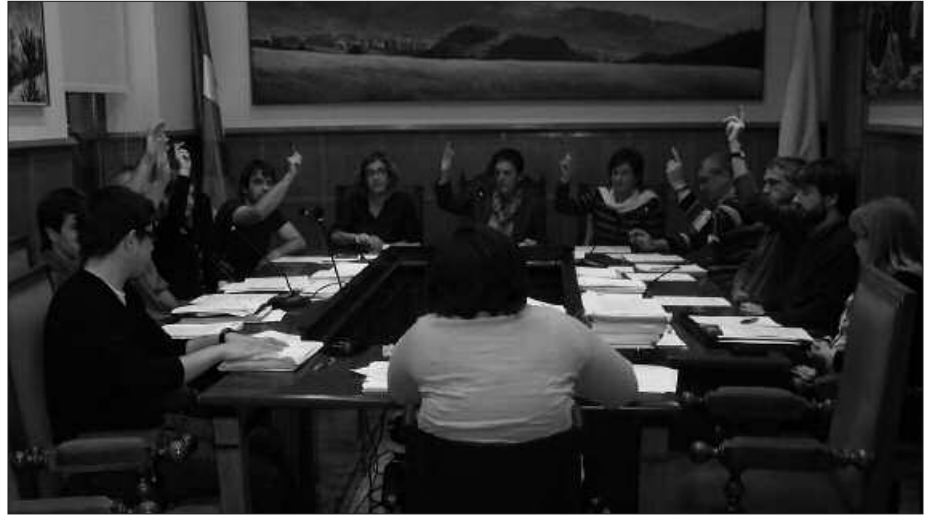
URRIAREN 26AN ELKARTU ZEN UDALBATZA PLENDA, OHIKO JARDUNEAN.

% 2,9ko KPI-aren igoera aplikatzeko asmoa die Bilduk, urriaren 26an burutu zen ezohiko osoko bilkuran hasieraz onartu ziren 2012rako ordenantza fiskalei. Kasu gehienetarako, aipatu ehuneko baliatuko nahi du gobernu taldeak. Erreferentzia moduan, 2010eko abuztuko Gipuzkoako datua erabili dute. Halere, igoera honetatik kanpo geratuko diren zenbait zerga egongo dira. Progresibitatea izango da kasuotan aplikatuko duten beste irizpidea, trakzio mekanikoko ibilgailuen gaineko zergan adibidez.