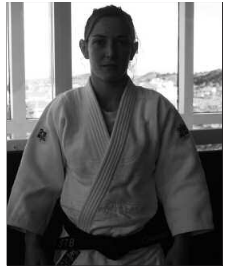
TXAPELKETA GARRANTZITSUENAK OLINPIAR JOKOETAKOAK DIRA.

O. B. Azkenean judo munduan txapelketa garrantzitsuena Olinpiar Jokoak dira. Beti txikitatik amesten duzun zerbait da. Lehen urruti ikusi arren, orain diot ez dela ametsa, neure eskuetan dagoela baizik. Hori gertatuko balitz, urteotako ibilbide osoa errekonozitua ikusiko nuke. Familia, egunero entrenatu eta laguntzen aritu direnak errekonpentsatzeko modu bat, hori guztia beraiekin partekatuta.