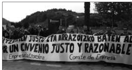
EGUN HAUETAN ELKARRETARATZEAK EGITEN DIHARDUTE.

U rriaren 19an egin bezala, astebete beranduagorako hilaren 26rako ere lanuzteak deitu zituzten Michelingo langileek. Ondoko irudian ageri den moduan, eguerdi partean lantegi aurrean elkarretaratu ziren.