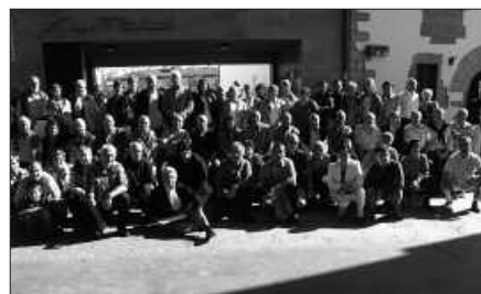
URRIAREN 23AN ORIA BEHEKO ODOLO EMAILEEN BILKURA EGITEN ZEN.

O ria Beheko bailarako odol emaileak omendu zituzten urriaren 23an, Usurbilen ospatu zen ekitaldian. Bide batez, datorren astelehenean azaroak 7, odola emateko aukera berri bat izango da Usurbilen, 18:00etatik 20:30era ambulatorioan.