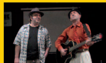
Ostiral honetan Sutegin, "Xentimorik gabe" antzezlan