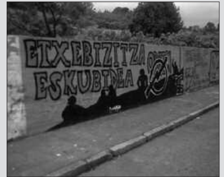
HILEAN BEHIN ARGITARATUKO DA ITAYAREN ORRI BAT NOAU!N.

ITAYAk hilean behin aldizkari hau zuenaginatuko dizue.