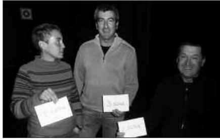
ARGAZKI LEHIAKETAKO IRABAZLEAK, SARIAK JASO BERRITAN.

E kitaldiek izan duten harrerarekin gustura dira antolatzaileak, balorazio baikorra egin dute Andatza Mendizale Elkartetik, ospatu berri den Mendi Astearen inguruan. Bestetik, urteko batzarra urte hasieran izango dela iragarri du Andatza elkarteak kudeatzen ari den talde txoak.