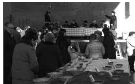
AZOKA EGUERDIAN IZANGO DA.

Iaz ikusi edota dastatu ahal izan zenaz gain, aurten inguruotako zenbait baserritako animaliak ere ikusteko aukera egongo da. Zaldi bat, bi behor, bi idi, bizpahiru ahuntza... Taloa eta txistorra dastatu ahal izango da, baita babarrun krema eta sagardoa ere. Postu bana jarriko dute bestalde, euren egitasmoa ezagutzera emateko Usurbiltzen Elkarteak. Eta ikasturte amaierako bidaia diruz laguntzeko,