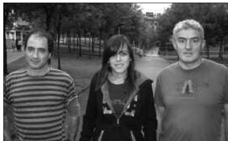
EGIN DEZAGUN BIDEA TALDEAK MOZIOA AURKEZTU ZUEN PLENOAN.