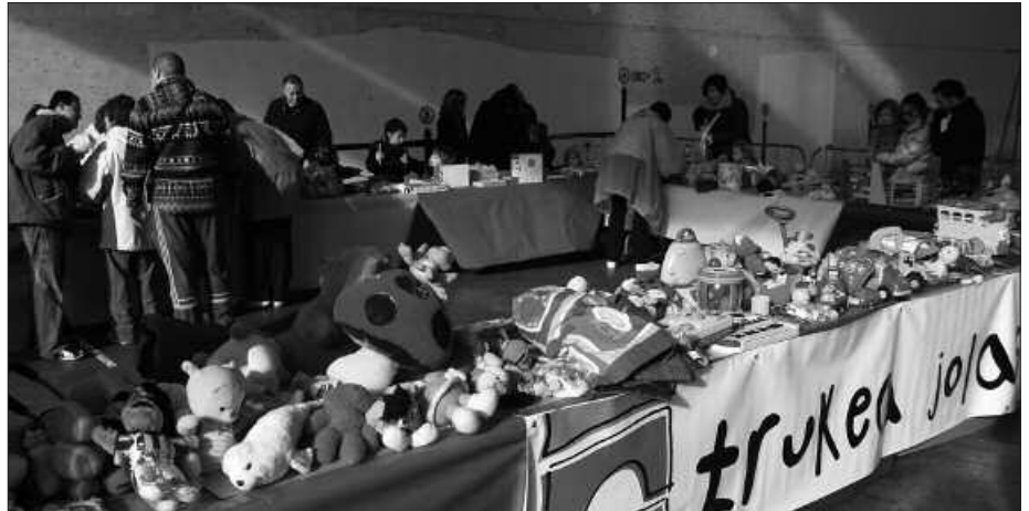
LARUNBAT HONETAN, GOIZEKO 11:30EAN HASIKO DA AZOKA.

Edizio honek badakar berrikuntzarik gainera. Antolakuntzatik adierazi dutenez, Gaztelekukoek azoka eguna dinamizatuko dute. Ekimenean parte hartu nahi duenak, azokarako gaiak lehenago, abenduaren 14tik 16ra Sutegiko erakusketa aretoan utzi beharko ditu. Ordutegi