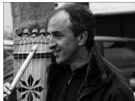
SUTEGIN ARITUKO DA, 19:00ETAN HASITA.