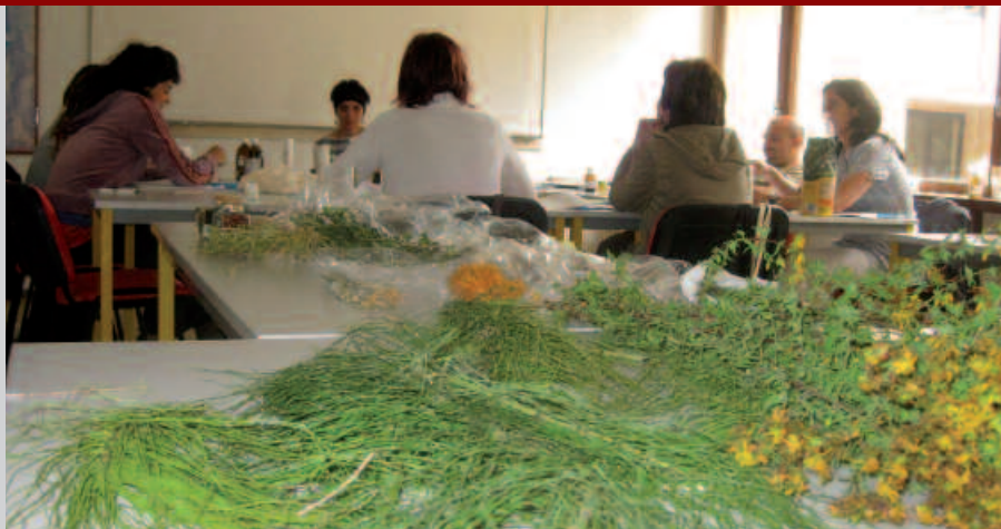
URTARRILAREN ERDIALDEAN HASIKO DA IKASTAROA.

Ikastaroa urtarrilaren erdialdean hasi eta 16 larunbatetan egingo