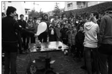
USURBILEN ERE, EUSKARAREN EGUNA OSPATU ZEN ABENDUAREN 3AN.

Bildu, Aralar, Hamaikabat eta EAJ-PNV-k mozioaren alde bozkatu zuten. PSE-EEko udal ordezkaria ordea, abstenitu zen. Usurbilgo Udala euskara bultzatu eta bermatzearen alde egon arren, mozioan aipatzen den esaldi batekiko