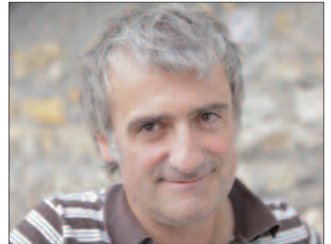
19:00ETAN HASIKO DA PROIEKZIOA.

Bigarren helburua litzateke Euskal Herritik kanpo bertsolaritza zer den azaltzea. Madrilgo lagun bati bertsolaritzari buruz hitz egiten badiozu, ez du ulertuko, ez dakielako mundu horretaz ezertxo ere ez. Zentzu horretan, bertsolaritza kanpoan erakusteko izpirituarekin abiatu zen dokumental hau. Hasieratik. Eta uste dut lortu dugula. Bertso zalearentzat erakargarria izango da, baina baita bertsoetaz ezer ez dakienarentzat ere.