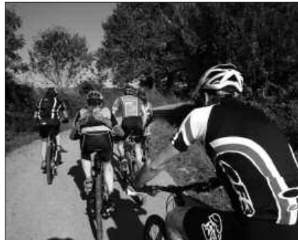
32 KILOMETROKO IBILBIDEA PRESTATU DUTE.

Martxan jarri berri den Irisasi BTT bilgunea 30 lagunek osatzen dute. Guztiek urtarrila amaierako hitzordurako gonbita