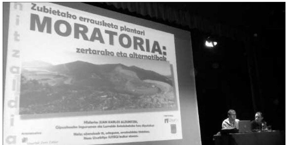
ABENDUAREN 15EAN SUTEGI TXIKI GERATU ZEN.

Datozen sei hilabeteko tarte honetan, hondakinen kudeaketaren inguruko