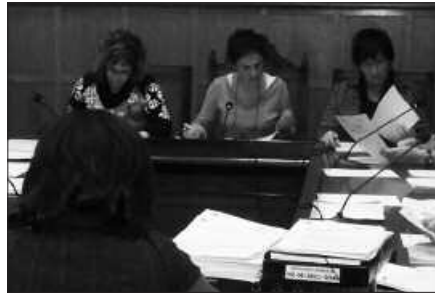
DATOZEN EGUNETAN HELARAZIKO ZAIE GAINONTZEKO UDAL TALDEEI.

Zirriborroa datozen egunotan helaraziko diete beste udal taldeei, "eta beraien ekarpenak aurkezteko epea ireki ondoren, eta eztabaidarako tartea kontuan izanda,