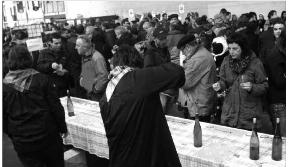
LEHIAKETAKO SAGARDOA DASTATU AHAL IZAN ZEN SANTO TOMAS FESTAN.

Aurten, lehen aldiz, animaliak ere izan dira eta umeak pozarren ibili ziren Askatasuna plaza inguruan. Baina azokaren muina frontoian egon zen. Epaimahaiak sagardo onena aukeratzen zuen bitartean, lehiaketara aurkeztutako sagardoak dastatzeko aukera izan zen. Sagardo Eguneko antolatzaileak fin aritu ziren lanean, sagardoak partitzen.