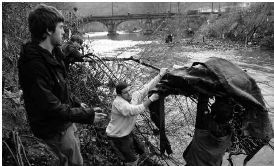
ERRIO BAZTERRAK GARBITZEN ARITU ZIREN ZERO ZABOR ETA ITAYAKOAK.

H ilabetea pasa da uholdeak izan zirenetik. Denboralearen arrastoak oraindik nabariak dira erreka bazterretan. Uholdeak pasa ziren, baina lan asko dagoela egiteko oraindik. Horren aurrean, auzolanean aritzeko xedez, abenduaren 6rako egin zuten deia. Usurbil Zero Zabor taldeak eta ITAYA Gazte Asanbladak eginiko deialdi bateratuak 60 lagun ingururen parte hartzea ekarri zuen. Hilabete lehenago izandako uholdeek utzitako ibai ertze-ko zikinkeria garbitzen aritu ziren, Herria Garbi izeneko egunean. Irudian ikus daitekeenez, gogotik aritu behar izan zuten.