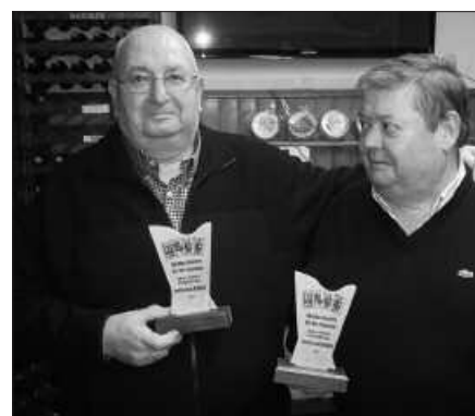
PEÑA PAGOLAKOAK HIRUGARREN IZAN DIRA AURTEN.