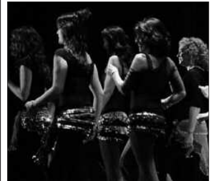
17:30EAN HASIKO DA SABEL DANTZA ERAKUSTALDIA.