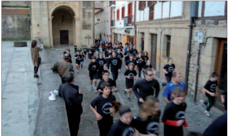
ABENDUAREN 31N, LASTERKETA ARRATSALDEKO 17:00ETAN HASIKO DA.

San Silvestre eguneko herri lasterketan parte hartzen dutenek, proba amaitu ostean Hurbilagok burutuko dituen zozketetan sarituak izateko aukera izango dute.