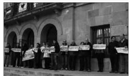
NORBANAKOAK ETA KOLEKTIBOAK, ASKO DIRA URTARRILAREN 7KO DEIALDIAREKIN BAT EGIN DUTENAK.

tiakin euskal presoak Euskal Herrira" lemapean. Norbanako zein eragileek hitzorduari atxikimendua adierazteko aukera dute oraindik, kolosalaizangoda.info web orrialdean. Usurbildik Bizkaiko hiriburura joateko autobusa antolatuko dute. Beti bezala, alde zuzenetik ohiko lekuetan izena eman beharko da.