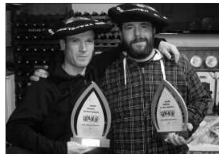
AGINAGA ELKARTEKOENTZAT IZAN DIRA AURTENGO TXAPELAK.

Bestalde, antolatzaileek eta elkarte guztiek txapelketa honetan lagundu duten guztiari eskerrak eman nahi dizkiete: Aialde-Berri Sagardotegia, Alamandegi Jatetxea, Aginaga Sagardotegia, Araeta Sagardotegia, Aratz Erretegia, Atxega Jatetxea, Barazar Jatetxea, Bordatxo Taberna, Irigoien Jatetxea, Iruin Sagardotegia, Maykar Jatetxea, Olarrondo Jatetxea, Patri