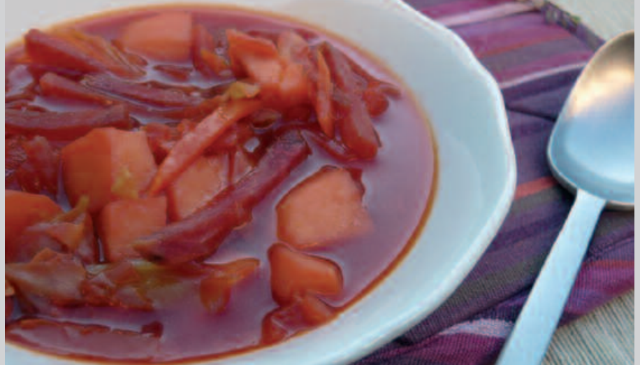
ERREZETA EGOKIA, EGUBERRI HAUETARAKO NAHI IZATERA.

Salda hotza jan nahi ezker, irabiaturako zopa 3 orduz hozkailuan edukiko dugu. Ondoren, oliba olio edo esne-gain likido