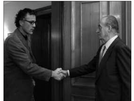
ABENDUAREN 15EKO ARGAZKIA IZAN ZEN ONDOKOA.

Usurbilgo Ezker Abertzalea udal aurrekontuen inguruan lanketa sakona egiten ari da eta horren berri dato-