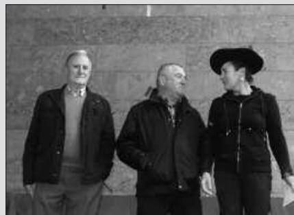
BABARRUN LEHIAKETAN, LERTXUNDI BASERRIKOENTZAT IZAN ZEN TXAPELA.