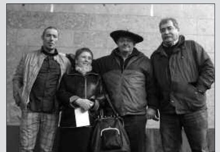
SAGARDO LEHIAKETAN, EGIOLETA BASERRIKOAK IZAN ZIREN NAGUSITU ZIRENAK.