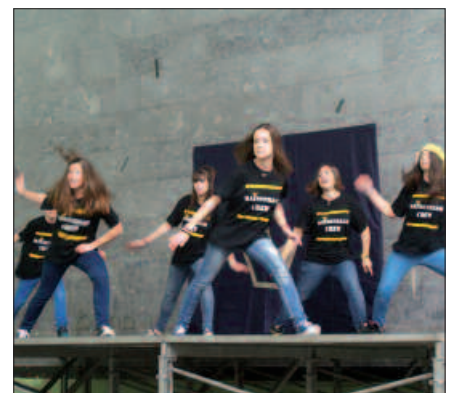
MAINSTREAM CREW TALDEAK GIROTU ZUEN JOSTAILU AZOKA.

Joan den larunbateko Jostailu Erabilien Azoka une batez eten zen, hip hop emanaldi bat ikusteko. Frontoian jarria zegoen oholtza gainean, Gaztelekuko eskutik, Mainstream Crew taldeak koreografia ikusgarri bat eskaini zuen. 15-16 urte inguruko Orio edota Zarautzeko gazteek parte hartzen