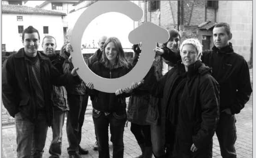
“EZINA EKINEZ EGITEN DELA IKUSI AHAL IZAN DUGU” DIO GZZ-K.

Pozarren hartu eta txalogarritzat jo berri du Gipuzkoa Zero Zaborrek (GZZ), joan den astean Gipuzkoako Hondakinen Konsorzioak (GHK) Zubietako errauste plantaren oinarritzko proiektua sei hilabetez etete harturiko erabakia. Eurek moratoria gisa ulertzen dutena ailegatu da, eta orain, “herritarren ongizatea lehentsi eta ingurumen osasungarri batean bizitzeko eskubidea bermatuko duten erabakiak erdiesteko garaia da”. Itxaropentsu, gogorarazten dutenez “gaur esan dezakegu, Zero Zabor proiektua Gipuzkoan gauzatzea gertuago dagoela helburua lortzetik, ez lortzetik baino” eta erraustegiak suposa dezakeen zentzugabekeria ageriago dagoela gaineratzen dute. Urteotan eginiko lanaren emaitza nabarmendu nahi izan dute prentsa ohar bidez, “berriz ere, ezina ekinez egiten dela