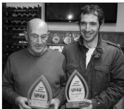
MAHASPILDEGI ELKARTEKOAK FINALERA IRITSI ZIREN.