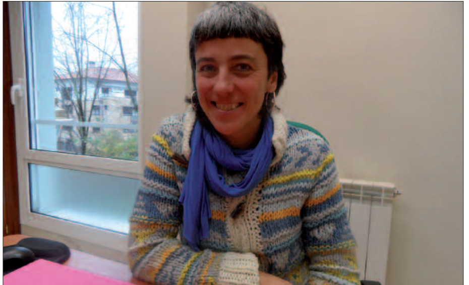
ASTEARTERO IZANGO DA SEXU AHOULKULARITZA GUNEA ZABALIK.

E. J. Udalerrri bakoitza oso desberdina da, bakoitzak bere izaera du. Niri, egia esanda, Usurbilgoa oso erronka polita iruditzen zait. Adibidez, Basaurin geure mezuak galdu egiten dira, udalerrri handia baita. Usurbil udalerrri txikia izanik, komunikazio aukera oso zuzenak dituela iruditzen zait eta horrek jendearengana asko gerturatzen gaitu. Lan ildoak antzekoak dira udalerrri guztietan; sentsibilizazioa, hezkuntza, eta aholkularitza. Baina herriak bere egiteko modua oso