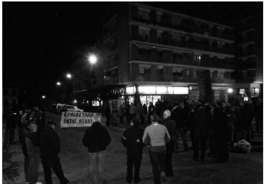
EPAIKETA SALATZEKO, ELKARRETARATZEA EGIN ZEN AURREKO ASTEAN.

tu zen mobilizazioan, azken orduetan Parisen gertaturikoaren berri ere eman zen. Antza, Fiskalak estatu espainiarrak Seguroлак estraditatzeko eginiko bi eskaerak onartzea eskatua du. Otsailaren 15ean epaileak eskaera hauek aintzakotzat hartuko balitu, Seguroлак erabaki horren aurka helegitea jartzeko aukera izango luke. Halere, horrek prozesua luzatuko lukeela adierazi zen elkarretaratzean. Bizpahiru hilabetez edo bai gutxienez, eta ezingo litzateke jakin, denbora tarte horretan aginagarria zein egoeratan gera daitekeen.