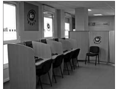
URTARRILEAN GOIZEZ IZANGO DA IREKITA KZGUNEAN.

Urtarrilak 23: Picnik, 9:00-11:00 artean.