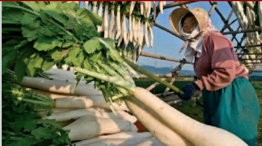
DAIKONA GORDINIK EDO PRESTATUTA JAN DAITEKE.