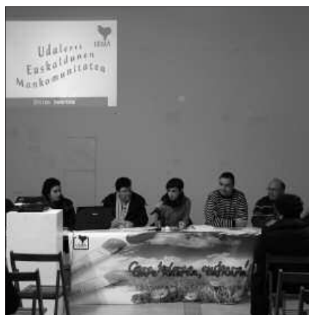
ZUMAIAN EGIN ZEN BATZARRA. USURBIL ERE UEMAN DAGO.

2012ko egitasmoaren baitan, lehentasuneko esparruak hauek izango dira: euskararen arnaguneak zein diren eta euskararen normalizazioan zer-nolako garrantzia duten gizarteratzea, udalez udal barne erabilera planetan sakontzea eta udal administrazioetatik kanpoko esparrutan eragitea. 2012ko UEMA Eguna Goizuetan izango da.