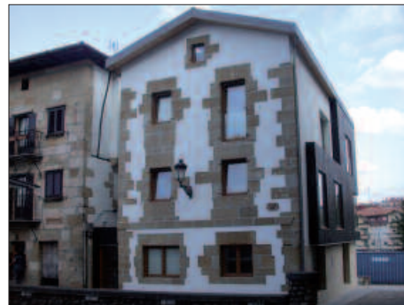
KULTURA AHOJKU BATZORDEAN IZENA ERABAKITZEN ARI DIRA ASTEOTAN.

Esanahiari dagokionez, pots edo potx asto txikiari deitzen zaio. R.M. de Azkuek bere hiru hizkuntzetako hiztegi bikainean