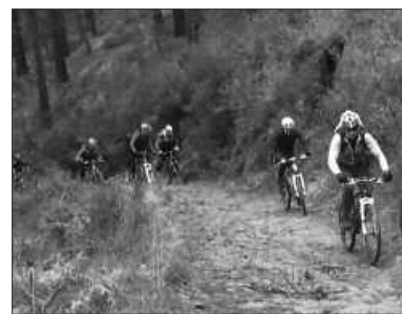
GOIZEKO 9:00ETAN ABIATUKO DIRA FRONTOITIK.

Antolatzailea: Andatza Mendizale Elkartea, BTT Taldea.