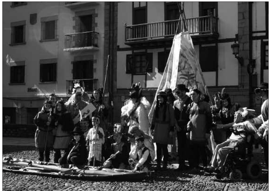
OTSAILAREN 18AREKIN EGOKITU DA AURTEN INAUTERI FESTA.

Burua nekatzen hasi eta esku lanekin hasteko garaia da beraz. Otsailaren 18an, mitologiak Usurbil hartuko du. Urtero moduan, edizio honetako gaia ere zabala da. Gertutik hasita, Euskal Herriko mitologiak hainbat pertsonaieztaz janzteko aukera ematen du; hor dugu Mari, Tartalo, basajaunak,