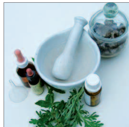
KLASEAK LARUNBATETAN IZANGO DIRA.