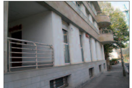
GIZARTE ZERBITZUEN BULEGOETAN DAGO AHOALKULARITZA GUNEA.

E. J. Eta inoiz ez dugu hitz egiten zer nahi dudan nik. Zer egin nahi dudan, zergatik eta legitimitate horretaz. Baizik eta non egon behar naizen, zer