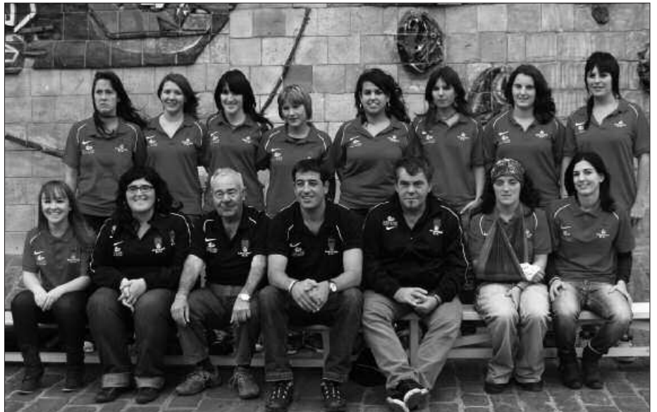
URTEBETEKO ETENALDIAREN ONDOREN BERRIZ ERE OSATU DA NESKEN TALDEA.

N. U. Urtebete eta gero kosta egin zaigu. Jendea gogoz etorri zen, futbolerako gogoia dagoela ikusten da,