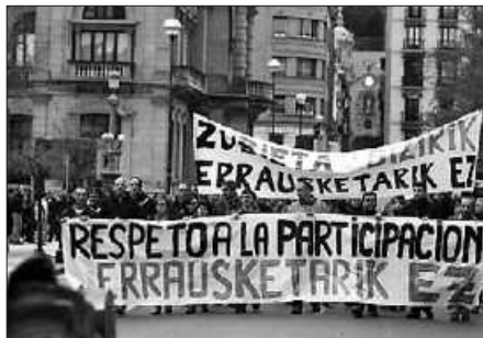
ALDERDI POLITIKO ZEIN GIZA MUGIMENDU EZBERDINEK EGIN DUTE OTSAILAREN 4KO DEIALDIA.

Besteak beste, Zubietako errauste plantako lanak eta makro-kartzela proiektua geratzea eskatzeko deitu da Donostian burutuko den mobilizazioa. 17:30ean abiatuko da Bulebarretik. Ezker Abertzalea, Aralar,