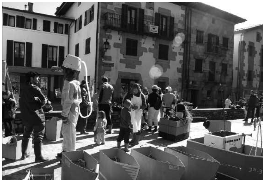
BATZUK ASPALDI HASI ZIREN PRESTAKETA LANEKIN.

Aurtengo inauteriak berrikuntzekin datoz. Larunbateko festaren baitan, Gaztelekukoak ere mozorrotzekotan dira. Euren egoitzan bertan “Ilargi-Eguzki” festa ospatuko dute 12-16 urte arteko gazteek. Ez hori bakarrik. Otsailaren 21ean, datorren asteartean, Zumarte Musika Eskolako abesbatza taldeek kontzertu sorpresa eskainiko dute Sutegiko auditorioan. Ikustekoa izango da.