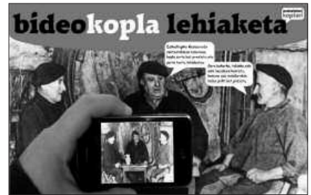
LANAK AURKEZTEKO EPEA MARTXOAREN 25EAN AMAITUKO DA.

Lehiaketa helduen euskalduntzeko zein mintzapraktika egitasmoetako edozein erakundetan dabilzan taldeei zuzentzen zaie, baina bertsolari baten laguntza eduki dezakete, hala eskatuz gero. AEKren eta Bertsozale Elkartearen arteko hitzarmenari esker, Euskal Herri osoko bertso-eskolak prest egongo baitira euren laguntza