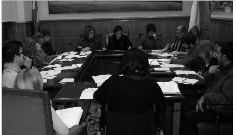
SOILIK BILDUREN BABESA JASO ZUEN UDAL AURREKONTU PROIEKTUAK.

Diru partida nagusien artean, aipatze-koa bestalde, Mikel Laboa plaza frontoi atzeraino oinezkoentzat izateko burutuko diren lanen bigarren fasea. 153.000 euroko diru partida aurreikusitako gobernu taldeak, egitasmo honetarako. Herri merkataritza sustatzea izango du helburu.