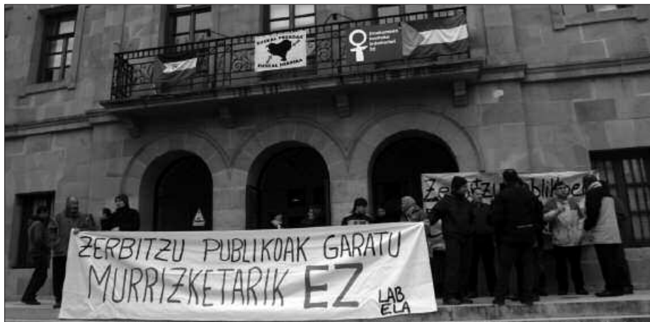
UDAL LANGILEAK ELKARRETARATZEA EGIN ZUTEN UDALETXE AURREAN.

Udarregi Ikastola edota Usurbilgo Udaleko langile eta Bilduko hautetsiek lan uztearekin bat egin zuten. Greba deialdia nabaritu zen baita, anbulatorioan edota gutxieneko zerbitzuak eskaini zituen EuskoTrenen ere. Ondoko irudian, udal langileek goiz erdian udaletxe aurrean burutu zuten elkarretaratzea, "zerbitzu publikoak garatu, murrizketarik ez" lemapean. Eguerdian partean, manifestaldi bana burutu zen Hego