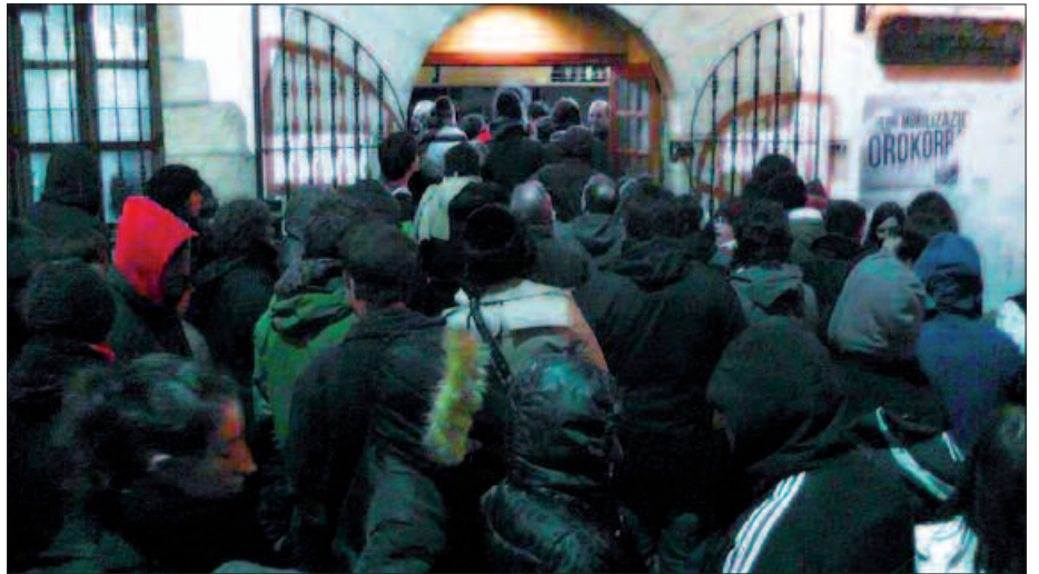
IREKI BERRI, AITZAGARA SARTZEKO GOGOZ ZIREN HERRITAR ASKO.