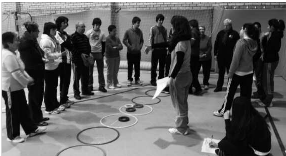
EKIMEN HONI ESKER, ELKAR EZAGUTZEKO AUKERA IZAN ZUTEN.

Ezohiko topagune baten irudia da, aldamenean ageri dena. Gutxitan ikusi ahal izan dena; belaunaldi desberdinetako herritarrak ekimen baten inguruan bildu eta parte hartzen. Usurbilgo belaunaldien arteko elkar ezagutza bultzatzea zuen helburu, Udarregi Ikastolatik biderratu zuten ekitaldiak. Baina ez hori bakarrik. DBH 4.mailako ikasleak izan ziren goiz pasa horretako antolaketa lan guztia