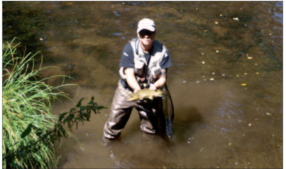
TXIKITATIK DATORKIO ARRANTZARAKO ZALETASUNA.

V. G. Laster jokatuko ditut sailkapenerako txapelketak; martxoaren 3an Leitzaranean, apirilaren 1ean Araxesen, eta apirilaren 14an Leitzaranean berriz, baina Leitza aldean. Seigarren postuan sailkatu