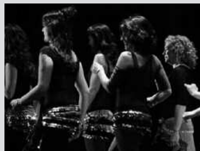
SUTEGIN IZANGO DA SABEL DANTZA EMANALDIA, 17:00ETAN.

Sabel dantza ikasten dabiltzan Usurbil, Orio eta Zarautzeko taldeek emanaldia eskainiko dute otsailaren 25ean. Sutegiko auditorioan izango da, arratsaldeko 17:00etan hasita.