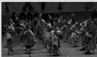
DESFILEA ETA GERO KIROLDEGIAN ARITUKO DIRA.