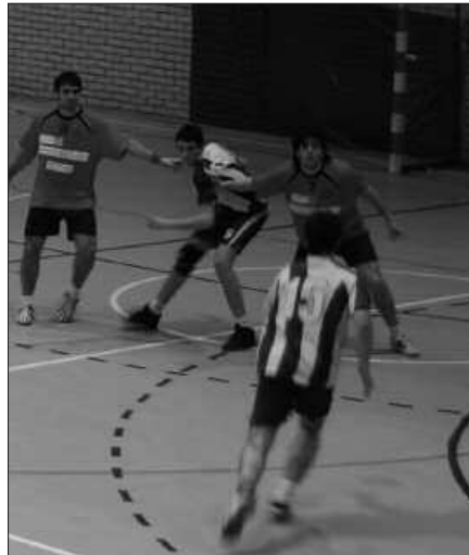
KIROLDEGIRA GERTURATZEKO GONBITEA LUZATU ZAIE ZALETUEI.

U surbil Kirol Elkartetik asteburuan Kiroldegira gerturatzeko gonbita luzatzen diete herritarrei, datorren jardunaldia erabakigarria izango baita seniorren 2.nazional mailako eskubaloi taldekoentzat. Horregatik aipatu kirol elkartetik, "zaletuei eta orokorrean usurbildar guztiei harmailak betetzeko dei bat egin nahi genieke, lau puntu garrantzitsuok Usurbildik alde ez egitea lortzeko". Bi neurketa jokatu dituzte; lehenengoa larunbat arratsaldean, eta bigarrena, datorren asteartean, elurragatik atzeratutako neurketa da, hilaren 21ean izango dutena.