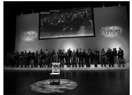
OTSAILAREN SEAN AURKEZTU ZEN DONOSTIAKO KURSALEN HERRIRA IZENEKO MUGIMENDUA.