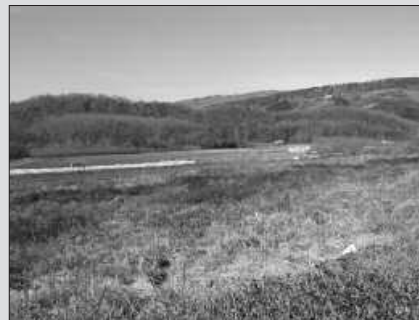
TXAGAÑETA, AGINAGAKO ERRIBERAN DAGOEN SEKTOREA.

2011ko maiatzaren 17an udalbatzak harturiko akordioa ezeztatua geratu da beraz. Honenbestez, jendaurrean egon zen epean, iazko akordioaren aurka 12 lagunek aurkezturiko helegitea ere ain-