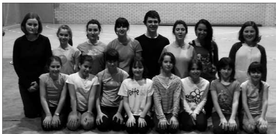
TXIMELETAKO KIDEEK GOGO HANDIZ PRESTATU DUTE LARUNBATEKO TXAPELKETA.

Desfilea goizeko 9:50ean hasiko da eta alebin lehiaketa 10:00etan abiatuko da. Infantil-kadete mailako lehiaketak, aldiz, 12:20ean hasiko dira.