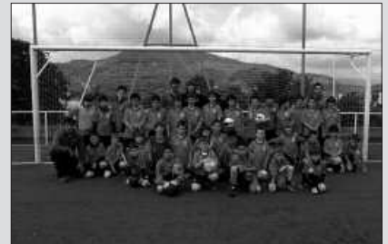
NAHIKOA JENDE ANIMATU EZ DENEZ, BERTAN BEHERA GERATU DA.

U surbil FT-koek Aste Santurako antolatu asmo zuten bidaiak bertan behera geratu da. Kirol taldeetik berri eman dutenez, nahikoa jendek ez du izena eman eta aipatu moduan, bidaiak ez egitea erabaki dute.