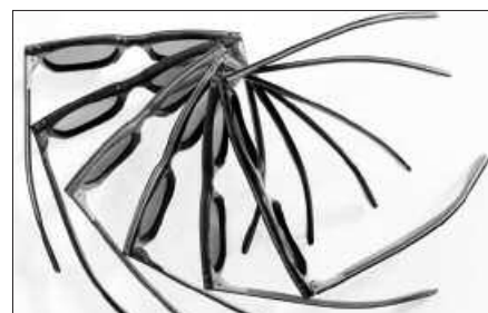
BETAURREKOAK SAHARARA BIDALTZEKO KANPAINA MARTXAN DA.

Kanpoko Erakundearen bidez. Optikatik azpimarratu dutenez, betaurrekoak puskatuta izanagatik ez bota erreusaren poltsara, lenteak adibidez aprobeitza daitezke eta. Usurbil Optika ordutegi honetan dago zabalik: astelehenetik ostiralera, goizez 9:30-13:30 artean eta arratsaldez, 17:00-20:00 artean. Larunbat goizetan aldez, 10:00-13:30 artean.