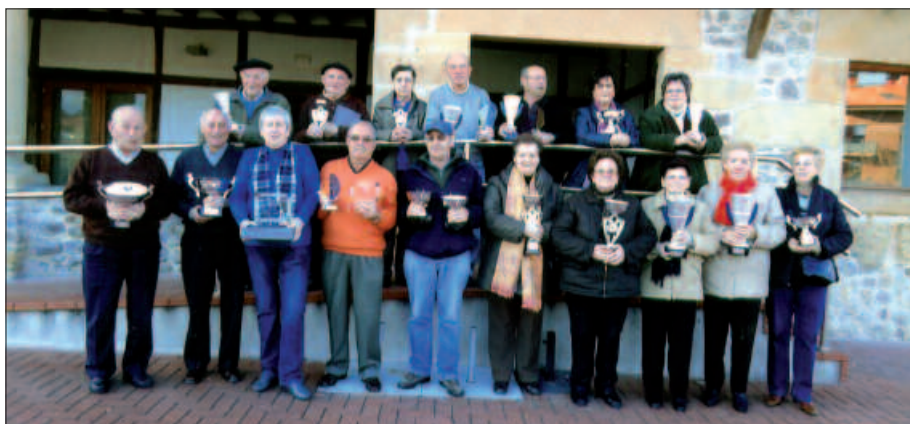
TXAPELKETAN SARITUTAKOAK, ARTZABALEN EGINDAKO ARGAZKIAN.