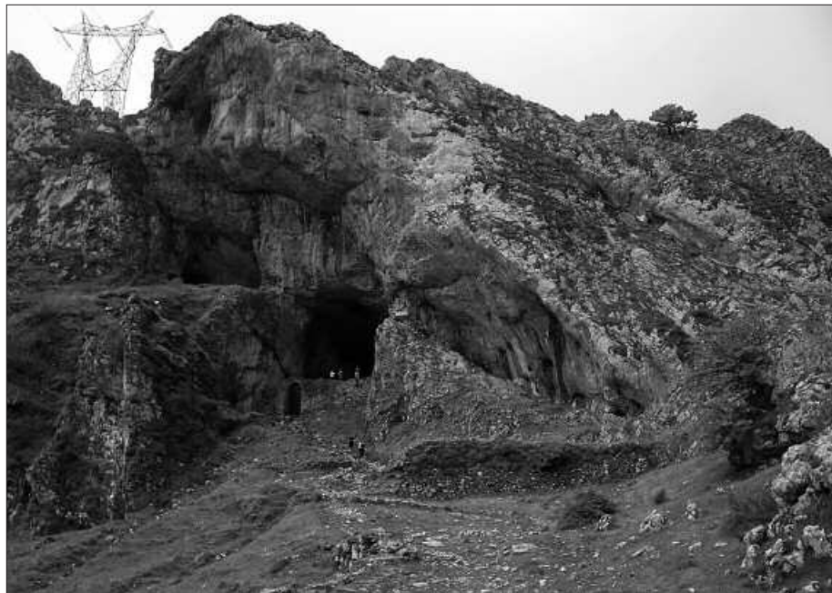
SAN ADRIANGO TUNELETIK IGAROKO DIRA.

Andatza Mendizale Elkartek antolatzen dituen ekitaldietako eta irteeretako federatuen istripuak, mendi federazioko aseguruak babesten ditu. Gainontzeko partaideen aseguruaren beraren ardura da.