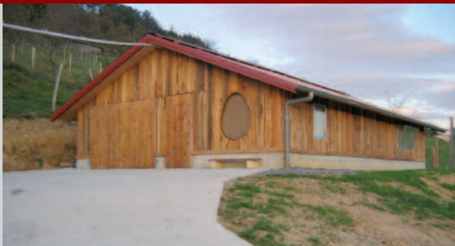
LEKUKO LUR ETA ZERU ENERGIAK HARMONIZATUZ ERAIKI DA OILATEGIA.

an, zuhaitz bat landatzean, lurra goldtzean edota mailetan gure ortua osatzean, bertako energiaren kalitatean eragiten dugu. Oilategiaren estetika polit zainduak, eraikuntza materialen ezaugarriek eta eguzki izpien kontrolak oilategi barnean sortzen duten giro xamurraz gain, nork daki Jexuxen oiloek ematen dituzten oskol gogor, zuringo likatsua, gorringo krematsu eta zapore findun arrautzak ez dituen lekuko