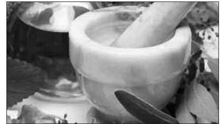
IZENA EMAN BEHAR DA AURRETIK.

Urtebetez, 1.000 euro jasotzeko aukera zozketatu du AEK euskaltegiak. Saria otsailaren 29ko ONCE-rekin atera zen;