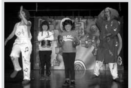
"MUSIKA TRESNEN FABRIKA" IKUSKIZUNAREN IRUDIA.

Nafarroako Garinoain udalerrikoen Musika Bandaren kontzertuarekin amaituko da Soinurbil. Egunez eguneko egitarau eta ekintzen inguruko informazio zehatza, datorren martxoaren 16ko astekarian.