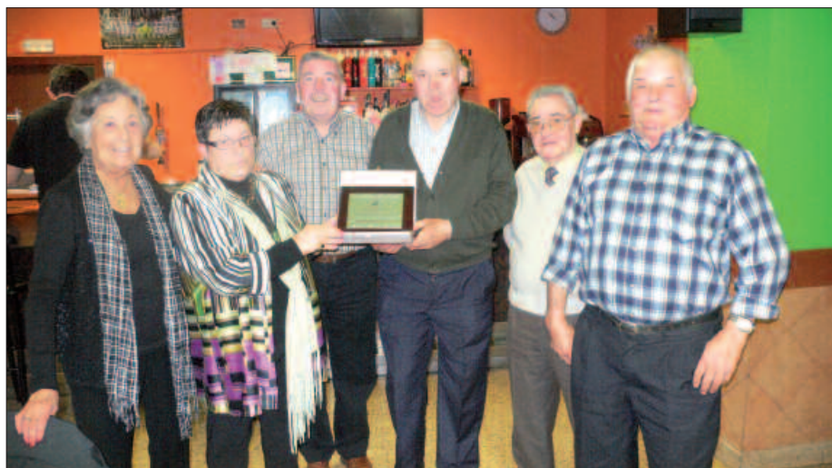
BAZKARI AMAIERAN HAINBAT OROIGARRI BANATU ZIREN.

Hasteko, joanak diren bazkideak omentzeko meza nagusian bildu ziren. Gero, urteko balantzea aurkeztu zuten. Eta azkenik, mende laurdena ospatzeko bazkari baten bueltan eseri ziren guztiak, Arrateko egoitzan bertan. Tabernakoek prestaturiko otordu eder bat dastatu ahal izan zuten hitzordura gerturatu ziren 50 lagun inguruk, guztiak ere giro ederrean. Bazkari amaieran, Arrateko zuzendari-