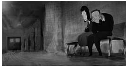
"ZEINEK GEHIAGO IRAUN" LABURMETRAIAREN IRUDIA.

Topagunea Euskara Elkartearen Federazioak Laburbiraren bederatzigarren edizioa aurkeztu zuen aurreko astean, Donostian. Euskarazko ikus-entzunezkoen arloan, urteko produktioa ezagutarazi eta herrietako kultur eskaintza aberasteko helburua duen zirkuitua urtero antolatzen du Topaguneak, herrietako Euskara Elkarteekin lankidetzan. Usurbilen,