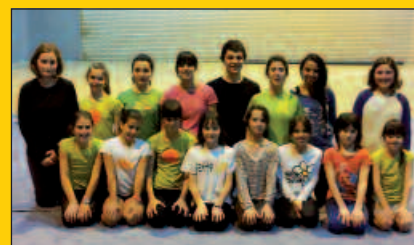
Tximeletako kideak Udaberri Txapelketan arituko dira