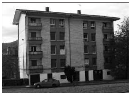
AZKEN OSOKO BILKURAN HARTU ZEN ERABAKIA.

Bilduk, Aralarrek, EAJ-PNV-k eta PSE-EEK babestu zuten proposamena, Hamaikabatek aurka bozkatu zuen.