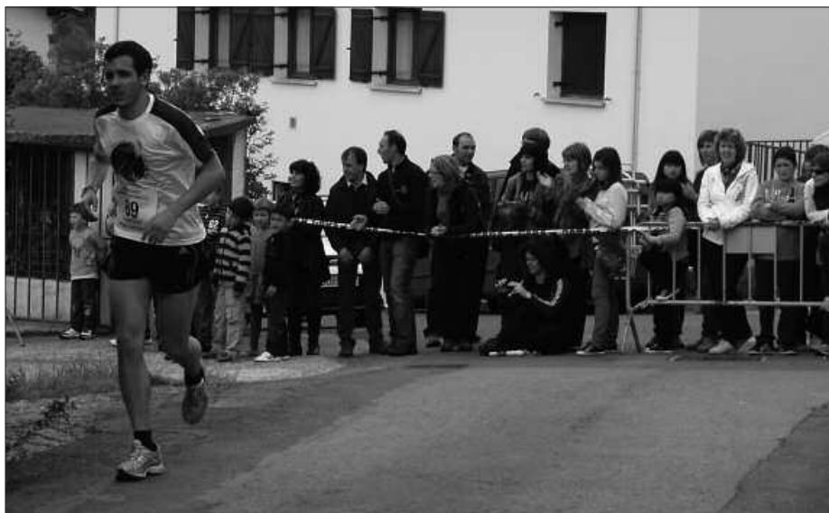
10:30EAN ITXIKO DA IZEN-EMATEA. INTERNETEZ ERE EGIN DAITEKE.

Ordubete lehenagotik 15 euro ordainduta, mendi aldeko lasterketa honetan parte hartu ahalko da. Edo bestela, aldeztu aurretik, 10 euroren truke herrikrossa.com web orrialdean sartuta.