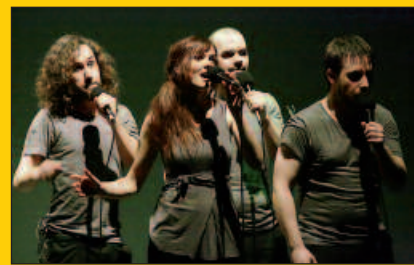
Demode Quartet-en umorea, Soinurbil Musika Astean