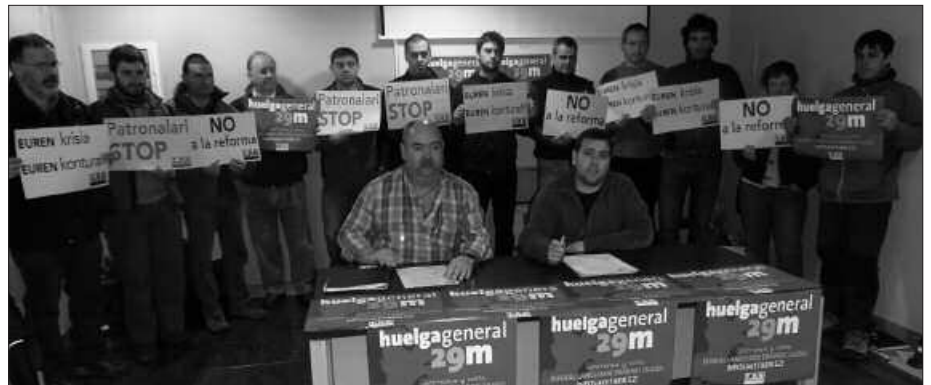
ELA-K (GOIAN) ETA LAB-EK (BEHEAN) ABERRALDIAK EGIN DITUZTE EGUNOTAN.

razi zutenez. “Lan eta gizarte eskubideen aurka eginiko erasorik bortitzena da!”, diote ELA-tik. Gizartea izutu eta urtetan lorturiko eskubideak kentzeko krisiaren aitzakia baliatzen ari direla diote. Gaineratu dutenez, “gezurra da eskubideen murrizketak direla, krisiari aurre egiteko bide bakarrak”. Eta ohartarazten dutenez, etorkizunean murrizketa gehiago izango dira.