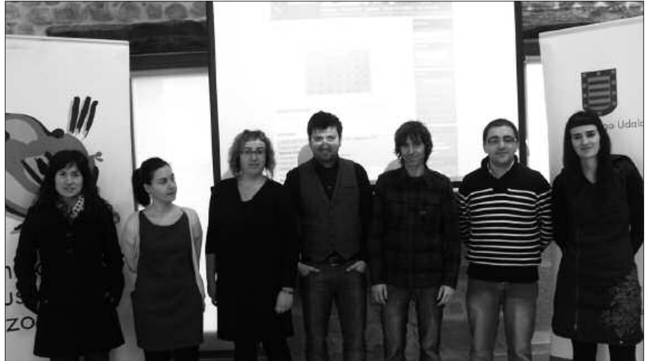
POTXOENEA AURKEZTU ZUTEN AGENDA BATERATUA.

Modu horretan, sarean eskualde osoko ekitaldi eskaintzaren berri jaso daiteke.