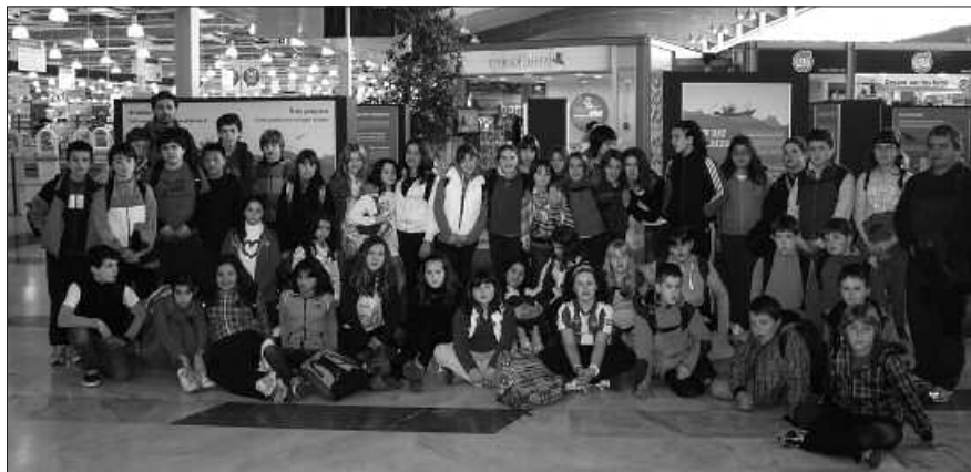
AURREKO OSTIRALEAN IZAN ZIREN URBIL-EKO ERAKUSKETAN.

azken egunean, Udarregi ikastolako ikasleak izan ziren bisitan. Erakusketa bi astez egon da Urbilen eta bisitari ugari izan ditu. Arrantza sektorea herritarrengana hurbiltzea zen kanpaina honen helburua.