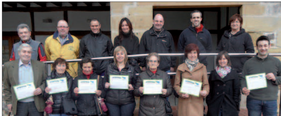
ZOKKETAN SARITUAK IZAN DIREN HERRITARRAK ETA HAINBAT DENDARI.

Urtarrilaren 28tik otsailaren 4ra luzatu zen kanpainaren baitan gogorarazi zenez, ontzi berrerabilgarriekin eroske-