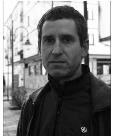
IGANDEKO EKITALDIA DEMA-PLAZAN IZANGO DA ETA KUBOAREKIN AGERTZEKO DEIA EGIN DUTE.

M. I. 300.000 gipuzkoarrek atez ate biltzen badituzte hondakinak, ez da sortuko zabor nahikoa erraustegia bideragarria izateko. Eta badu bigarren alde