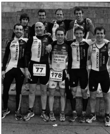
OÑATIKO TXAPELKETAN, BAXURDE TXIKIKOAK BIGARREN IZAN DIRA TALDEKAKO SAILKAPENEAN.