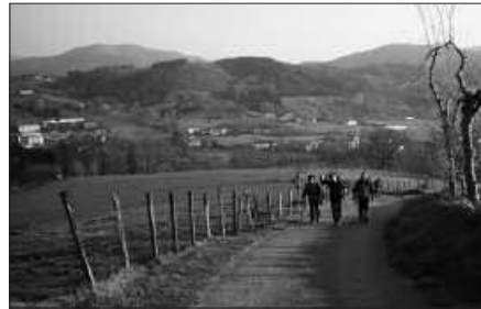
MARTXOAREN 28AN DONOSTIARA JOANGO DIRA OINEZ.

Ibilaldia Donostiara oinez Artzabaldik. 9:30ean irteera. Bazkaria Kai Alden, eguneko menua, 10 euro. Martxoaren 19rako ordaindu behar da.