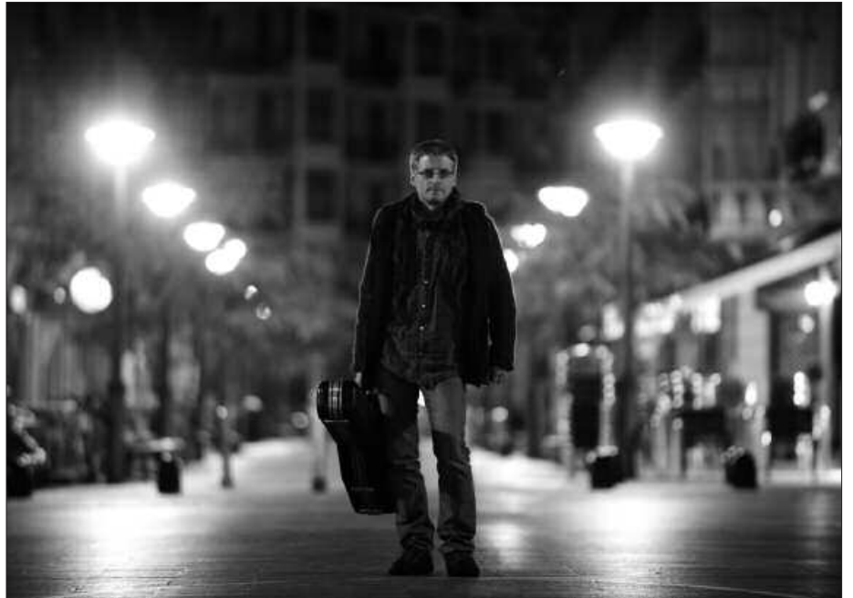
ASTEARTEAN, 18:30EAN UDARREGI IKASTOLAN IZANGO DA, KANTU TALDEAREN ENTSEGUAN.