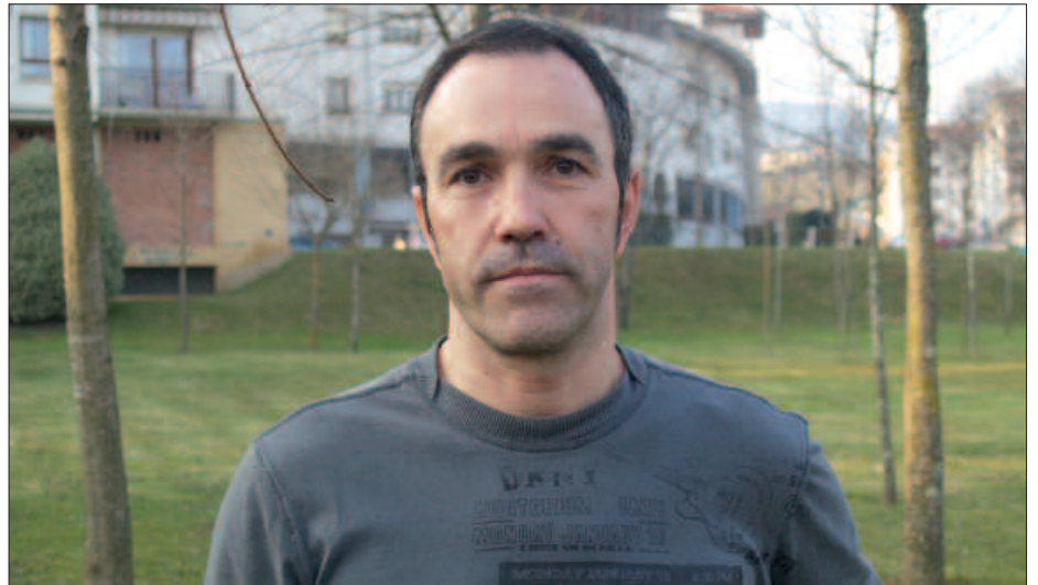
JOSEBA REZOLA GUSTURA IBILI OHI DA AGINAGAKO MENDI LASTERKETAN.

J. R. Asfalto pixka bat badu hasieran. Lehen kilometro eta erdia asfaltoan da. Dezente gogorra da, aldaparekin hasten baita. Aurreneko aldia duenak, lasai hasi dadila. Bi edo hirugarren kilometrotik aurrera hor bai pikea hasten dela.