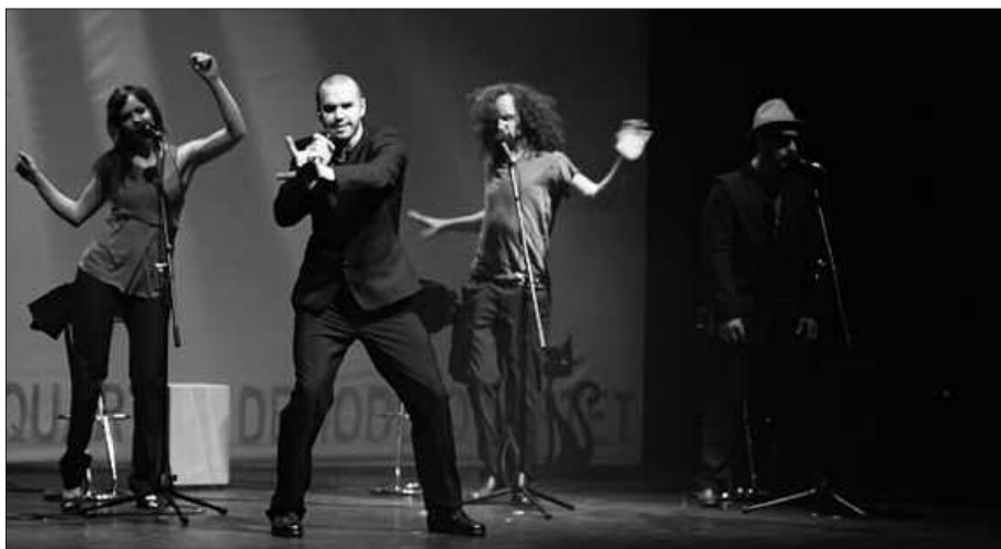
MUSIKA ETA UMOREA UZTARTZEN DITU DEMODE TALDEAK.

Soinurbil Musika Asteari beste ikuskizun batek emango dio hasiera. "Musika Tresnen Fabrika" izenekoak hain zuzen. 10 urte arteko haurrei