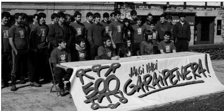
AMAIURRERA IRTEERA ANTOLATU DUTE MARTXOAREN 24RAKO.

A ndoain, Hernani, Lasarte eta Usurbilgo gazte mugimenduen bilgune berri bat aurkeztu dute Usurbilen; Jalgi Hadi Garaipenera! Buruntza. "Eskualdeko gazteen arteko harremana bultzatu asmoz" sortu da, larunbatean Dema plazan aurkeztu zuten bilgune berria. Ekitaldian gaineratu zuten, "aurten betetzen dira 500 urte Nafarroako erre- suma konkistatu zutenetik, eta horren aitzakian ere Euskal Herri mailan sortu den mugimenduan ere gure eskua luzatu nahi genuke". Horren harira, Amaiurrera irteera antolatu dute martxoaren 24rako. "Bertan, gure historia- ren parte bilakatu den gertaeraren berri ematea izango da helburu modu praktiko batean, astean zehar herri bakoitzean