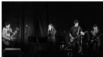
IRUDIAN, URREZKO MUSKERRAK.