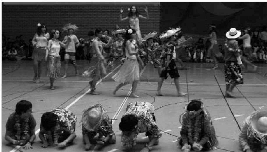
DANTZA IKUSGARRIAK EGIN ZITUZTEN KIROLDEGIAN.

Lehen aipatu bezala, ikuskizun hau izan zen ikusleek gehien gozatu zutena, gurasoek batez ere, ikasleek dantza egiteko hautatu zuten kantua oso ezaguna