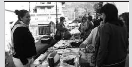
TXOKOALDEN EGINGO DA, GOIZEKO 10:00ETAN HASITA.

M artxoaren 25ean igandea, goizeko 10:00etatik aurrera zabalduko dute Txokoalden, salerosketarik eta dirurik erabiliko ez den azoka. Trukea, eta herritarren arteko tratua nagusituko dira bertan. Ohi bezala, jai giroan burutuko da Trukalariak taldeek antolaturiko ekimena.