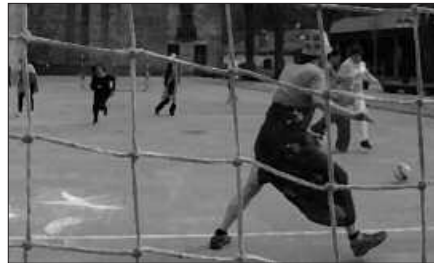
40 EUROTAN DA IZEN-EMATEA.

Bestalde, gogoratu nahi da herri mailako txapelketa izanik "herritarren parte-hartzea eta giro ona bultzatzea dela gure helburua, beraz, askotan izaten diren sarrera gogorrak ekiditea nahi dugu. Liskarrak utzi norbere etxean!".