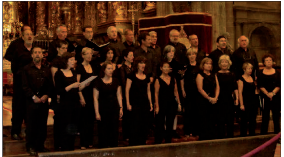
LARUNBATEAN SALBATORE ELIZAN IZANGO DIRA DONOSTI-ERESKIKO KIDEAK.

Martxoak 23, ostirala: Demode Quartet 20:30ean, Sutegiko auditorioan. Sarrerak: alde aurretik 6 eurotan Oiardo Kiroldegian. Egunean bertan, 8 euro lehiatilan.