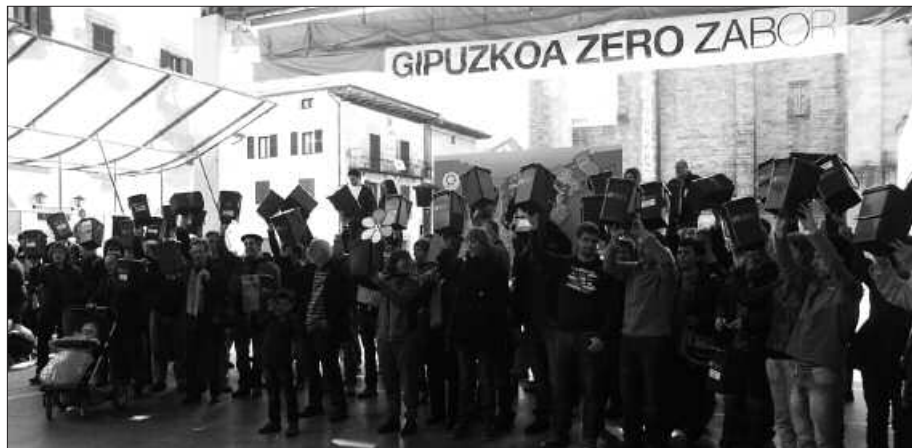
ATEZ ATEKOARI BABESA EMAN ZIOTEN, HIRUGARREN URTEURRENEAN.

M artxoaren 16an hiru urte bete zituen atez ateko bilketak. Urtemuga ospatzeko ekitaldia antolatu zuen Gipuzkoa Zero Zabor bilguneak, joan den igande eguerdian. Atez ateko bilketa egiten duten udalerrietako, eta 2013tik aurrera sistema bera martxan jarri asmo duten 34 udalerrietako herritarrak bildu ziren frontoian. Usurbildarren eskutik, zorionak, eskerrak eta animuak eman zitzaizkien zero zabor norabidearekin bat egin asmo duten udalerriei. Eta udalerriotatik, eskertu egin zuten, "hondakinen arazoa konpontzeko bidea erakutsi diguzuelako". Udalerrien mugekin zehazturiko Gipuzkoako mapa bat koloreztatu