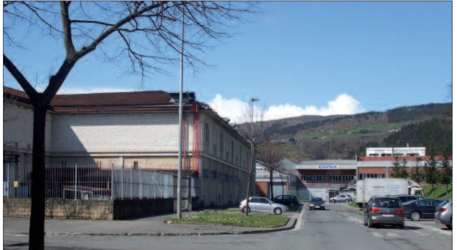
USURBILGO UDALBATZAK AHO BATEZ ONARTU ZUEN ESKUALDE MAILAKO LANKIDETZA HITZARMEN HAU SINATZEA.

Lankidetzak honen baitan, honako lan ildoak jorratzea aurreikusia dago: garapen lokalerako plan estrategikoak prestatzea, eskualdeko Behatoki Sozioekonomikoa martxan jartzea, enpresa berriak jartzeko azpiegiturak bultzatzea, jarduera ekonomikoak sus-