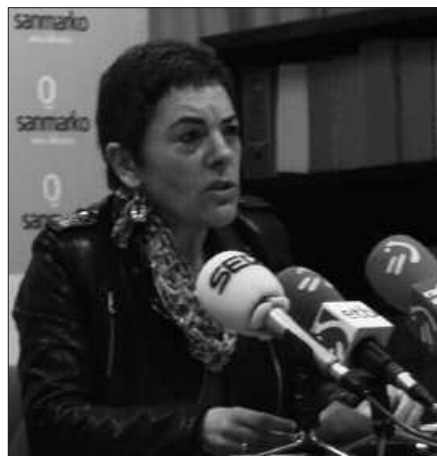
SAN MARKON ESKAINI ZUEN PRENTSAURREKOAREN BIDEA WWW.NOAUA.COM ORRIAN IKUSGAI.

Duela hiru urte atez atekoa abiatu zenetik, hondakinak birziklatzeko beste hainbat aurrerapauso eman dira Usurbilen. Tartean, alkateak gogorarazten zuenez, “Urbil merkataritza guneko eta poligonoetako hondakinak ere gaika biltzen” hasi baitziren 2010ean. Horrek gaikako bilketa ia %89ra igotzea ekarri zuen Usurbilen. “Zifra horietan mantentzen gara gaur egun eta 2011ri dagokionez, %88,8 batera iritsiko garela aurreikusuten dugu”, iragartzen du alkateak.