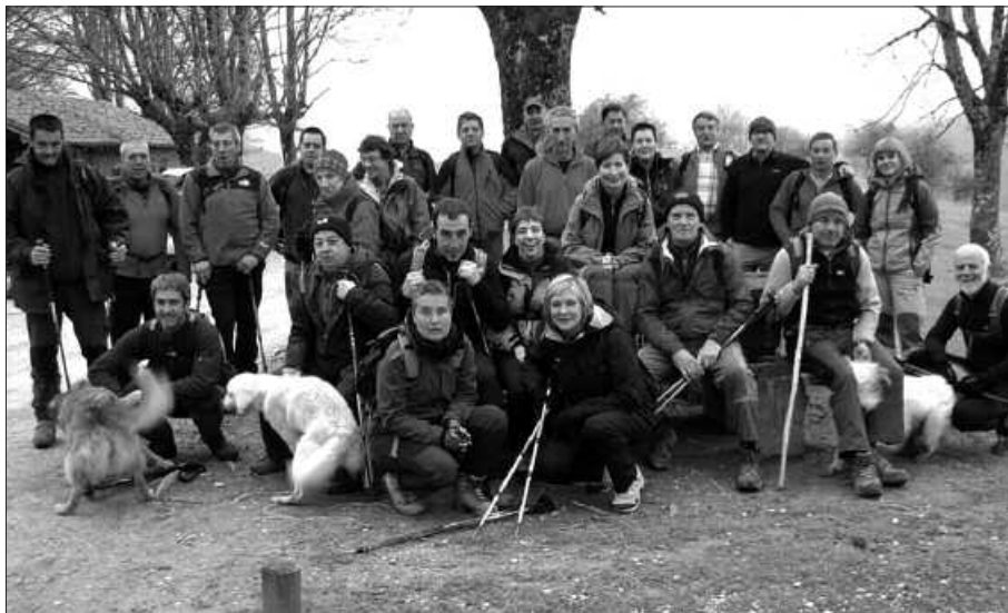
26 LAGUN ELKARTU ZIREN ARATZ MENDIRA EGIN ZUTEN IRTEERAN.

patu behar izan genuen elurra, ez ziren oztopo izan aurreikusitako bidari jarraitzeko, eta pausoz pauso Aratzeko gailurra zanpatu ahal izan genuen”, handik bueltan igorri diguten kronikan diotenez.