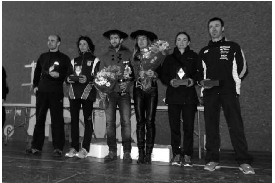
LASTERKETA IKUSTERA HURBILDU ZIREN GUZTIAK HAMAIKETAKOAZ GOZATZEN ZUTEN BITARTEAN EGIN ZEN SARI BANAKETA.