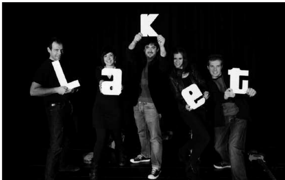
KANTU-JIRA ETA KANTU-AFARIAREN ONDOREN, FRONTOIAN KONTZERTUA EGINGO DA. BESTEAK BESTE, LAKET TALDEKOAK ARITUKO DIRA.

Kantu afaria ere ospatuko da egun berean. Honako menua dastatu ahal izango da Artzabalen: espinaka eta ganba pudina; bakailu takoa saltsan; basurde gisatua; flana izozkiarekin; edaria (urteko ardoa, sagardo), ogia eta kafea. Prezioa: 22 euro. Txartelak salgai, Bordatxon eta Artzabalen.