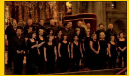
Larunbat honetan, Donosti-Ereski abesbatza