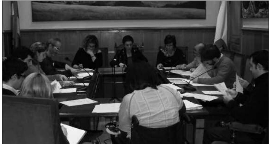
MARTXOAREN 16KO EZ OHIKO BILKURAN HARTU ZEN ERABAKIA.