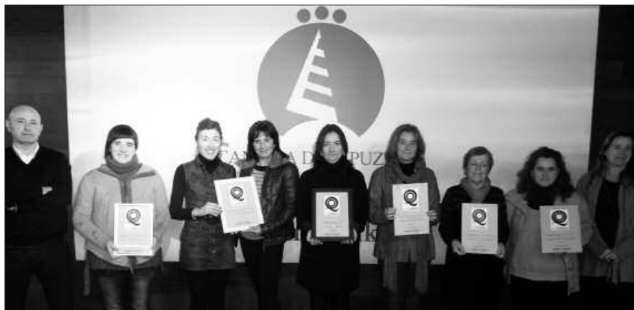
GIPUZKOAKO MERKATARITZA GANBARAN JASO ZUTEN KALITATE AGIRIA.

A lkartasuna Usurbilgo Baserritarren Kooperatibak, Lizardi liburu dendak, Lurdak, Otar-Goxok, Paumak eta Usurbil Optikak UNE 175001 Kalidenda ziurtagiria eskuratu dute, bezeroei eskaintako zerbitzua kalitatezkoa dela bermatzen duten ziurtagiria hain zuzen. Modu honetan borobildu da, Hurbilago Usurbilgo Merkataritza eta Ostalarien Elkarteak sustatu eta Gipuzkoako Merkataritza Ganberarekin saltokiok elkarlanean egin duten ibilbidea.