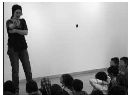
IXABEL AGIRRESAROBEEK EMANALDIA ESKAINIKO DU 17:00ETAN.

Izen ematea: martxoaren 29ra arte. Aste Santuko oporraldia igarota, tailerrak izango dira (eguneko 3 euro). Argibide gehiago, Antxomolantxakoekin harremanetan jarriz edo telefonoz: 610 875 287.