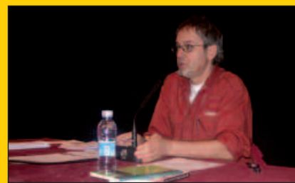
Hitzaldi sorta prestatu du Nafartarrak taldeak