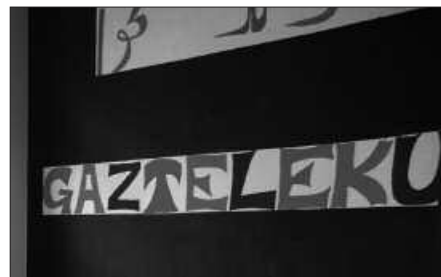
ZIORTZA ETA GAZTELEKUAREN ARTEAN ANTOLATU DA GAZTE EGUNA.

Laguntzaileak: Hitz Aho Udaregi Ikastolako Guraso Elkartea.