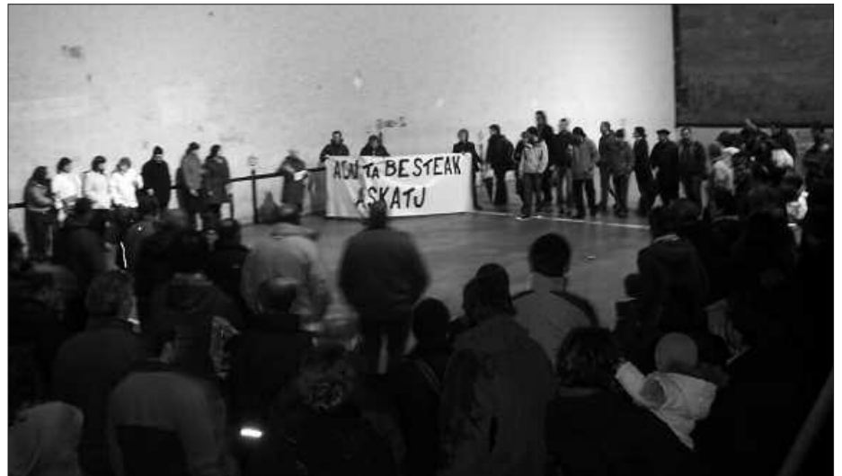
ATXILOTU ZUTEN EGUNETAN MANIFESTAZIO JENDETSUAK EGIN ZIREN.

A. S. Damoklesen ezpata gainean duzula sentitzen duzu. Honetan guztian gogorrena eta gaitzitzen zailena, atxilotetako unea izan da. Hartzen duzun sustoa, beldurra, itzela da. Ezin da hitzez azaldu. Soilik egoera hori bizitu duenak daki zertaz ari naizen. Esaterako, gau asko eman ditut lokartu ezinik, edozein zarata txikirekin esnatzen nintzen, eta gauean gerta daitezkeen soinu guztiak ikastera iristen zara. Orain askoz lasaia nago, ume bat izateak ere hori dena ahazten laguntzen dizu. Gainerakoan, orain-