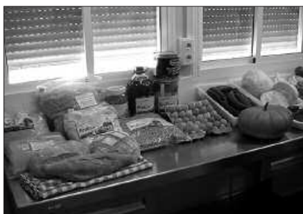
APIRILAREN 23AN HASIKO DA BAINA IZENA AURRETIK EMAN BEHAR DA.