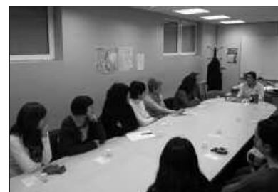
AEK-KO BULEGOETAN EGIN ZEN IKASTAROA.

P asa den astean izan zen saioa eta Etumeta AEK euskaltegian egin zen. 18 pertsonek hartu zuten parte.