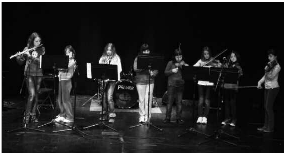
ZUMARTEKO IKASLEAK, "EZER EZ DA BETIKO" KANTUA JOTZEN.

Soinurbilek batu zituen Loatzo eta Zumarte Musika Eskoletako ikasleak. Urtero egiten dute elkar-truke moduko eguna. Eta aurten, Tolosaldekoak izan dira Usurbil aldera gerturatu diren ikasleak. Sutegin aritu ziren elkarrekin, Loatzokoak eta Zumartekoak, martxoaren 22ko arratsaldean. Leporaino bete zen auditorioa eta ikusleek, tartean gurasoak eta lagunak, txalo zaparrada batekin eskertzen zuten saio bakoitza. Baina ikasleen saioez gain, bestelako ikuskizunekin gozatzeko aukera izan da aurtengo edizioan.