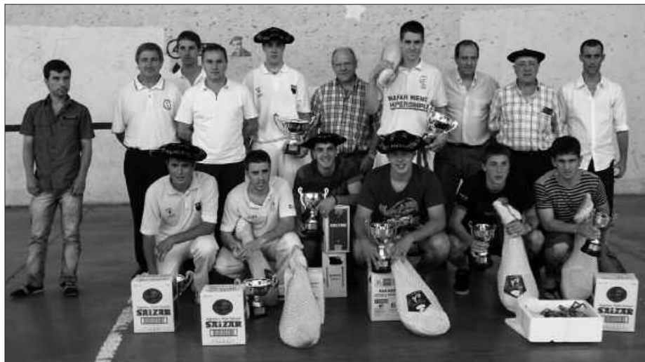
IAZKO FINALISTAK ETA GARAILEAK, JUBENIL ZEIN NAGUSIEN TXAPELKETETAN.