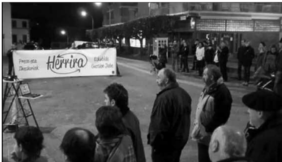
OSTIRALEAN, ELKARRETARATZEA IZANGO DA MIKEL LABOA PLAZAN, 20:00ETAN.

Larunbat honetarako, kantu afaria ere antolatu da Artzabalen. Kasu honetan, txartelak 22 eurotan erosi ahal izango dira Bordatxon eta Artzabalen. Menua hau izango da: espinaka eta ganba pudina; bakailu takoa saltsan; basurde gisatua; flana izozkiarekin; edaria (urteko ardoa, sagardoa), ogia eta kafea.