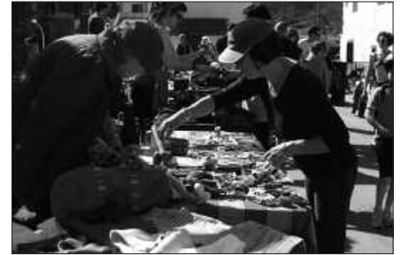
JENDEA BILDU ZEN TXOKOALDEN EGIN ZEN TRUKE AZOKAN.

Usurbilgo Bigarren Eskuko Azoka, apirilaren leian ospatuko da, 10:00-