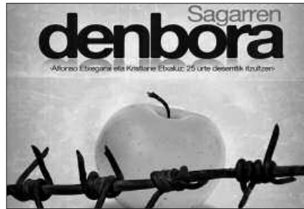
APIRILAREN 15EAN SUTEGIN.