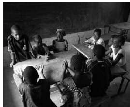
ELIKAGAIAK BILTZEN ARI DIRA KATEKESIKO 6. MAILAKO IKASLEAK.

Aipatu moduan, oinarrizko elikagaiak ordu eta lekuotan utzi ahal izango dira asteburuan.