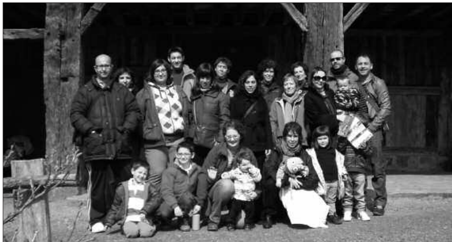
MARTXOAREN 18AN IGARTUBEITIN IZAN ZIREN.

U surbilgo Etumeta AEK Euskaltegitik bidali digute aldameneko argazkia. Eta argazkiarekin batera, kronikatxo hau. "Martxoaren 18an Usurbilgo Mintzalagun taldeetan biltzen garenok Igartubeiti baserria bisitatu genuen. Bertan garai bateko bizimodu eta tolarre erraldoia ikusi ahal izan genituen. Ondoren Zumarragako Antigua baseliza izan genuen jomuga. Eguraldiaren laguntza handirik izan ez bagenuen ere, etxera itzuli aurretik, hamaiketako egiteko aterruna izan genuen".