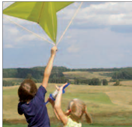
LAGUNTZA PREMIAN DIREN HAURREN KOPURUA UGALDU EGIN DA.

N. Harrera familiaren premia uste baino handiago al da?