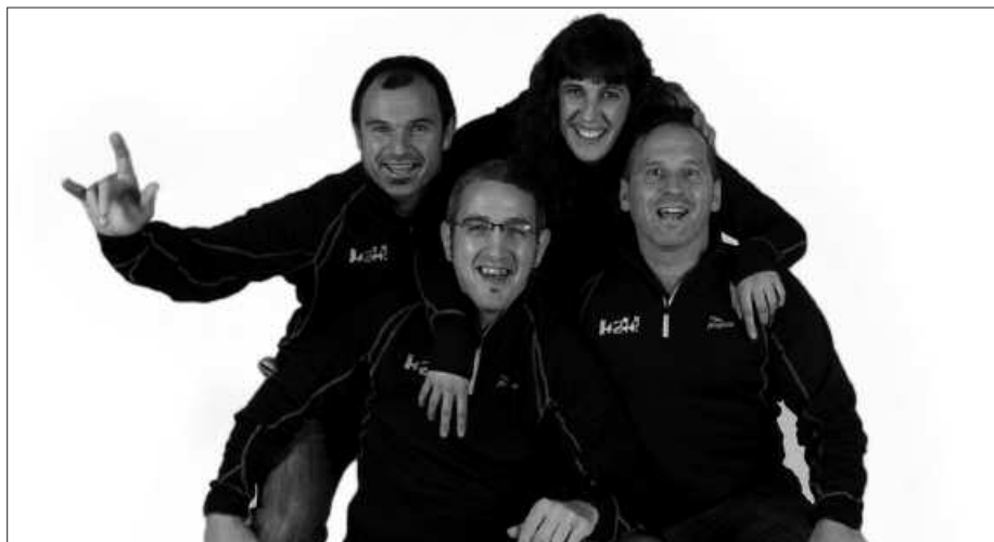
100 KILOMETRO OSATU BEHAR DITUZTE ELKARTASUN LASTERKETA BATEAN.

eltxetxo bana jarria dugu. Ideia da, jendeak gure erronka zein den ezagutzea eta kolaboratzea. Bestalde, geure blog-ean edo probaren web orrian jendeak ekarpenak egin ditzake.