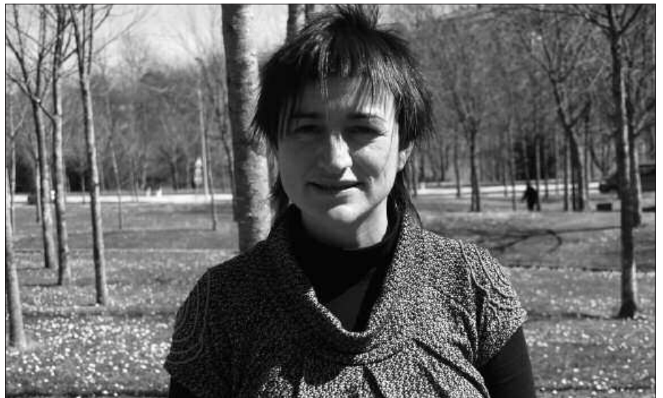
APIRILAREN 30EAN HASIKO DA EPAIKETA AUDIENTZIA NAZIONALEAN.

A. S. Euskal Herriko hiru milioi biztanleentzako demokrazia aldarrikatzen zuen eskaintza elektoralak da epaituko dena. Demokrazia formalaren zutoinak diren oinarrizko eskubideak epaituko