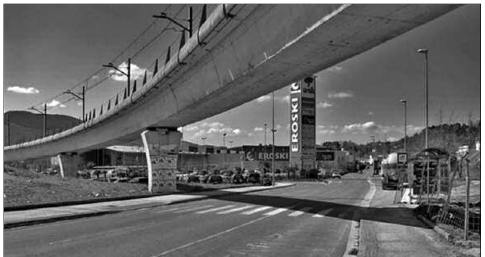
IRAKURLE HONEK ARGAZKI HAU IGORRI DIGU, KEXUAREKIN BATERA.

I rakurle batek, e-posta bidez, honako argazkia eta honako testua bidali digu. "Zebrabide hau pasa behar dugunok arrisku bizian aurkitzen gara batzuetan, kotxeek ez baitute zebrabidea errespetatzen, eta batez ere Errekaldetik datozenak abiadura bizian doazelako. Behar bezala pintatuta eta errepidean koxkak jarrita, ez al litzateke arriskua murriztuko?". Horra iradokizuna.