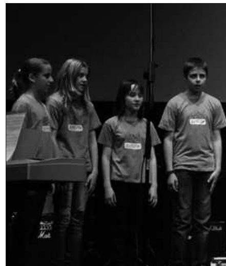
4 URTEK GORAKO EK EMAN DEZAKETE IZENA.

no zenbakira deituta jaso daiteke: 943 37 15 94.