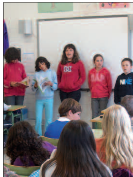
BELDURREI AURRE EGITEN ETA JENDAURREAN ABESTEN IRAKASTEN ZAIE, BESTEAK BESTE.

Hor ikusten delako batzuk gusturago ibiltzen direla beste batzuk baino, batzuk zaletasun edo ofizio dutela berez beste batzuk baino. Gaur egun, Gipuzkoa osotik 11.000 inguru ikaslerengana iristen bagara, zenbat ale bertso eskoletarara biderratu daitezkeen. Eta bertso eskola horietatik, etorkizunean ateratzen joango dira, zaleak, antolatzailleak, gai jartzaileak, bertsolariak... Denetarik.