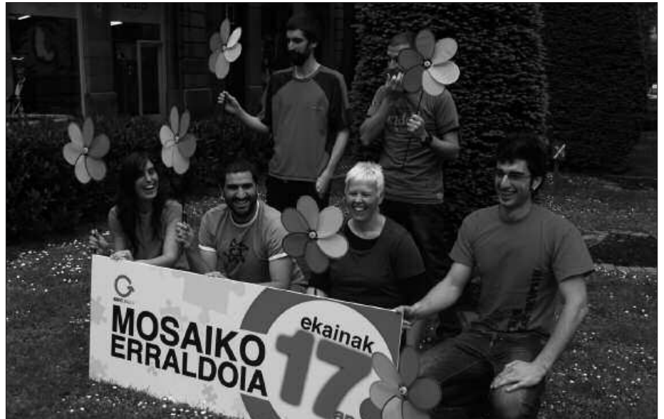
EKAINAREN 17AN EGINGO DA DONOSTIAKO SAGUESEN.

Ekainaren 17ko mosaiko erraldoiari zer nolako itxura eman nahi dioten, eskutan zituzten haize errotekin irudikatu nahi izan zuten. Eta modu honetan azaldu zuten, nola burutu