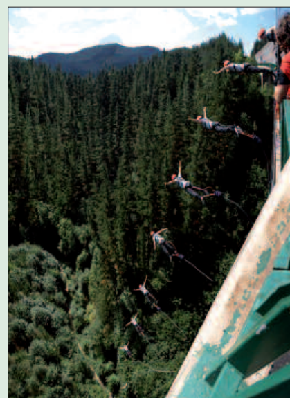
Ekainaren 9rako antolatutako dute gomasalto saioa.