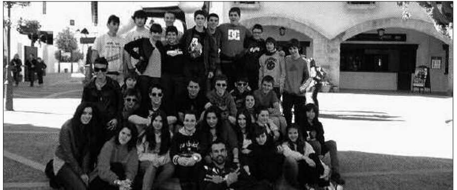
GELDITU GABE IBILI ZIREN HIRU EGUNETAN.

Hurrengo egunean, goizean goiz Bartzelona hirira abiatu ginen, Camp-