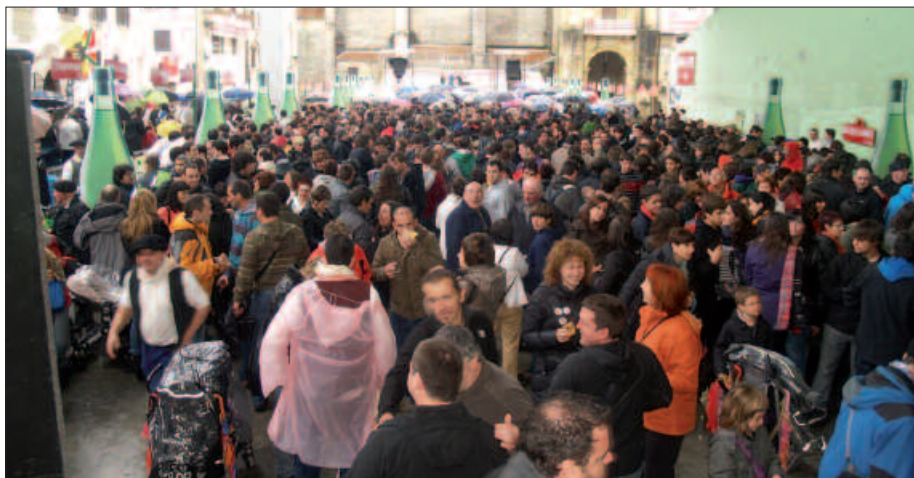
FRONTOIAN PILATU ZEN JENDEA ETA GIROA BEREHALA PIZTU ZEN BERTAN.

Aitzaga irekita izan zen Sagardo Egunean, aspaldiko partez, eta hortxe ere ostatu hartu zuten sagardozele askok, euritik ihesi. Askatasuna plazan, pintxoak eta edatekoa eskuratzeko aukera zegoen baina euriarekin gutxiago luzitu zuen gune honek.