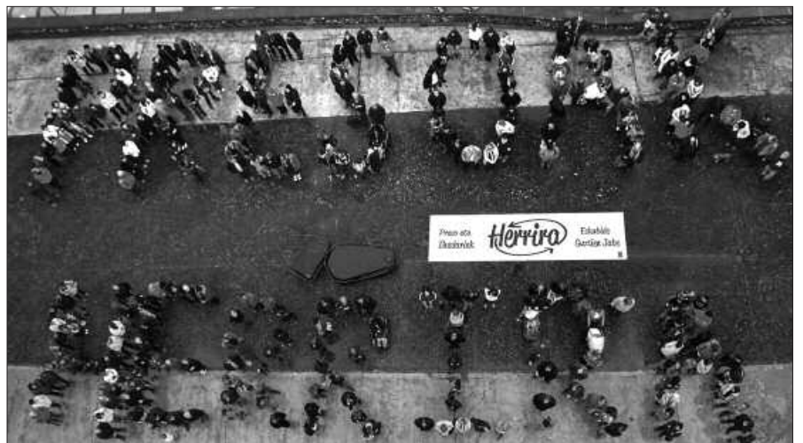
OSTIRAL HONETAN HILABETE AMAIERAKO ELKARRETARATZEA EGINGO DA, 20:00ETAN MIKEL LABOA PLAZAN.

Milaka lagun kalera atera ziren Maurreko larunbatean, Herrira mugimenduak euskal preso politikoen eskubideen alde plazak betetzeko egindako deialdiari babesa adieraziz. "Goazen Plazara" ekimenak jarraipen handia izan zuen Euskal Herrian. Antolatzaileen esanetan, guztira 227 elkarretaratze egin ziren. Usurbilen, Dema plazan elkartu ziren hainbat lagun eta "presoak herrira" hitza osatu zuten. Garabi batetik ateratako argazkia igorri digute. Sagardo Egunean ere, euskal presoaren eskubideak aldarrikatzeko eskualde mailako elkarretaratzea egin zen.