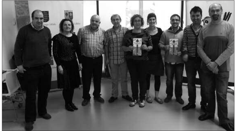
ESKUALDEKO UDAL ORDEZKARIAK ETA ESKOLETAKO ZUZENDARIAK, POTXOENEAN.

Maiatzaren 18an Usurbilen emandako prentsaurrekoan, euskarak lan munduko hizkuntza ere izan behar duela eman zen aditzera; eta ez soilik eskoletan erabiltzekoa, Buruntzaldeko udal eta ikastetxeetako ordezkariak azpimarratu zuten bezala. “Eskoletan eta DBHn egiten den lana oso garrantzitsua da eta lan horri bultzada emateko, Batxilergoa eta Lanbide Heziketako zikloak euskaraz ikasteko aukera badago”, gogorarazi zuten.