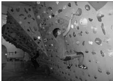
ESKALADA IKASTAROA ANTOLATU DU ANDATZAK UZTAILERA BEGIRA.

Bada Andatza Mendizale Elkartekoek antolatu duten beste ekimen bat ere; bi eguneko eskalada ikastaroa hain zuzen. Saioak uztailearen 7a eta 8an burutuko