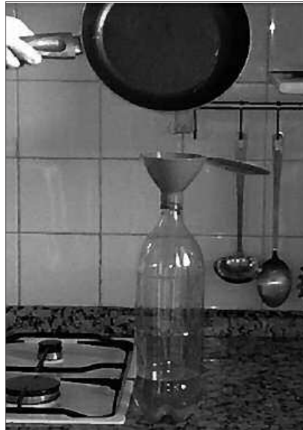
AUZOKAKO BILKETARI EGINGO ZAID EKAINAREN 1ETIK AURRERA.

Hala ere, Usurbilen kasuan “Ekogras enpresak biodiesela ekoizteko erabiltzen du, gure ibilgailuetan erregai moduan erabiltzeko (olio litro batekin diesel litro bat erdiesten da eta petroliotik zuzenean sortutako erre-gaiek baino eragin txikiagoa dute