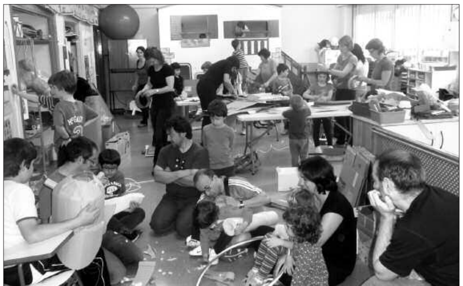
MAIATZAREN 28AN IKUSGAI IPINIKO DITUZTE SUTEGIN.

Gurasoentzat, bestetik, formakuntza tailerrak maiatzean bukatu dira eta Hitz Ahok dioenez, "balorazioa oso ona egin dute parte hartu duten 36 gurasoek. Hurrengo ikasturtean, urritik-apirilera hilean behin antolatuko dira tailerrak; gurasoek haurren hezkuntzaren inguruan hausnarketa leku bat izan dezaten".