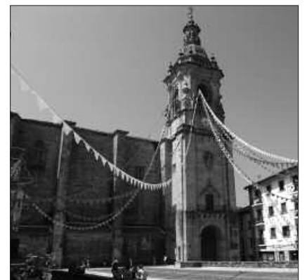
EKAINAREN 5EAN BILDUKO DA BERRIRO JAI BATZORDEA.

Gogoan izan bestalde, ostiral honetan, maiatzaren 25ean amaituko dela Egitarau Diseinu Lehiaketan parte hartzeko epea. Informazio gehiago: 943 371 999 edo kultura@usurbil.net .