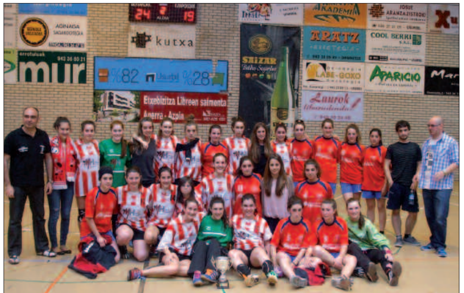
ELGOIBAR ETA USURBIL KE TALDEKO KIDEAK, PARTIDA AMAIERAN.