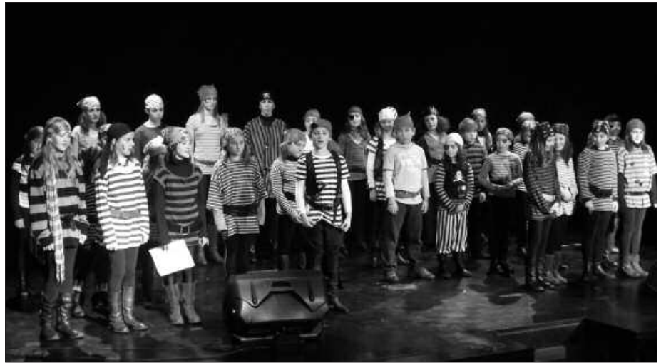
IKASTURTEAN HAINBAT KONZERTU ESKAINTZEN DITUZTE ZUMARTEKO IKASLEEK.

I. A. Lehen dena egina genuen. Kontzertua genuenean, dena lotua ego-