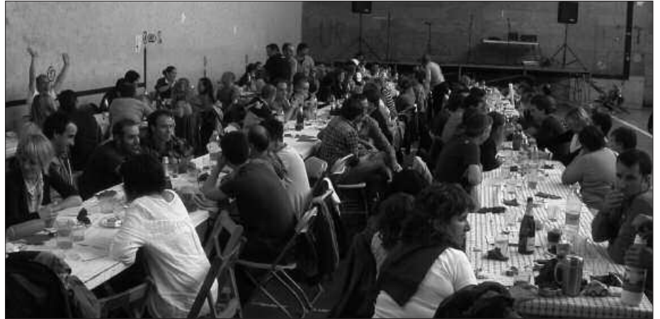
BAZKARIA FRONTOIAN EGINGO DA. TXARTELAK ALDEZ AURRETIK EROSI BEHAR ZIREN.

Haur Hezkuntzako txanda izango da gero. Ikuskizuna eskainiko dute eguerdiko 12:00etatik aurrera Oiardo