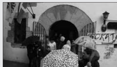
GARBITZAILE BILA ARI DIRA.

A itzaga Elkartea garbitzeko arduratuko den pertsonaren bila dabil. "Interesdunek beren izen-abizenak eta kontakturako telefono zenbakia helbide honetan utz dezakete: Aitzaga Elkartea, 30 postakutxa. Azken eguna: ekainak 5 asteartea".