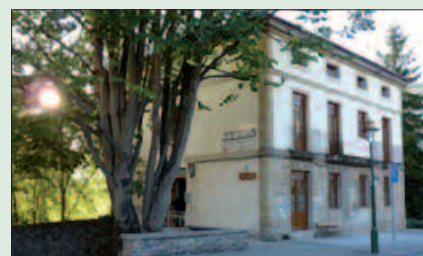
4 URTETIK GORAKO EK EMAN DEZAKETE IZENA ZUMARTEN.

Matrikulazioa, azken txanpan Egunak: maiatzak 28-ekainak 1. Ordutegia: 11:00-13:00/16:30-19:30.