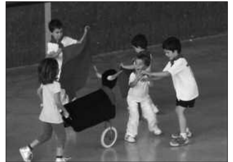
4 URTETIK GORAKO EKEMAN DEZAKETE IZENA.