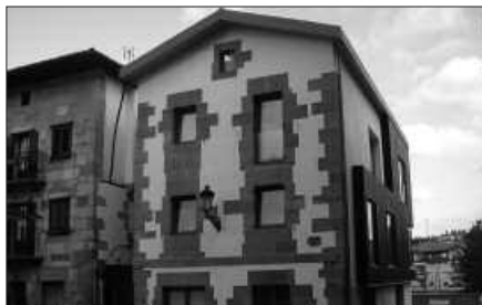
EKAINAREN 8AN DBH3KO