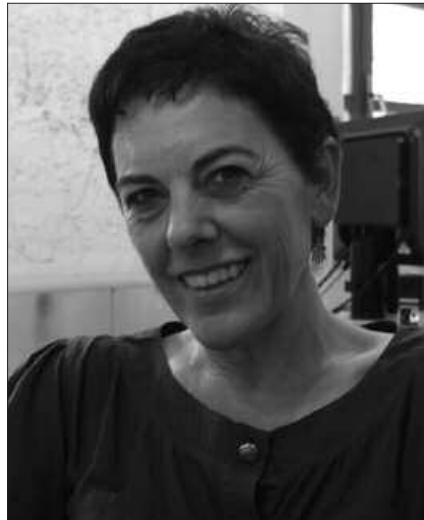
AUZOZ AUZO IBILIKO DA DATOZEN EGUNETAN.

Noski, urtebete hau nola joan den ere azalduko dugu, gure ikuspegia emango dugu eta azalpenak mahai gainean jarriko ditugu, baina bilera hauen xede nagusia Udalaren eta herritarren arteko komunikazioa bultzatzea da.