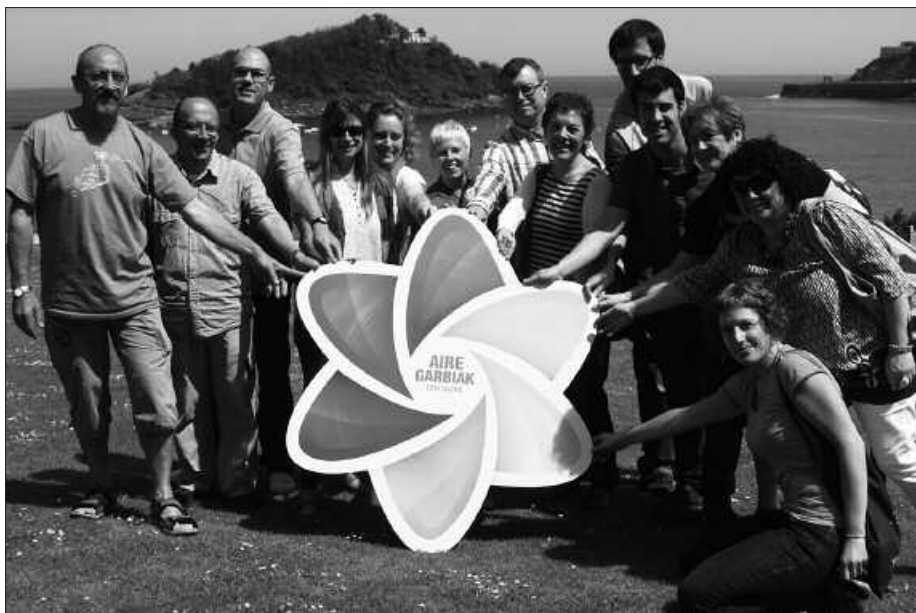
ASTEAREN HONETAN EGIN DUTE ABERRALDIA USURBILGO ITUNAKO KIDEEK.

Iaz Zubietako flashmob ekimenean gertatu bezala, herritarren parte hartzea ezinbestekoa izango da oraingoan ere. Usurbil Zero Zabor bilgunetik, 500 herritar baietz joan, horixe da egina duten apustua. Horregatik, abian dira Usurbilen ekaineko hirugarren igandeko hitzordua prestatzeko lanak. Usurbil Zero Zabor bilguneak, datozen bi igandeotan, hau da, ekainaren 3an eta 10ean, eguerdi partean mahai bat jarriko du Dema plazan. Bertan, haize errota erraldoia osatzeko herritarrek eskutan hartu beharko dituzten kartulinak salduko dituzte. Bi egunotan gainera, Donostiako ekimenarekiko atxikimen-