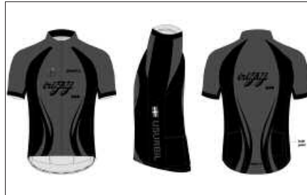
EKAINAREN 15ERA ARTE EGIN DAITEZKE ESKARIAK.

“CRAFT markako jantzi hauek kalitate onekoak eta teknologikoki aurrerakoiak dira. Besteak beste, Radioshack Nissan Trek taldea janzten duen marka da”, adierazi dute Irisasi BTT bilgunitik. Udako zein neguko arropak prestatuko dituzte. Prezio eta diseinuak Oiardo Kirolegian edo Andatza Mendizale Elkartearen web orrialdean,