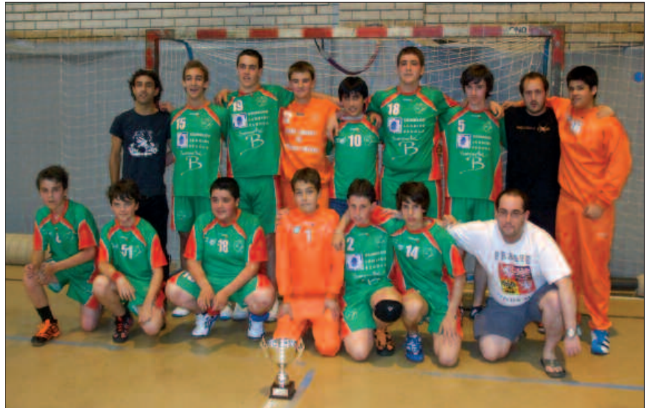
PARTIDA POLITA JOKATU ZUTEN ETA MEREZIMENDU OSOZ IRABAZI ZUTEN.

H iru eskubaloï partida iragarrira zeuden aurreko asteburuan Oiardo kiroldegian, eta hiruretan giro ederra izan zen. Senior neskek jokatu zuten lehenbizi, Kopa Nazionaleko partida. Eta ondoren, Gipuzkoako Kopako bi finalak. Biak, kadete mailari dagozkionak. Usurbil KE mutilen taldeak aise irabazi zuen finala, Zumaiako Pulpo taldearen aurka. 22-33 izan zen azken emaitza. Atera kontuak. Parekatuta joan zen partida baina, bigarren zatian, Usurbil KE ondo ibili zen defentsan eta horri esker lortu zuten garaipena. Kopa eskuratu zuten unean, pozarren ziren jokalariaik.