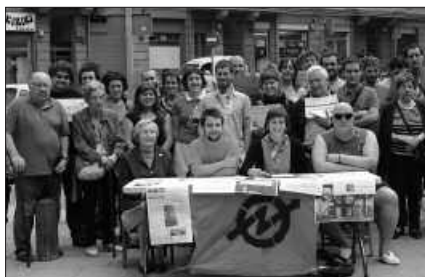
IGANDE HONETAN, SUTEGIN IZANGO DIRA 18:30EAN.

18:30ean hasiko den hitzorduan, mahai inguru bat burutuko da. "Beraien historia kontatuko digute, orain Bilbon, batez ere Errekalden, gelditu den hutsunea... eta noski hau Usurbilgo kasuarekin kontrajarriko