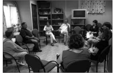
SANTUENEAN EGIN ZUTEN LEHEN BILERA, PASA DEN ASTELEHENEAN.

Ekainak 11, astelehena: Aginaga, 19:00 Antxomolantxa Elkarte.