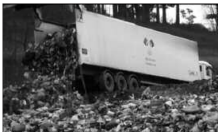
18:30EAN HASIKO DA DOKUMENTALAREN PROIEKZIOA.

Antolatzaileek aurreratu dutenez, "Dokumentalean zaborraren problematika bere osotasunean azaleratzen