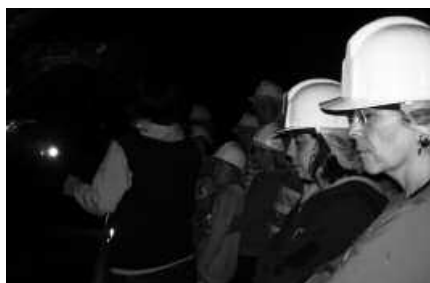
ARDITURRIKO MEATZETAN IZAN ZIREN MAIATZAREN 27AN.

M aiatzaren 27an Oiartzun aldean ibili ziren Mintzalaguneko kideak. "Oraingoan mintzalagunok Arditurriko meatzetan barrena ibili gara. Igandean Aiako Harriak parkearen eguna zela aprobetxatuz, Oiartzungo bidegorriari jarraitu eta duela gutxi arte ustiatu izan den meategira iritsi ginen. Harrigarria da horrelako toki batean nolako lanak eginak dauden ikustea, pentsa erromatar garaian hasi ziren ustiatzen, auskalo nolako baldintzetan. Ez zen xamurra