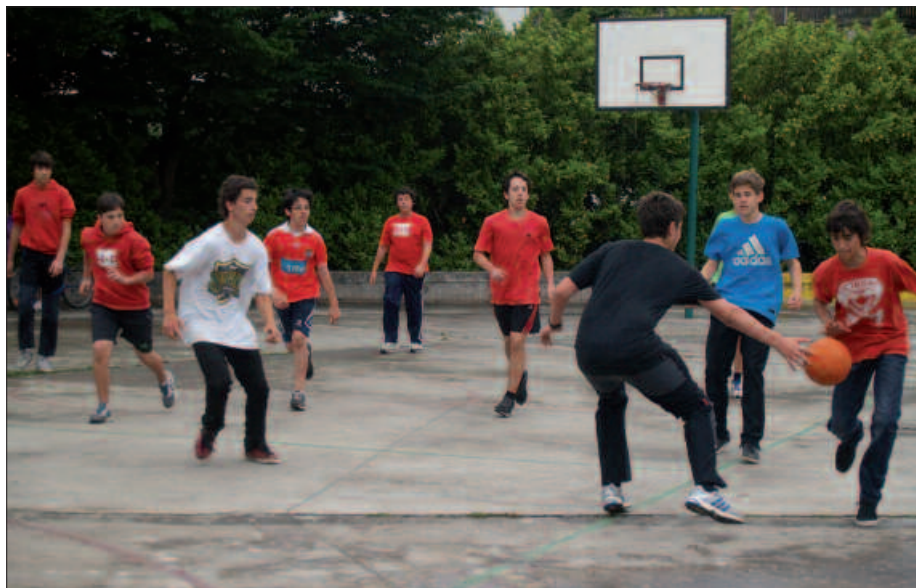
IKASLEEN ARTEKO JOKOAK EGIN ZIREN UDARREGIKO PATIOAN.

E guneroko zereginak alboratuta, ikasle, irakasle eta gurasoek Ikastola Eguneko jaialdian murgiltzeko aukera izan zuten joan den igandean. Goizean ikasleen arteko jokoa ospatu ziren, euren lanak erakusgai jartzearekin batera. Eskulan eta teknologia ikasgaietan urtean zehar egindakoren emaitza ezagutzeko aukera egon zen ikastolan bertan. Zalantzarik gabe ordea, ikusmin handiena Haur Hezkuntzako ikasle eta irakasleek Oiardo Kiroldegian eskaini zuten ikuskizunak piztu zuen. Beste behin, kirol gunea jendez bete zen, "Datorrenari, agur!" izeneko emanaldia ikusteko. Eguna frontoian ospaturiko bazkari baten bueltan borobildu zuten.