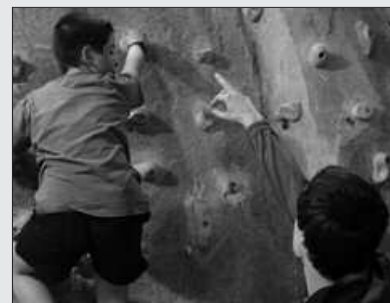
EKAINAREN 11N AMAITUKO DA ESKALADA IKASTAROAN IZENA EMATEKO EPEA.

Uztailaren 14an eta 15ean Piedrafitako zirkora irteera antolatu dute Andatzakoek. Uztailaren 9an amaiuko da izen-ematea. Informazio gehiago: andatza.com