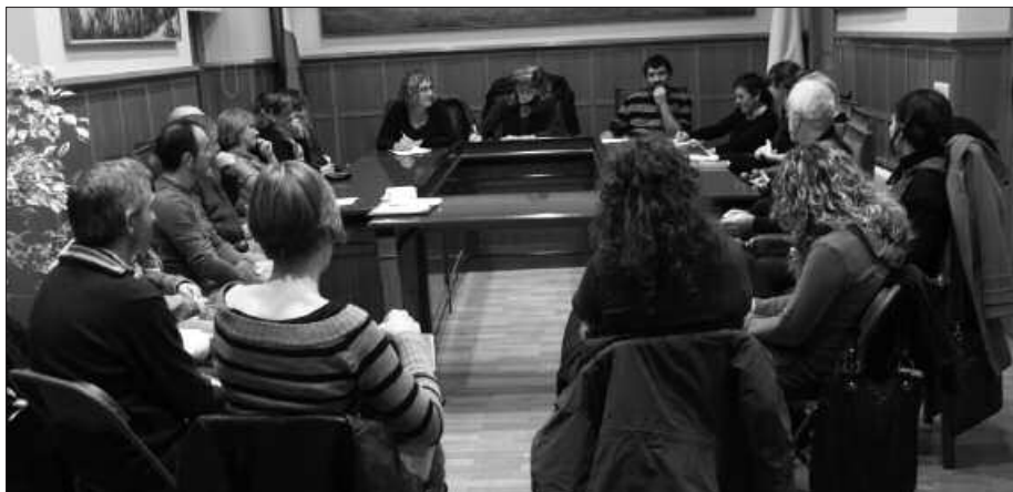
KULTURA AHOLKU BATZORDEAN LANDU ZIREN IRIZPIDEAK HARTU DIRA KONTUAN.

H errian antolatzen diren hainbat ekimen babesteko Usurbilgo Udalak aurtan martxan jarritako diru-laguntza deialdi desberdinak banatzeko prozesua aurrerabidean da. Kultur, ongizate eta kirol arloetakoak behin behingoz onartu dira eta egunotan alegazioak aurkezteko epea zabalik geratuko da. Ingurumen alorrekoak laster onartze-koak dira diru-laguntza batzordean. Azkenik, euskara eta aisialdi alorrekoak eskatzeko epea hamar egun barru zabalduko da.