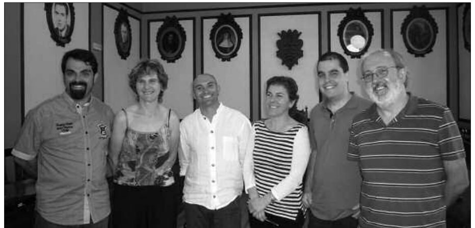
ESKUALDEKO ALKATEEK SINATU DUTE HITZARMENA.

Akordio honen baitan, lau helburu bete nahi dituzte sei udalek: sustapen ekonomiko eta enplegu arloan gure lurraldearen egoera zein den jakiteko diagnostikoa egitea; enplegurako eta sustapen ekonomikorako plan lokal edota