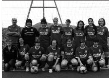
EKAINAREN 14AN ZABALDUKO DA ERAKUSKETA SUTEGIN.

ratu mailako taldea osatu asmo du Usurbil FT-k. Plaza mugatuak izango dira, gehienez 16 lagunentzako lekua dago. Apuntatzeko epea ekainaren 7ra arte zabaldu dute.