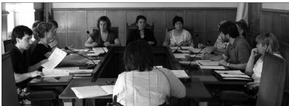
MAIATZEKO OHIKO PLENOAN HARTU ZEN ERABAKIA.

Sei puntuko testuan gainera, "Usurbilgo Udalak Espainiako Estatuari dei egiten dio Nafarroari eta Euskal Herri osoari 1512ko Konkistan eta 1936-39ko altxamendu faxistan eragindako kaltearen aitortza egitea". Euskal Herriak herri gisa dituen eskubideen aldeko defentsa egiten du mozioak, eta gaineratzen denez, "euskal jendarteak bere etorkizunaz libreki hitz egin eta erabakitzeko eskubidea duela aitortzen du. Era berean, Udal honek eskubide