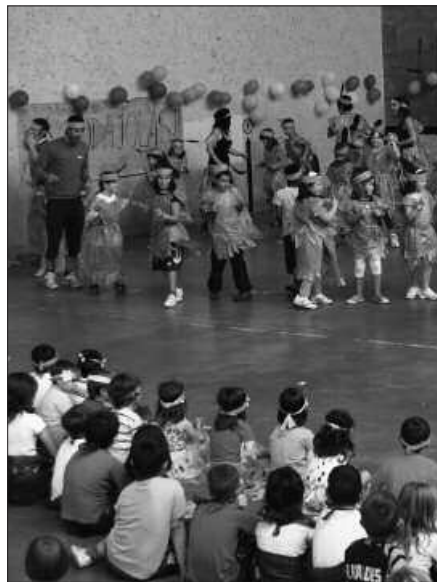
UDAJOLAS AURTEN UZTAILAREN 3AN HASI ETA 27AN AMAITUKO DA.