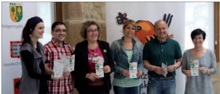
AUTO-ESKOLA BAKOITZEKO 400 EURO ARTEKO SARIA ZOZKETATUKO DA.

Eta laguntza hori gabe auto-eskolek ezinezkotzat jotzen zuten sektorean