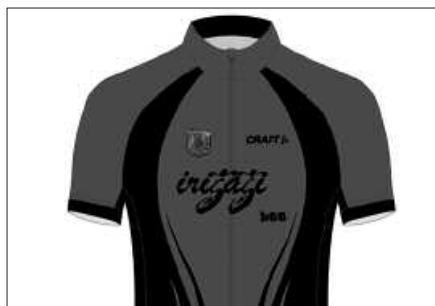
EKAINAREN 15ERA ARTE EGIN DAITEZKE ESKARIAK.

Prezioak eta diseinuak andatzamendizale.info web orrian kontsulta daitezke.