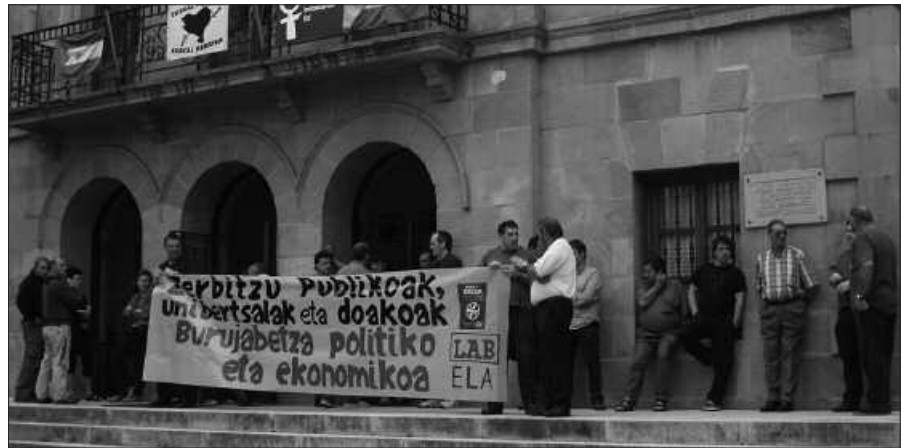
MAIATZAREN 31N ELKARRETARATZEA EGIN ZEN UDALETXE AURREAN.

Aplikatzen ari diren murrizketen- atik, sektore publikoko langile- ak greba edota lan uzteetara deituak zeuden joan den maiatzaren 31n. Euskal Herriko gehiengo sindikalak finkaturiko mobilizazioek Usurbilen ere eragina izan zuten. Udal langileek bi orduko lan uztea burutu zuten Joxe Martin Sagardia plazan, "Zerbitzu publikoak unibertsalak eta doakoak. Burujaletza politiko eta ekonomiko" lemapean. Usurbilgo Udaleko LAB eta ELA sindikatuek deitu zuten aipatu mobilizazioa.