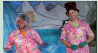
ARGAZKIAN, JAKIN ETA JOLAS ANTZERKI TALDEKO KIDEAK.

I kasleek udako oporrak hartuko dituzten ostiral honetan, pailazoen emanaldia programatu du Santuenea Kultur Elkarteak, 17:30ean auzoko frontoian. Jakin eta Jolas antzerki taldeko kideek "Ipar Poloan bero, dantzatzu gero" izeneko saioa eskainiko dute. Izenburuak dioen bezala, dantzan jarri nahi dituzte Santuenera hurbilduko diren gazteak, ipar poloan ez egon arren.