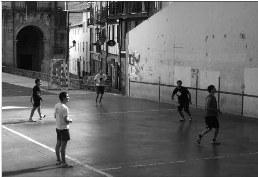
IGANDEAN JOKATU ZIREN AZKEN KANPORAKETAK.

P aleta Goma Txapelketako partidien lekuko izan da frontoia azken igandeetan. Aurreko igandean jokatu zen azken kanporaketa. Egun hauetan, final-erdien txanda izango da eta ekainaren 27an jokatuko dira bi finalak.