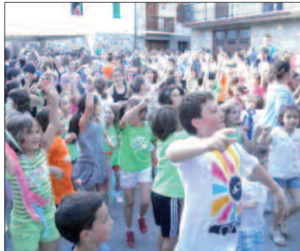
IGANDEAN, HAURRAK NAGUSI IZAN ZIREN KALEZARREN.

San Juan Eguna 11:30 Meza Nagusia. Ondoren, toka. 13:00 Soka-dantza. 16:30 Gorritiren showa. Ondoren, buruhandiak. Ondoren, sardina eta sagardo dastaketa Saizar Sagardotegiaren eskutik.