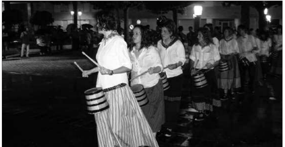
EKAINAREN 29AN AMAITUKO DA ESKAERAK AURKEZTEKO GARAIA.

XXXVI. Bertsopaper Lehiaketan parte hartzeko epea ixtear da.