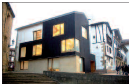
1.500 PROIEKTUEN ARTEAN LEHIATU BEHAR IZAN DU.

Epaimahaiak orain, ezagutzera eman dituen 25 aipamenen artean sartu du, Usurbilgo eraikina. Ez hori bakarrik, Sagarna ahizpek eta