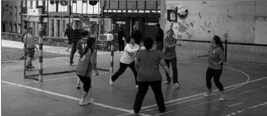
USURBIL FT-REN EGUNEAN GIRO EDERRA IZAN ZEN NAGUSI.

Usurbil FT-k antolaturiko Usurbil Cup txapelketa amaierara heldu da, azken partidak larunbatean jokatu dira. Minibenjamin mailako taldeak txapelketan zehar ez dira elkarren artean lehiatu, eta honenbestez, ekainaren 23an talde guztiek jokatu dute. Goizez 10:30etatik aurrera, Oiardo Kiroldegian. Arratsaldez, 16:00etan hasita gainerako