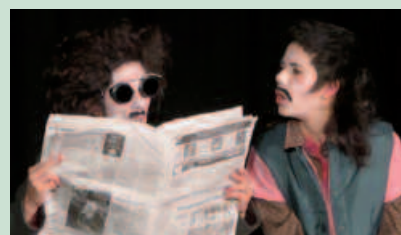
ZUBIETA LANTZENEK ANTOLATU DU "HERIO HEROI" ANTZEZLANA.