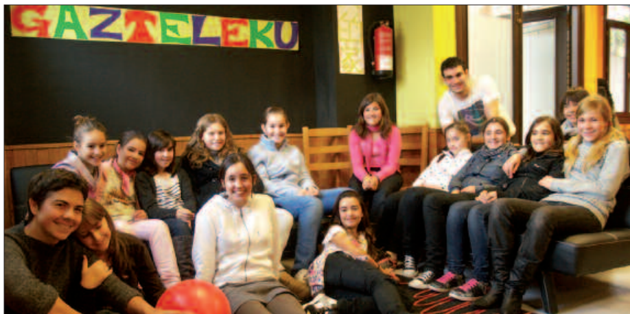
EKITALDI UGARI ANTOLATU DITUZTE UZTAILAREN 30A BITARTEAN.

11:00-19:00 Hendaiara irteera. Tren geltokitik hondartzara oinez. DBH 2.