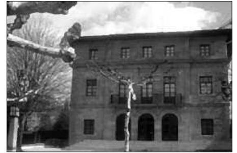
USURBILGO UDALA SANEATUENETARIKOA OMEN DA.

Hirigintza arloari dagokionean herrian bidegorri-sare bat egiteko proiektu eskatzen ari gara aspalditik eta esan digu-