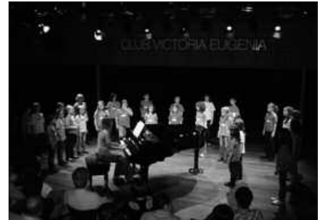
SUTEGIN, UDARREGIN ETA KALEZARREN ARITUKO DIRA KANTUAN.

18:00 Musika Txokoko ikasleen emanaldia Udarregi Ikastolan.