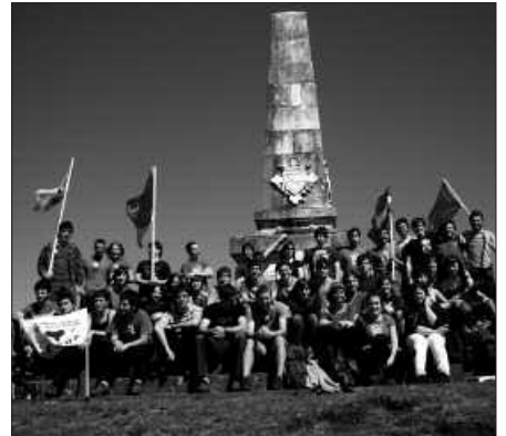
MARTXOAN AMAIUREN IZAN ZIREN ITAYAKO GAZTEAK.

Euskararen arloan ere ibili gara gure pintzeladak ipintzen. Horren adibide ditugu herriko tabernetan ipinita dauden kartelak euskararen erabilera zuzena sustatzeko asmoz eta batez ere gazteen artean erabiltzen ditugun hitz edo esaldi okerrak gure ahotik kentzeko helburuarekin. Baina euskararen arloan dena ez da zuzentasuna ere. Honela ospatu genuen Euskararen eguna gazteok dugun heldu izateko gogoia alboratu eta inozentzia garbienean herriko haurrekin jolasak eginez algaren faltarik izan gabe. Eta algarekin jarraituz bukatu genuen eguerdi hura ere, hamaiketako janez piropo txapelketako piropo original, pastelero eta berdeenak entzuten. Euskaraz ere piropo ederrak esan daitezkeela erakutsiz.