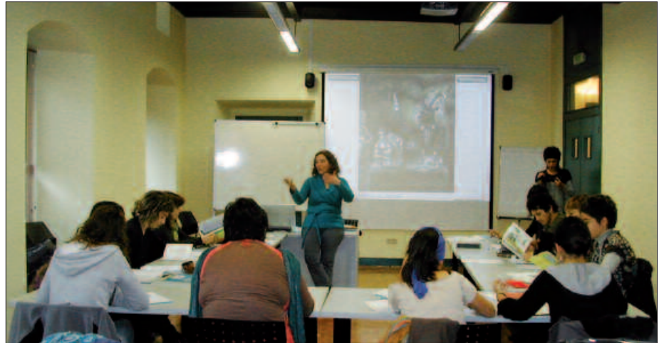
UEU.ORG HELBIDEAN XEHETASUN GEHIAGO ESKURA DAITEZKE.

I. T. Urtero, 35-40 ikastaro berri izaten ditugu. Hori ere erronka handia da. UEUren txikitutasunak bermatzen du gauza berritzaileak egiteko aukera. Ikastaroei dagokienez, hauek ditugu; artea eta musika, giza zientziak eta gizarte zientziak, ingenieritza, teknologia, osasuna eta zientzietakoak. Gehienak oraindik gizarte zientzietakoak dira. Batzuetan espero ez dugun ikastaroak izugarritzko arrakasta du. Aurten Pirinioetako ikastaro praktikoa bat hirugarren egunerako beteta zegoen. Itzultzaileen ikastaroei, informatikak ere oso ondo funtzionatzen dute. Batetik adituentzako ikastaroak daude eta beste batzuetan edonork parte har dezake.