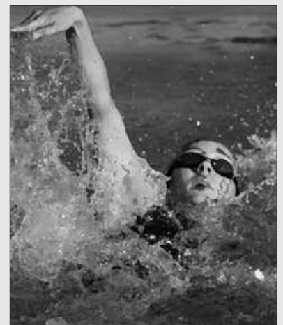
IGERIKETA IKASTAROK ERE ANTOLATU DITUZTE.

Uda honetan ere kirolaz gozatzeko aukera eskaini nahi dute Kirol Patronatutik. Horregatik, ikastaro eskaintza zabala antolatu dute uztaileko. Hilaren 4tik 20ra, helduentzat hobekuntza ikastaroa igarilekuan, mantentze gimnasia, aerobik, pilates, spinning. 8-10 urte arteko gaztetxoentzat bestalde, "Kirolarekin jolasean" ekimena antolatu dute. Jarduera desberdinetan parte hartzeko aukera izango dute; igeriketa, herri kirolak, talde kirol eta jolas desberdinak, pilota palaz, tenisa, badminton, mendi bizikletekin txangoak, patinak, psikomotrizitatea material ezberdinekin, jolasak, txapelketak... Etxeko txikienei zuzenduriko igeriketa ikastaroak ere antolatu ditu Kirol Patronatuak. Informazio gehiago edo izen emateko: 943 372 498 edo kirolpat@usurbil.net.