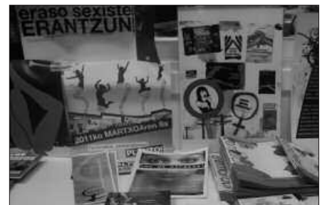
MATERIAL UGARI EGONGO DA ESKURAGARRI.