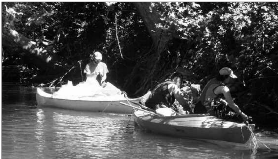
ORIA IBAIA GARBITZEN ARITU ZIREN EKAINAREN 16AN.

L arunbat honetan ospatuko da, Santixabeletako VII. Kayak jaitsiera. Ekitaldia, goizeko 9:30ean hasiko da, Zubietako Aliri paretik. Puntapax Kano Kiroel Elkarteak antolatu du ekimena. Baita joan den ekainaren 16an, Oria ibaia garbitzeko hitzordua ere.