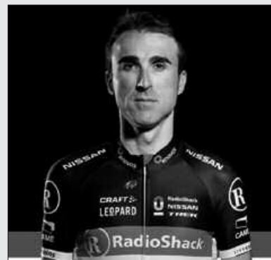
RADIO SHACK TALDEAREKIN ARITUKO DA TOURREAN.

L arunbat honetan, ekainaren 30ean abiatuko da 2012ko Frantziako Tourra. Txirrindularien artean, usurbildar bat izango dugu aurten ere; Haimar Zubeldia. RadioShack-Nissan taldekoekin batera parte hartuko du. Talde burua Franck Schleck izango dute eta gainerako kideak, Cadel Evans, Andreas Kloeber, Chris Horner, Yaroslav Popovich, Fabian Cancellara, Jens Voigt eta Maxime Monfort. Lehen etapa, ekainaren 30ean Lieja-Lieja artekoa. 20 ibilbide osatu ostean, Pariseko helmugara ailegatuko dira uztailaren 22an.