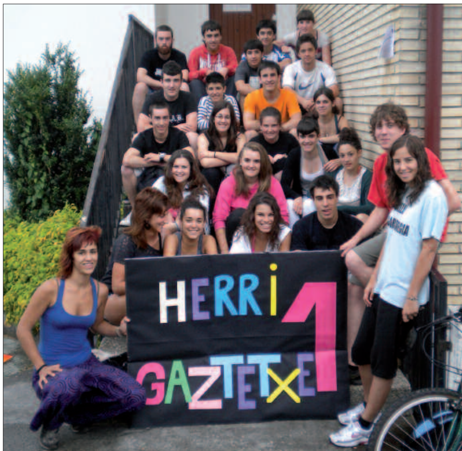
ITAYAREN EKIMENAK HARRERA POLITA IZAN DU, “GAZTE ETA HELDU ASKOK ILUSIOZ” HARTU DUTELA ADIERAZI DIGUTE.

batez ere entzun dugunarengatik, gazte eta helduago askok ilusioz hartu dute berri hau.