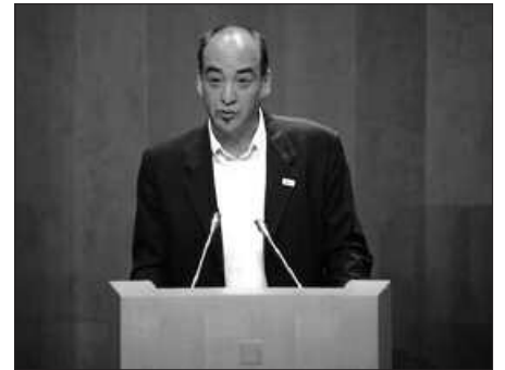
“ADOSTASUNERA IRISTEKO GAITASUN EZA” EGOZTEN DIO BILDURI.

Bilduk bere demokrazia kultura eza azaltzen ari da kasu honetan. Botere legegilea eta botere exekutiboa nahasten ditu. Nahasmen interesatua gainera, zeren Batzar Nagusietan ez du gehiengoa lortzen, adostasunetara iristeko gaitasun eza erakutsiaz.