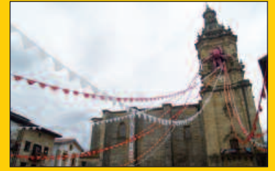
Hastera doaz Santixabelak!