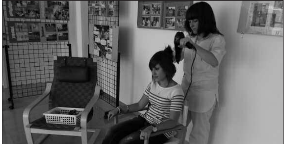
IKASITAKO ERAKUSTEN ARITU ZIREN HASTAPEN TAILERRETAKO IKASLEAK.

Urtean zehar ikastetxe barruan buruturiko lanketa gizarteratzeko erakusketa antolatu zuten joan den astean, Hasierako Lanbide Prestakuntza Programetako arduradunek. Ikasketa ziklo hauetako ikasleak, sukaldaritza eta ile apainketa prestakuntza jaso dutenak edo ikasten dihardutenen argazki bilduma ikusgai egon zen, besteak beste. Gaur egun ikasle direnak ere bertan ziren. Sukaldaritzakoek eurek prestatutako pintxo gozoak das-tatzeko aukera eskaintzen zuten. Ile apaintzaile izateko bidean direnek berriz, zuzeneko erakustaldiak egin zituzten. Atallun kokatua dagoen ikas-tetxean, 2012-2013 ikasturterako