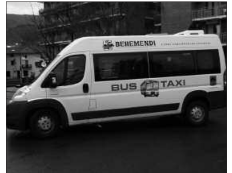
UZTAILAREN 2AN EZ DA ZERBITZURIK IZANGO.

D atorren astetik aurrera, udako ordutegi indarrean izango da bus-taxi zerbitzuan. Goizez bakarrik ibiliko da, astelehenetik ostiralera orduotan: 7:30-8:30, 10:30-11:30 eta 13:00-14:00etan. Arratsaldetan ez da zerbitzurik izango, ezta abuztu osoan ere. Datorren astelehenean, Santixabel Eguna, Usurbilen jai eguna izango denez, bus taxi zerbitzurik ere ez da izango hilaren 2an.