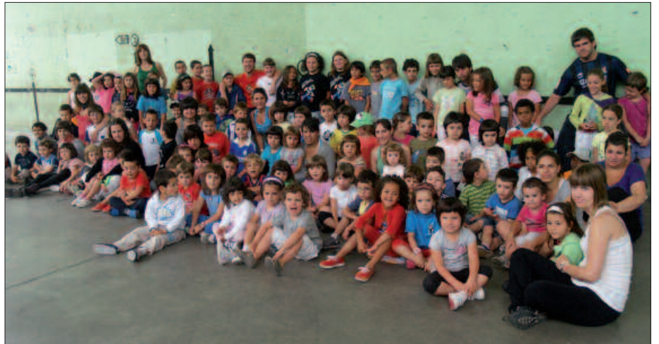
UZTAILAREN 3AN HASIKO DA UDAJOLAS.

Ordaindu beharreko kuota hau izango da. Eskola txikitan matrikulatuta dauden haurrak: hilabete osoa, 100 euro. Hamabostaldia, 70 euro.