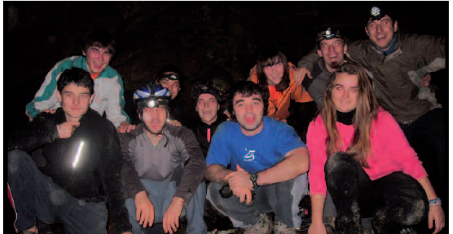
UDAZKENEAN, ERNIOKO KOBAZULOETAN IZAN ZIREN ITAYAKO HAINBAT LAGUN.

lituzke planteatzen duzuen gune autogestionatuak?