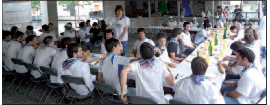
OILASKO BILTZAILEAK, GOIZEAN GOIZETIK XAHUTUTAKO INDARRAK BERRITZEN.

Baina nabarmentzeko moduko ekitaldirik utzi digute aurtengo festek. Santixabeletako txupinazo ekitaldia adibidez. Emozioz beteriko hitzordua izan da aurtengoan. Atzegiko kideen eskutik hasi ziren festak. Dema plazan jarri zuten oholtza gainean bildu ziren,