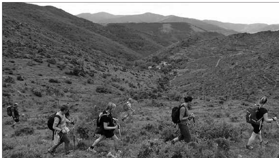
ANDATZAKO HAINBAT LAGUN, ERRIOXA INGURUAN EGINDAKO IRTEERAN.

E rrioxatik ekarritako oroitzapen politik gogoan dituzte Andatzako kideek. Baina dagoeneko Pirinioetara begira daude. Datorren asteburuan abiatuko dira hara. Bada izena emateko aukera oraindik.