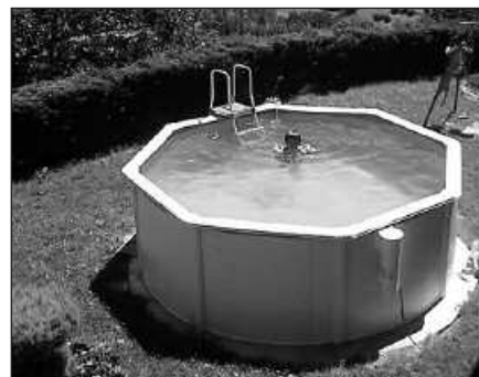
ANTZEKO IGERILEKUAK UGARITU EGIN DIRA ETA HORREK ERAGIN ZUZENA IZAN DU UR-KONTSUMOAN.

Halaber, ordenantza honen helburua zein den zehazten dute: "igerilekuen instalazioaren kontrol tekniko eta hirigintzako egitea eta ura modu arduratsuan erabiltzea da. Era berean, igerilekuen mantentze-lanekin, funtzionamenduarekin eta erabilerarekin lotutako erantzukizunak zehaztu nahi dira. Horrekin lotuta, segurtasun-bal-