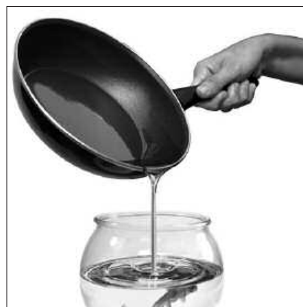
EROSKETA TXARTELAK BANATZEN DITUZTE BEZERDEN ARTEAN.

Trukean, herriko dendariak txartelak banatuko dituzte olio utzi duten herri-tarren artean. Badira 10 euroko saria duten txartelak eta dendan bertan erabili ahal izango dira, erosketa egiteko. Ekimen honen bitartez biltzen den olio Ekogras enpresara eramango da, biodiesela ekoitzi dezaten.