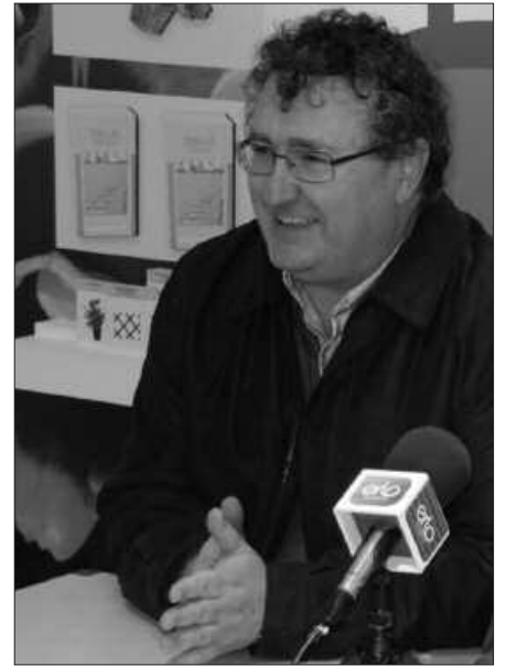
EAJ-REN USTEZ, ALDUNTZINEN “PLANAK EUROPAKO AGINDUEN KONTRAKO BIDEA PROPOSATZEN DU”.

Aldundiaren plana oso aste gutxitan egina dago, inprobisazio ugariekin,