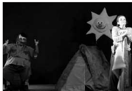
“EGUZKIAREN BIDAIA” ANTZEZLANA, UZTAILAREN 14AN SUTEGIN.

A. T. Herrian kale antzerkiak izango dira irailan. Hiru larunbat. Irailaren 8an Markeliñe etorriko da “Terapia” obrarekin. Gauekoa, ederra. Hilaren 15ean, Markeliñe berriz haurrentzako obra batekin; “ZooZoom”. Parte hartzailea da. Oso gauza bereziak, irudimentsuak egiten ditu. Jendea txunditzen du. Topa Eszenika irailaren 29an eta zirkoa egiten duen talde bat etorriko da; Malas Compañías, “Orsai” lanarekin. Estreinatua berria da. Hiru obra hiru egunetan. Hartara beti dugu zerbait herrian. Ahal dela, ea lortzen dugun herriko ekintzen agendan txertatzea.