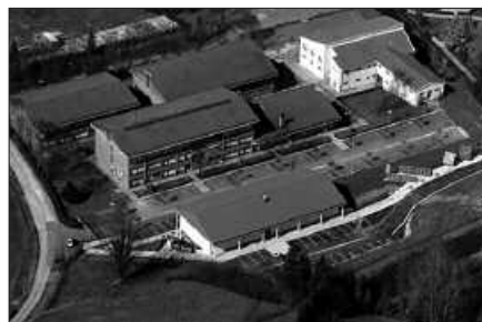
UZTAILAREN 11N AMAITUKO DA MARIKULATZEKO EPEA.

2012-2013 ikasturtean, Erdi eta Goi Mailako ziklo desberdinetan trebatzeko aukera izango dute ikasleek; administrazioa eta kudeaketan; elektrizitate-elektronikan; fabrikazio mekanikoan; ura eta energia; produkzio zerbitzu eta mantenuan. Eskabideak bulego ordutegi honetan aurkez daitezke; astelehenetik ostegunera, 9:00-14:00