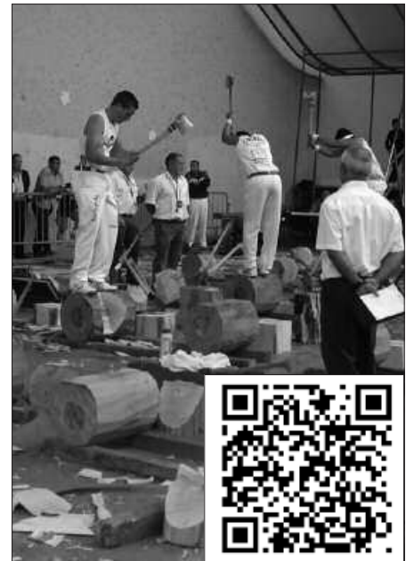
LEHIAREN INGURUKO BIDEA ZEIN BESTE BIDEOK ESKUKO TELEFONON IKUSTEKO, HAUXE DUZUE KODEA.