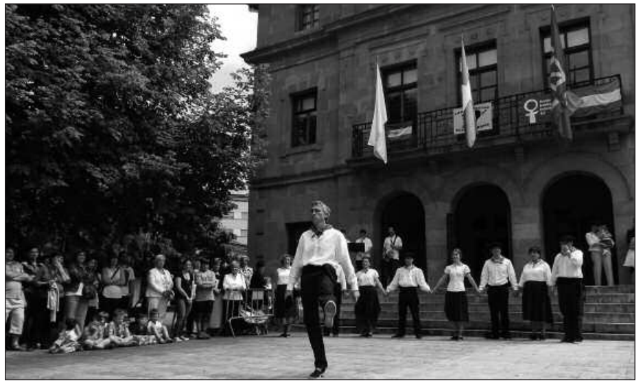
USURBILGOA, IKURRINA ETA NAFAR BANDERA EGON DIRA JAIETAN ESKEGITA.

Mozioak zehazten duenez, bandera nafarrak "500 urtez okupatuak izan ondoren bizirik mantentzen den giza taldea adierazten du, mundu zabalean bere