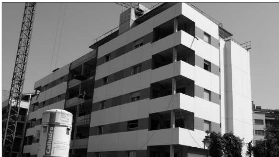
UZTAILAREN 13RA ARTE LUZATU DUTE KONTRATUA.