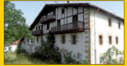
Ugarten 18 etxebizitza eraikitzeko asmoa du Udalak