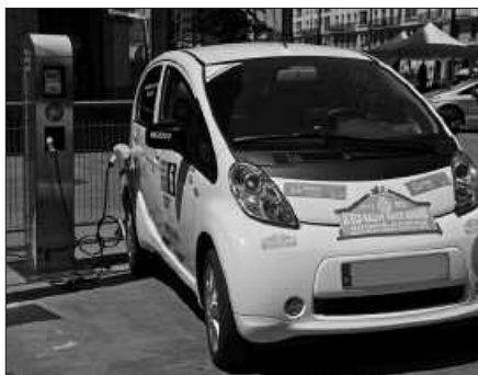
HONEN ITXURAKO AUTO ELEKTRIKO BAT IKUSTEKO AUKERA IZANGO DA.

Gidatze eraginkorreko ikastaroan izena eman behar da Bestalde, Usurbilgo Udalak Energiaren Euskal Erakundearekin elkarlanean, gidatze eraginkorreko ikastaroa antolatu du datozen asteotarako. Klase teoriko eta praktikoez osatuko