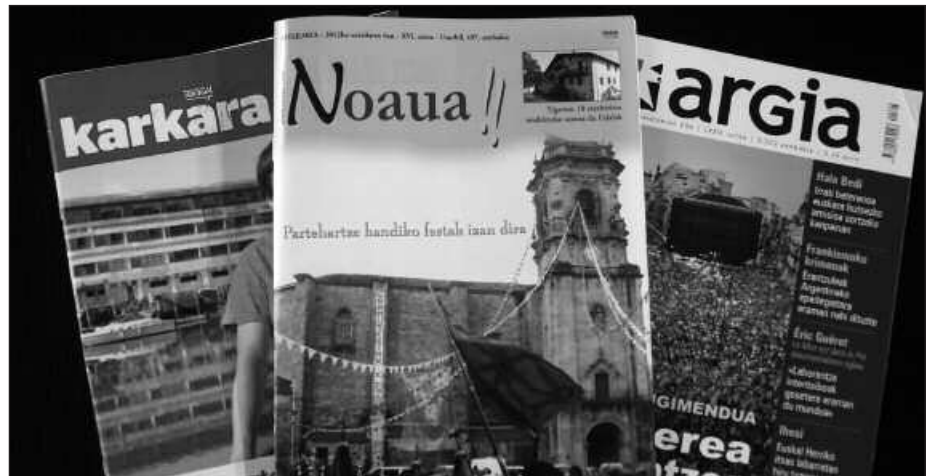
EUSKARAZKO HEDABIDEEN SEKTOREA EZ DAGO EGOERA ONEAN.

Garai latzak dira guztiontzat, ondortxo dakigu hori. Inoiz baino ahalegin handiagoak egiten ari gara euskal hedabideok garai berri horietara egokitzeko: diru iturri berriak bilatzeko, gure enpresa egiturak sendotuz, eta ditugun baliabideak optimizatzeko, elkarlanerako formula berriak garatuz. Ez gara kikildu krisiaren aurrean, eta soberan ez ditugun indarrak inbertitzen ari gara gauzak hobeto egiteko. Lan horren ondorioz, herri ekimeneko euskal hedabideek martxoan aurkeztu