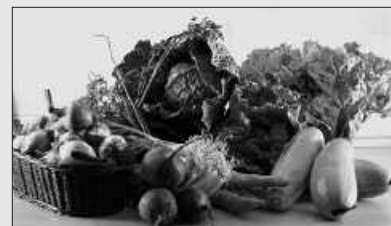
ASTEARTE ARRATSALDEZ BANATUKO DIRA OTARRAK.

Usurbiltzen Taldekoek otarrak jasotzeko hitzordu berria finkatu dute bestalde. Aurrerantzean, astearte arratsaldero 19:00-19:30 artean postua jarriko dute Bake Epaitegiko egoitzaren atzealdean. "Otarrak gain, arrautzak, haragia, laranjak... eta beste hainbat produktu jasotzeko aukera ere izango duzu", adierazi dute Usurbiltzen taldeak.