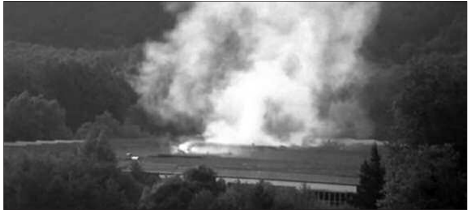
ERA HONETAKO INSTALAZIEN KONTROLA EUSKO JAURLARITZARI DAGOKIO.