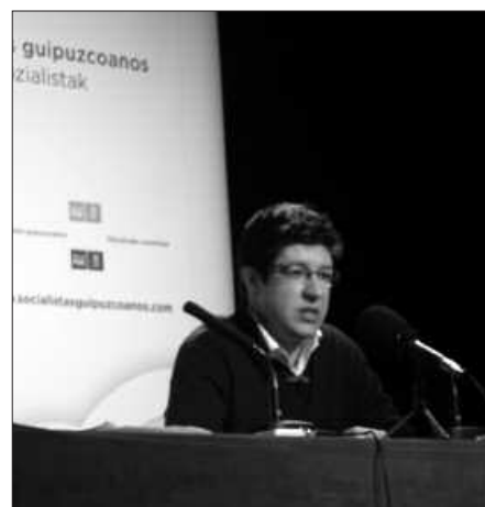
KONPONBIDEAN AURRERA EGITEKO, UNE HAU APROBETXATU BEHAR DELA DIO.

Agerian geratzen ari da, armak uzten badira, politikan planteamendu denak direla baliogarriak. ETak eragindako arazoa baino, bitalagoak diren kezka dituzte jendeak. Uste dut herritarrak nahikoa nazkatuta gaudela gai honekin.