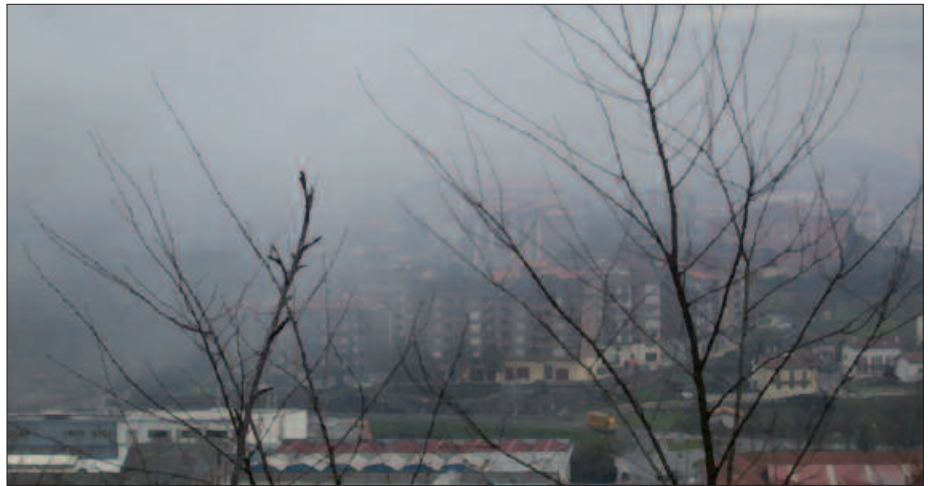
ARAZOA ASPALDITIK DATOR. ARGAZKI HAU 2007KO DA.

Garai honetan, ezbaierik gabe bileran bertan zalantzan jartzen ez zen jatorria du, atxegaldetarrek urteotan behin baino gehiagotan arnastu duten usainak eta keak; Osinalde industria gunean kokaturiko Ucin enpresa hain zuzen. Arazoaren iturria bertan kokaturik, azken urteotan Usurbilgo Udalak, enpresarekin eta