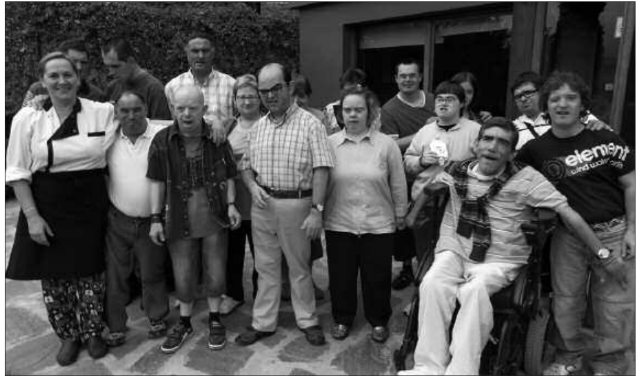
OLARRONDOK URTERO BAZKALTZERA GONBIDATZEN DITU.

Santixabelei hasiera ofiziala pozarren eman ostean, uztailearen 6an hitzordu berri baten bueltan bildu ziren berriz, ondoko argazkiko lagunak. Duela ia hamarkada batetik Olarrondo jatetxeak prestatzen dien egun pasa politaz gozatze-ko aukera izan zuen herritar talde honek. Eguraldia lagun, jatetxe atarian bildu ziren NOAUA!-rako argazki hau ateratzeko. Eurek eta senideek esker ona helarazi nahi diote jatetxeari. Olarrondokoek antolatzen dieten hitzordura, hutsik egin gabe bertaritzen dira urtero. Eguna nola igarotzen duten asmatzeko, euren aurpegiei begiratu besterik ez dago.