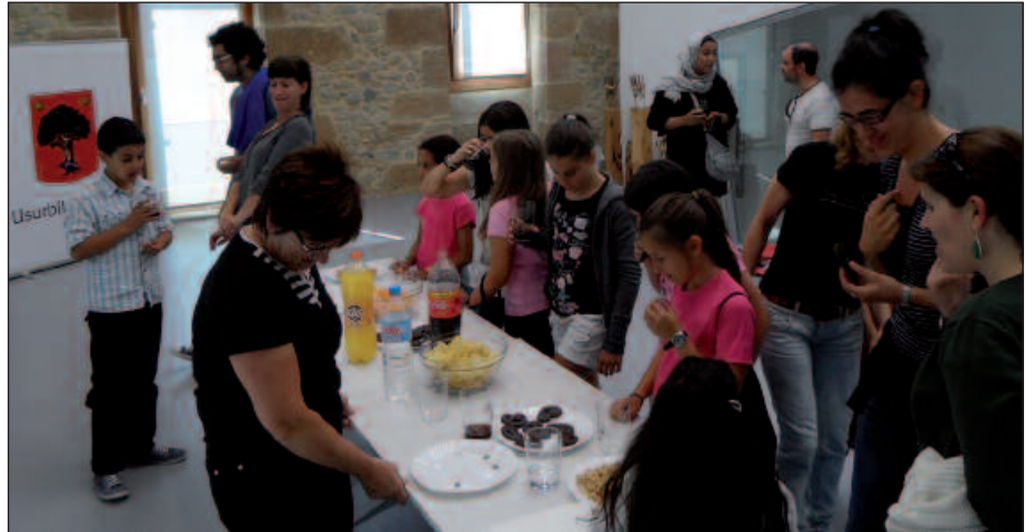
POTXOENEAN ANTOLATU ZEN MERIENDA BATEKIN EGIN ZITZAIEN ONGI ETORRIA SAHARAR HAURREI.

zubiak pasatzean, izugarria izan zen. Hainbeste ura eta zubi bat gainean, harrituta zegoen.