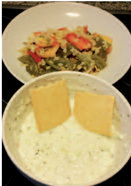
Aukera piloak eskaintzen ditu pepinoak...

Oso pepinozaleak ez direnek esaten dute potetsa ematen diela, errepikatu alegia. Errezeta bat prestatzera zoaztean, pure edo krema bat, pepinoa zuritu, erdibitu eta haziak kendu ondoren,