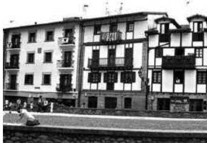
19:00etan hasiko da hitzaldia.

“Gero eta garrantzitsuagoa zaigu euskararen egoera eta bilakaera modu objektiboan baloratzeko aukera ematen diguten datuak izatea, eta datu horien artean bada bat herriko euskararen errealtatea adierazteko funtsezkoa dena: kalean euskara zenbat erabiltzen den”, hala