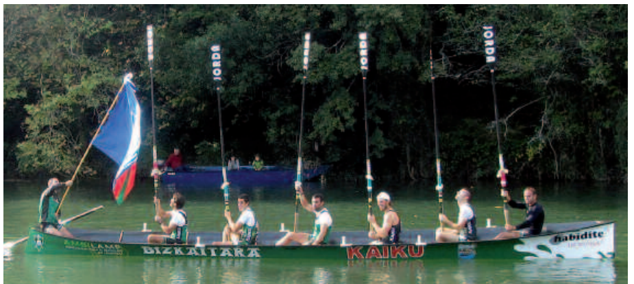
Getaria eta Kaikuko arraunlariak, banderak jaso berri.