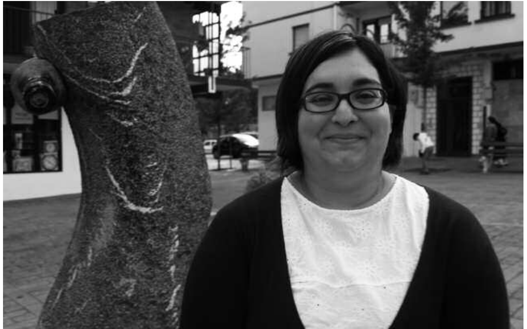
Etorri eta berehala, euskaltegian hasi zen euskara ikasten.

A lakanten jaioa, duela hamar urtetik Usurbilen bizi da. Ama hizkuntza katalana du. Bitxia da, baina batez ere eredugarria, hona etorri zenetik, hizkuntza aldetik burutu duen prozesua. Datoren elkarrizketa hau irakurri besterik ez dago. Usurbilera ailegatu berritan, euskara ez zekienez, katalanetik erdarara hitz egitera igaro zen. Mutil lagun eta koadrila euskalduna izanda ordea, euskaltegian matrikulatu zen. Ordutik euskara ikasten Etumetan, eta handik kanpo, herritarrekin ikasitakoa praktikatzeko joan ahala, bertako hizkera ere barneratua du neurri handi batean.