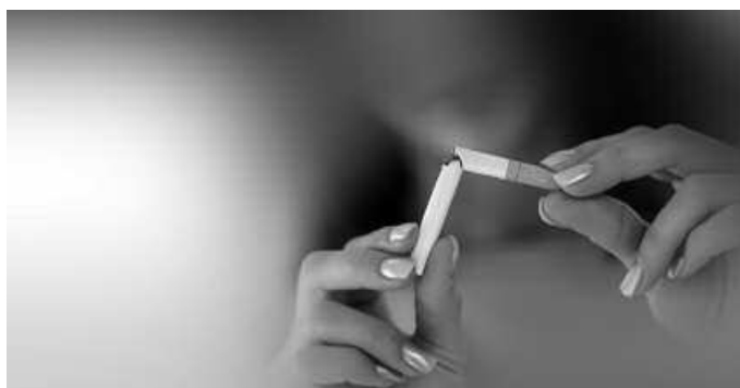
Urriaren 30ean hasi eta abenduaren 18an amaituko da.

“Dependentzia fisikoaz hitz egiten dugunean nikotinak sortzen duenari buruz ari gara”, dio Udalak bere web orrian ipini duen informazioan. “Erretzeari uztean, nikotina faltak gorputzean abstinentzia sindromea sor dezake. Honi nola aurre egin lantzen