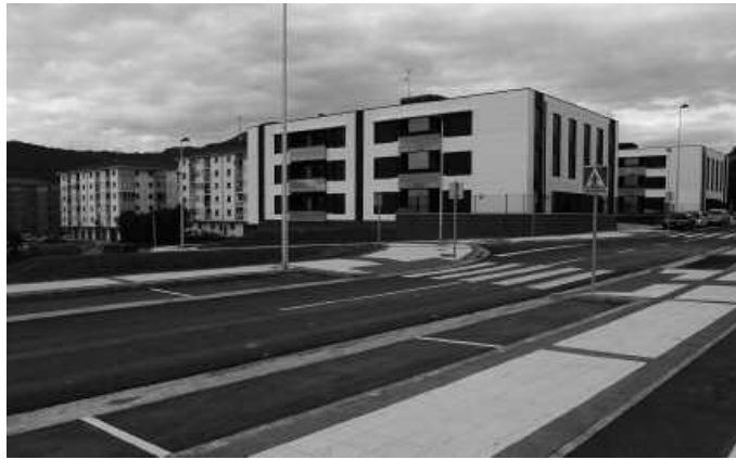
Munalurra ingurua. Itxura berria hartzen ari da.

Kale berri honen izendapena, toponimoak aztertu ostean proposatu da eta kale izendegia eguneratu beharra, hainbat helbide aldatu beharra eragin du. Modu honetan; azken lanetan murgilduak dauden babes ofizialeko bi etxebizitzek, helbide gisa, 2 eta 4 zenbakiak izango dituz-