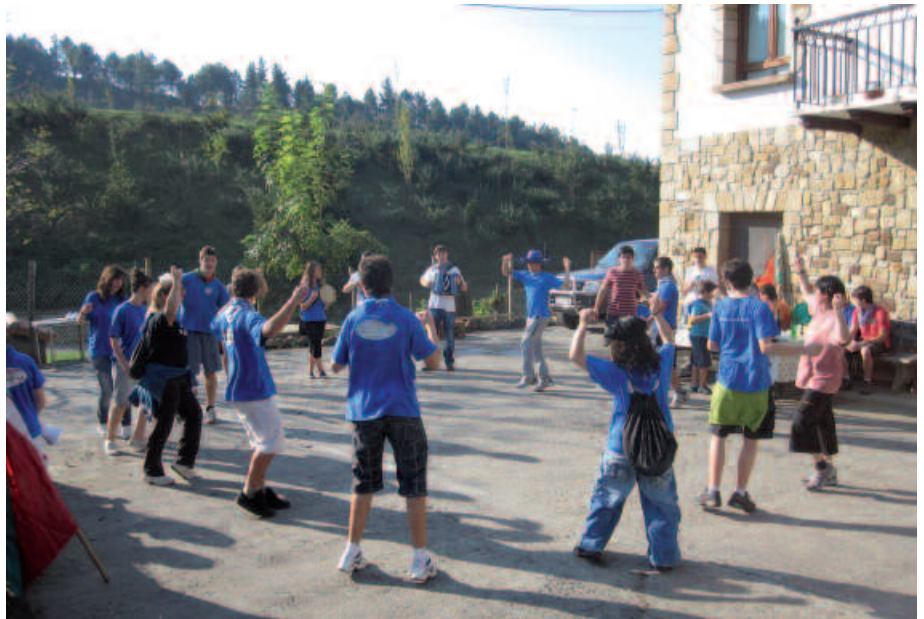
Oilasko biltzaileak larunbatean ibiliko dira baserriz baseri, eskean eta dantzan.