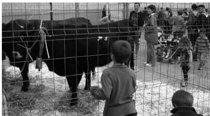
Euskal arrazako animalien erakusketa antolatu dute Euskal Jai egunerako.

Araetan egingo den bazkariko txartelak Barazarren daudela salgai. Urriaren 8ra arte egongo dira salgai.