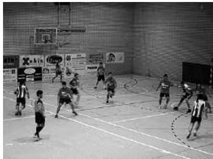
2013an beteko du mende erdia.

rantzitsua izango dela diote: "beharko genuke material guztia biltzea, bakoitzak eduki dezakeen gutxi hori amankomunean jartzeko".