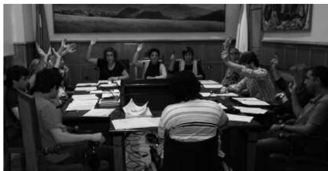
Udal hautetsiak, iraileko udalbatza plenoan.

Aipatu saioan egin zen hain zuzen, urriko hirugarren igandeko hitzordurako mahaikideen zozketa. Mahai bakoitza, mahai buruak eta bi bokalek osatuko dute, 24 herritarrek beraz. Mahai kide bakoitzera-ko titularrarekin batera, beste bi ordezkoko ere aukeratu behar izaten dira. Beste 48 Usurbi-