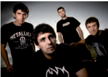
Argazkian, Hotzikara taldeko kideak. Eliza Zaharrea arituko dira ostiral honetan.