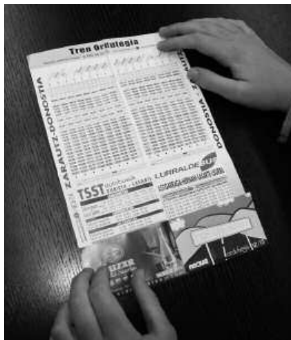
Poltsikoan eramateko moduko tamainakoa da tren-bus ordutegia.

Ale gehiago eskura ditzakezu udaletxeko udal erregistroan, kiroldegian eta NOAUA!ko bulego-