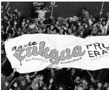
ZukGua Zarautzen aurkeztu zen. Usurbilen asanblada deitu da urriaren 12rako.

Parte hartzera deitzen diete gazteei. "Denok gara beharrezkoak. Hau dela eta, herriko gazte guzkiei, independentzia eta sozialismorantz eramango gaituen gazte mugimendu berriaren prozesu-eratzailaren parte hartzera animatzen zai-