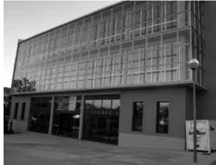
Gastuak aurrezteko, hainbat proposamen jaso dira auditoretzan.

fluoreszenteak T5 luminaria fluoreszente elektronikoengatik aldatzea proposatzen da kiroldegiko solairu ezberdinetan”. Baita igerilekuan ere, zarata, distira eta keinarik gabe funtziona dezaten. Proposamenekin, besteak beste, lanparen bizi-tza luzatu eta argiztatze denbora murriztuko litzateke, energetikoki eta ekonomikoki aurreztuz noski. Baina ez hori bakarrik. Instalakuntza elektrikoaren energia erreaktiboaren kontsumoa kontrolatzeko, kondentsadore batera bat jartzea aholkatzen dute Inergetikakoek.