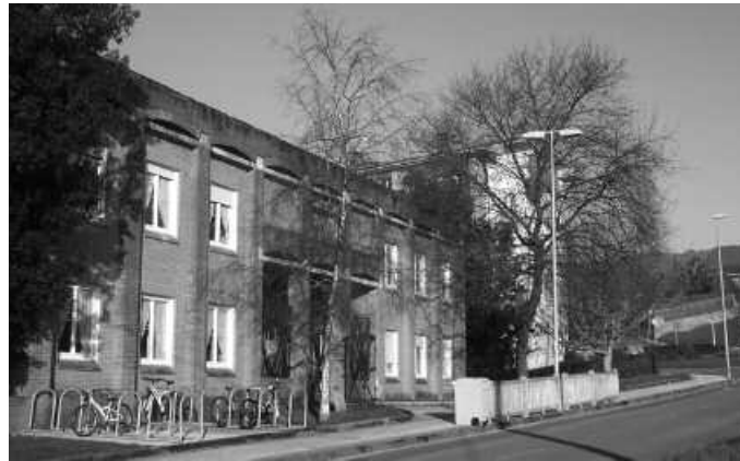
Bilerak Potxoenean egingo dira.

Urriaren 24an hasi eta otsailaren 6ra arte luzatuko den parte hartze prozesuaren baitan, zazpi bilkura burutuko dira. Bilera guztiak irekiak izango dira, nahi duen orok parte hartu ahal izango du. “0-16 hezkuntza proiektua zehazteko usurbildarrok etorkizunerako nahi dugun hezkuntza-eredu bateratua adostea eta hori gauzatzeko bideak jorratzea izango da” helburu nagusia. Gai honen inguruko