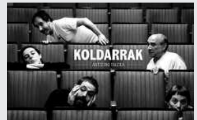
"Izan bedi emakumea" antzezlanarekin etorriko dira Sutegira.

Antzerkizale Sarea jarri du abian Euskal Herriko Antzerkizaleen Elkarteak (EHAZE), egiten diren lanei ibilbide bat emateko. Gilkitxaro, Bina-bina, Txirene, Kuku eta Koldarrak taldeen emanaldiekin osatu du irail eta urriko egitaraua. Koldarrak taldekoak Usurbilen izango dira, urriaren 26an ostirala, iluntzeko 20:00etan Sutegin; "Izan Bedi Emakumea" izeneko antzezlanaren eskutik.