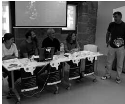
Potxoenean egin zen Antzerki Egunaren aurkezpena.