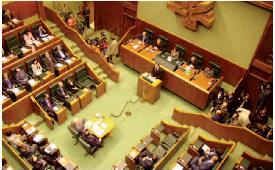
Gipuzkoan, 13 izan dira aurkeztu diren zerrendak.