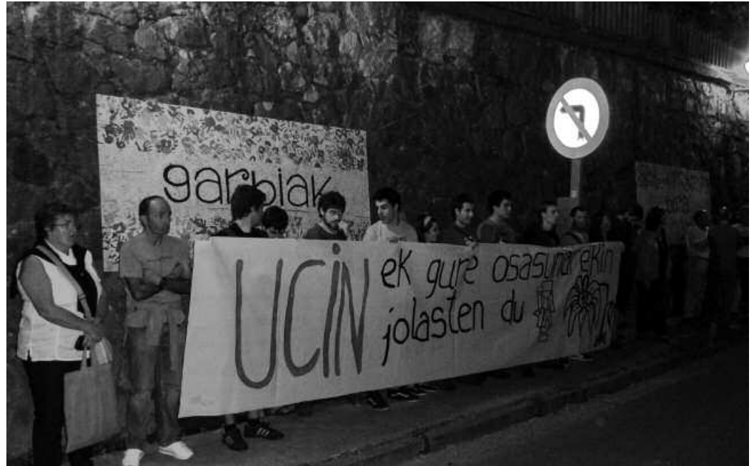
Aurreko ostiralean elkarretaratzea egin zuten Atxegalden.

honetan, baina gehienbat datorren astetik aurrera adi egotea eskatu zien. Ucin zenbait hobekuntza lan egitekotan da urriaren 12tik 14ra. Hala jakinarazi zion aipatu enpresako gerenteak Udalari, bi aldeek joan den aste hasieran burutu zuten bileran. Hitzordu horrek eman zuena azaldu zuen ingurumen zinegotziak Potxoenean. Iraga-