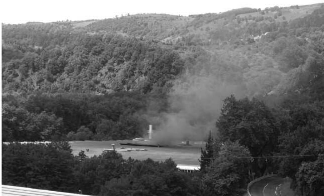
2013ko ekainean aldatu beharreko filtroak asteburu honetan aldatuko ditu Ucinak.

Uztailean, neurri zuzentzaileak hartzea eskatu zion Udalak Ucin enpresari