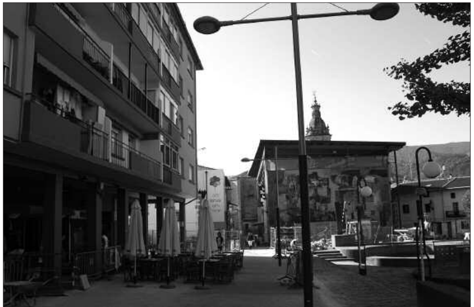
Laster amaituko dira konponketa lanak.

Erabateko normaltasuna ez da itzuli Mikel Laboa plazara, baina lanek jada ez dituzte lehen bezain beste oztopatzeko, taberna edo saltokietarako joan etorriak.