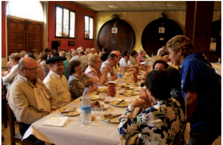
Giroa primerakoa izan zen San Praixku eguneko hamaiketakoan.