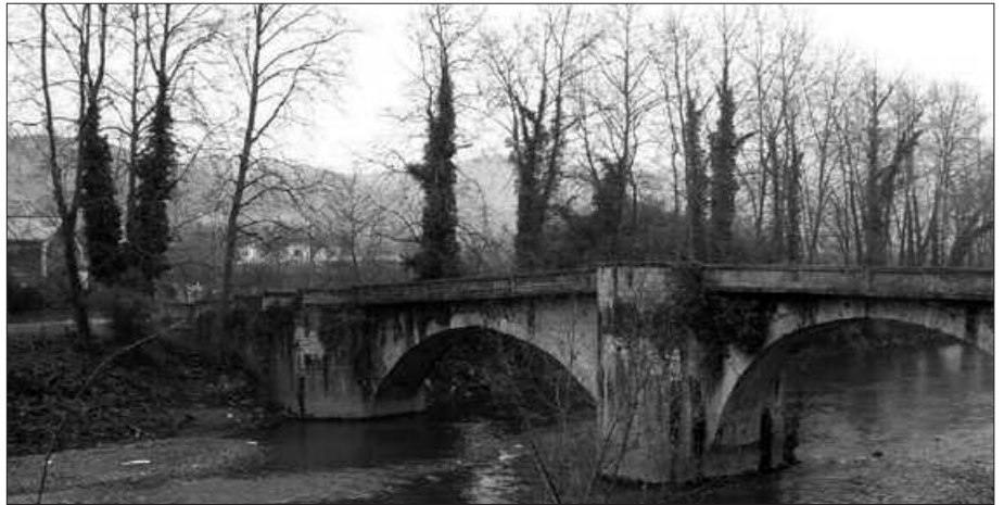
Andatzak antolatatu du argazki lehiaketa.

"Usurbil inguruan ba ditugu hainbat erre-kasto eta ibai. Oria ibaia nagusi. Uraren korrontearen gainera hiru zubi eder ibaiaren biertzak lotzen. Aliriko zubia Zubietan, Zorrotzeko zubia Santuenean, eta Altzonazkoa Txokoalden. Uraren korronteari jarraituz bideratuko dugu 2012ko argazki lehiaketa. Ziur gaude askok aprobetxatu duzuela zuen argazki-kamera hartzeko eta argazki batzuk Oria ibaian ateratzeko, eta zer esango duzue, argazki horietako batengatik saritxoren bat irabazteko aukera izanez gero...?", berri eman dute antolakuntzatik.