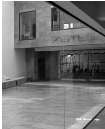
Aurrerantzean, liburu elektronikoak irakurtzeko bi gailu jarriko dira, mailegatzeko moduan.