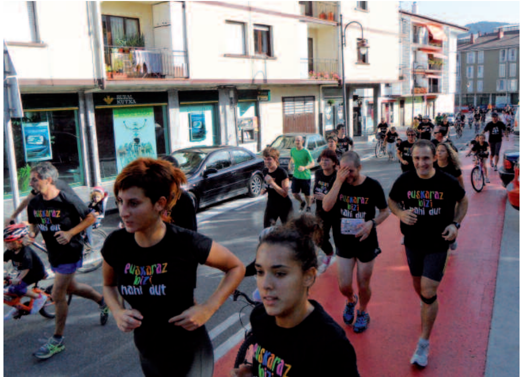
Haurrak, gazteak eta helduak korrika, irailean euskararen alde egin zen herri lasterketan.

Nagusiak bakarrik (haurrik gabe) daudenean: %48,1.