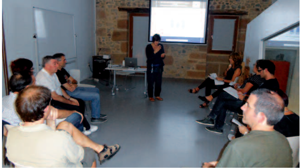
Potxoenean eman ziren ezagutzera kale neurketen emaitzak.