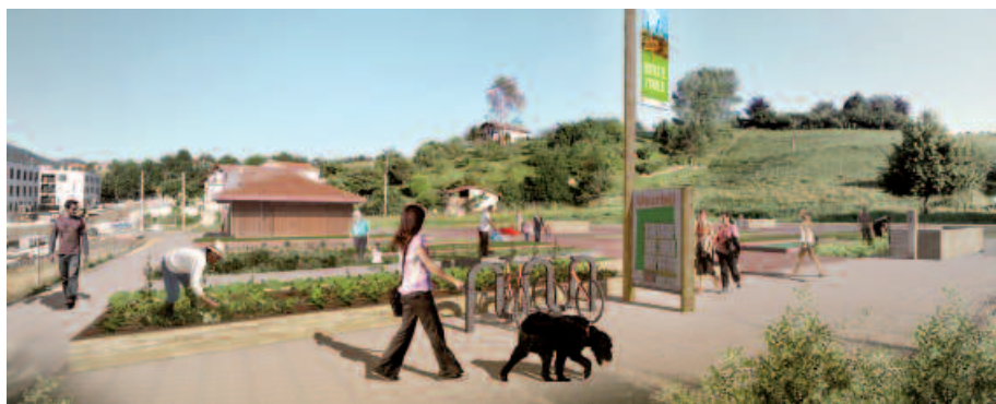
Olarriondon jarriko dira baratzeak. Argazki-muntaia honetan ikus daiteke nola geratuko den.

Sare horretan integratzen lehenak, Usurbil eta Lezo izan dira. Lezon 64 lursail egokituko dira, Usurbilen 57. Prentsa ohar bidez jakitera eman dutenez, “egokitzapen lanak hasi berri dira eta aurki herritarrek euren lursail propioak lantzeko aukera izango dute”. Lur sail ba-koitzeko erabiltzaileek komuna eta lanabesen biltegia bere barne hartuko dituen