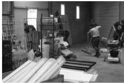
Ostegun honetan, goizeko 9:00etan elkarteko deia zabaldu dute gaztetxeok.

Beste hitzordu bat ere antolatu dute Usurbilgo Gaztetxean, kasu honetan, iganderako, urriaren 28rako. Fracking-a edo "hausketa hidraulikoa" delakoaren gaia jorratuko da bertan, arratsaldeko 18:00etatik aurrera. Horretarako, gaztetxeok Frackin Ez Araba kolektiboko partaideak gonbidatu dituzte eta hitzaldia eskainiko dute. "Euskal Herrian gas naturala ustiatzeko metodo berri bat erabiltzen hasteko asmoa du Eusko Jaurilaritzak, fracking-a. Araban hilaren 6an irten ziren kalera teknika hau guztiz gai-