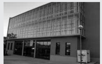
Alegazioak egiteko 30 egun daude.

-Alegazioetarako epea: 30 egun. Erreklamaziorik ez bada, erabakia behin betiko onartutzat joko da.