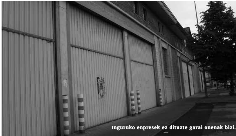
Inguruko enpresek ez dituzte garai onenak bizi.

E statuko Enplegu Zerbitzu Publikoak ezagutzera eman berri ditu Usurbilgo iraileko langabezia datuak. Albiste onik ez darte; Usurbilen berriz ere gorantz egin du langabezia joan den hilean. 339 langabetu zenbatu dituzte guztira, abuztuan baino 8 gehiago. 2005az geroztik, erregistratu den kopuru altuenetik (341, 2011ko udaberrian) gertu gaude jada.