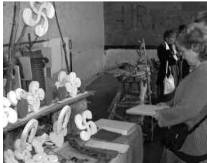
Eguerdiko 11:00etan hasiko da Aitzagak antolatu duen azoka. Aurtengoa, XVII. edizioa.

U rtero moduan, Artisautza Azoka antolatu du Aitzaga Elkarteak azaroaren 1erako. Hamazazpigarren edizioa, datorren ostegun goizeko 11:00etatik aurrera ospatuko da frontoian, aspaldiko partez antolatzaileen egoitza irekia dela gainera. Denetariko produktuez horniturik egongo diren hogeitatu bat postu bilduko dira bertan: bitxigintza, larrugintza, zeramika, otargintza... Gainera, txorizo eta taloa dastatzeko aukera izango da.