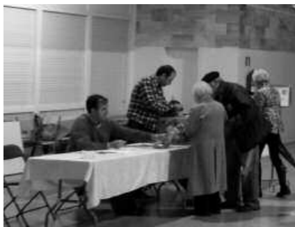
Hainbat herritar Udarregi ikastolan bozkatzen, pasa den igandean.

Herritarrek hitz egin dute hauteslekuetan eta hurrengo lau urteotako Eusko Legebiltzar berriak zer nolako itxura izatea nahi duen argi utzi dute.