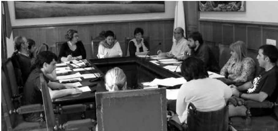
Kirol zerbitzua udal egituran txertatzeko asmoa du gobernu taldeak.

A ldaketarik ez bada, 2013ko urtarrilaren 1ean Usurbilgo Kirol Patronatua desegin eta udal egituran txertatuko dute. Aipatu erakundea desegitea hasieraz onartu zuen udalbatzak, urriaren 16an burutu zen ezohiko osoko bilkuran. Proposamenaren alde agertu ziren, Bildu, Aralar eta EAJ-PNV. Abstentziora jo zuen aldiz, Hamaikabatek. PSE-EE-ko udal ordezkaria ez zen egon aipatu saioan.