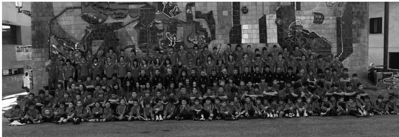
Futbol taldeko kideak, iazko denboraldiko aurkezpen ekitaldian.

Denboraldi berriari ekiteko gogotsu daude futbol taldeetako jokalariaik eta entrenatzaileak