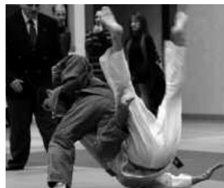
Hondarribian, Avilesen, Malagan eta Tarbesen lehiatu dira azkenaldian.