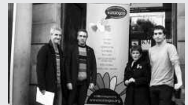
Usurbilen ere banatuko da katalogoa.

Urte amaierara heldu gara, eguberriak ate joka ditugu, euskarazko produktuak oparitzeko aitzakia ezinhobea. Baina zer oparitu? Hor dago gakoa. Erabakitzen laguntzeko, urtero moduan, jada hamabosgarren ediziora heldu den Euskarazko Produktuen Katalogo berria aurkeztu dute. Guztira, 140.000 ale banatuko dira. Hortik, sorta bat Usurbilen noski. Papereko bertsioarekin batera, noiz nahi euskarazko produktuen eskaintza eguneratzen duen web orrialdea ere hor dago: www.katalogoa.org . Bertatik ere, katalogoaren paperezko bertsioa eskuratu liteke.