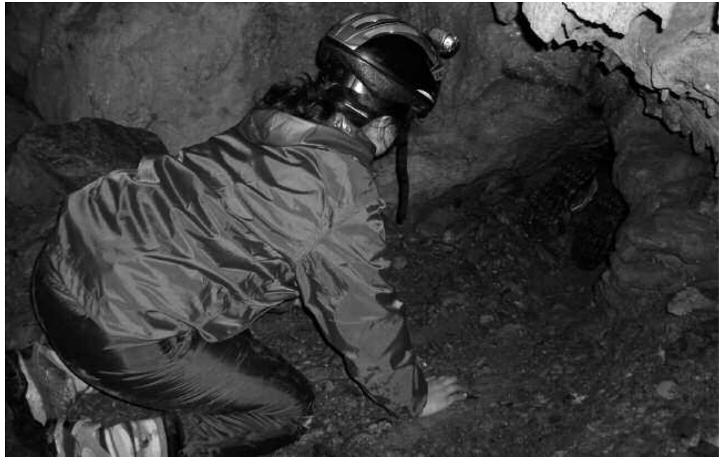
DBH1eko ikasleak Ernion aldean izan ziren eta ondoren Aia partean pasa zuten arratsaldea.

Gehiena gustatu zitzaiguna kobazuloko urak eginiko leku estuetatik etzanda eta lokatzez goiti-behera zikinduta igarotzea izan zen, baita txirrista baten moduan, ipurdiz jaistea ere. Galeria