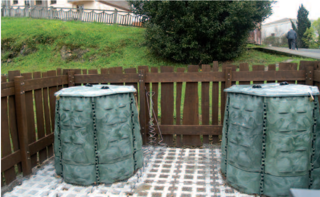
Anbulatorioaren inguruan zabalduko dute auzokonposta egiteko gunea berria.

Usurbilgo Udalak antolaturiko Hondakinen Prebentzio Asteari ekiteko, Auzokonpostariari I. Batzarra ospatu zen larunbat goizean. Gai honi lotuta, asteburu honetan, Errekatzikiko auzokonpostatzeko lehen eremua inauguratu zela urtea beteko denean, Usurbilgo Udalak berri eman duenez, egun 101 sendi dabilta Usurbilen konpostatze komunitarioa egiteko egokitu dituzten zazpi eremutan. Beste 69, itxarote zereñdian daude.