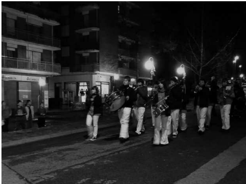
Euskal Herriko Musika Eskolaren ekimena da Musikalean.

horren guztiaren emaitza izan da. Zumarteko soto, ganbara eta gelatan landutakoarena, baina batez ere, gure ikasle bakoitzak bere kabuz egindakoaren emaitza. Ez baita gutxi musika eskolako ikasleek urteetan zehar egiten dutena!