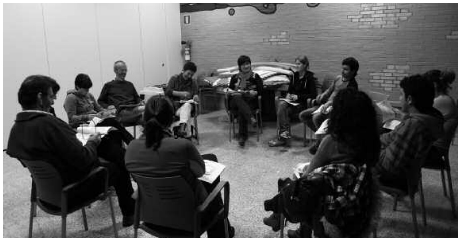
Astlehenean Aginagan izan ziren. Ostegun honetarako Potxoenean jarri dute hitzordua, 19:00etan.

A maitzear da, 2013ko udal aurrekontuak lantzeko Usurbilgo Udala auzoz auzo burutzen ari den bilera erronda. Azken hitzordua, ostegun honetarako, azaroaren