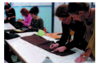
Izena emateko epea irekita dago.

10:00-12:00 Jostungintza eta bitxigintza tailerrak Potxoenean. Oharra: tailerretarako izen ematea udaletxean, 943 371 951 edo mailez: ingurumena@usurbil.net.