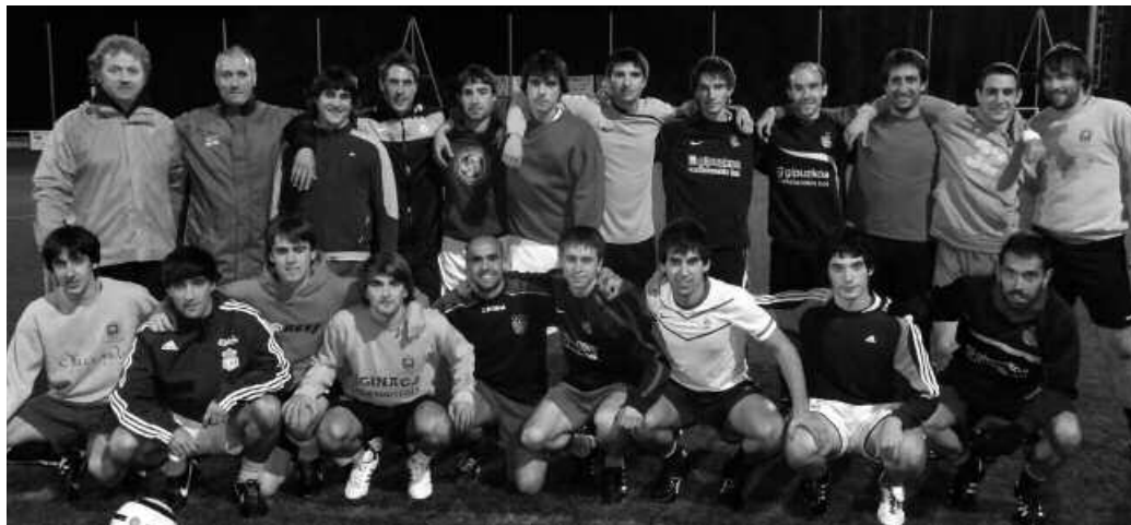
Usurbil FT taldeko jokalaria eta entrenatzailea, entrenamendu batean.

Iazko lana nabaritu da. Aurreko urtearen hasieran gehiago kostatu zitzaigun jokoa egitea eta entrenamendu saioak nahi genituen moduan betetzea. Baina iaztik hona taldeak asko hobetu du. Entrenatzea eta helburuak lortzea askoz errazagoa izaten ari da guretzat. Are gehiago, batez ere dugun taldearekin, jokalaria lagunak dira denen artean. Eta