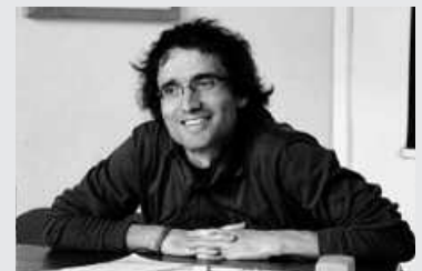
Azaroaren 30ean Sutegin.