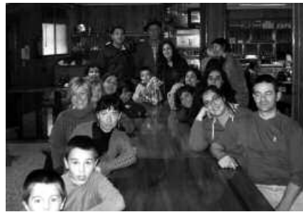
Ikasitakoa praktikan jartzea ezinbestekoa da euskara ikasten ari direnentzat.

Euskaltegitik berri eman dutenez, bostetik gora dira Usurbilen, biltzen diren taldeak. Guztira, hogeitik gora mintzalagun, gainerako herritarrek ekimen honekin bat egitera deitzen dituztenak. "Praktikatu gurekin! lemapean, beraiekin batera euskaraz gozatzeke gonbitea egiten digute", berri eman du euskaltegiak, prentsa ohar bidez. Abantailarik ere badu Mintzalagunen parte hartzeak. "Partaideek EHUko kredituak eskuratu ahalko dituzte, bidaia eta egonaldietarako deskontuak, AIZU! eta Argia aldizkariak eta Berrria egunkaria merkeago, eta beste hainbat abantaila", gaineratu dute.