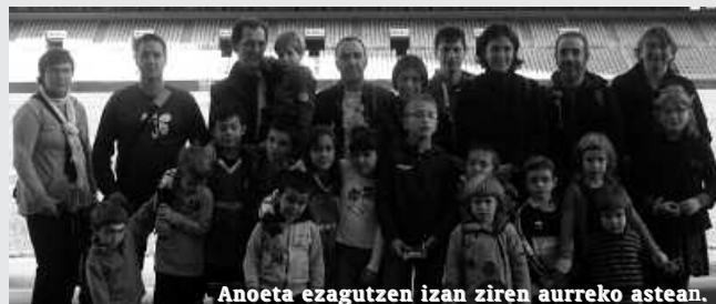
Anoeta ezagutzen izan ziren aurreko astean.

17:00 Jakin eta Jolas pailazoak. Musikaz Blai.