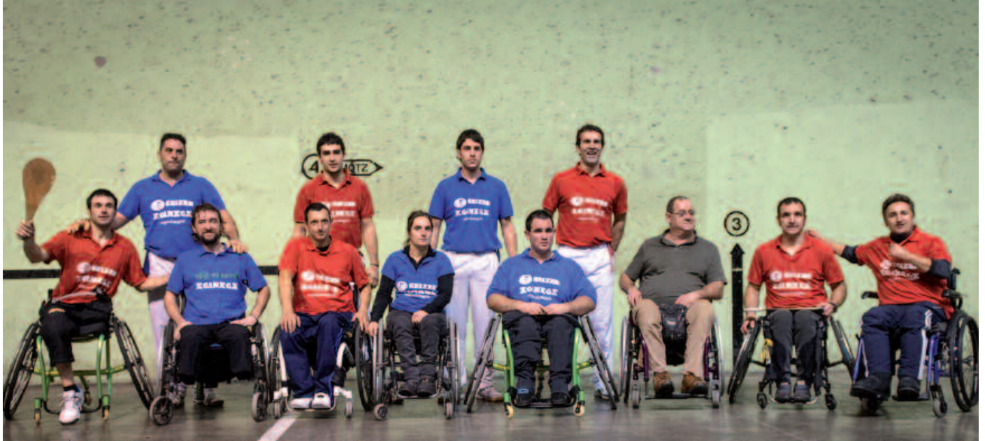
Jende askoren aurrean aritu ziren batzuk eta besteak. Pagazpe Pilota Elkartekoak oso pozik dira jaialdiak eman zuenarekin: “esker hitzak baino ez ditugu”.

J aialdiak oihartzun handia izan zuen hedabide-etan. Horri esker, jendetza bildu zen izaera benefikoa zuen pilota ikuskizunetan. Osagaiak gainera, erakargarriak ziren: profesional izandako pilotariak, herriko pilotariak, gurgildun aulkietan dabiltzan pala jokariak... Aurrekusi bezala, ikustekoak izan ziren batzuen eta besteen saioak. Dirua biltzeko antolatu zuen Usurbilgo Pilota Elkartek. Ia ba, denon ekarpenekin, behar dituzten gurgildun aulki berezi horiek eskuratzeko moduan dauden laster.