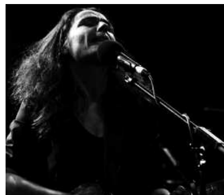
Anariren kontzertua 20:00etan izango da.