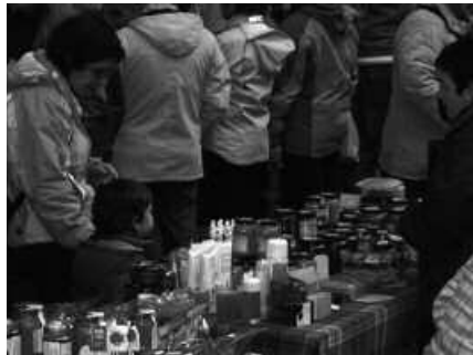
Igande goiz eta eguerdi partean ospatuko da.

Igandean, Emakumeenganako Indarkeriaren Aurkako Eguna izango da. Horren haritik, film emanaldia antolatu du Usurbilgo Udaleko Parekide-tasun Sailak. "En el tiempo de las mariposas" filma ikusteko aukera egongo da, iluntzeko 18:00etatik aurrera Sutegin (2 euro sarrera).