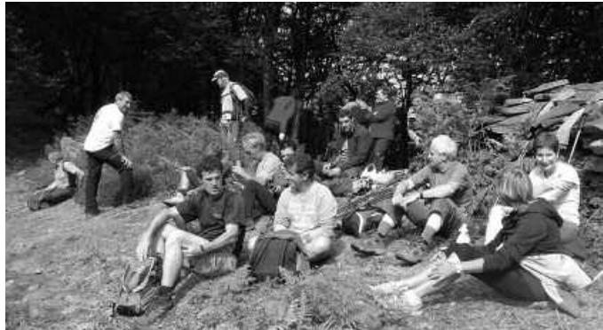
Andatzako kideak, irailean Enkarterrietara egin zuten irteeran.