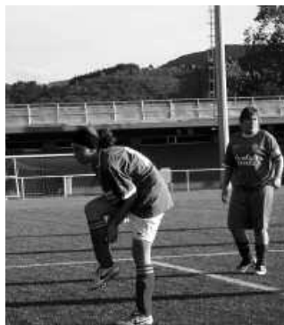
Taldea oso ondo antolatuta dagoela diote jubenil taldeko kideek.

I. Etxaniz. Etorri zenean, nesken taldea bakarrik zegoen. Haiek jarraitu ez bazuten, agian futbol taldea desagertu egingo zen. Lan handia egin zuten orduan, erregionalen taldea atera zuten. Talde lehiakor bat atera zen, mailaz igo ginen, jaitsi ere bai, berriz igo. Baina gaur arte taldea mantendu da.