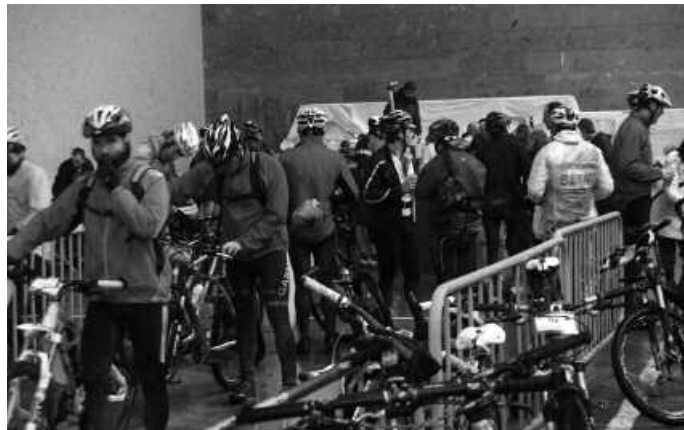
Urtarrilaren 27an abiatuko dira, 9:30ean frontoitik.

Trabesian parte hartuko dutenek, urtarileko azken igandean, goizeko 9:30ean frontoian prest egin beharko dute. Pilo-