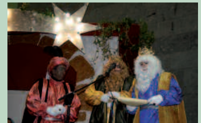
Errege Magoak, frontoira iritsi berritan.

H itzordura puntual agertu ziren urtarriaren 5ean Meltxor, Gaspar eta Baltasar. Urdaiaiatik abiatu eta frontoirainoko bidea lagunez inguratua eta gozokiak oparitzu osatu zuten. Herritarrez bete zegoen frontoian amaitu zen kabalgata. Erregeei azken desioen berri emateko edota azken gozokiak jasotzeko aukera izan zen. Errege Egun bezperako ekimen hau antolatzen duen Ziortza Gazte Elkartek "eskerrak eman nahi ditu aurtengo kabalgata aurrera eramateko urte guztian zehar laguntzen egon diren guztiei".