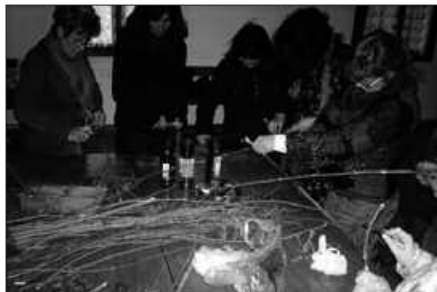
Klaseak larunbatetan egingo dira, gaztetxean.

Saio hauei buruzko zehaztasunak, ostegun honetan (urtarrilak 10) arratsaldeko 16:00etan Potxoenea kultur etxean burutuko den aurkezpen ekitaldian.