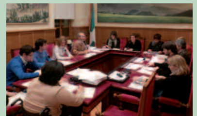
Abenduaren 20an hartu zen erabakia.

Puntu hau ahobatez onartu zen. Beraz, langileek 2013ko ordainsariak aurrerapenez kobratu ahal izango dituzte. Aurreratzeko hori borondatezkoa izango denez, langileek euren eskatu beharko dute hala egitea.