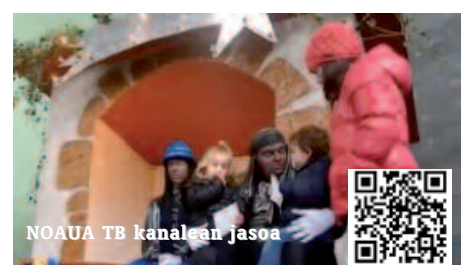
NOAUA TB kanalean jaso

QR kode hauek baliatuz, telefono bidez ikus ditzakezu irudi eta bideo hauek guztiak. Bestela, www.noaua.com web orriko "Argazkitegian" sartuz edo NOAUA! TB kanalean klik egin.