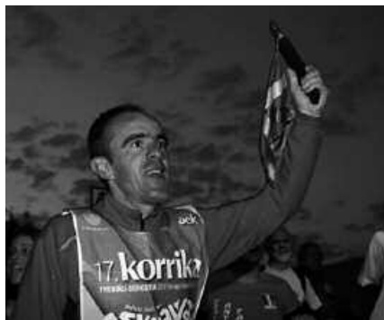
Bilera euskaltegian izango da, 20:00etan.

Euskararen aldeko lasterketa girotuko duen Korrika Kulturala Usurbilen abiatuko da, urtarrilaren 26an ospatuko den egun osoko Euskal Herri mailako jaialdi batekin. Sagardotegi erraldoi bat kokatuko dute Kaxkoan, herri bazkaria izango da, Esne Beltzaren kontzertua... Ekimen honen bidez, Korrika 18 lasterketak egingo duen moduan, euskara ikasleak