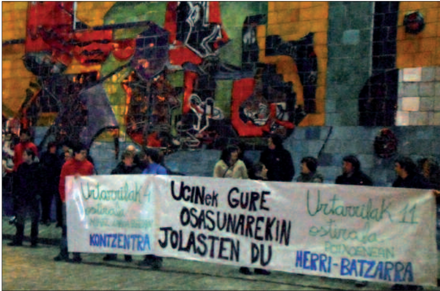
Herri batzarra deitu du ITAYAK ostiral honetarako. 19:00etan Potxoenean.

Irailaz geroztik egin bezala, joan den urtarrilaren 5a urtarrileko eta urteko lehen ostirala izanik, kutsaduraren aurkako elkarretaratzea burutu zen Mikel Laboa plazan. Itaya Gazte Asanbladak deituriko mobilizazio honen bidez, ke eta usain txarren arazoak konpontzeke jarraitzen duela gogorazi zen.