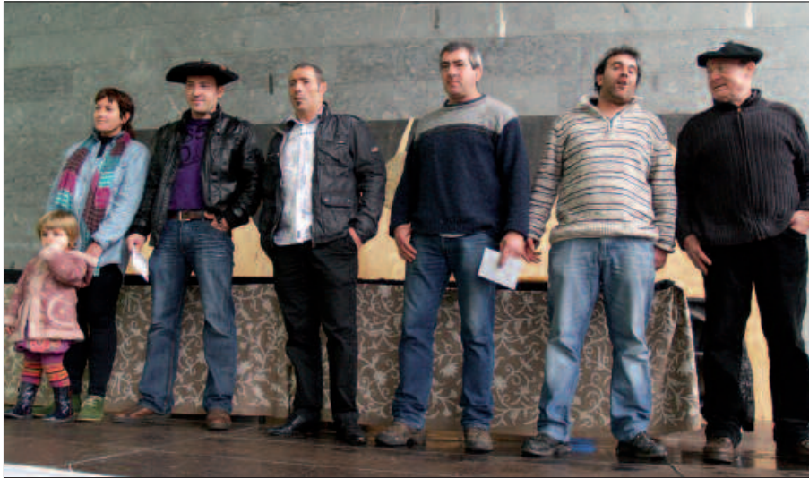
Sagardo txapelketako irabazleak, epaimahaikideekin batera.

E guberri harrera egin zien Santo Tomas azoka egunez, giro goxoak erakarrita, jendez bete zen frontoi ingurua. Batzuk, sagardo lehiaketara aurkezturiko usurbildar ekoizleen edariak dastatzera hurbildu ziren. Besteak, talo goxoak jatera. Babarrun lehiaketara aurkeztutako ekoizleen produktuak ere ikusgai izan ziren. Mugimendua baita, Udarregi Ikastolako enpostre gozoz postuan, kilometroak 2013ko antolatzaileek Dema plazan jarritako gunean, baita Herrirak Aitzaga ondoan kokatua zuen postuan ere.