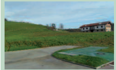
Urtarrilaren 23ra arte dago epea.

Urtarrilaren 23ra arte irekita jarraitzen du Agerreazpiko udal baratzetan zozketan parte hartzeko izen emateak. 18 urtetik gorako usurbildarrak apurta daitezke. Lurra lantzeko 30 metro karrutuko partzela bat edo bi eska daitezke. Eskatzaileen artean, lehentasunak finkatu ditu Udalak. Eskeraer udaletxean aurkeztu behar dira. Informazio gehiago bertan, edo www.usurbil.net atarian.