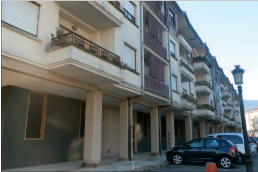
Erreka Txiki kalean badira mota honetako etxebizitzak.

L okal komertzialak etxebizitza gisa erabiltzeko ordenantza onartuta zegoen lehendik ere. Etxebizitza horiek saldu edota alokairuan jarri nahi duenak, abenduko plenoan onartu ziren oinarriak jarraitu beharko ditu. Tasatuen izaera izango dute etxebizitza hauek. Honek zer esan nahi du? Finean, zozketa bidez esleitu-ko direla.