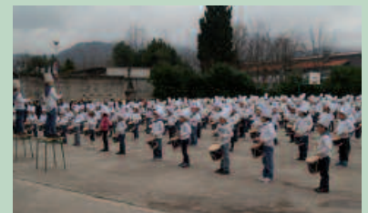
Arratsaldeko 16:00ak aldera hasiko da.

S an Sebastian Eguna bezperan ospatu ohi dute Udarregi Ikastolakoek, danborra joz. Aurten ordea, asteburuan egokitzen delako, egunbete aurreratu dute emanaldia. Hilaren 18ra, arratsaldeko 16:00ak aldera, hitzordurako egoki jantzita emanaldia eskainiko dute ikasleek.