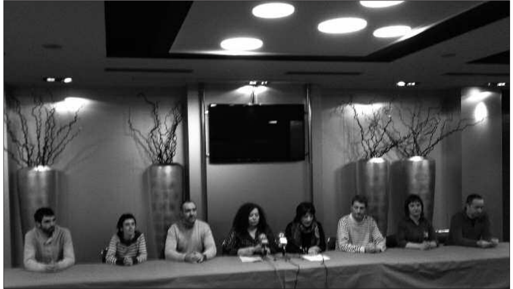
Bederatzi alderdi politikok bat egiten dute manifestazioarekin: Ezker Abertzalea, Aralar, Alternatiba, Eusko Alkartasuna, Ezker Batua-Berdeak, Eusko Ekintza, Gorripidea, Euskal Herriko Komunistak eta Antikapitalistak.

lako. Beraiei ere indarra bidaltzen zaie manifestazioen bidez. Eta beste hainbat gauza ere egin daitezke; eskutitz bat bidaltzea, edo postaltxo bat. Beraiek komunikazio hori, haize berri pixka bat eskertzen dute. Familiarrak eta lagunak saiatzen gara eten hori ez izaten, beraiek ere herriko eta familiako errealitatean txertatuta egon daitezen, baina haize berria ere eskertzen dute.