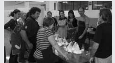
Agerialdeko jangelan eskainiko da.

Ogia egiteko ikastaroa antolatu du Usurbiltzenek, urtarrilaren 26rako. "Ikastarotik ogi eder batekin itzuliko zara etxera!", adierazi dute antolatzaileek. Ikastaroko saioa, goizez izango da, 9:30-14:00 artean, Agerialdeko jangelan. Prezioa, 30 euro. Izena emateko deitu, 608 566 683 (Benat) telefono zenbakira.