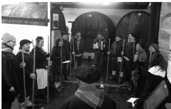
Zubietarrak 19:00etan hasiko dira kantuan; Eskola Txikitik abiatuko dira.

Ekitaldi hau amaitu eta bi ordura deitu dute bigarren hiztordua, Kantu Taldekoek eta