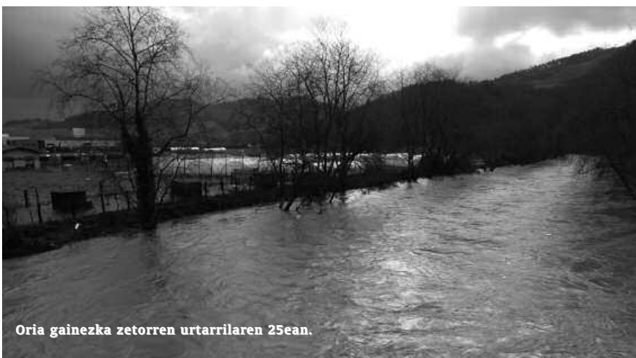
Oria gainezka zetorren urtarrilaren 25ean.

A stebete ere ez Oriak azken aldiz gainezka egin zuenetik eta udalerrira alderik alde zeharkatzen duen erriara begira ginen berriz, joan den urtarrilaren 24an. Ez gainezka egin zuelako, baina bai azken egunetan bezala hazita zetorrelako beste behin. Bere bidetik