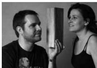
"Ispilua" antzerkiko antzezleak.

Igande honetarako antzerkia ere antolatu du Usurbilgo Gaztetxeak: "Ispilua" antzezlan,