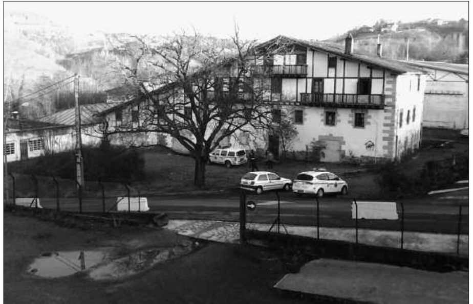
Urtarrilaren 25ean, lehen orduan, Ertzaintza bertaratu zen Ugarte baserrian. Albistearen sare sozialetan zabaldu zen berehala. Argazki hau Facebook orrialdetik hartu dugu.

Okupatu dutenetik hona, oso harrera ona egin zaiela adierazi zioten NOAUA!ri: "batez ere gaztetxeko jendea dugu ondoan, eta asko lagundu digute". Denak daude langabezia eta hiru ikasle dira.