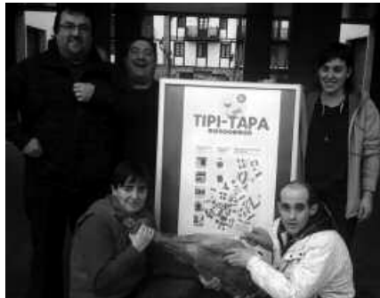
Urdaiazpiko pintxoak izango da igande honetako Tipi-Tapa ibilbideko "izarra".

2 euroren truke, ezkur-urdaiazpikoz egindako pintxo bereziarekin batera urteko ardoa (zuria, gorria edo beltza), txakolina, sagardoa, zurittoa, muztioa edo ura izango dira eskuragarri, eta ezkur-urdaiazpikoz egindako pintxoak bakarrik nahi duenak 1,5 eurotan eskuratu ahal izango du.