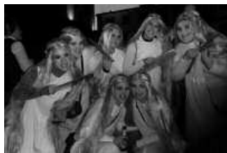
Iaz mitologia izan zen mozarrotzeko aukeratu zuten gaia.

Inauteri Festako mozarrotzeko gaia musika izango dugu, eta musikak girotuko ditu kaleko bazter guztiak. Aurreko urteetako bi txaranga taldeek ez dute hutsik egingo, ezta aurtengo ere; eguerdian, Zumarte Musi-