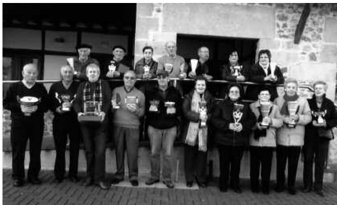
Iazko txapelketetan sarituak izan ziren lagunak.

Otsailak 20, asteazkena toka eta igel jokoak. Sari banaketa eta askaria partaideentzat. Antolatzailea: Gure Pakea.