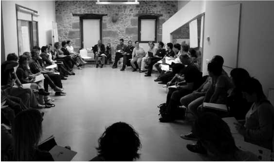
Otsailaren 6an egingo dute parte hartze prozesuko azken bilera, 18:30ean potxoenean.

O tsailaren 6an amaituko da urrian abiatutako hezkuntzako parte hartze prozesua. Helburua, etorkizuneko Usurbilgo hezkuntza eredia bateratua adostea da. Prozesuko azken bilera, ai-