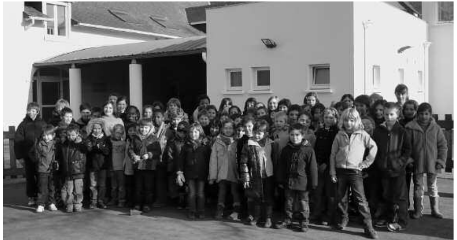
5.120 euro batu ziren abenduan Eperra ikastolaren alde. Esker onez, ikasleek argazki hau igorri digute NOAUA! aldizkarira.