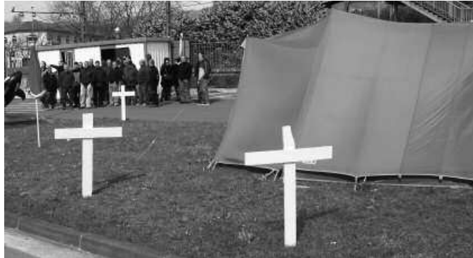
Protesta giroa isildu da azkenaldian, baina langabeziaren kopuruak gora jarraitzen du etengabe.

Buruntzaldean edota Gipuzkoa mailan ere beste hainbeste, langabetu kopurua bazter guztietan igo da. Herrialde mailan esaterako, 2011ko abenduan 41.130 lagun zeuden lanik gabe, urtebete beranduago 47.688 ziren langabezian. 6.558 langabetu gehiago urtebeteko epean. Halere, langabezia tasa baxena duen herrialdea dugu Gipuzkoa, %12,59koa hain zuzen. Gai-degiaren arabera, Euskal Herri osoan 230.959 langabetu zirela agurtu genuen iazko urtea, %14,8ko langabezia tasarekin (2011 amaieran, tasa %12 zen).