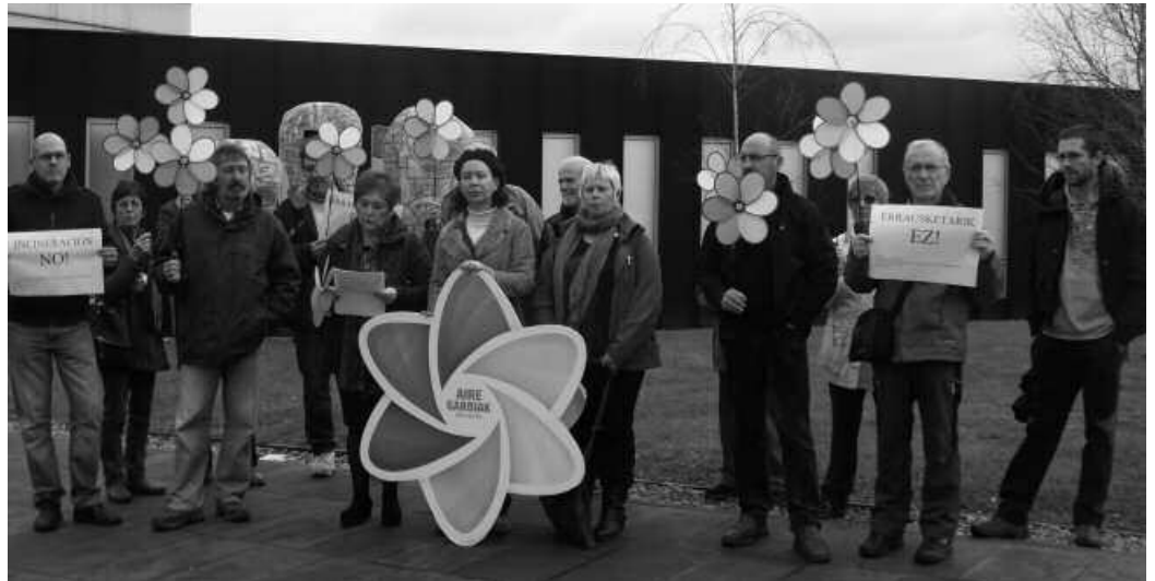
Hainbat taldek prentsaurrekoa eskaini zuten Gipuzkoako Batzar Nagusien atarian.

Batetik, “swap” izeneko finantza produktuaren inguruko argibideak eman zituzten: “Bakarrik 9 milioi erabili eta 90 milioiren interesak ordaintzen ari gatzaizkie herritarrok bankuei swap hori sinatu zutenen erruz”. Finantza produktu “espekulatibo” horrek errauste planta egitasmoaren atzean dagoen enpresa taldeari soilik egiten diola mesede eta bere helburu nagusieta-