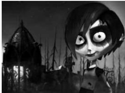
Animaziozko film hau jatorriz katalana da.

Dixie nerabe bihurria da. Bost urte pasatu dira gurasoak banandu zirenetik, eta, orduz geroztik, neska diferentea izatearekin amets egin du Dixiek. Institutuko lagunek ez dute normaltzat hartzen, haren janzkera eta portaera guztiz diferentek baitira. Halako batean, gertaera latz batek