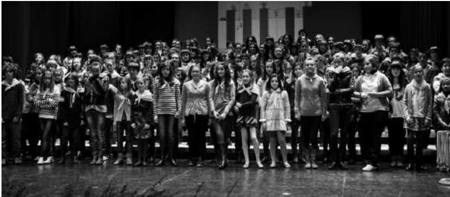
Partehartzaile denei ematen zaie domina eta agiri bat.

A ndoaingo Piano Jaialdia ospatuko da asteburu honetan. Andoaingo Udalak eta Seiasle Elkarteak elkarrekin antolatzen duten jaialdi honek zortzigarren edizioa beteko du eta, honakoan ere, izango da Zumarteko ikaslerik jaialdian.