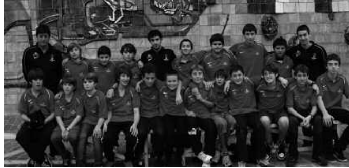
Denboraldi polita osatzen ari dira taldeko jokalariek.