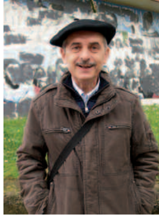
Pelloc eta sendiak eskerrak helarazi nahi dizkiete laguntza eskaini zuten guztiei.

Bai. Egunkarian denbora labur egon nintzen zuzendari. Ni auzitik kanpo geratzen naiz preskribituta dagoelako. Poliziak jakin behar zuen hori. Orduan ni zertarako behar