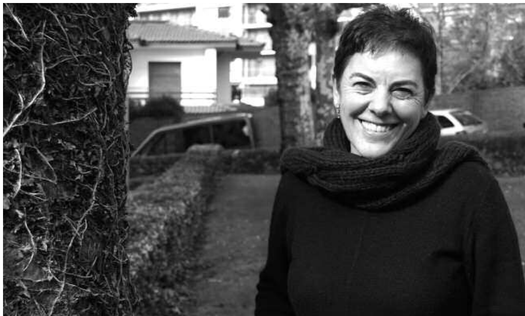
Egoera ekonomikoa ez da erraza eta horrek ere eragin du 2013ko udal aurrekontuak osatzerako orduan.

Krisi egoera zail batean kokatzen dituzue aurrekontuok. Zer aurreikuspen ditu-