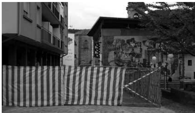
Mikel Laboa plazako lanak amaituko dira aurten.

-Hirigintza Plan Orokorra garatzen hasteko partida: "Garantzitsua da, herriaren etorkizuna marrazten duen erabakia da. Hiru bat urteko lanketa