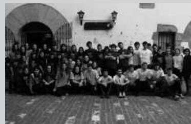
Lasarte-Oria eta Usurbilgo gazteek hartu zuten parte ginkanan.

Korrikaren aldeko ginkana ospatu zen larunbatean Usurbilen. Abiapuntua, Aitzaga ataria izan zen. Ekimena abiatu baino lehen, ondoko argazkia atera genuen. Azkenean, "Lekukoaren bila" izeneko ginkana honetarako sei talde osatu ziren, horietako bat (kamiseta horiekin) usurbildarrez osatua. Gainerakoak lasartearrak ziren. Etxekoek irabazi zuten. Laster, Irunen jokatuko dute Gipuzkoako kanporaketa.