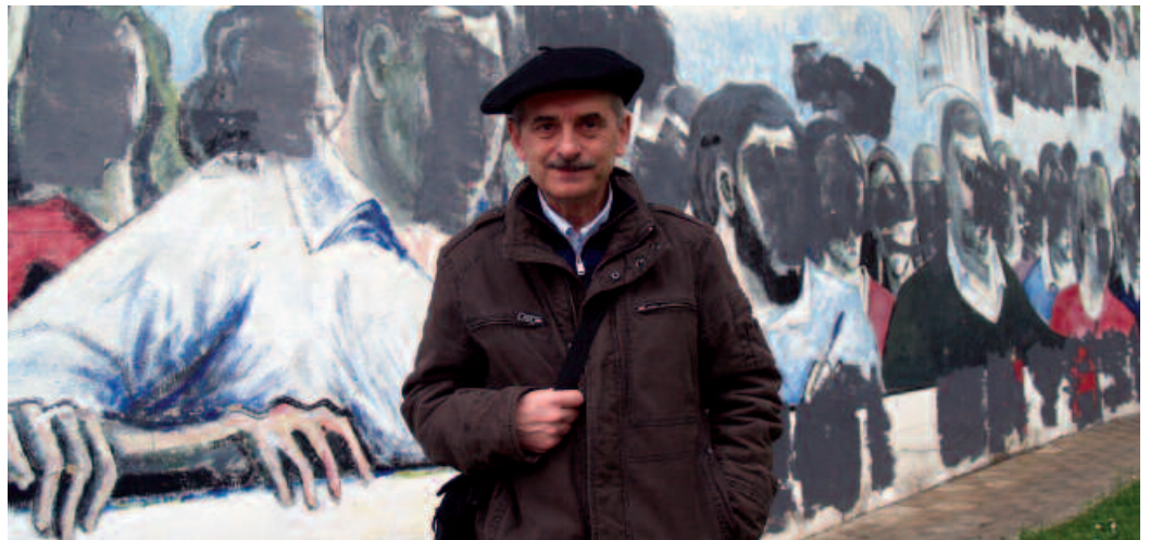
Zazpi urteren ondoren absolutzioaren berri jaso zuten. Auzi ekonomikoaren afera, ordea, zabalik dago oraindik.

Euskaraz funtzionatzen zuen mundu oso baten kontrako eraso bat zen. Asko gogoratzen gara Eginen itxierarekin, Joxemi Zumalabe fundazioarekin, 18/98. AEKren kontrako eraso ere izugarria izan zen eta hori ere gertutik bizitzea tokatu zitzaigun. Bestalde, ETA edo ezker abertzalearen inguruaren ideia horrek kalte handia egin du, baina ez da duela hamar urteko kontua. Egunkaria sortu