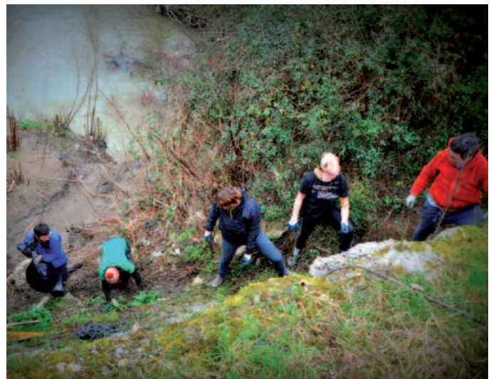
20 bat lagun aritu ziren gogotik lanean.