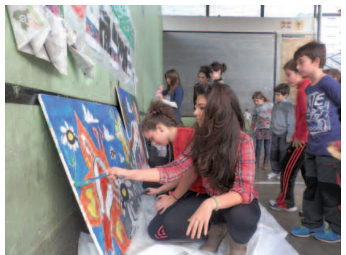
Gaztelekukoek mural bat margotu zuten frontoian.