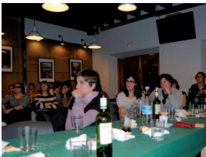
Artzabal txiki geratu zen. Txartelak berehala agortu ziren.