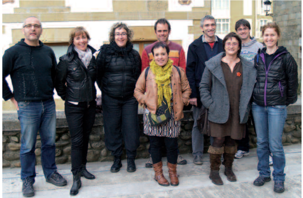
Argazkian, talde eragileko ordezkariak.

Talde eragilea. Usurbilgo eskoletan nahiz ikastolan nolako hezkuntza-eredua nahiko genukeen adosteko bildu gara. Bakoitzak bere definizioa zuen buruan eta denok ados