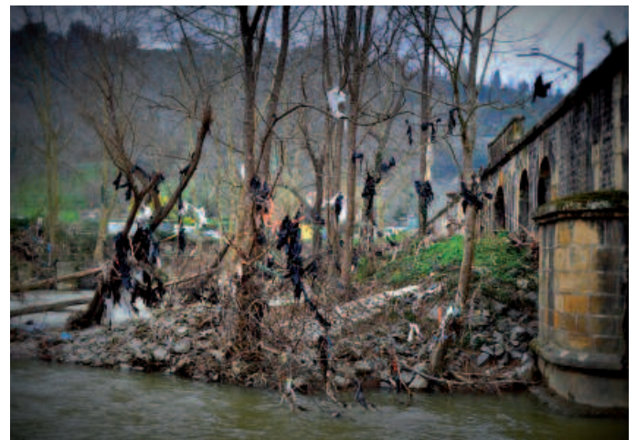
Negutegietako plastiko zati handiak eta metalak ere kendu zituzten.