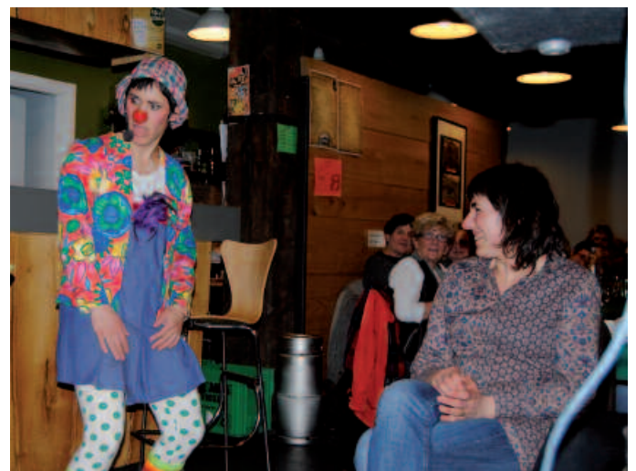
Bertso-afarian elkartu zirenek klown saioaz ere gozatu ahal izan zuten.