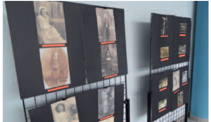
Argazki erakusketa zabalik dago oraindik.

Baina ez dira hemen amaitzen, Emakume Langilearen