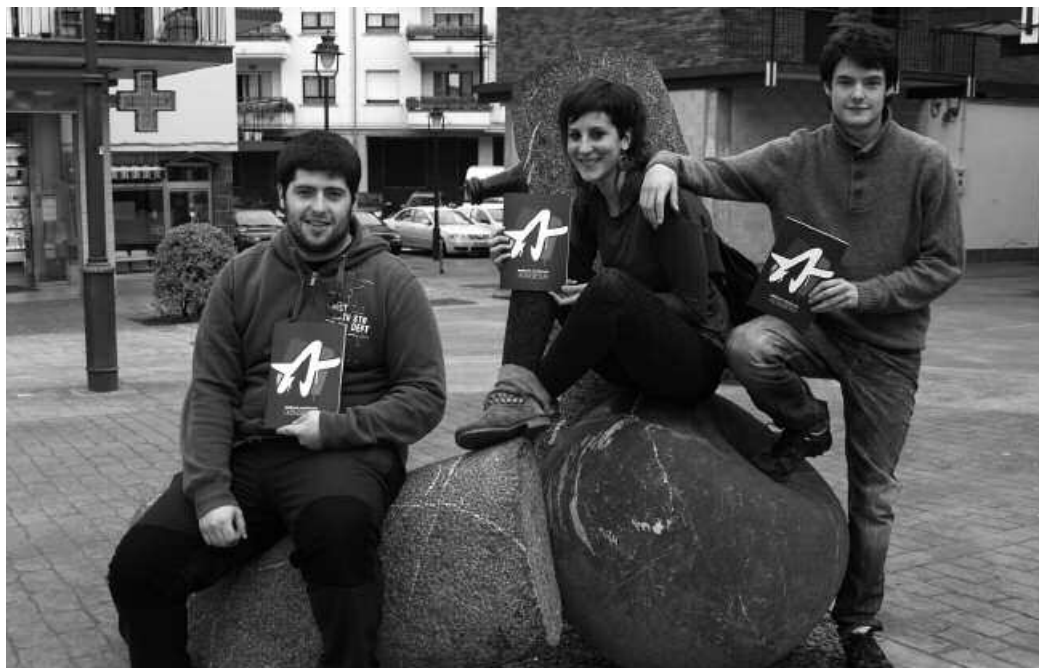
Ernai gazte erakunde osatu berri da. Usurbilen ere izango du bere lan-talde propioa.

M artxoaren 2an Lizarran eginitako estreinako kongresuan sortu zen Ernai, nazio mailan egituraturiko Ezker Abertzaleko gazte erakunde berria. “Euskal estatu sozialista eta feminista” dute helburu. Ernaik auzo eta herrietan egon nahi du, eta horren erakusle, Usurbilen sortu den lan-taldea. Apirilean aurkezpen publikoak egitekoak diren arren, gazte antolakunde berriari buruz edota martxoa amaieran Urduñan ospatuko den Gazte Danbadaz jardun dute aipatu lan-taldeko ordezkariak NOAUA!rekin.