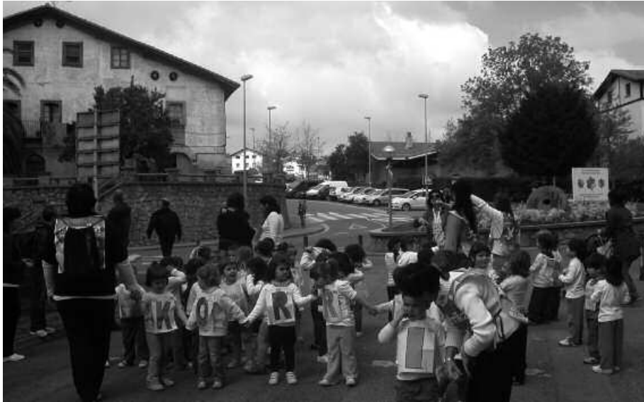
Korrika Txikia martxoaren 21ean ospatuko da. Argazkian, duela bi urteko edizioa.

Ostegun arratsalde honetako 16:00etan abiatuko da 18. Korrika, Andoaingo Martin Ugalde kultur parketik. Hamar egunez Euskal Herria alderik alde zeharkatu ostean, Baionara helduko da martxoaren 24an. Egun horretan, Lapurdiko hiriburura joateko autobusa antolatuko du Korrika Batzordeak. Usurbildik berriz, helmugara ailegatu bezperan igaroko da euskararen aldeko lasterketa. Hilaren 23an, larunbat arratsaldez.