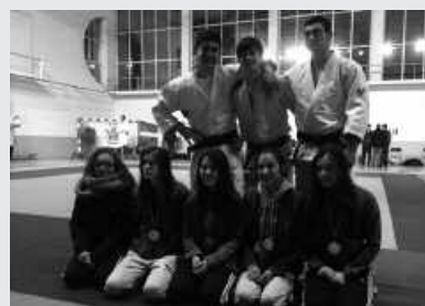
Euskadiko Txapelketan aritu berri dira.