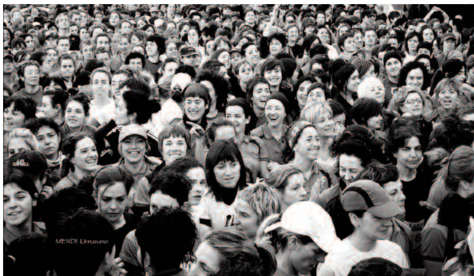
Usurbildar ugari aritu ziren Donostiako Lilatoian parte hartzen.

B ost kilometroko ibilbidea osatu zuten parte hartzaileek, martxoaren 3an Donostian ospatu zen proban. Lilatoiko korrikalari kopurua gorantz doa urtez urte. Edizio honetan, iaz baino 700 dortsal gehiago banatu dituzte. Hona hemen, 2013ko Lilatoiko web orrialdean, bilatzailean Usurbil idatzi eta agertu zaigun herritarren zerrenda: