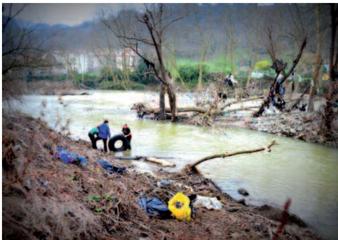
Gehien bat plastikoa, egur zatiak eta tela zatiak jaso zituzten.