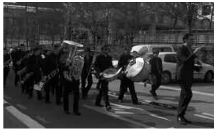
Aurreko igandean Zumaiaiko Musika Bandaritu zen, kalejiran lehenik frontoian ondoren.