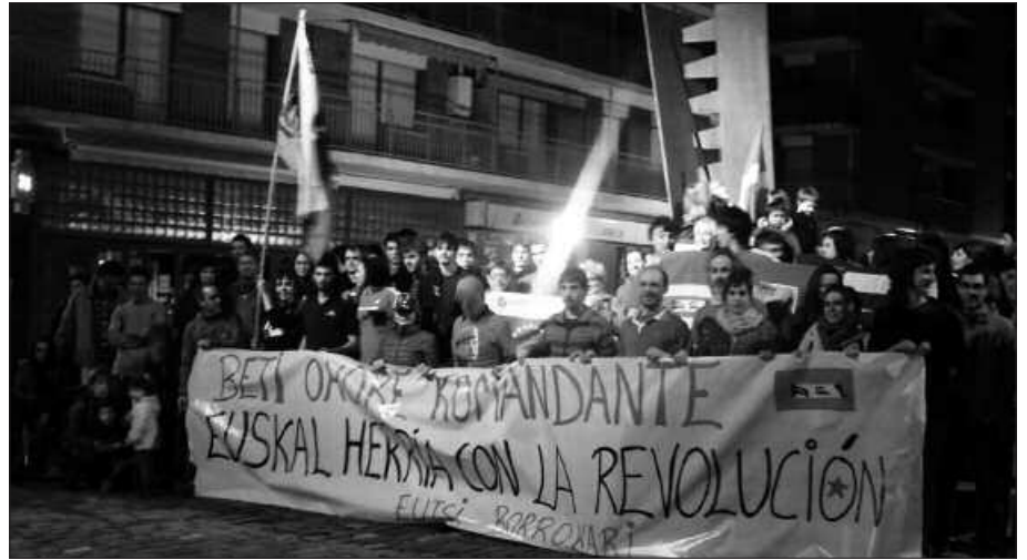
Venezuelako gobernura bidaliko dute argazkia, dolu adierazpen gisa.

B eti ohore komandante, mezu horren atzean hainbat herritar bildu ziren joan den ostiral iluntzerako deitua zegoen elkarretaratzean. Zendu berria den Venezuelako presidente Hugo Chavezen oroimenez, bere aldeko estatu hiletak egin ziren egun berean, dolua adierazteko mobilizazioa burutu zen Mikel Laboa plazan. Aurretik eginiko gonbitari erantzunez, hainbat herritar iraultzaren kolore gorriko arropekin agertu ziren hitzordura. Ekitaldian taldeko argazkia atera zen. Asmoa, dolua adierazpen gisa, Venezuelako gobernura bidaltzea da.