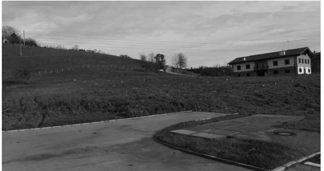
Udaletxeak egin duen eskaintzara animatu diren herritarrak asko izan dira.

-Zozketa egingo da, alde zurretik jakinaraziko den egun, ordu eta lekuan. Modu