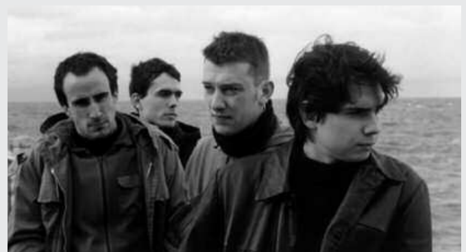
Sen taldea, aspaldiko promozio argazki batean.

H amar urtez agertokietatik kanpo egon ondoren, taula gainera itzuliko da Sen taldea. Eta garai berriko lehen kontzertua Usurbilgo gaztetxean eskainiko dute, larunbat honetan. Bi dira iragarri dituzten saioak: lehena Usurbilgoa eta, bestea, Gazte Danbada jaialdian, Arabako Urduñan egingo den ekitaldian. Baina gehiago ere etorriko dira. Gauzak ondo bidean, emanaldi gehiago eskainiko di-