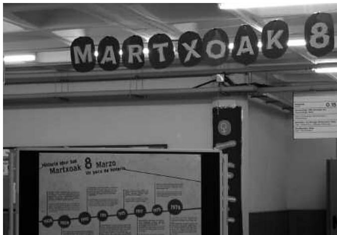
Martxoaren 8ko ospakizuna 1977an ezarri zen ofizialki.

1909. New York berriro ere. 15.000 emakume langileek "Ogia eta larroxak" lemapean protesta. Babes ekonomikoa eta bizi-kalitatea eskatu zuten; baita boto eskubidea eta