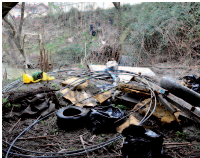
Eski batzuk edota aspiradora bat ere “agertu” ziren zaborren artean.