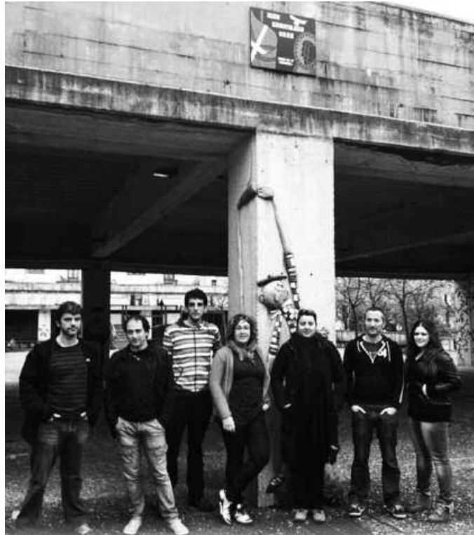
Askatasuna plazan, Sortuko herri kontseilua osatuko duten herritarrak.

S. U. Egun hauetan izaten ari gara epe labur eta erdira jorratu beharreko lan ildoak finkatzeko batzarrak, eta, nagusiki bi lan ildo jorratuko ditugu; batetik, gatazkaren ondorioei dagozkion gaiak, eta bestetik,