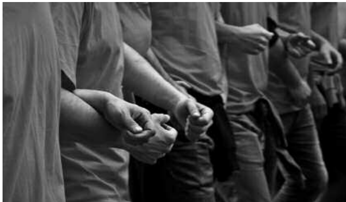
Aurreko astean, Donostiako AskeGunean eginiko mobilizazio bat.

Duela gutxi, Ernai gazte taldea osatu da Usurbilen. Gazte mugimendu orok bere egitura propioak garatzeko aukera izatea, albiste ona izango da bere horretan, ezta?