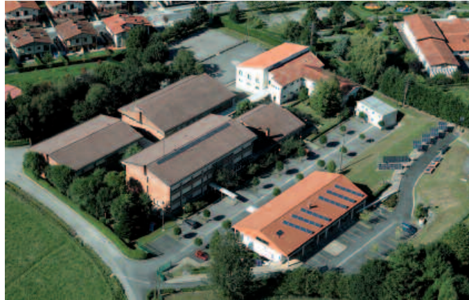
Asesoramendu gisa funtzionatzen du Zubikasik.