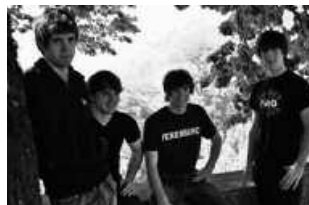
Astelehenera arte dago bozkatzeko epea.

Bertan, "Gaua" abestian klikatu, datu pertsonalen formulario txiki bat bete eta kito. Datorren astelehenean, Gazte-ako "B Aldea" saioan, Entzu-