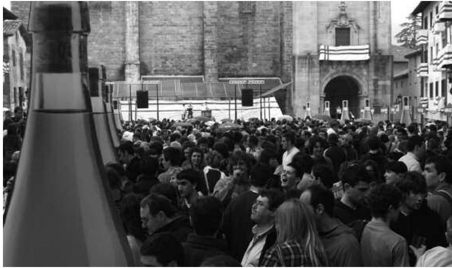
Maiatzaren 19an izango da Sagardo Eguna. Aurretik izango dira hainbat ekitaldi.

E z ahaztu honako data hau; maiatzaren 19a. Eguna horretan ospatuko da XXXII. Sagardo Eguna. Sagardo Egunaren Lagunak taldeko kideak antolakuntza lanetan murgilduak daude jada. Baina ez eurak bakarrik, baita beste zenbait eragile ere. 2013ko edizio honen bueltan sagardogintzari loturiko beste hainbat ekitaldi ere antolatu baitira, hilabete honen amaieran hasi eta ekaina heldu artean. Deialdi guztiok, "1. Sagastia Loretan" izeneko egitarauan bildu dituzte.