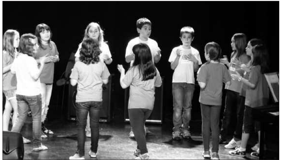
Asteburu honetan, Zumarte Abesbatzako 15 lagun Hondarrbian izango dira tailer batean.

Zumartekoak nahiz izena eman duten gainontzeko abesbatzako kideak bi zuzendari hauen esanetara arituko dira. Te-