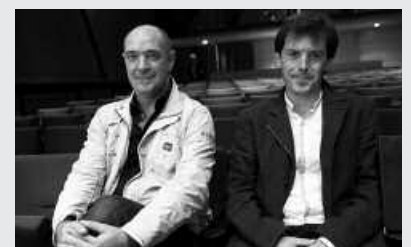
Apirilaren 28an igandea, 19:00etan Sutegin.

Sarrerak Txiribogan eta NOAUA!n jarriko dira salgai 10 eurotan (NOAUA!ko bazkideek 8 eurotan eskura dezakete, baina alde zuzen erositako NOAUA!n).