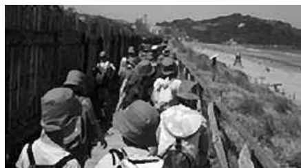
Apirilaren 19an itxiko da ingeles udalekuetan izena emateko epea.

M artxoaren 13ko Artezkaritza Kontseiluak, Udarregi Ikastolako urteroko ohiko batzar orokorra deitzea erabaki zuen apirilaren 25erako. Datorren ostegunerako, bi deialdi egin ditu. Lehena, arratsaldeko 18:00etarako eta hala badagokio, bigarrena 18:30erako, Udarregi Ikastolako erdiko aretoan.