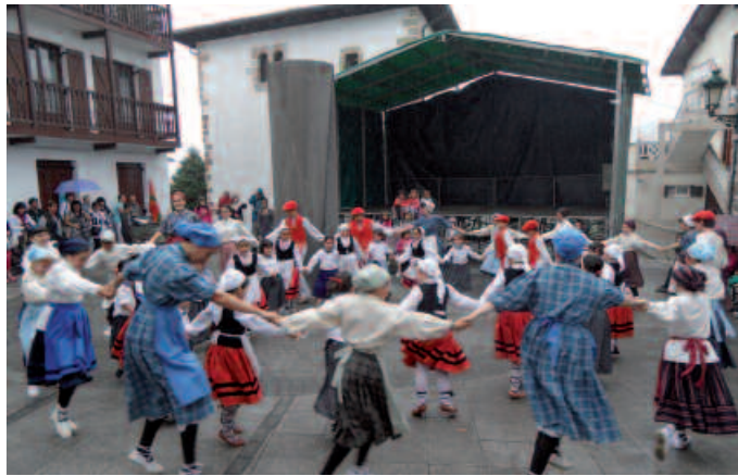
Egun osoko egitaraua prestatu dute datorren asteko larunbaterako.

Egun berean inauguratuko dute bestalde, Usurbilgo Dantza Taldearen erakusketa. Bertan, bilgune honi loturiko material desberdina ikusteko aukera egongo da, apirilaren 27tik maiatzaren 5era, 17:30-20:00 artean Sutegiko aretoan.