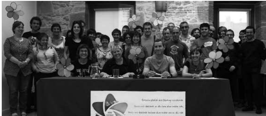
Zero Zabor taldeetako ordezkariak, Potxoenean.

G ipuzkoako hainbat udalerrietan osatuak dauden Zero Zabor taldeek mozioak aurkeztuko dituzte euren herrietako udaletxeetan. Konpromiso etikoa hartzea eskatuko diete, aipatu erakundeoi. Hondakinak murriztu, birziklatze emaitza hoberenak dituen bilketa sistema martxan jarri eta herriarren parte hartzea bultzatzeko konpromisoa bere egitea galdegingo diete udalbatzei hain zuzen.