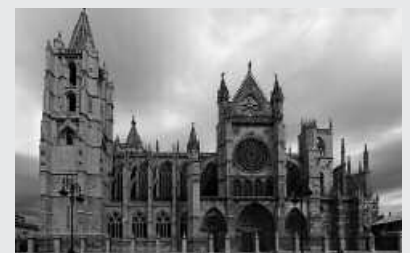
Artzabalen eman behar da izena.