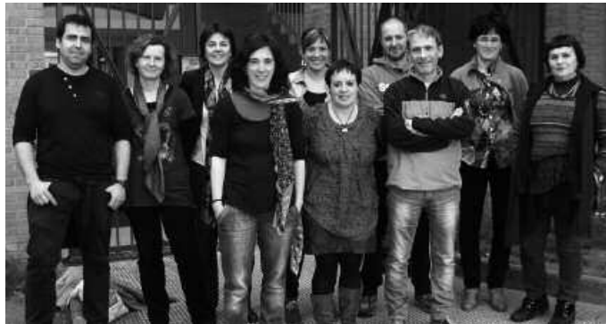
Artezkaritza Kontseilukoek pozez eta arduraz hartu dute erronka.

Batetik, diru-laguntza iturria delako, baina ez soilik. Gure ustez, euskara eta euskal kulturaren aldarrikapenerako eta sustapenean laguntzeko; herrian ikastolaren alde lan egite-