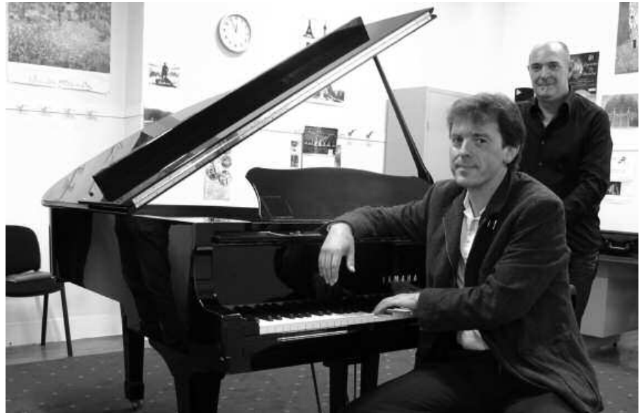
Igande honetan, ‘Bi arreba’ ikuskizuna eskainiko dute Sutegin.

Emanaldi ugari egin dituzue. Eta badituzue gehiago begibistan. Horrelako erantzuna espero al zenuten?