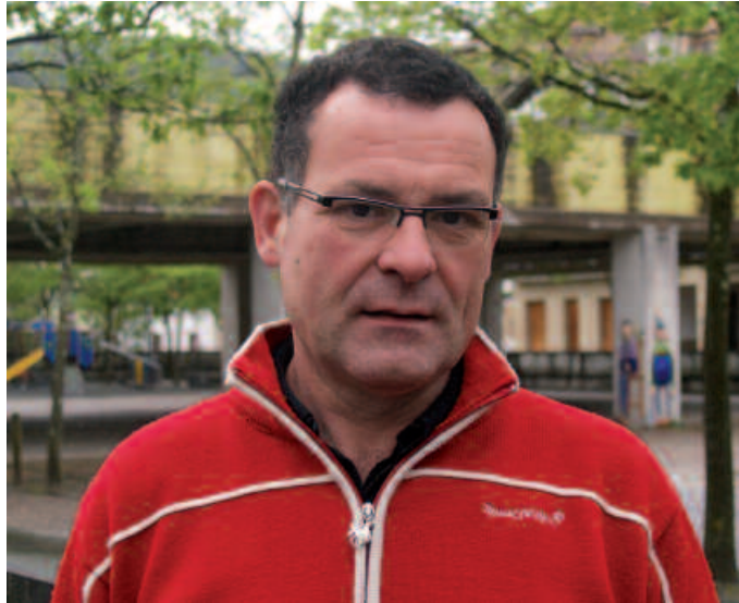
Jakoba Errekondok larunbat honetan gidatuko duen ibilaldi batekin hasiko dira Sagastiak Loretan jardunaldiak.

J. E. Sagardo Eguna maiatzaren 19an izango da. Sasoi honetan tokatzen da beti. Zergatik ez hor sartu genion. Aurten azpimarratzeko moduko zerbait gertatu da; jende desberdin piloa elkartu dela gauzak egiteko. Sagardo Egunaren Lagunak taldekoekin batera, baserriarren kooperatiba, Usurbilgo sagastien enpresa, Itaya, sortu berri dugun Sagardoaren