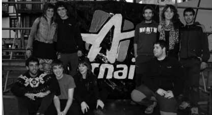
Ernai gazte talde berria aurkeztu zen aurreko larunbatean.

"Aske gunean eginiko herri-harresian beraien porrei elkartasunarekin erantzuten genien, mehatxuei auziperatuak maite genituela oihukatuz, beraien eraso bakoitzari kemen, maitasun eta indar gehiagoz eran-