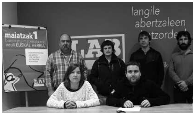
Manifestazioa eguerdiko 12:00etan hasiko da.

Eredu sozial berri bat defendatzen du LAB sindikatuak, "aberastasun banaketan oinarrituko den lan harreman eta babes sozial eredu berria" Euskal Herrirako. Horretarako, ezinbestekotzat jotzen dute "burujabetza politikoa eta eko-