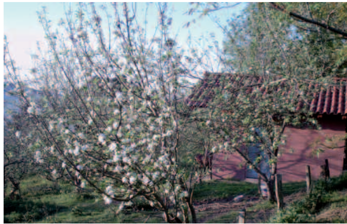
Sagastiak nola sortzen diren azalduko da larunbateko ibilaldian.

J. E. Sariaandi baserria Euskal Herriko lehenengoetako baserria da. Aurreneko baserriak, XVI. mendean sortzen dira. Sagardoak egiteko makinak ziren. Horren adierazgarri eza-gunena Igartubeitin daukagu, Euskal Herrian eta mundu osoan martxan dagoen bakarra. Eta Sariaandi baserria, tipologia horretako baserria da. Pen-