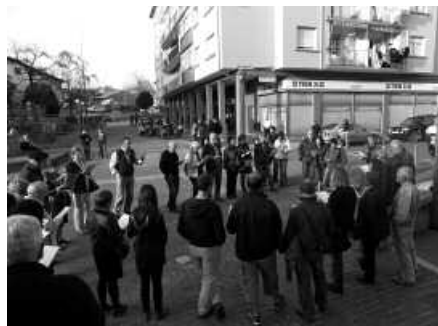
19:00etan abiatuko da kantu-jira.