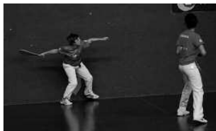
Maiatzaren 3an amaituko da izen-ematea.

Partidak igande arratsaldetan 17:30etik aurrera