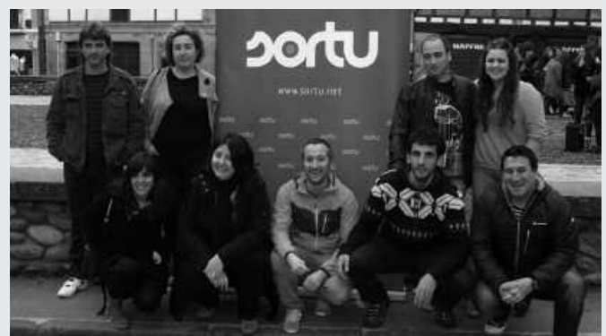
Argazkian, Sortuko Herri Kontseilua osatuko duten kideak.