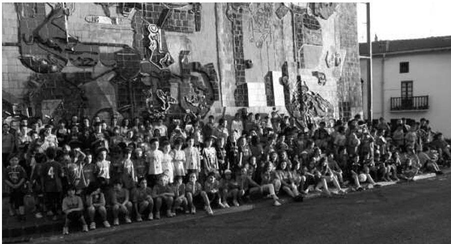
Usurbil Cup txapelketako partaideak, duela bi urteko argazkian.

A ldaketarik ez bada, maiatzaren 17an hasiko da aurtengo Usurbil Cup. Bi aste lehenago, maiatzaren 3ra arte irekita dago jada, Usurbil FT-k antolaturiko kirol ekimenean izen emateko epea. Oiaro Kiroldegian eskugarri daude apuntatzeko orriak eta bertan eskatzen diren datuak bete beharko dira. Horrekin batera, 60 euroko ordainagiria aurkeztu beharko du talde bakoitzak. Taldeak, gutxienez 8 jokalarikoak izan beharko dute, gehienez hamarrekokoak. 18 urtetik gorako arduradun bat izan beharko du jokalaria multzo bakoitzak. Usurbil Cup Txapelketan aritzeko, parte hartzaileek usurbildar-