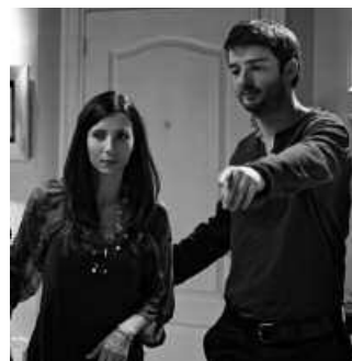
Maiatzaren 3an, 'Bypass' pelikula emango dute Sutegin.

■ 22:00 "Hil arte bizi" antzez- lana Sutegin. 8 euro alde aurretik Lizardin, 10 euro egunean bertan.