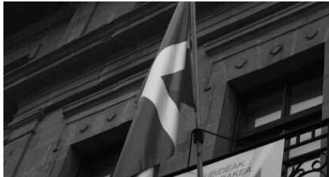
Maiatzaren 4ko omenaldian herritarrek parte hartzeko deia egin du Udalak.